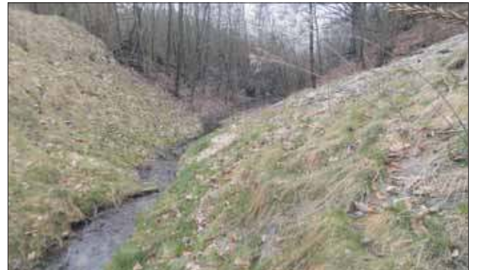
Jaworzniczka za zaporą

Osobiście tę dolinę po raz odwiedziłem w 2013 roku podczas wykonywania waloryzacji przyrodniczej miasta i gminy Trzebinia. Przez pierwsze pięćset metrów Jaworzniczka płynie w bardzo głębokim wąwozie. Wstępnie oceniam go na dwadzieścia metrów. W okresie swojej świetności Jaworzniczka zabrała stąd sporo piasku. Źródło znajdowało się u podstawy stoku. Podobnie w swoim obszarze źródłowym uczynił Żabnik, chociaż ten w rejonie Trzebini Sierszy na początku płynął płytkim rowem, zaś głęboki wąwóz pojawił się dopiero po pierwszych pięćset metrach. Jak dalej przez byłą piaskownię płynął Jaworzniczka trudno powiedzieć, ponieważ ta historia została „zniknięta”. Moim zdaniem było to płytkie kilkumetrowe zagłębienie, ponieważ jest ono chociaż suche czytelne do dziś. Obecnie strome stoki wąwozu źródłowego porastają przede wszystkim sosny zwyczajne oraz buki po-