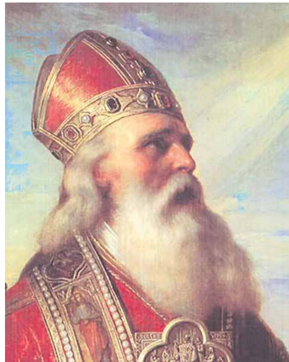
Św. Wojciech

powiedzieć, że głupotą. Jego zachowanie graniczyło bowiem z szaleństwem. Tym bardziej, że biskup wobec Prusów miał zachowywać się z poczuciem wyższości i z arogancją. Nie zważając na lokalne zwyczaje, kontynuował swą misję, zrażając do siebie autochtonów i wywołując ich gniew. Miarka natomiast przebrała się 23 kwietnia 997 roku, kiedy to Wojciech, beczeszcząc jeden z świętych gajów, został finalnie zamordowany. Następnie obcięto mu głowę, nabitą ją jednocześnie na włócznię jako trofeum. Ciało natomiast wrzucono do rzeki. Mimo swej dramatycznej wydarzenie to przez polskiego księcia zostało przekute na sukces. Bolesław wykupił najpierw głowę, potem resztę ciała. Większość relikwii złożono w Gnieźnie. Bardzo szybko, bo już dwa lata później Wojciech został świętym Kościoła katolickiego. Rozpoczął się intensywny kult świętego, który, przy okazji zjazdu gnieźnieńskiego, doprowadził do utworzenia w Polsce niezależnego arcybiskupstwa w Gnieźnie i trzech nowych biskupstw. Był to miłowy