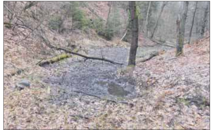
Wypływ wody Jaworzniczki

Szósta tegoroczna wycieczka zaliczona. Tym razem wybraliśmy się do źródła Jaworzniczki położonego przy granicy Trzebini Sierszy oraz Bukowna. Obszar źródłowy znajduje się w głębokim wąwozie nieco na północ od dojazdu pożarowego 55. Kiedyś to była spora rzeka postrzegana również jako potok. Jako dopływ Koziego Brodu osiągał 5,32 km długości. Meta wypadała tam, gdzie