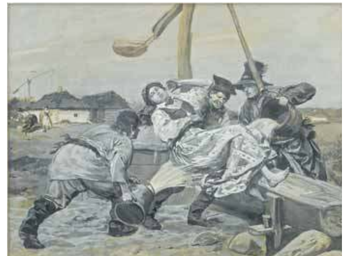
Śmigus wg J. Chełmońskiego (wikipedia)

Zaczyna od Środy Popielcowej. Zauważa, że właśnie w tym dniu w domach ściągano różnego rodzaju ozdoby, co miało korespondować z nastrojem Wielkiego Postu, a więc czasem pokuty i skruchy. Podobnie w kościołach demontowano wszelkie feretrony. Kiedy natomiast przychodził czas Niedzieli Palmowej, to rzecz jasna palmy wykonywano własnoręcznie, te zaś w czasie mszy świętej poświęcano. Palmy tworzone były z zieleniny, dostępnych ewentualnie kwiatów i bazi. Po poświęceniu zwyczajem było to, że kilka kulek bazi polykano, co gwarantować miało zdrowie. Samej zaś palmy nie wnoszono do domu, ponieważ uważano, że za palmą do chałupy wleczą muchy. Toteż pozostawiano je na zewnątrz, osadzając na drzewach owocowych, co gwarantować miało urodzaj. Dopiero w Wielki Piątek z palm tych tworzone krzyżyki, które osadzano znowuż na szczytach domostw. Miało to gwarantować ochronę przed niebezpieczeństwami, przede wszystkim przed pożar-