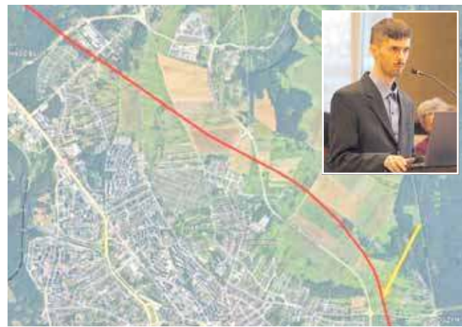
Nowa linia kolejowa przez centrum Jaworzna (fot. Prezentacja przygotowana przez Jana Chrapka na sesji rady miejskiej)

PKP rozważa w przyszłości budowę nowej pasażerskiej linii kolejowej, która mogłaby przebiegać przez centrum Jaworzna i poprawić połączenia miasta na trasie Katowice – Kraków. Taka koncepcja występuje w opracowaniu przygotowanym przez PKP Polskie Linie Kolejowe SA, które przedstawia zamierzenia inwestycyjne na lata 2021-2030. Linia ta mogłaby przebiegać m.in. w rejonie Niedzielisk, bliżej Śródmieścia i dalej w stronę Wilkoszyna.