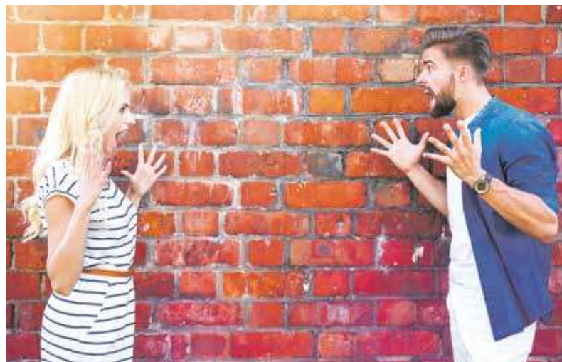
Zdo mi sie, co ta baba pedziła tymu chopu: dej mi pokój

A we ty haji, jak nos ftoś noprowdy fest znerwuje, abo zrobi coś richtich gupigo, to godomy, co jest gupi jak funt kudłów (głupi jak ćwierć kilo psiej sierści), abo fuło jak gynś bez łeba (mówi głupoty jak gęś bez głowy, co jest bardzo logiczne). Nadowajom sie tyz inksze powiedzonka: fułos jak muror (mówisz głupoty jak murarz), łosprawios bery, torbis, pipecys, mos ipi i wali ci w dekel (ogólnie mówiąc to wszystko sprowadza się do hasel: gadasz głupoty, odbija ci). W trocha barzi łogodny wersji jak sie powadziecie, to możecie cieponoć na koniec: mos ała i dwa boloki, a twoje dzieci som glacoki. Dosłownie to będzie: odbija ci i masz dwie rany, a twoje dzieci są łyse. Zdecydowanie chodzi tu o to, żeby przy okazji złorzeczenia trochę się zrymowało, a ogólnie mamy śląski idiom.