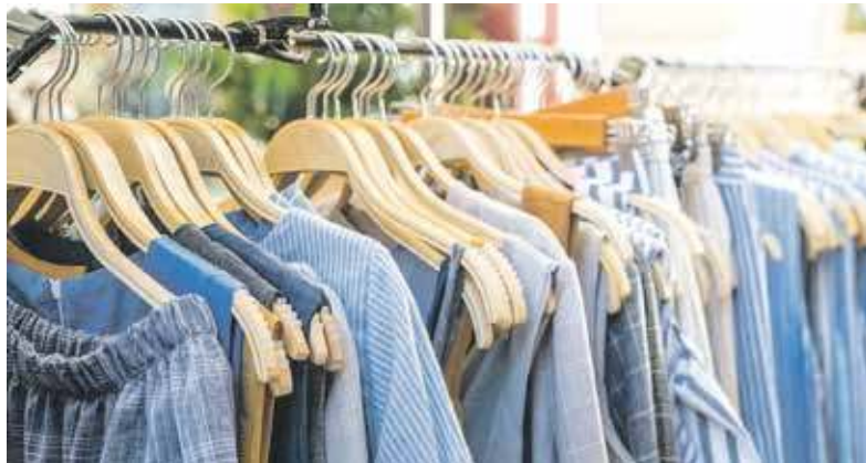
Ubrania, których już nie chcemy lub nie potrzebujemy mogą z powodzeniem posłużyć innym

I tu świetnie sprawdzają się EKOzwroty. To coraz bardziej popularna ogólnopolska inicjatywa, której celem jest zapobieganie marnotrawstwu sprawnych przedmiotów i tym samym radykalne zmniejszanie ilości odpadów. Dzięki niej możemy bezpłatnie oddać rzeczy uznane przez nas za niepotrzebne innym. Żeby to zrobić, wystarczy skorzystać z najbliższego paczkomatu InPost.