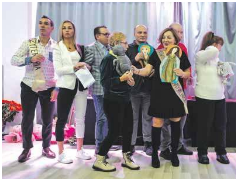
Gala jubileuszowa WTZ była bardzo wzruszającym wydarzeniem

BYTOM. WARSZTATY TERAPII ZAJĘCIOWEJ PROWADZONE PRZEZ BYTOMSKIE STOWARZYSZENIE POMOCY DZIECIOM I MŁODZIEŻY NIEPEŁNOSPRAWNEJ ŚWIĘTOWAŁY JUBILEUSZ ĆWIERĆWIECZA ISTNIENIA.