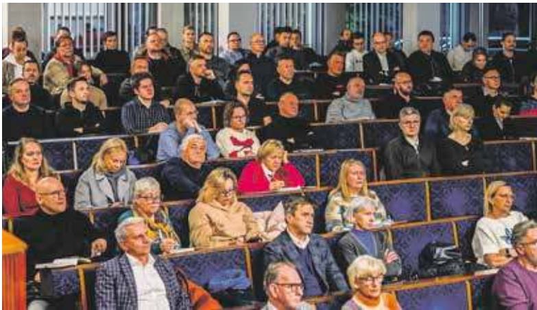
Mieszkańcy zakwalifikowani do projektu poznali jego szczegóły podczas spotkania zorganizowanego w Ratuszu

Zyskają właściciele domków jednorodzinnych, którzy dwa lata temu tłumnie zgłosili się do programu „Rozwój energetyki rozproszonej opartej