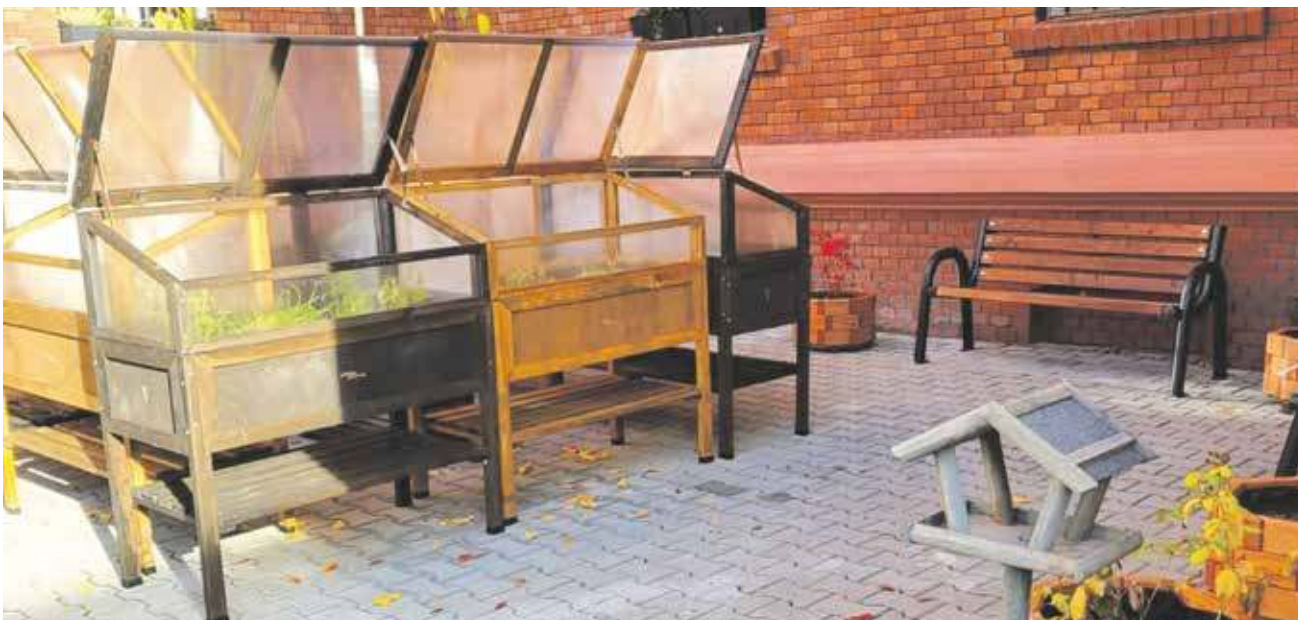
Ufundowana przez WFOŚiGW w Katowicach ekopracownia pod chmurką działa między innymi w bytomskiej Szkole Podstawowej nr 4

JUŻ W KWIETNIU RUSZY TRZECIA EDYCJA KONKURSU „EKOPRACOWNIA POD CHMURKĄ”, KTÓREGO ORGANIZATOREM JEST KATOWICKI WOJEWÓDZKI FUNDUSZ OCHRONY ŚRODOWISKA I GOSPODARKI WODNEJ. WARTO WZIĄĆ W NIM UDZIAŁ, BY ZYSKAĆ NIETYPOWE I ATRAKCYJNE MIEJSCE POMAGAJĄCE UCZNIOM W ZDOBYWANIU SZEROKO POJĘTEJ WIEDZY PRZYRODNICZEJ.