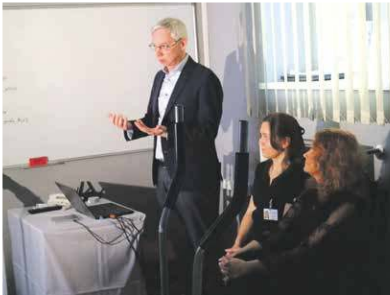
Podczas spotkania mówiono o znaczeniu prawidłowego odżywiania w procesie leczenia

Pacjent musi być odpowiednio przygotowany do leczenia. - Kluczowe jest, aby najpierw przeprowadzić rehabilitację, dostosować dietę i komple-