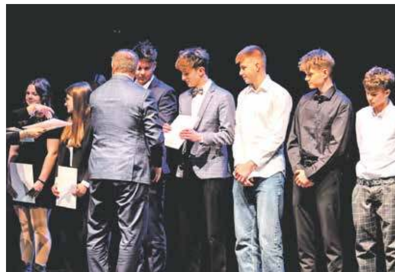
Młodych, zdolnych sportowców w Bytomiu nie brakuje