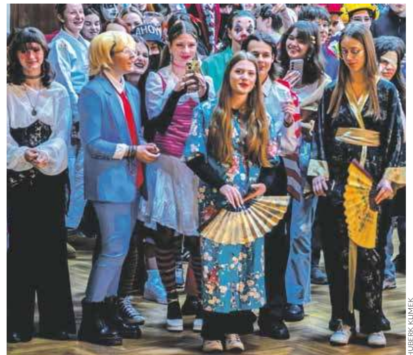
Uczniowie w "kreatywnych" strojach wypełnili całą aulę

W czasie TyTY na korytarzu szkoły zorganizowano wystawę prac plastycznych uczniów oraz liczne