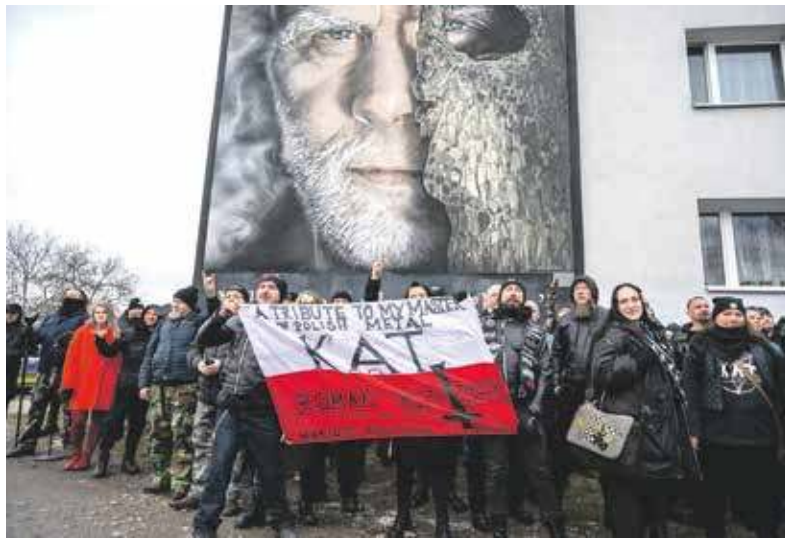
Fani nie zapominają o Romanie Kostrzewskim

Atmosfera była bardzo dobra, ubrani w czarne skóry miłośnicy twórczości Kostrzewskiego wspominali go i zgodnie przekonali, że „Romanowi za to, czego dokonał należało się takie uznanie”. Swój udział w wydarzeniu