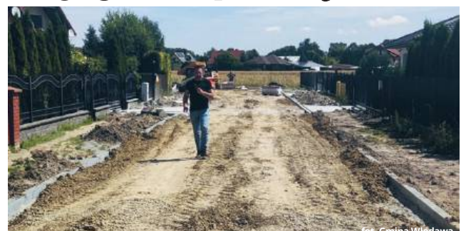
fol. Gmina Włodawa

Prace rozpoczęto od ulic Imbirowej i Miętowej w Susznie. W tej samej miejscowości objęte projektem są także ulice: Makowa, Jaśminowa, Maciejki i Storczykowa. W Szumince zaplanowano przebudowę dróg wewnętrznych, natomiast w Różance prace prowadzone będą na ulicach: Kresowej, Św. Antoniego, Nad Bugiem, Jerzego Fleminga, Magnackiej i Książęcej. Projekt ma na celu zwiększe-