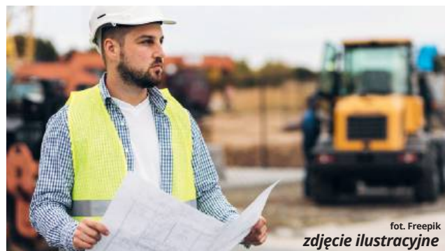
zob. Freepik zdjęcie ilustracyjne

Długi odcinek, który liczy niespełna 1,7 km, wytypowano też w Radziejowie. W tej samej miejscowości prace będą przebiegały także na krótszej, bo 350 m trasie.