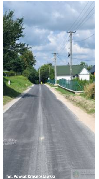
fol. Powiat Krasnostawski

- Ulica Bielezyska pełni istotną funkcję komunikacyjną w mieście, dlatego szybkie zakończenie prac ma duże znaczenie dla lokalnej społeczności. Dziękujemy miastu Krasnystaw za wsparcie finansowe tego remontu - podkreślają władze powiatu. (red)