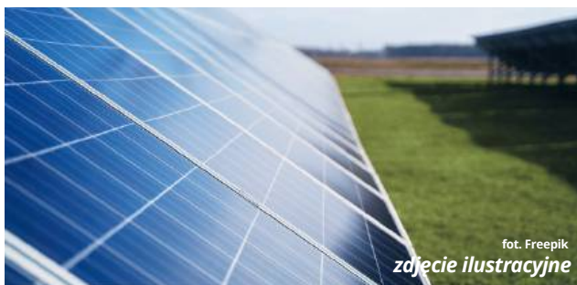
zob. Freepik zdjęcie ilustracyjne

Niestety, realizacja tych planów na razie nie będzie możli-