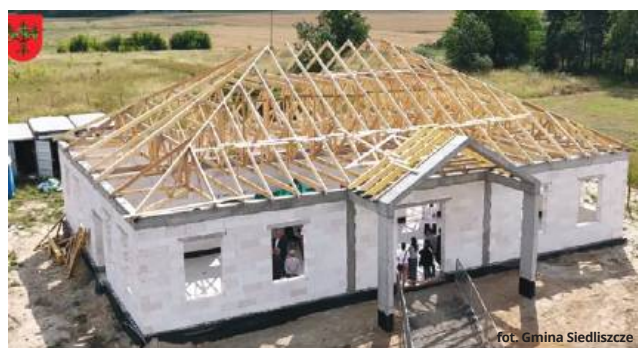
Budowa obiektu przebiega bardzo sprawnie

- Nowy żłobek zapewni opiekę najmłodszym mieszkańcom gminy, tworząc nowoczesne, bezpieczne i przyjazne środowisko dla dzieci. Inwestycja jest realizowana ze środków samo-