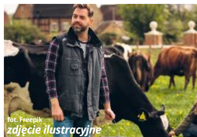
fol. Freepik / zdjęcie ilustracyjne

Polscy rolnicy obawiają się, że produkty, jakie z Ameryki Południowej trafiać będą na