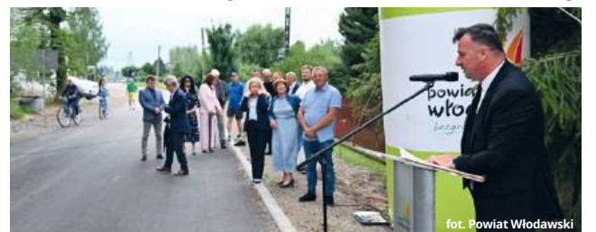
fol. Powiat Włodawski

Zadanie sfinansowane zostało z dwóch źródeł: Programu