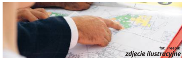
zob. Freepik zdjęcie ilustracyjne

- Kolonii przewidziano na przykład tereny, na których można realizować inwestycje związane z zabudową zagrodową.