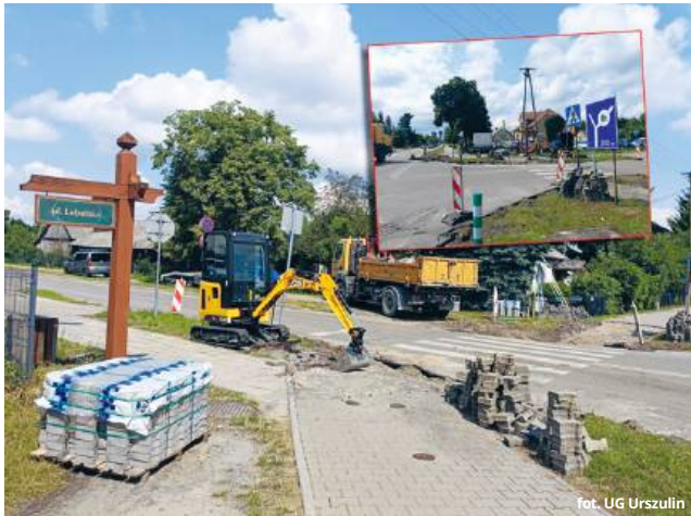
Skrzyżowanie ul. Lubelskiej i Szkolnej w Urszulinie od lat było źródłem wielu kolizji i wypadków

Jak podkreśla, decyzja o rozpoczęciu robót zapadła