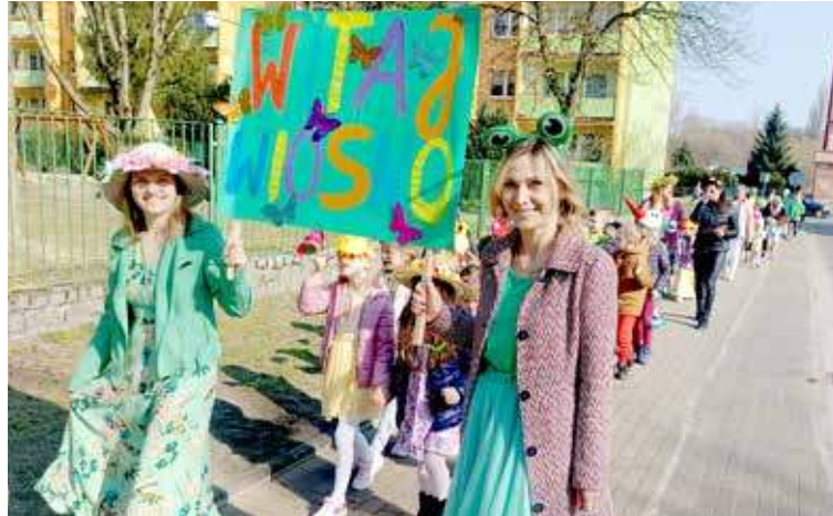
Taki korwód powitał wiosnę