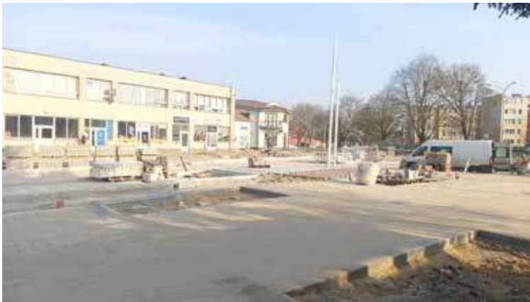
Chodnik przed GDK będzie szeroki

mają potrwać do końca czerwca. I tutaj pojawiają się pewien problem. Swoje zaniepokojenie zgłosił nam jeden z naszych Czytelników. Zauważył on, że budowana jezdnia na ulicy Juliusza Słowackiego, naprzeciwko Goleniowskiego Domu Kultury, jest wąska. Czytelnik, mieszkający w tej okolicy i zmotoryzowany, zwraca uwagę na szerokość chodnika bezpośrednio przed Domem Kultury. Twierdzi on, że chodnik ten jest niepotrzebnie szeroki, zaś