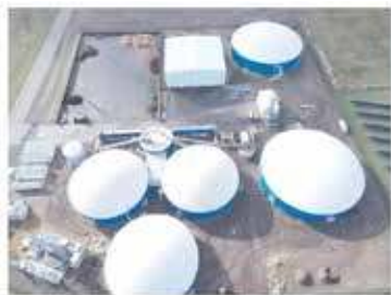
Biogazownia miała być wzorowana na już istniejącej

- Wiemy z całą pewnością, że marzenie inwestora o biogazowni na terenie naszej wsi nie jest małe, i na pewno nie będzie zasilane z biomasy z okolicznych terenów, ponieważ planowana jest inwestycja szeroko przekraczająca