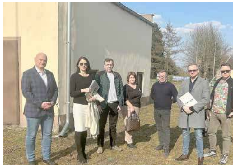
Plac budowy został przekazany w piątek

Przebudowa hydroforni ma na celu zapewnienie ciągłości dostarczania wody dla mieszkańców ale również poprawę jej jakości oraz parametrów. W tym celu infrastruktura wodociągowa zostanie zmodernizowana. Inwestycja ta ma strategiczne znaczenie dla Gminy Maszewo. Inwestycja ta ma na celu nie tylko poprawę funkcjonowania systemu wodociągowego, ale także zwiększenie efektywności energetycznej obiektów związanych z dostawą wody. Dzięki nowoczesnym rozwiązaniom technologicznym, mieszkańcy będą mogli cieszyć się lepszymi parametrami jakościowymi wody.