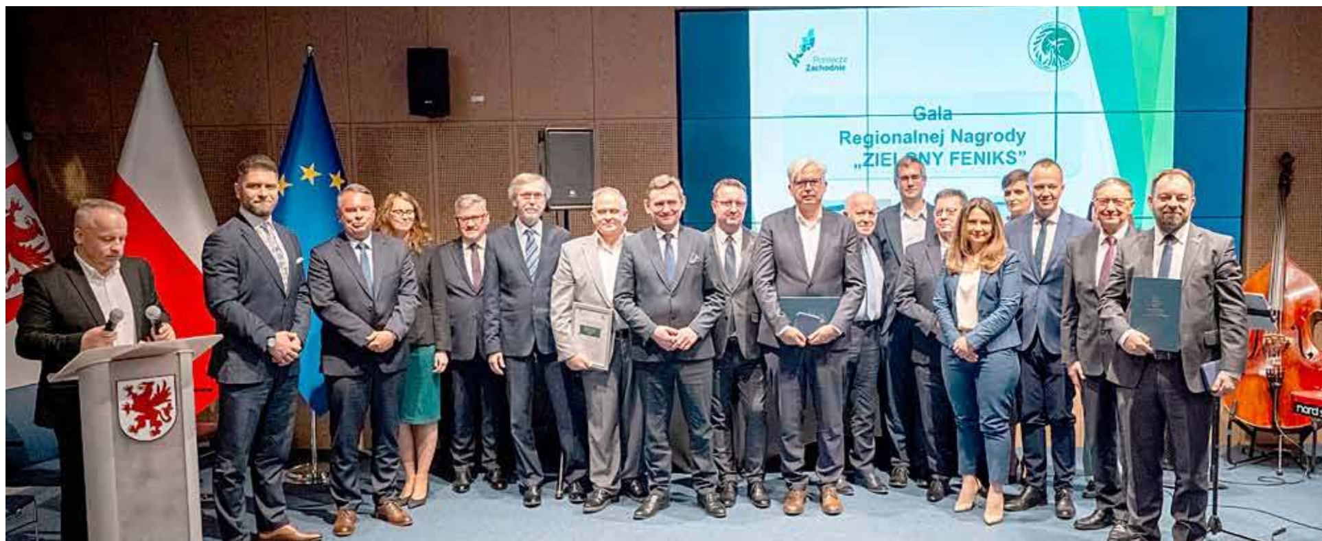
Laureaci konkursu