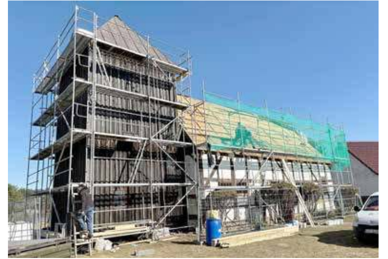
Remontowany kościół pw. św. Stanisława Biskupa i Męczennika w Dzisnej

слава Biskupa i Męczennika w Dzisnej. Tam z kolei prace obejmują remont dachu oraz wieży, ich dezynfekcję oraz instalację przewodów uziemiających i odgromowych. Kościół ten, zbud-