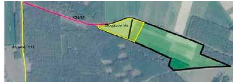
Obiekt planowany był w tym miejscu

energii – przyłączenie do sieci elektroenergetycznej.