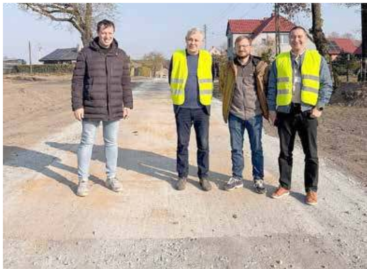
Droga w Miodowicach została oddana do użytku