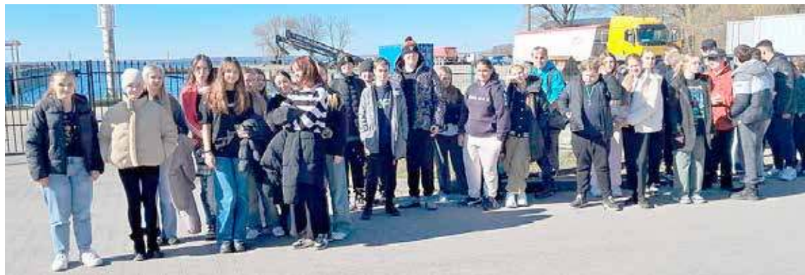
Stepniccy uczniowie odwiedzili port