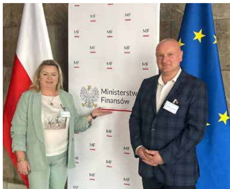
Gmina Maszewo nie ma długów