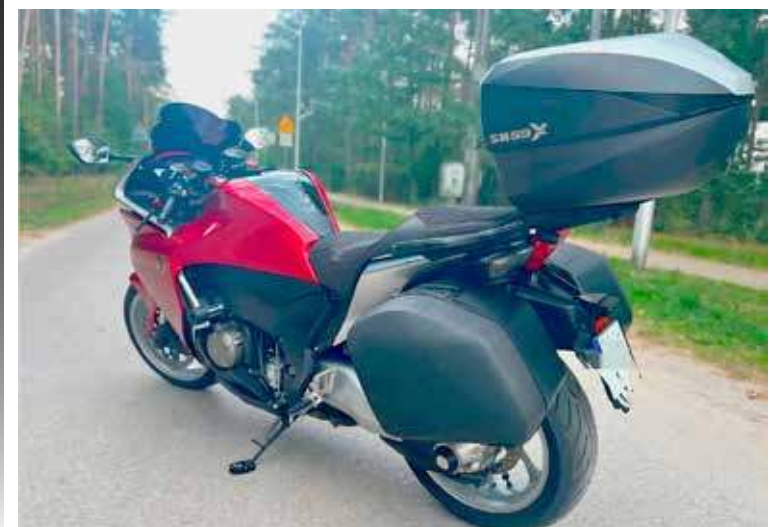
Nieodpowiedzialny motocyklista na drodze