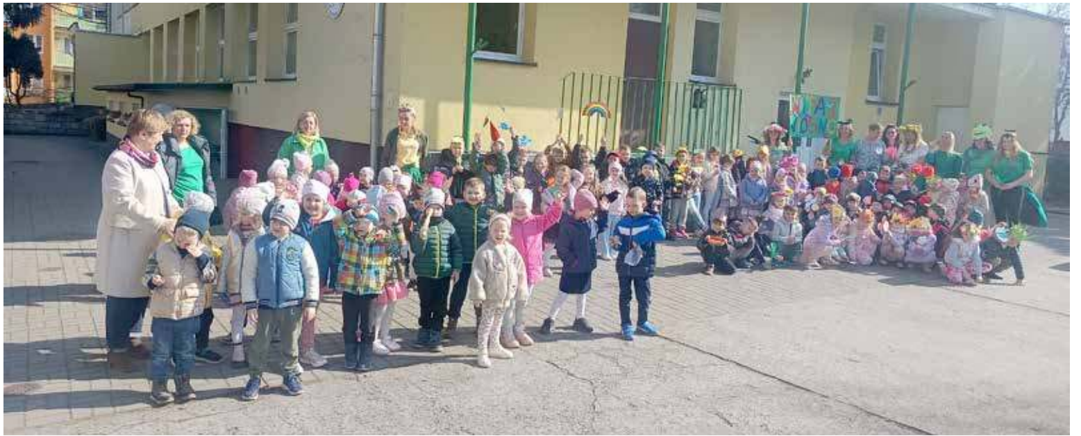
Ulicami miasta przeszła ponad setka dzieci

W czwartek, 20 marca, o godzinie 10:01 Słońce przeszło przez punkt równonocy wiosennej. A to oznacza, że w tym momencie rozpoczęła się astronomiczna