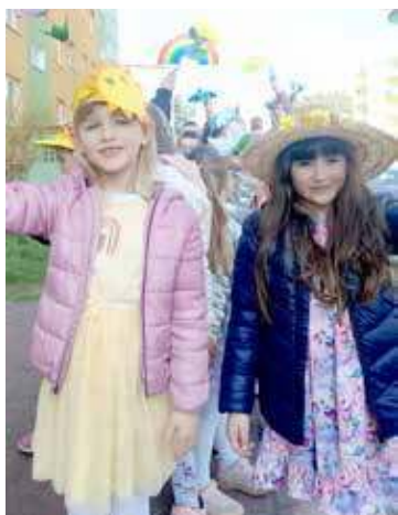
Uśmiechy powitały wiosnę