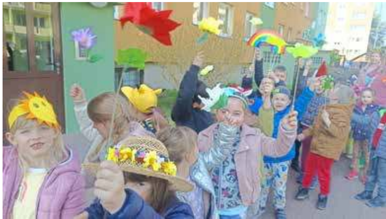
Było kolorowo i dźwięcznie

wiosna. I trzeba przyznać, że za oknami jest coraz bardziej wiosennie. Temperatura rośnie, coraz częściej możemy też cieszyć się bezchmurnym niebem.