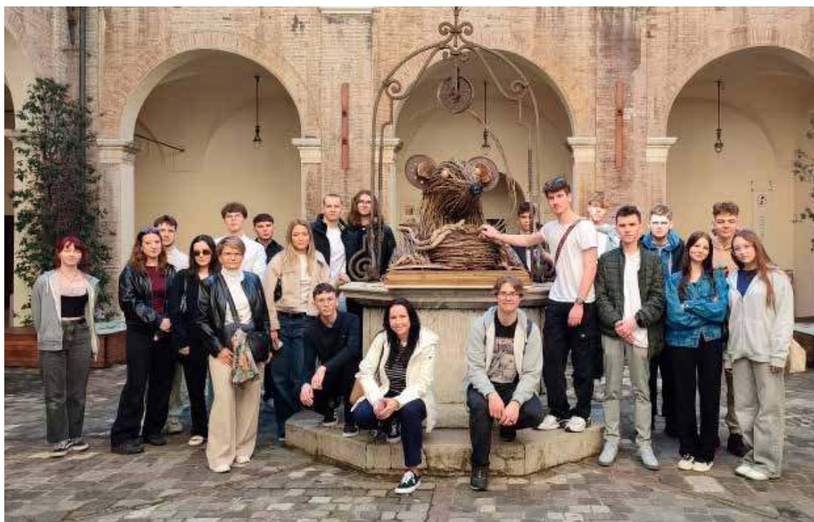
Uczniowie dotarli do włoskiego miasta

Uczestnicy kursu odbyli wizytę studyjną w Istituto Alberghiero Malatesta di Rimini. W tym dniu został również zorganizowany spacer po Rimini, podczas którego uczestnicy projektu mogli podziwiać najważniejsze zabytki miasta w jego historycznej części, m. in. Arco d'Augusto – czyli łuk triumfalny, Piazza Tre Martiri (Plac Trzech Męczenników)