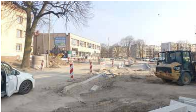
Czy wąska jezdnia oznaczać będzie korki

Mieszkańcy Goleniowa już od dłuższego czasu muszą mierzyć się z problemami wynikającymi z trwającej przebudowy ulic Puszkina, Witosa oraz ich okolic. Po kilkukrotnym przekładaniu terminu oddania ulic do użytku niejako światłem w tunelu jest to, że tamtejsza okolica zmienia się. Widać tam coraz więcej efektów przebudowy, całość zaczyna „nabierać kształtów”. Wedle zapewnień gminnych władz prace