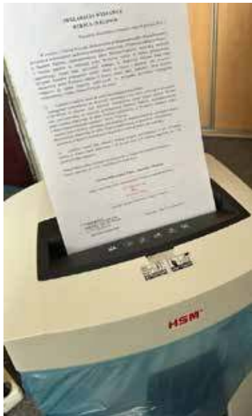
Weksle zostały komisyjnie zniszczone

W środę, 26 marca, w Ministerstwie Finansów w Warszawie komisyjnie zostały zniszczone weksle in blanco. Oznacza to, że Gmina Maszewo zdołała spłacić pożyczkę zaciągniętą w ramach Programu postępowania naprawczego.