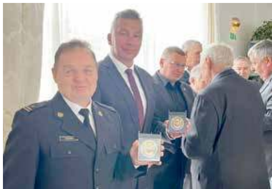
W trakcie uroczystości wręczano odznaczenia