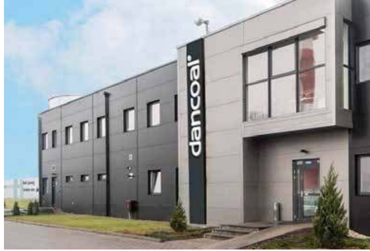
Dancoal ogłasza upadłość

Niewątpliwie rozeznanie takie niezbędne jest dla umiejscowienia planów inwestycyjnych co do nabycia przedsiębiorstwa Spółki w długoterminowych strategiach inwestycyjnych potencjal-