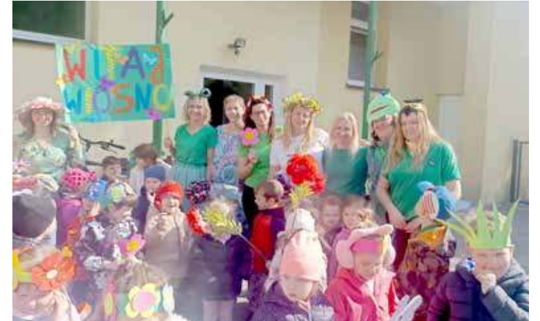
Panie przedszkolanki czuwały nad bezpieczeństwem