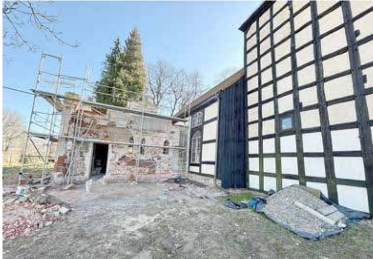
Prace remontowe w kościele pw. Matki Bożej Królowej Polski w Łoźnicy

Postępowanie w celu wyłonienia wykonawcy tych prac zostało ogłoszone i rozstrzygnię-