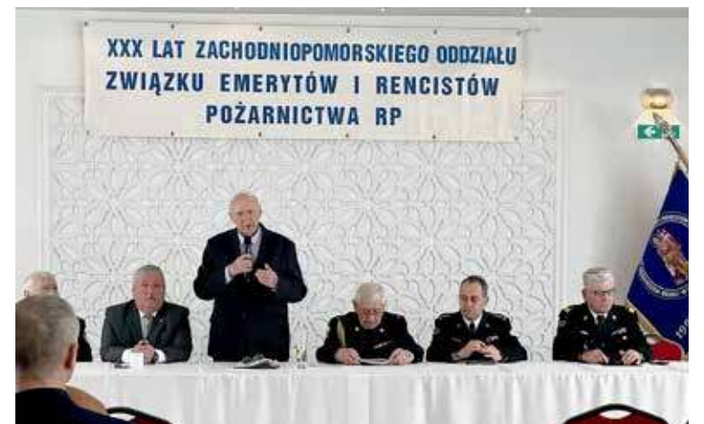
Uroczystość odbyła się w Goleniowie