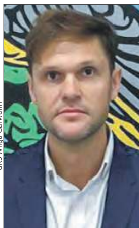
GKS Wilga Garwolin