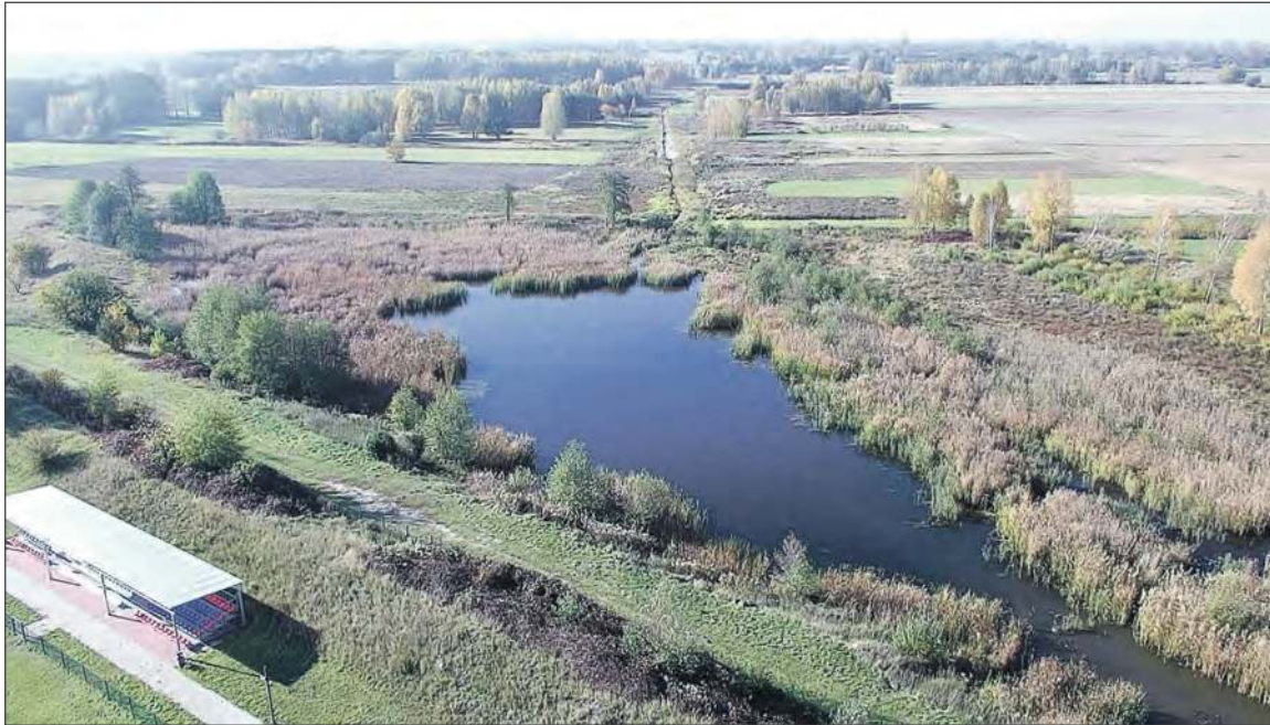
■ Położony za stadionem „Sępa” zalew jest obecnie w znacznej części zarośnięty. Gmina chce uporządkować ten teren i stworzyć na nim tereny rekreacyjne

Gmina Żelechów chce zagospodarować zarośnięty zalew przy stadionie Klubu Sportowego „Sęp”. Prace koncepcyjne mają ruszyć jeszcze w tym roku. Burmistrz ogłosiła konkurs na nową wizję tego terenu