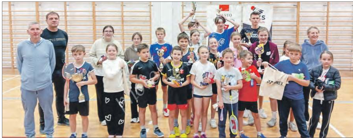
Uczestnicy Turnieju Cztery Pory Roku - Jesień w MKS Garwolin

Zawodnicy MKS Garwolin stanęli także na podium poza powiatem. W XXV Mazovia CUP 2025 (3-5 października, Zielonka), w kategorii U17 brązowy medal w grze podwójnej