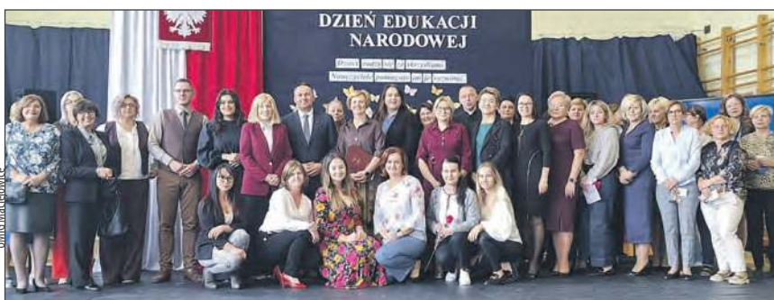
✚ Dzień Nauczyciela w Publicznej Szkole Podstawowej im. ks. Jana Twardowskiego w Samogoszczu

W Publicznej Szkole Podstawowej im. Tadeusza Kościuszki w Maciejowicach cała społeczność zebrała się 17 października na uroczystym apelu. Uczniowie klas III przygotowali oprawę artystyczną, a ciepłe słowa, życzenia i gratulacje skierowano do wszystkich pracowników - pedagogów, administracji i obsługi. Najważniejszym punktem maciejowickich obchodów było wręczenie Nagród Burmistrza. Tomasz Kwiatkowski