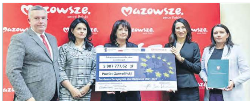
Całkowita wartość projektu wynosi 6 950 326,62 zł. Dofinansowanie to 5 907 777,62 zł

W ramach ogólnego wsparcia dla regionów warszawskiego wschodniego, siedleckiego i ostrołęckiego, które łącznie otrzymały ponad 47 mln zł, znaczna część tej kwoty trafi do naszych szkół ponadpodstawowych.