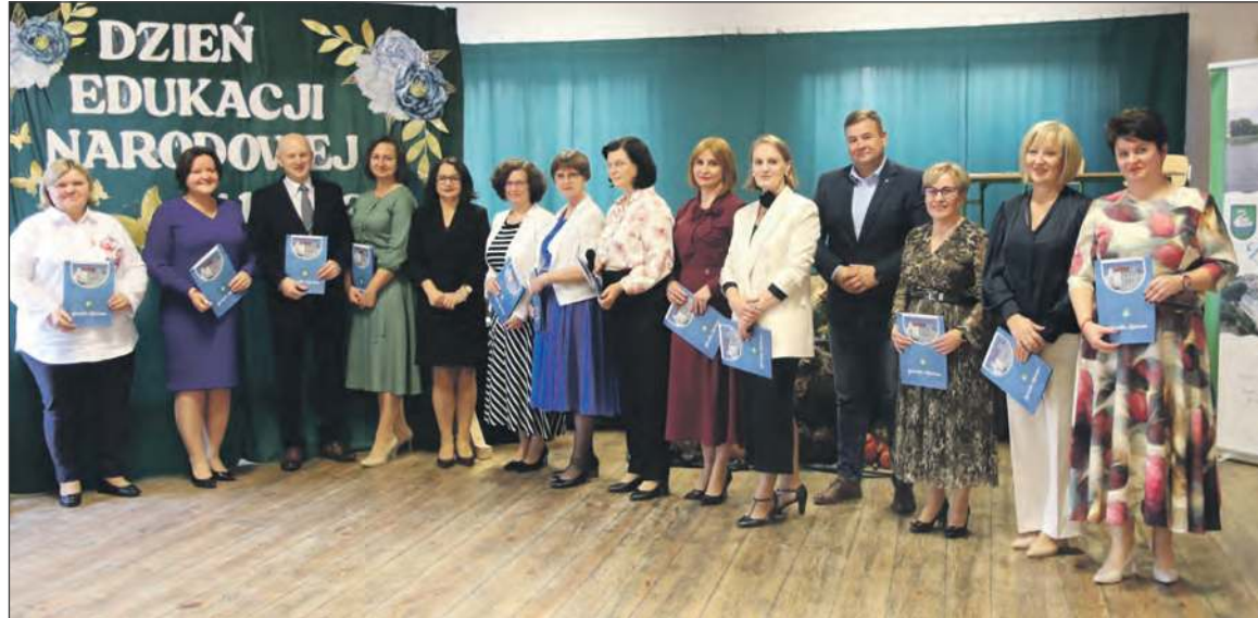
Uroczystość była okazją do uhonorowania nauczycieli Nagrodą Burmistrza