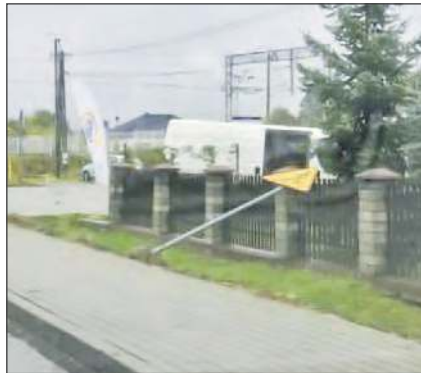
■ Ktoś uszkodził sześć znaków drogowych w Rudzie Talubskiej