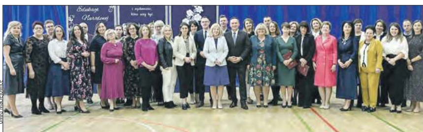
✚ Dzień Edukacji Narodowej w Publicznej Szkole Podstawowej im. Tadeusza Kościuszki w Maciejowicach

Szkoły z terenu gminy Maciejowice uroczystie obchodziły Dzień Edukacji Narodowej. Świętowano w Maciejowicach i Samogoszczu