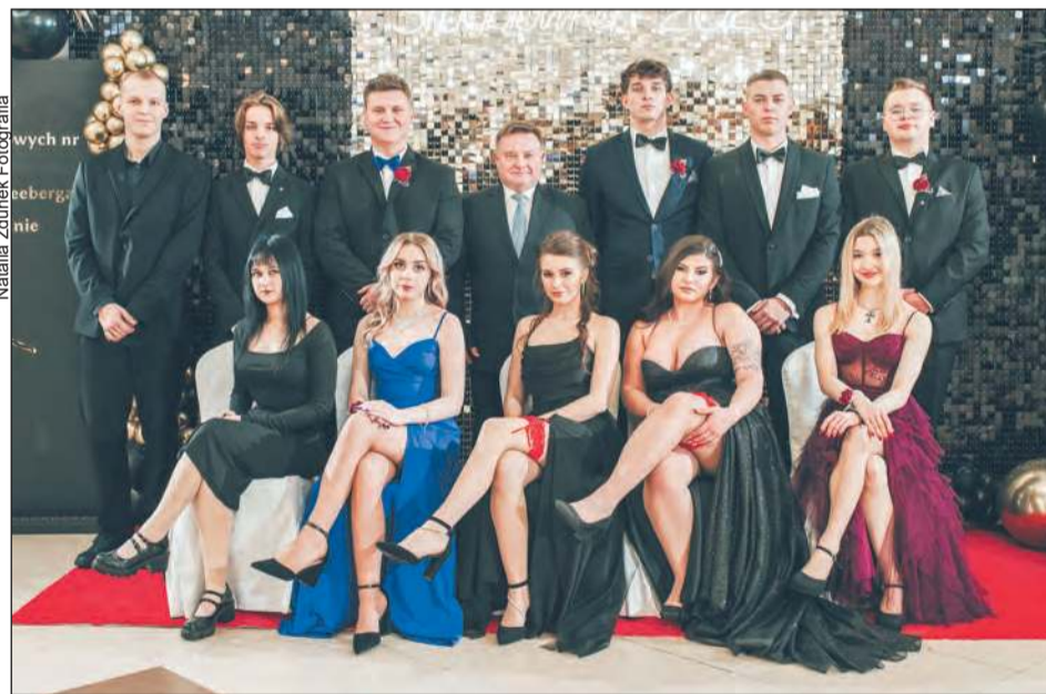
Natalia Zdunek Fotografia