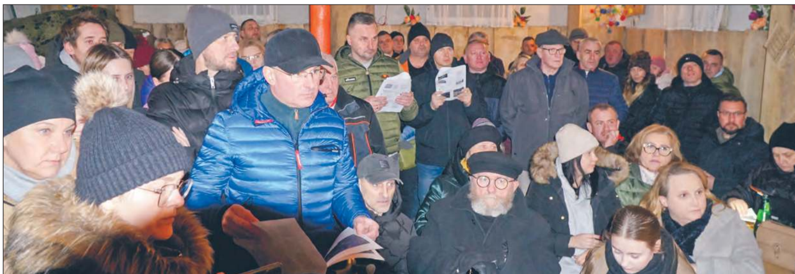
Uczestnicy spotkania w „harcówce” wyrazili swój stanowczy sprzeciw wobec planów budowy sortowni śmieci przy ulicy Janiszewskiej

Trwa dyskusja na temat planów budowy w Rykach zakładu gospodarki odpadami. Miałyby on powstać w miejscu obecnego wysypiska przy ulicy Janiszewskiej. Mieszkańcy nie zgadzają się na taką lokalizację