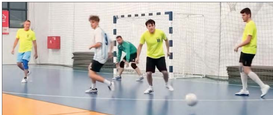
W ryckiej „halówce” zakończyła się faza zasadnicza i rozpoczyna się gra w play-offach