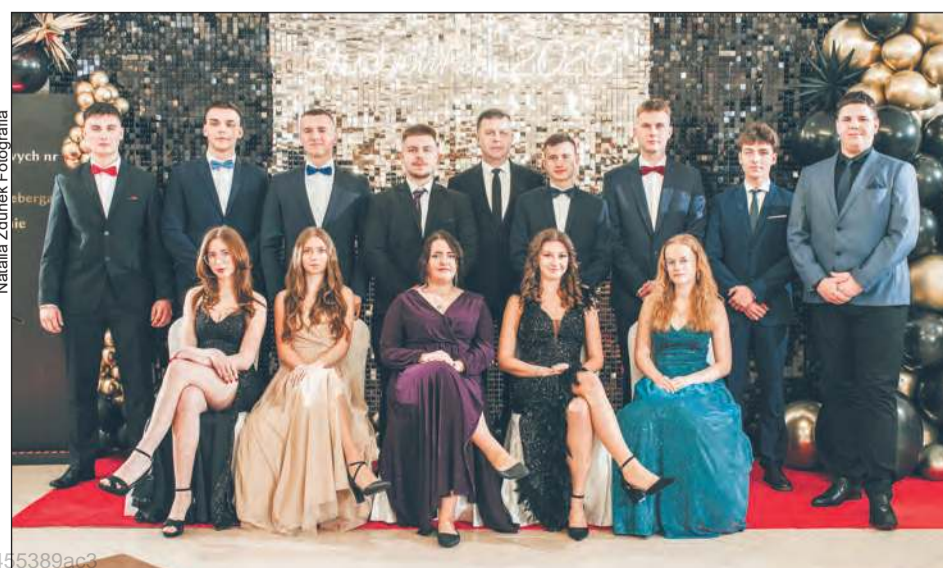
Natalia Zdunek Fotografia