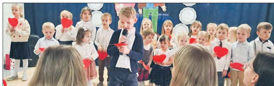
» „Kochana babciu, kochany dziadku szczęścia i zdrowia życzymy wam i swoje serce w prezencie wam dam” - można było usłyszeć ze sceny