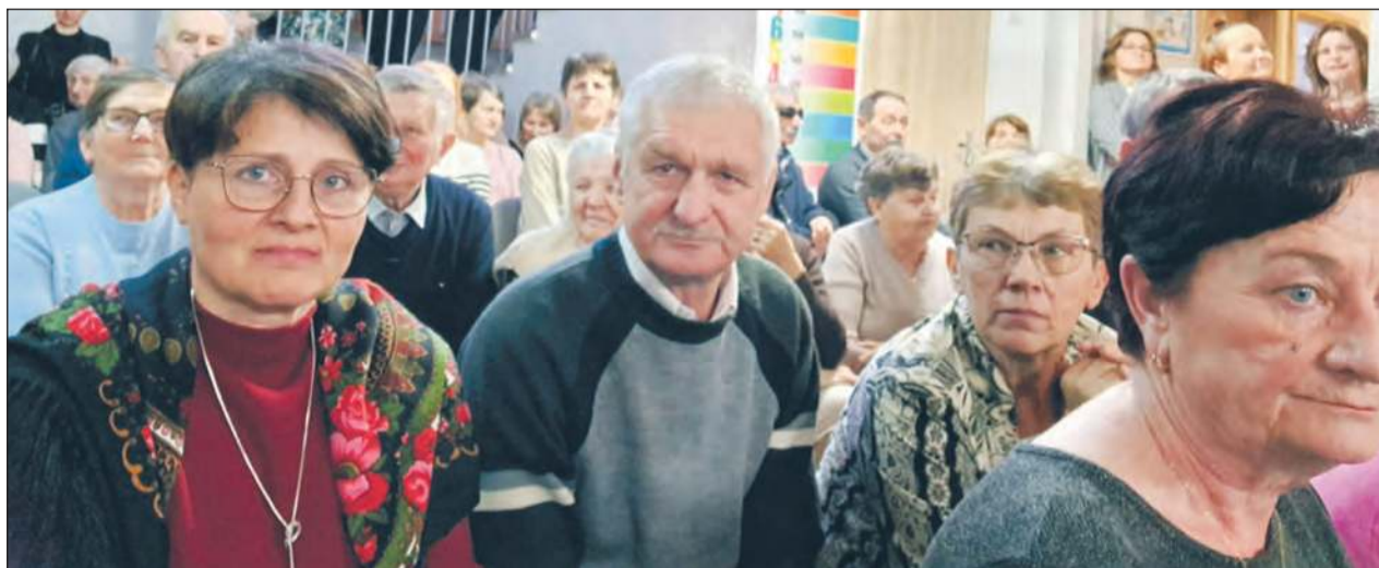
» Jak co roku, z wielką radością, do szkoły na wyjątkowe przedstawienie w wykonaniu uczniów przybyli dziadkowie i nie tylko