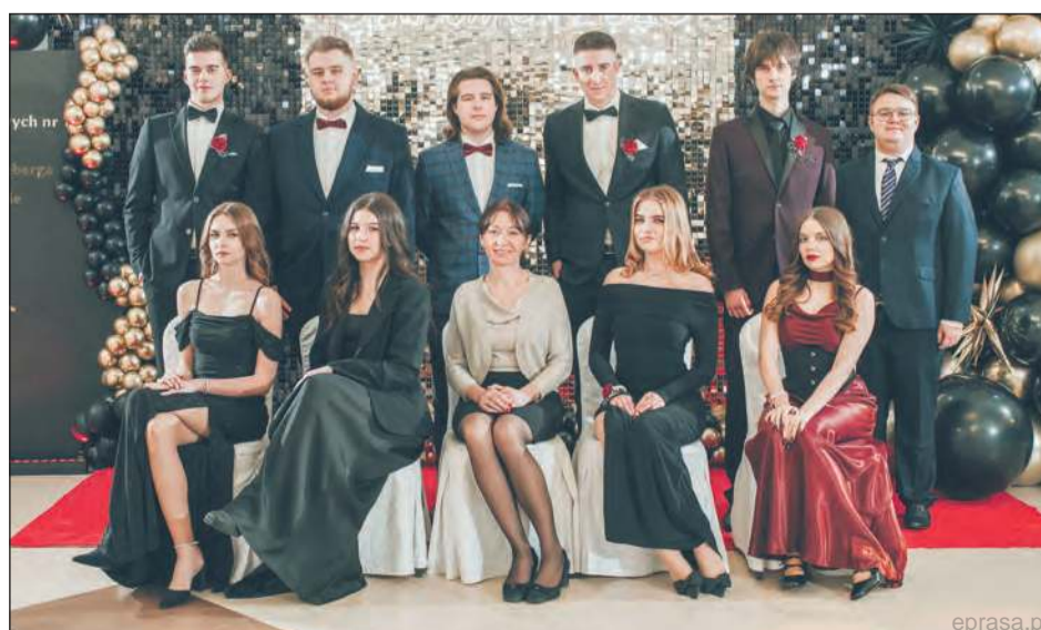
Natalia Zdunek Fotografia