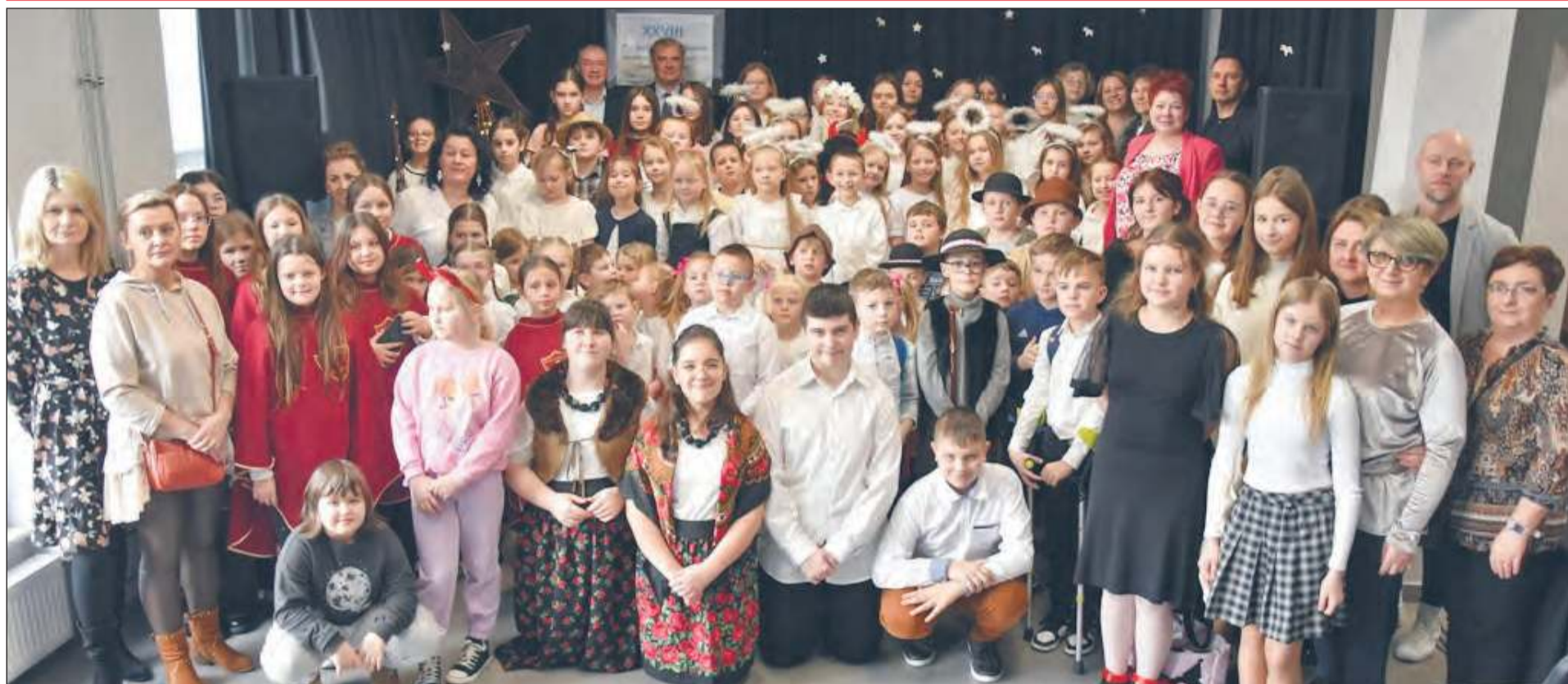
» W tym roku zgłosiło się 9 zespołów reprezentujących 5 placówek oświatowych z terenu Dębina. W sumie na scenie zaprezentowało się prawie 100 dzieci

» Młodzi ludzie chcą kultywować tradycję śpiewania kolęd, co potwierdza rosnąca popularność dęblińskiego Przeglądu Kolęd i Pastorałek, organizowanego przez Miejski Dom Kultury