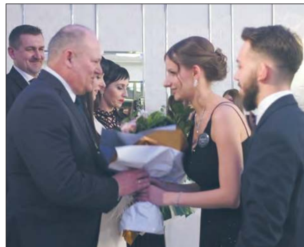
Wszyscy wychowawcy otrzymali z rąk uczniów podziękowania

Jakie to były wtedy dzieci! A dziś widać, jak bardzo się zmieniliście. Przed wami pierwszy bal, wkrótce odbierzecie świadectwa, które będą przepustką do egzaminu dojrzałości, a potem czekają was kolejne życiowe wybory - uczelnia, kierunek studiów, życiowy partner. Pamiętajcie jednak, byście zawsze byli przyzwoitymi i dobrymi ludźmi - życzył uczniom.