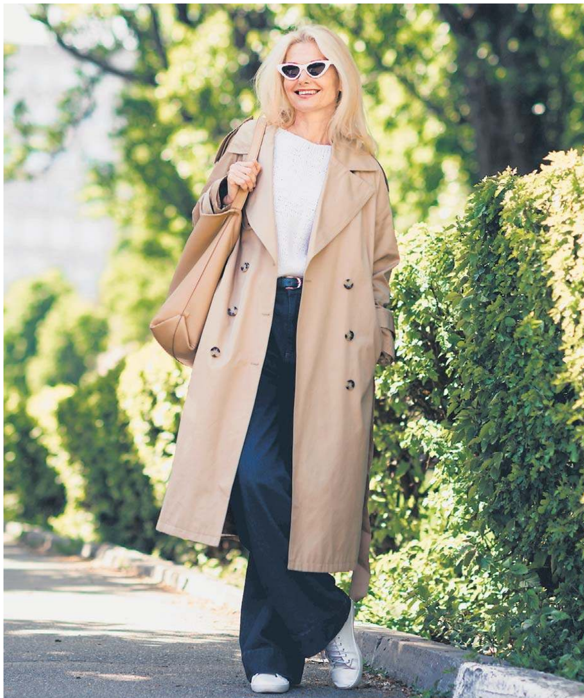
Trencz zazwyczaj ma luźny, lekko oversizowy krój, z szerokimi ramionami i paskiem w talii, który pozwala na optyczne modelowanie sylwetki

Trencz damski to rodzaj płaszcza. Jego klasyczna wersja ma dwurzędowe zapięcie i charakterystyczny pasek z kłamrą. Wywodzi się z mody męskiej. Sama nazwa pochodzi od angielskiego słowa, które oznacza „okop”. Za stwórcę tego okrycia wierzchniego uznaje się Thomasa Burberrego, który w latach 20. uszył dla żołnierzy długie, lekkie płaszcze wykonane z nieprzemakalnego i materiału, który chronił ich także od wiatru. Z czasem płaszcz wszedł do mody i nosili go popularni amanci lat 40., m.in. Humphrey Bogart. Przez wiele lat obecności na rynku płaszcz ten zmieniał także swój krój i przeznaczenie. Obecnie jest jednym z najbardziej pożądanych kobiecych okryć wierzchnich. A kto go rozpromował wśród pań? Oczywiście Audrey Hepburn w kultowym filmie „Śniadanie u Tiffaniego”. I tak trencz damski beżowy stał się elementem garderoby, który zawitał do każdej kobiecej szafy. Teraz występuje w innych kolorach, takich jak czarny, granatowy, czerwony, a nawet zielony. Trencz damski zapinany jest na 2 rzędy guzików.