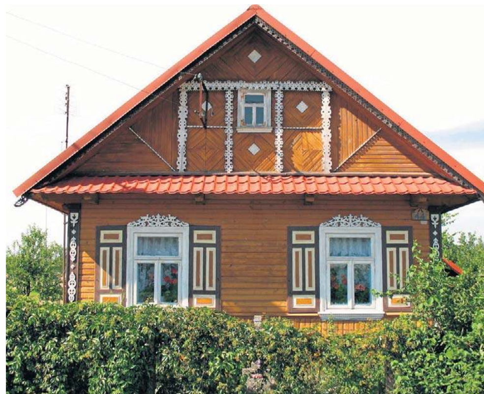
Misterne wyrezki i jasne kolory domów w Krainie Otwartych Okiennic urzekają o każdej porze roku

na z cudów ikona Matki Bożej, namalowana w XVIII w. Według lokalnej legendy właśnie do tej ikony, wiszącej wówczas jeszcze nie w cerkwi, lecz na drzewie, miał się