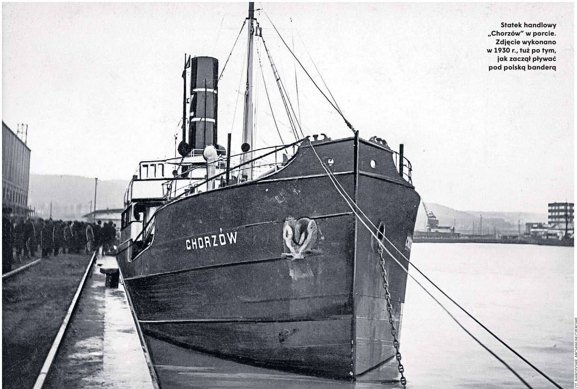
Statek handlowy „Chorzów” w porcie. Zdjęcie wykonano w 1930 r., tuż po tym, jak zaczął pływać pod polską banderą

● Niewielki statek handlowy „Chorzów” w czasie wojny przypadkiem znalazł się we Francji ● Okazał się jedynym dostępnym statkiem, którym można było przewieźć zbiory z Wawelu do Wielkiej Brytanii ● Misja niemożliwa - ale zakończyła się szczęśliwie