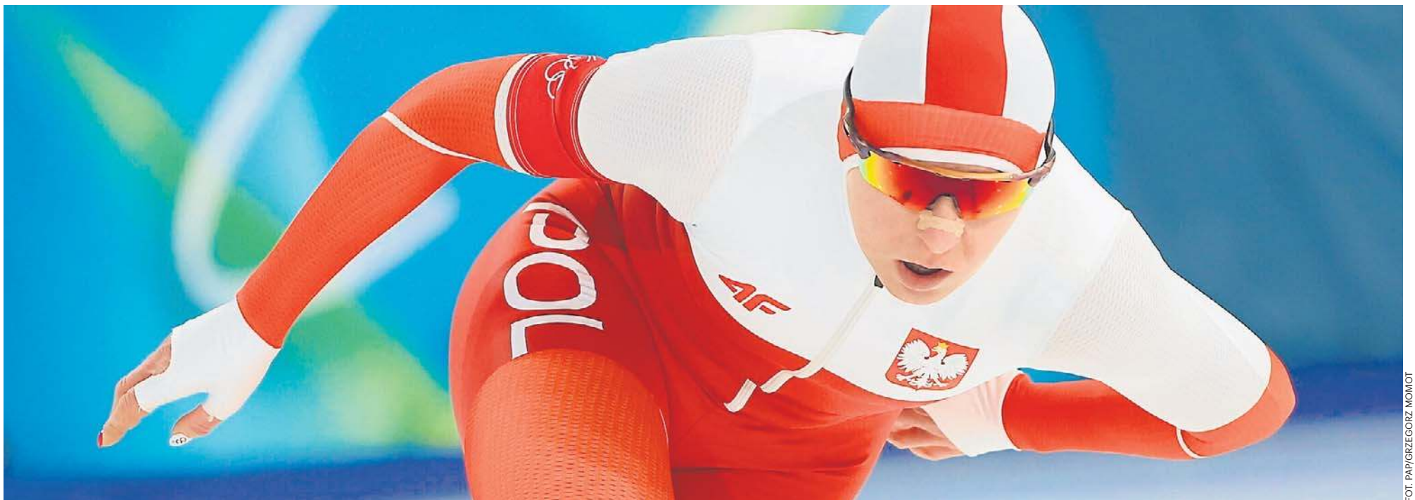
Natalia Czerwonka wciąż jest rekordzistką Polski na 1500 metrów (1:53,56 – 16 lutego 2020 r., Salt Lake City), w wieloboju sprinterskim (152,770 punktów – 26 lutego 2017 r., Calgary) i w tzw. wieloboju dużym (164,128 punktów – 5 marca 2017 r., Hamar)