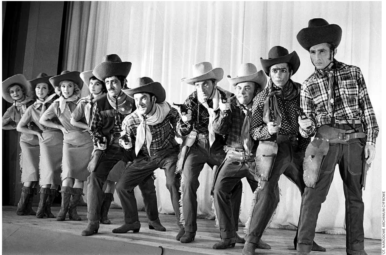
Aktor wolał jednak zawsze teatr. Tu, w 1965 roku, jako kowboj w sztuce „Jim strzela pierwszy” jest trzecim kowbojem od lewej, w jasnym kapeluszu

Jednocześnie wciąż był niesamowicie skromnym człowiekiem: podobno codzien-