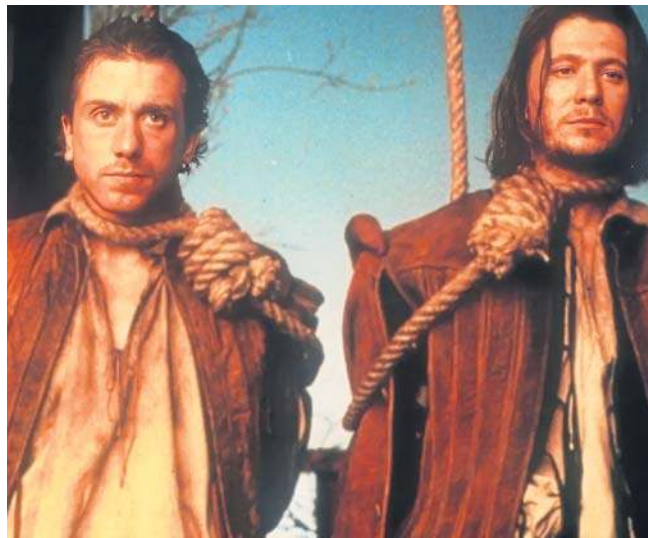
W filmie „Rosencrantz i Gildenstern nie żyją” z 1990 roku (reż. Tom Stoppard) zagrali Tim Roth i Gary Oldman

Zapyta ktoś: czymże właściwie zawiniли nieszczęśnicy, którzy byli tylko igraszką w rozgrywce między królem a księciem? Nie wiadomo, czy wiedzieli o tym, co jest w liście, i czy w ogóle zgodzili się na śmierć Hamleta. Wiadomo jednak, że byli usłużni i oddani Klaudiuszowi oraz że bez szemrania wykonywali jego rozkazy. Hamlet bez skrupułów podpisał na nich wyrok śmierci, uważając, że w pełni sobie nań zasłużyli, a Szekspir z nieskrywaną uciechą to opisał.