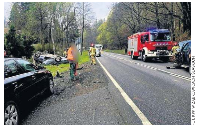
FOT. KPP W ZĄBKOWICACH ŚLĄSKICH

- Nie kierujcie się w ten rejon. Wybierzcie objazdy lub, jeśli możecie, przełóżcie droż - apelowała jeszcze przed południem policja z Ząbkowic Śląskich. ©