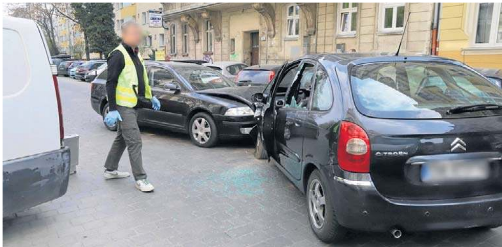
Złodzieje specjalnie doprowadzili do wypadku, a następnie ukradli pieniądze z przewożącego je samochodu konwojentów