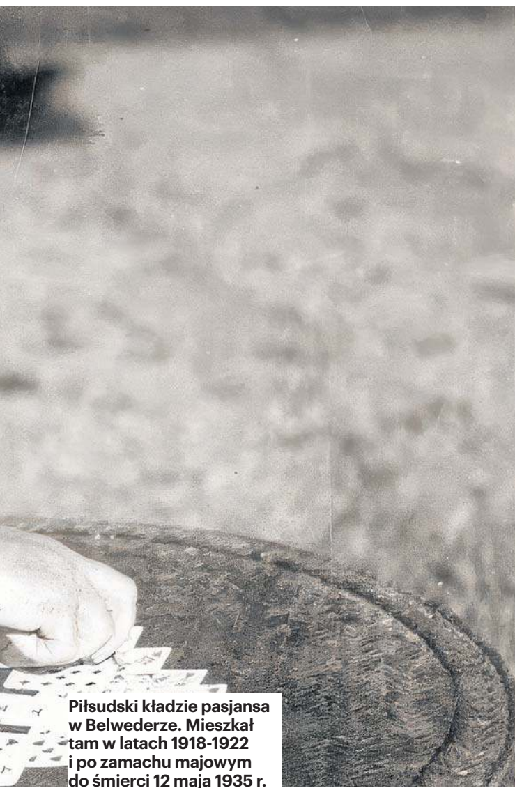
Piłsudski kładzie pasjansa w Belwederze. Mieszkał tam w latach 1918-1922 i po zamachu majowym do śmierci 12 maja 1935 r.