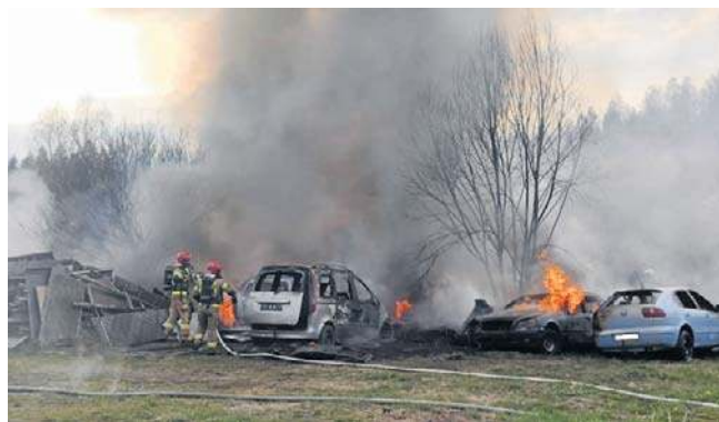
O pożarze poinformowała Komenda Powiatowa Państwowej Straży Pożarnej w Złotoryi

Na miejscu, w akcji uczestniczyli: JRG Złotoryja, OSP Sokołówiec, OSP Świerzawa, OSP Prusice i policja. ©©