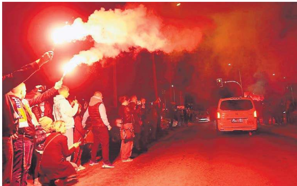
Gdy karawan z trumną opuszczał teren kościoła, kibice Śląska Wrocław odpalili race