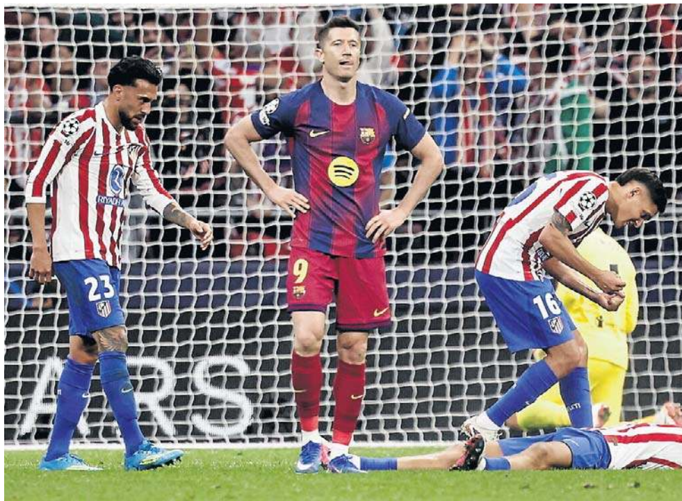
Robert Lewandowski rozpoczął mecz z Atletico Madryt na ławce rezerwowych. Na boisku zameldował się w 68. minucie, już przy ustalonym wyniku

Po meczu Lewandowski nie krył rozczarowania z powodu odpadnięcia Barcelony. Od momentu transferu z Bayernu Monachium ani razu nie dotarł z nią do finału Ligi Mistrzów.