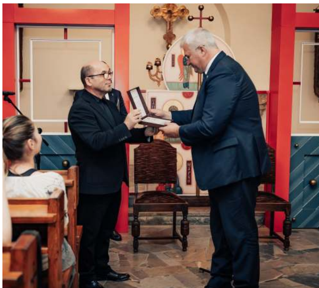
Отець Стефан Батрух вручив міністру відзнаку «Цеглинка філантропії».

«Воно зміцнює кожну з наших країн і Європу загалом. Адже безпека України є неподільною з безпекою Європи», – наголосив Андрій Сибіга. На підсумковій пресконференції він також зазначив, що природною частиною Люблінського трикутника має стати вільна і демократична Білорусь.