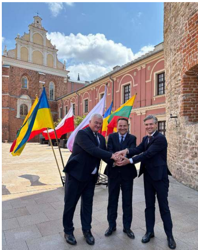
Міністри закордонних справ України, Польщі та Литви