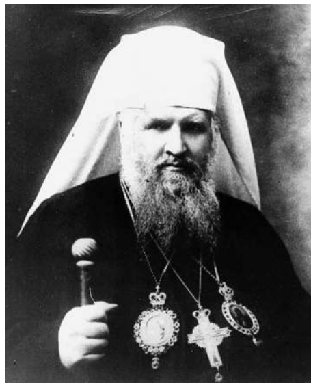
Архієпископ Андрей Шептицький

постився. Під час великого посту їв один раз на день, а ввечері випивав тільки склянку чаю, що було «нечуваним омертвлєнням в його віці». Ослаблений організм постраждав ще й від тифу, на який він захворів у серпні 1891 року. За порадою лікарів молодий чернець із жовтня перебував на реабілітаційному курорті в Закопане, а повернувшись у монастир у травні 1892 року, продовжив готуватися до складання обітниці. В серпні 1892 року був висвячений на священника, а наступного місяця провів першу службу у родинному селі Прилбичах. Після цього ще продовжив богословські студії, перервані хворобою, потім перебував у Добромільському мо-