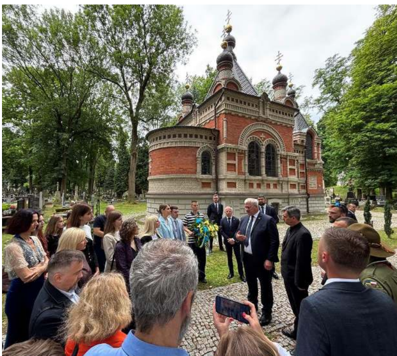
На Православному кладовищі у Любліні

Відбулась теж предметна розмова, як посилити тиск на агресора через санкції та військову співпрацю, розблокувати переговорний процес про вступ України до ЄС й про спільну протидію гібридним російським загрозам – кібератакам та пропаганді.