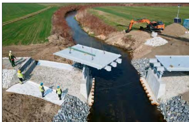
Prace montażowe przebiegły zgodnie z harmonogramem i założeniami technicznymi.

Jak podkreślają przedstawiciele wykonawcy, prace przebiegły zgodnie z harmonogramem i założeniami technicznymi.