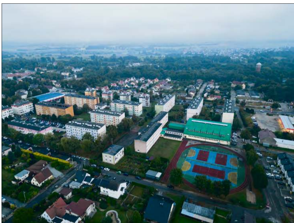
Prace nad Planem Ogólnym trwają w każdej gminie powiatu krapkowickiego – nowy dokument określi, gdzie w przyszłości będzie można budować, a gdzie zabudowa zostanie ograniczona.

Jednym z głównych powodów reformy jest tzw. rozlewanie się miast. Zabudowa powstaje coraz dalej od centrów, często w