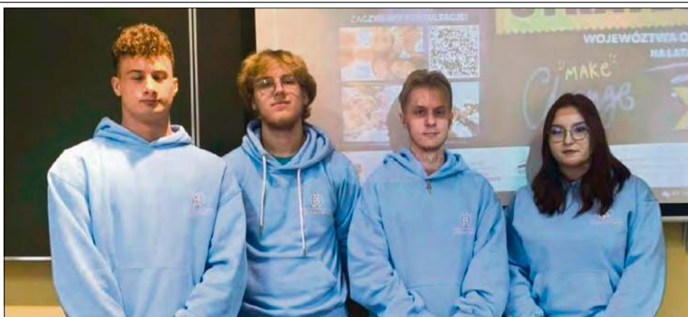
Wydarzenie miało na celu przybliżenie młodzieży szkolnej działań Młodzieżowego Sejmiku Województwa Opolskiego.

Po części teoretycznej uczestnicy pracowali w grupach. Dyskutowali o problemach i atutach swojej okolicy, wymieniając się spostrzeżeniami na temat przestrzeni, w której żyją na co dzień. Spotkanie zakończyło się w przestrzeni publicznej szkoły, gdzie młodzi radni podziękowali koleżankom i kolegom za udział w zajęciach.