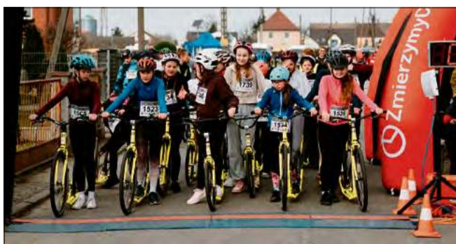
Po raz kolejny dzieci i młodzież uczestniczyły w wyścigu hulajnog.

Emocje, śmiech i sportowa walka do ostatnich metrów - tak wyglądał wyścig na hulajnogach w Walcach. Wydarzenie w ramach Dni Partnerstwa pokazało, że integracja polsko-czeska może mieć naprawdę szybkie tempo.