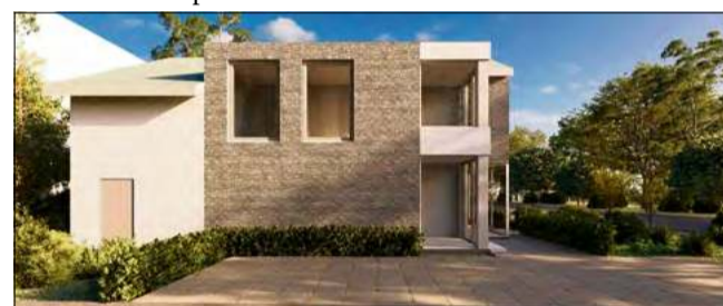
W budynku powstaną nowoczesne powierzchnie biurowe przeznaczone pod wynajem.

Osoby zainteresowane wynajmem powierzchni biurowych mogą już teraz kontaktować się z nowym właścicielem: e-mail: nieruchomosci@msiw.eu