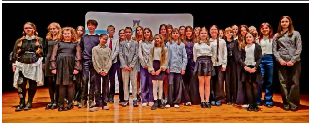
W eliminacjach wzięło udział ponad siedemdziesięciu uczniów.

W Krapkowickim Domu Kultury odbyły się miejsko-gminne eliminacje do 71. Ogólnopolskiego Konkursu Recytatorskiego. Wydarzenie zgromadziło 53 uczestników, którzy zaprezentowali swoje umiejętności w czterech kategoriach wiekowych.