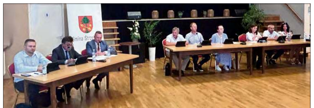
Wykonanie uchwały powierzono burmistrzowi Strzeleczy.

Podczas ostatniej sesji, która odbyła się 24 lutego, Rada Miejska w Strzeleczy podjęła uchwałę w sprawie udzielenia pomocy finansowej dla gminy Krapkowie. Środki przeznaczone zostaną na dofinansowanie bieżącej działalności Warsztatu Terapii Zajęciowej w Krapkowicach.