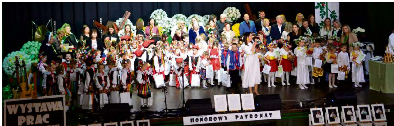
Podczas XVIII edycji przeglądu „Raz na ludowo” scena należała do najmłodszych.

Równolegle z przeglądem działał kiermasz. Swoje stoiska przygotowały koła gospodyń wiejskich, przedszkola i szkoły podstawowe.