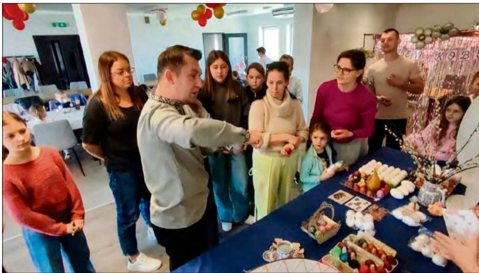
Sala wiejska w Krępnej zamieniła się w pracownię ludowego rzemiosła, gdzie pod okiem instruktorów powstawały tradycyjne opolskie kroszonki.

Podczas warsztatów przy jednym stole zasiadli mieszkańcy w różnym wieku – panie, panowie i