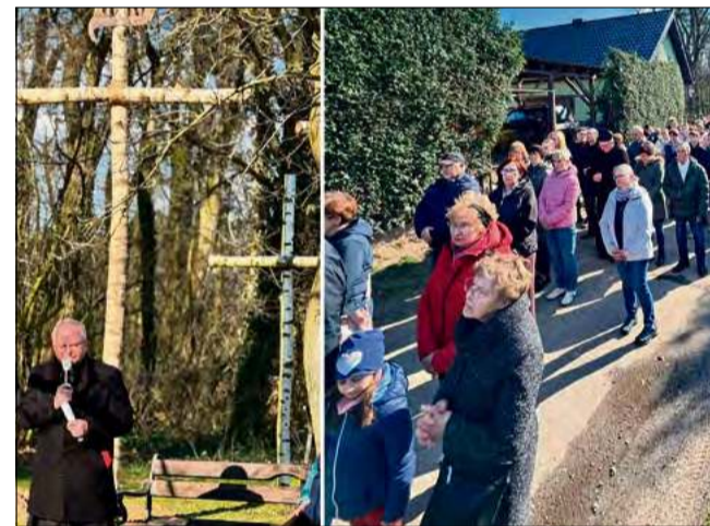
Uczestnicy nabożeństwa nieśli krzyż ulicami miejscowości.

W sobotę 21 marca w Dobrej odbyło się tradycyjne nabożeństwo drogi krzyżowej ulicami wioski. Wydarzenie miało charakter dekanalny - do udziału zaproszono wiernych z kilku parafii.