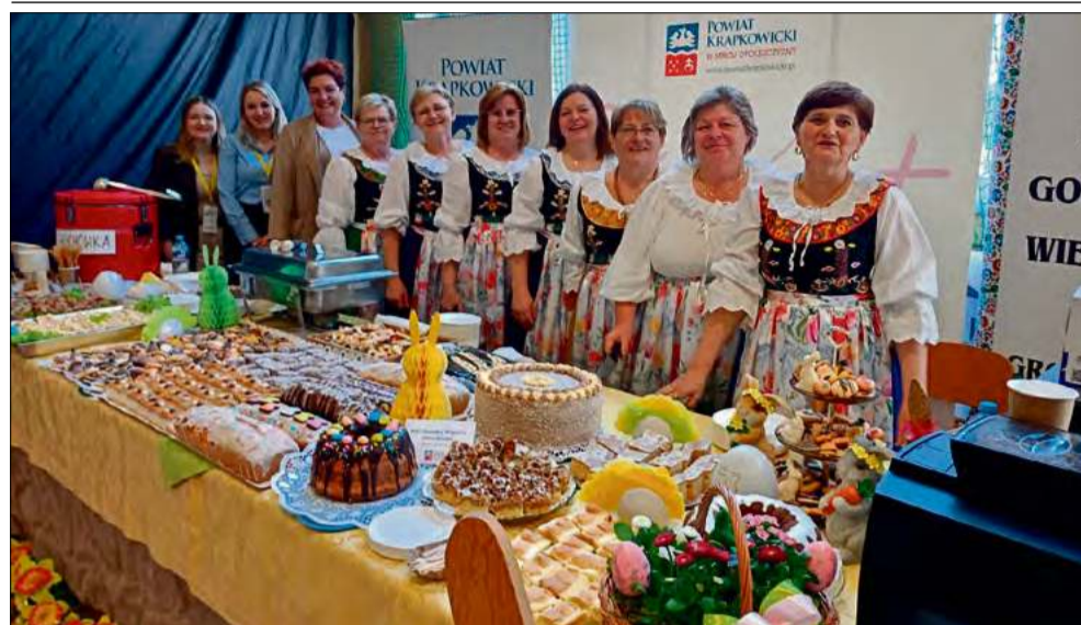
KGW Grocholub udowodniło, że tradycja, kreatywność i kulinarne umiejętności mieszkańców naszego regionu mają moc przyciągania uwagi i budowania pozytywnego wizerunku regionu na szerszą skalę.