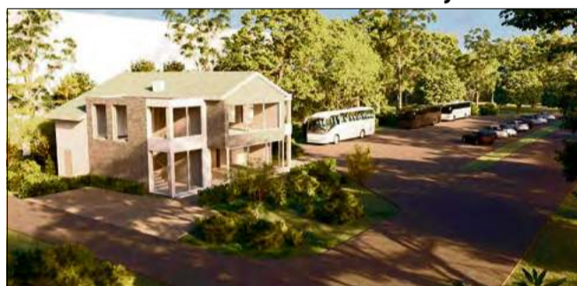
Obiekt znajduje się w atrakcyjnej lokalizacji przy drodze krajowej nr 45, w bezpośrednim sąsiedztwie dużego parkingu.

Planowany najemca to sieć sklepów Żabka, co zapewni okolicznym mieszkańcom i podróżnym wygodny dostęp do codziennych zakupów oraz usług.