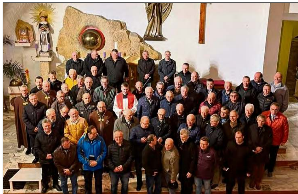
Frekwencja okazała się zaskakująca.

Frekwencja okazała się zaskakująca. W kościele w Góraźdżach modliło się kilkudziesięciu mężczyzn, co