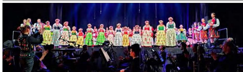
Dzięki pasji, pracy i wsparciu nawet najmłodszy artyści mogą zaznaczyć swoją obecność na scenach wielkich widowisk i czerpać inspirację od najlepszych.

To był występ, który na długo pozostanie w pamięci zarówno małych tancererek, jak i publiczności. W sobotę 21 marca Dziecięcy Zespół Taneczny „Przecinek” z Broźca wziął udział w niespodziewanym pokazie przed ogromną widownią w hali Azoty - a przede wszystkim przed artystami legendarnego Zespołu Pieśni i Tańca „Śląsk” im. Stanisława Hadyny.