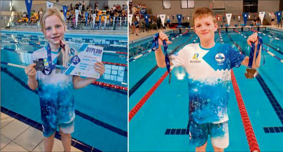
Trenerzy i klub pogratulowali młodemu pływakowi udanych startów oraz sportowej postawy.

Ponad 500 uczestników z 44 klubów rywalizowało w zawodach pływackich zorganizowanych przez ISM Delfin Cieszyn. W gronie tym znalazła się dwójka reprezentantów młodszej grupy UKS Delfin Krapkowice, którzy stanęli na podium.