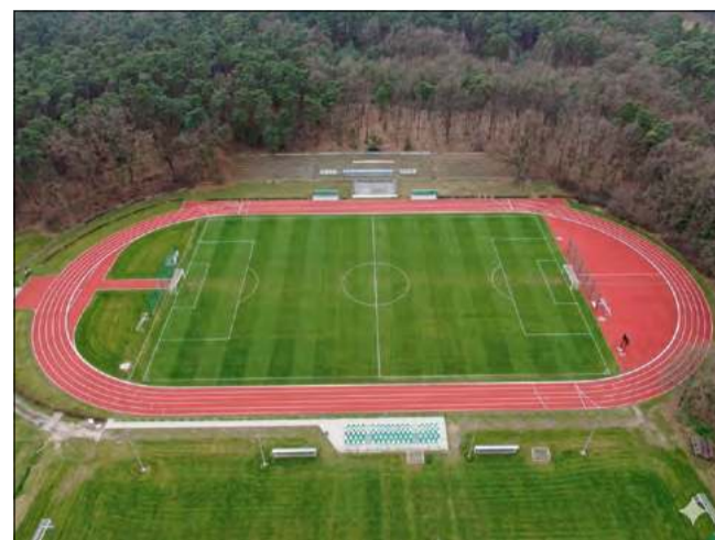
Tak może wyglądać otwarty stadion za kilkanaście miesięcy.

Jeśli procedura przyznania środków przebiegnie pomyślnie, pierwsze prace rozbiórkowe i ziemne mogą ruszyć na początku przyszłego roku.