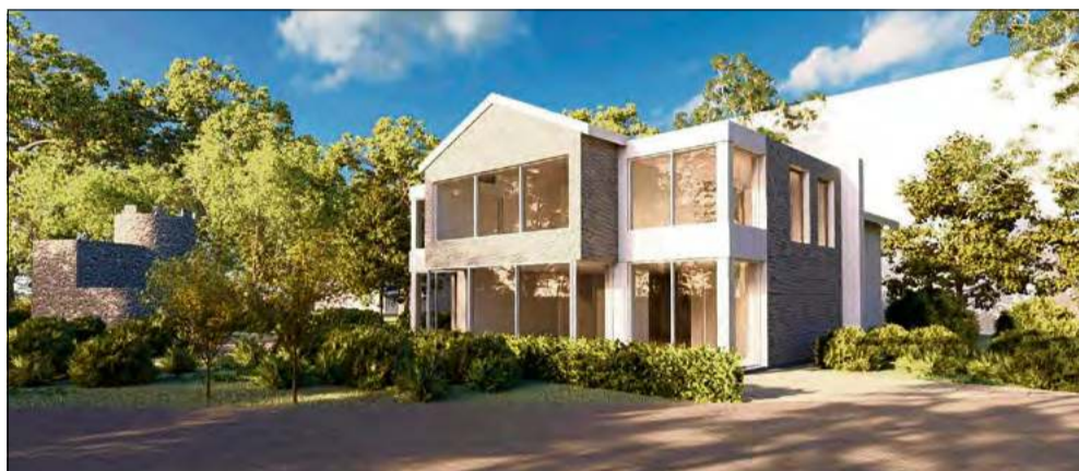
Wizualizacja budynku przy ul. Czecha 2 w Krapkowicach po planowanej modernizacji.

Zgodnie z założeniami, na parterze budynku powstanie lokal handlowy.