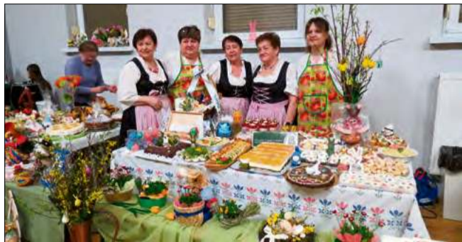
Wystawa Stołów Wielkanocnych w Walcach zachwyca tradycją i smakami.

Zapach świątecznych potraw, misternie zdobione pisanki i wyjątkowa atmosfera - tak wyglądała Wystawa Stołów Wielkanocnych w Walcach. Wydarzenie przyciągnęło miłośników tradycji i pokazało, że śląska gościnność ma się doskonale.