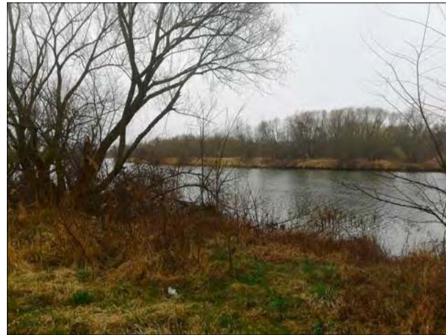
Stan Odry na odcinku gminy Krapkowice był przedmiotem pytań radnych podczas Komisji Spraw Społecznych, która odbyła się 3 marca.

W planach na najbliższe lata znajdują się dwa kluczowe zadania. Pierwszym z nich jest modernizacja prawostronnego obwałowania rzeki na odcinkach Krapkowice-Otmęt oraz Krapkowice-Odrowąż. Dokumentacja projektowa dla tego przedsięwzięcia jest już gotowa, a początek robót budowlanych zaplanowano wstępnie na rok 2027. Drugim zamierzeniem, uzależnionym od pozyskania środków finansowych, jest