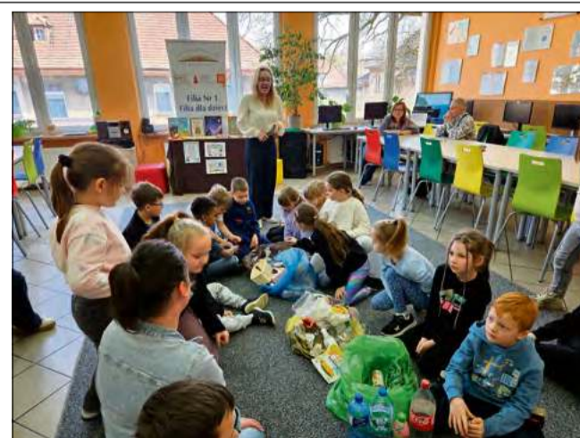
Spotkanie miało miejsce w Miejskiej i Gminnej Bibliotece Publicznej w Krapkowicach.

Spotkanie było nie tylko lekcją teorii, ale przede wszystkim inspirującą wy-