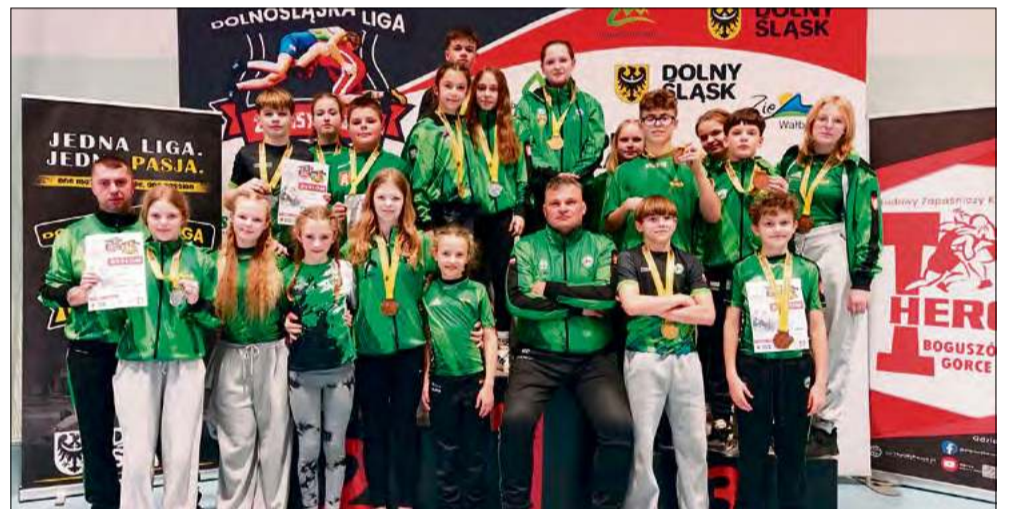
W Boguszowie-Gorcach reprezentanci ZKS-u Gogolin wielokrotnie mieli powody do radości.