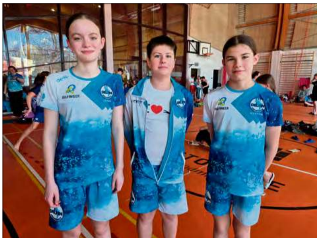
14 marca zawodnicy UKS Delfin Krapkowice wzięli udział w Zawodach Pływackich o Puchar Prezydenta Katowic.

Zawody rozegrane na katowickiej pływalni zgromadziły liczne grono młodych adeptów pływania, co przełożyło się na wysoki poziom sportowy i