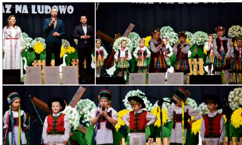
Wystąpiły dzieci z przedszkoli z całej gminy oraz goście z innych miejscowości.