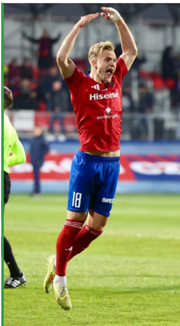
Pod Jasną Górą zapanowała euforia.

Sędziował Karol Arys (Szczecin). Widzów 5500. Żółte kartki: Zych – Jędrych.