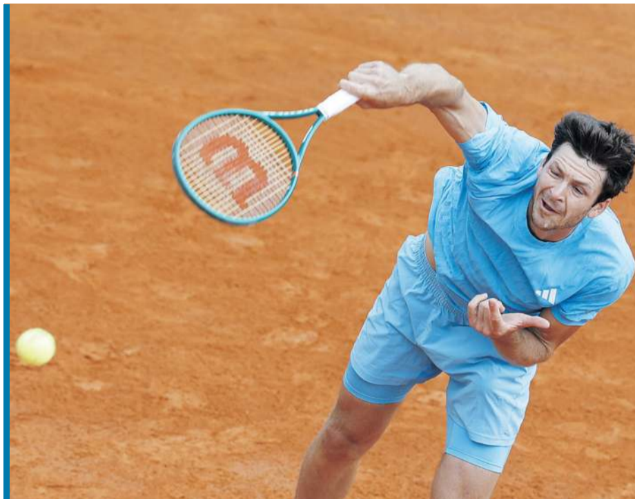
Mieszkający w Monte Carlo Wrocławianin po trzech dobrych meczach zakończył przygodę w tej edycji imprezy rozgrywanej „po sąsiedzku”.