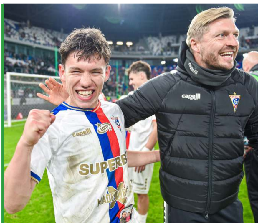
W pierwszym meczu z Legią jedenastka z Zabrza wygrała u siebie 3:1.