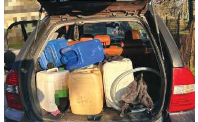
Na terenie budowy trasy S17 dochodziło wielokrotnie do włamań i kradzieży paliwa ze zbiorników maszyn budowlanych

Kryminalni sukcesywnie docierali do coraz szerszego grona osób pokrzywdzonych. Jak się okazało, do zdarzeń z udziałem tych samych sprawców dochodziło również na terenie powiatu zamojskiego i biłgorajskiego.