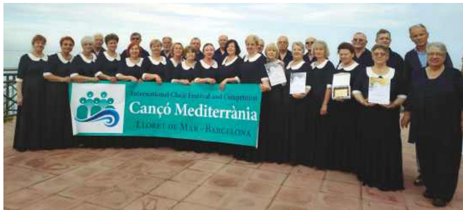
Chór Roztocze występował aż trzy nagrody na międzynarodowym festiwalu w Lloret de Mar.

To wyjątkowe osiągnięcie jest efektem wielomiesięcznych przygotowań, konsekwentnej pracy oraz ogrom-