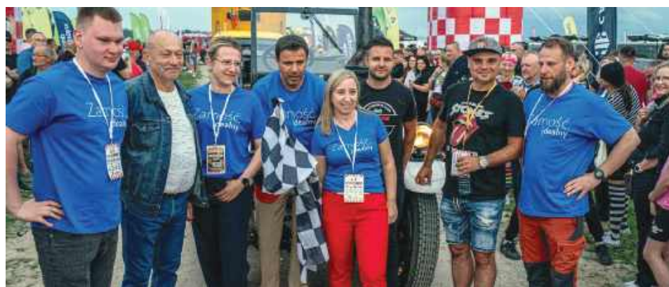
W tegorocznej edycji Rajdu Koguta wzięło udział ponad 3,7 tys. pojazdów. Organizatorzy podkreślali, że ta liczba nie mogłaby być aż tak duża, gdyby nie znakomite warunki, jakie dla uczestników na mecie zaoferowały Miasto Zamość, Gmina Zamość i Powiat Zamojski.