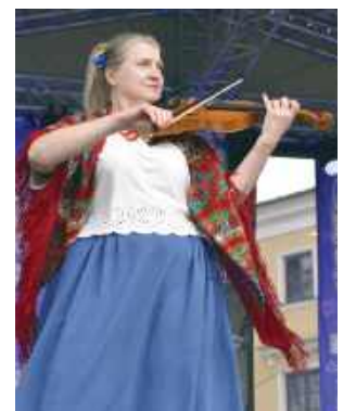
Na scenie na Rynku Wielkim przez dwa dni odbywały się występy artystyczne.

Na Rynku Wodnym zorganizowano strefę warsztatową, gdzie m.in. odbywały się pokazy rzemiosła. Na scenie na Rynku Wielkim przez dwa dni odbywały się występy artystyczne. Wystąpili m.in. Kapela Fajerka, Rainer Maria Nero, Orkiestra Jarmarku