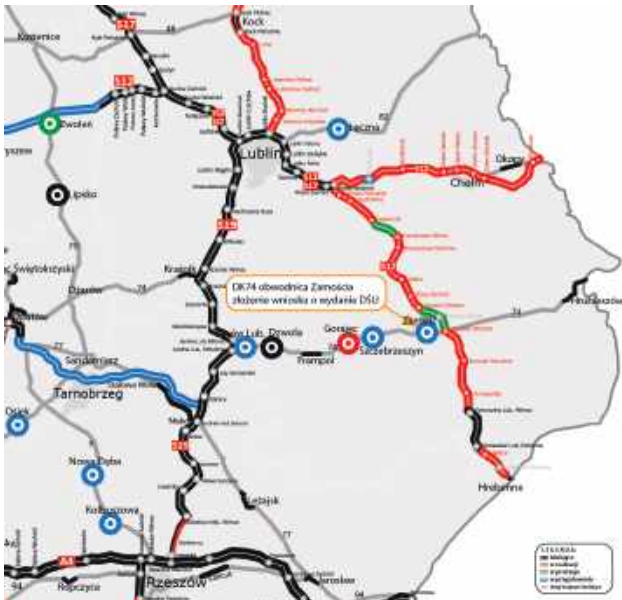
Obwodnica przebiegać będzie w nowym śladzie przez teren pięciu gmin: Sułów, Szczepleszyn, Zamość, Nielisz i Stary Zamość.

Prawie 19 kilometrów nowej drogi, mosty nad Wieprzem i Łabuńką oraz połączenie z przyszłą S17 – Generalna Dyrekcja Dróg Krajowych i Autostrad złożyła wniosek o decyzję środowiskową dla obwodnicy Zamościa w ciągu DK74, rekomendując wariant 3C (zielony).