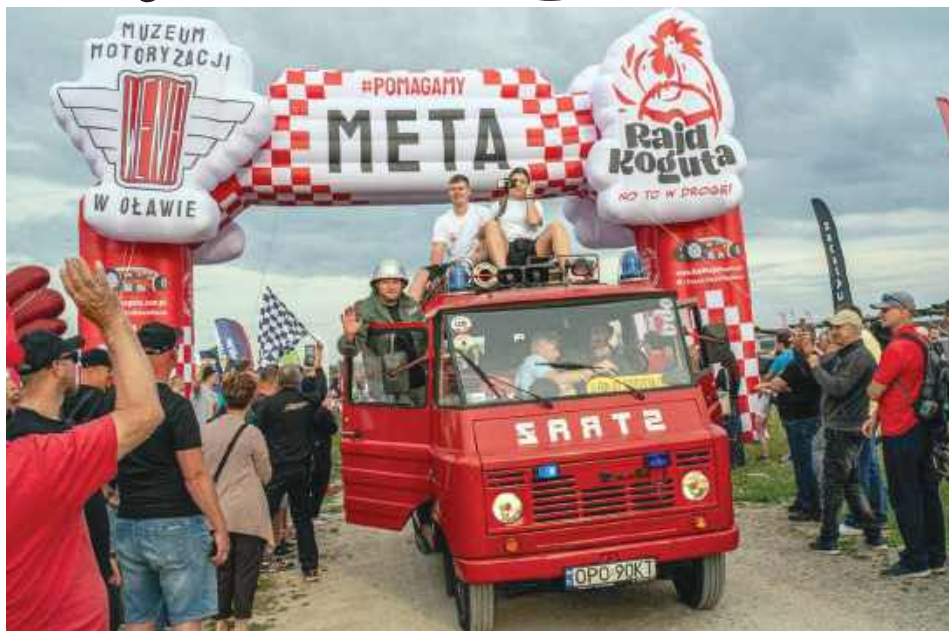
Meta Rajdu Koguta na lotnisku w Mokrem.

4, 5 i 6 czerwca wszystkie drogi prowadziły do Zamościa i Mokrego. Zamość stał się bowiem meta jubileuszowej, 10. edycji Rajdu Koguta – jednego z największych charytatywnych rajdów motoryzacyjnych w Europie. Finał wydarzenia – z udziałem blisko 4 tys. zabytkowych pojazdów z całej Polski – odbył się w dniach 5-6 czerwca na terenie Aeroklubu Ziemi Zamojskiej w Mokrem.