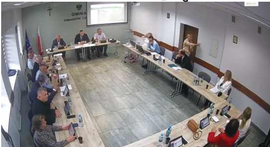
Spór o zaledwie 181 metrów kwadratowych gruntu wywołał jedną z najgorętszych dyskusji tej kadencji Rady Gminy Tomaszów Lubelski.

Gdy przewodniczący otworzył dyskusję, głos zabrała wójt. – Poszerzenie pasa drogowego w Majdanie Górnym trwa już od kilku lat. Powstaje tam