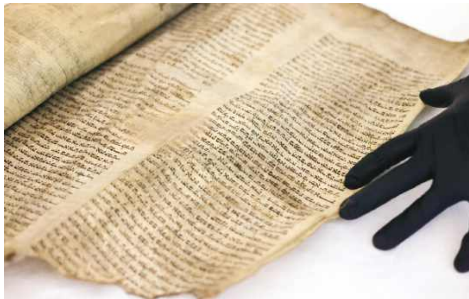
Tora zachowała się w stanie wymagającym prac konserwatorskich. Widoczne ślady zniszczeń wskazują, że została częściowo nadpalona.

Historia odzyskania Tory rozpoczęła się w marcu 2025 roku. Pracownicy ministerstwa natrafili wówczas na portalu Facebook na ofertę sprzedaży zabytkowego zwoju. Przeprowadzona weryfikacja pozwoliła