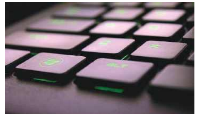
Ujawniono treść korespondencji prowadzonej przez oskarżonego z pokrzywdzoną, a także ślady jej kasowania – przekazała prokuratura.

W ramach prowadzonego śledztwa przeprowadzono szereg czynności procesowych, w tym m.in. dokonano zatrzymania i zabezpieczenia nośników elektronicznych, które poddano oględzinom i badaniom przez biegłych. Sąd przesłuchał małoletnią pokrzywdzoną z udziałem biegłego psychologa, zabezpieczono