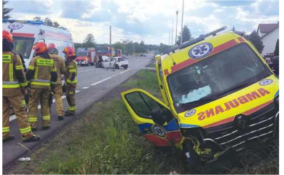
Po wypadku droga krajowa nr 74 w Bodaczowie była całkowicie zablokowana.