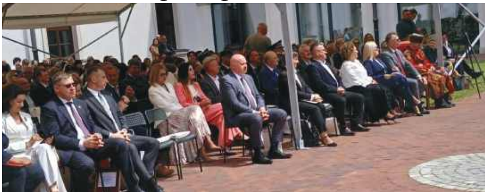
Centralnym wydarzeniem obchodów była Gala Jubileuszowa na szkolnym dziedzińcu.

Centralnym wydarzeniem obchodów była Gala Jubileuszowa na szkolnym dziedzińcu. W niecodziennej roli wystąpił sam Jan Zamoyski, którego postać przywołano podczas stylizowanej na XVI-wieczną polszczyznę przemowy otwierającej uroczystość. Podczas gali przypomniano historię szko-