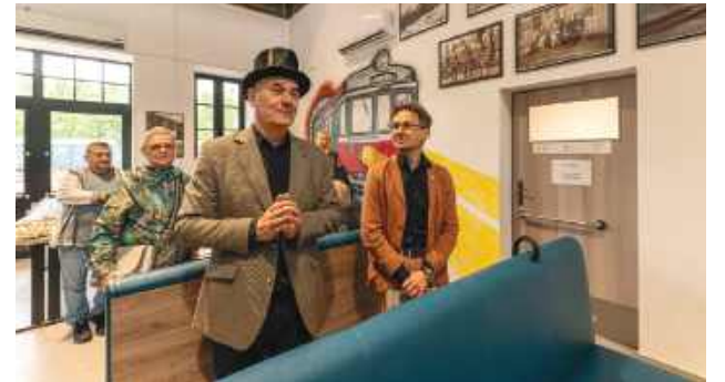
Część wystawy można obejrzeć w barze Peron.