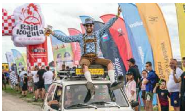
Radość z ukończenia rajdu była ogromna.