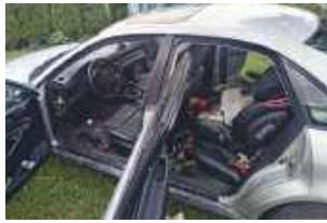
W samochodzie porzucane puszki po piwie... a kierowca pijany.