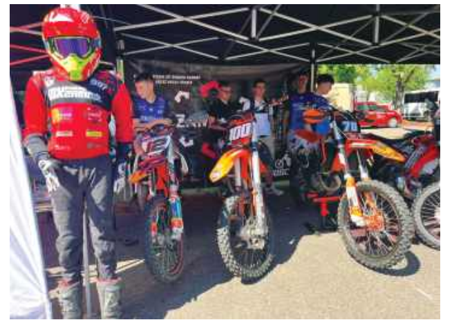
Na uczestników czekały prezentacje różnego rodzaju pojazdów oraz widowiskowe pokazy jazdy, w tym motocykli.

Miłośnicy czterech i dwóch kółek nie mogli narzekać na brak atrakcji. Na terenie Zespołu Szkół Ponadpodstawowych nr 2 im. Tadeusza Kościuszki w Zamościu odbyła się XVI edycja Dnia Motoryzacji – wydarzenia, które na stałe wpisało się już w kalendarz lokalnych imprez.