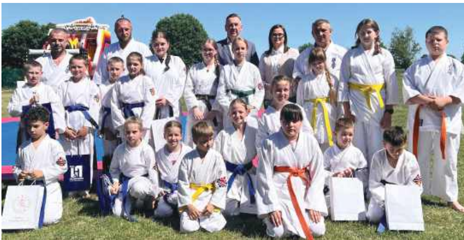
Tegoroczny piknik był już piątą edycją wydarzenia organizowanego w ramach projektu budowy mieszkań komunalnych i socjalnych w Terebiniu.

Jednym z najważniejszych punktów programu było wręczenie wyróżnień zawodnikom UKS Sportów Walki Werbkowice oraz Dojo Seiken Czerniczyn za sukcesy osiągnięte podczas Mistrzostw Świata KyodoKyokushin. Zawody odbyły się 25 kwietnia w Korzennej