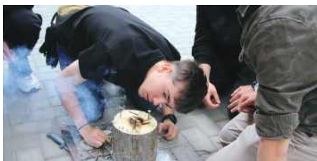
Uczestnicy musieli sobie poradzić m.in. z rozpalaniem ognia przy użyciu krzesiwa.

w postaci wyposażonych plecaków ewakuacyjnych dla szkół oraz m.in. multitoole, kubków termicznych, krzesiw i bransoletek survivalowych dla uczniów.