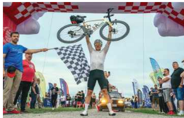
Niektórzy trasę pokonali na rowerze.