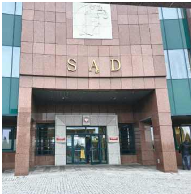
20 maja Sąd Okręgowy w Zamościu utrzymał w mocy wyrok sądu pierwszej instancji.