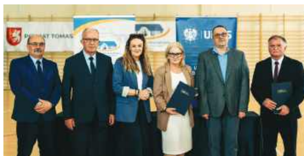
Podpisanie umowy o objęcie klasy II Liceum Ogólnokształcącego patronatem przez Uniwersytet Marii Curie-Skłodowskiej w Lublinie.

Wśród, 3 czerwca, w siedzibie szkoły przy ul. Żwirki i Wigury 3 podpisano porozumienie o współpracy pomiędzy Wydziałem Filolo-