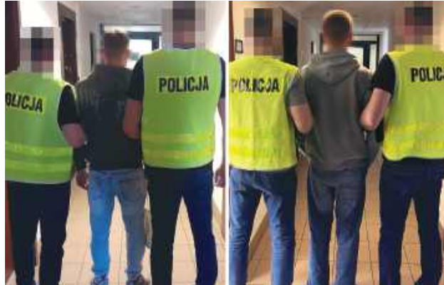
Kryminalni zatrzymali 19- i 20-latkę z gminy Adamów, którzy kradli paliwo. Mężczyźni uszli już zarzuty.