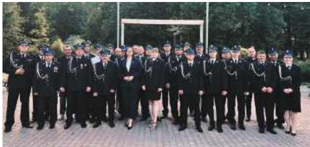
Podczas spotkania podsumowano działalność Oddziału Gminnego ZOSP RP w kadencji 2021-2026, przedstawiono sprawozdania z działalności oraz udzielono absolutorium ustępującemu zarządowi. Następnie wybrano nowe władze i przyjęto kierunki działania na kolejne lata.