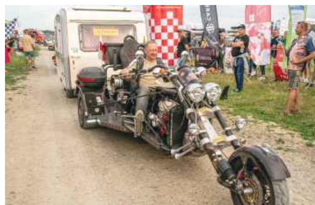
Można było zobaczyć prawdziwe motoryzacyjne perełki.

Przez dwa dni na usytuowanej na lotnisku w Mokrem scenie odbywały się koncerty. Wystąpiły m.in. zespół folklo-