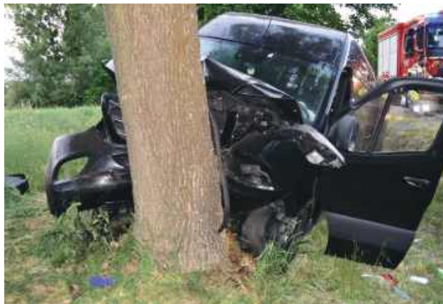
Kierujący Mercedesem był trzeźwy. 62-latek nie odniósł poważniejszych obrażeń.

licjanci ruchu drogowego, którzy wstępnie ustalili przebieg zdarzenia. Jak wynika z ich ustaleń, 62-letni kierowca nie zachował należytej ostrożności podczas jazdy, stracił panowanie nad pojazdem, zjechał z drogi do rowu, a następnie uderzył w przydrożne drzewo.