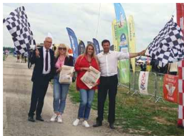
Na mecie czekała też ekipa Kroniki Tygodnia.

czowie. Ich udział miał wymiar przede wszystkim charytatywny – podczas rajdu zbierali środki na leczenie i rehabilitację czwórki dzieci z regionu białskiego.