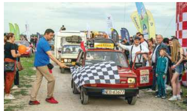
Na widok polskich klasyków niejednemu łezka zakręciła się w oku.

rystyczny „Wójtowanie” z Krasnobrodu, Zwierzyniecka Kapela Ludowa ze Zwierzyńca oraz Kapela Gminnego Ośrodka Kultury w Grabowcu, „Babczki” z Mokrego, zespół wokalny Ale Cantare z Płoskiego, grupa wokalna Showmen Szopiniek oraz zespoły The Shoemakers, Comers i VOX.