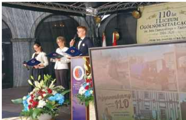
Jak podkreślali organizatorzy, jubileusz był nie tylko okazją do wspomnienia bogatej historii szkoły, ale także do refleksji nad jej rolą w życiu miasta i regionu oraz spojrzenia w przyszłość.