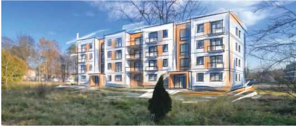
Po latach oczekiwania i licznych komplikacjach inwestycja Społecznej Inicjatywy Mieszaniowej w Tomaszowie Lubelskim wchodzi w kolejny etap. Na zdjęciu potencjalna zabudowa w Tomaszowie.

Spółka SIM Lubelskie poinformowała o rozstrzygnięciu przetargu na opracowanie koncepcji oraz pełnej wielobranżowej dokumentacji projektowo-kosztorysowej dla budynku mieszkalnego wielorodzinnego, który ma powstać przy Alei Sportowej w Tomaszowie Lubelskim.