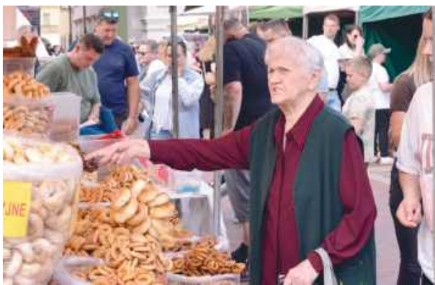
Na stoiskach na Rynku Wielkim, Rynku Wodnym oraz Rynku Solnym można było znaleźć m.in. regionalne przysmaki.

Jarmark Hetmański to coroczna impreza o charakterze promocyjno-handlowym, nawiązująca do rocznicy nadania aktu lokacyjnego miasta. Podczas wydarzenia zamościanie i turyści mogli spróbować wyjątkowych potraw i produktów przygotowanych przez lokalnych producentów. Na stoiskach na Rynku Wielkim, Rynku Wodnym oraz Rynku Solnym można było znaleźć m.in. regionalne przysmaki (sery, miody, wędliny, pieczywo i tradycyjne wypieki) oraz lokalne