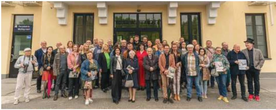
Wspólne zdjęcie uczestników wernisażu.