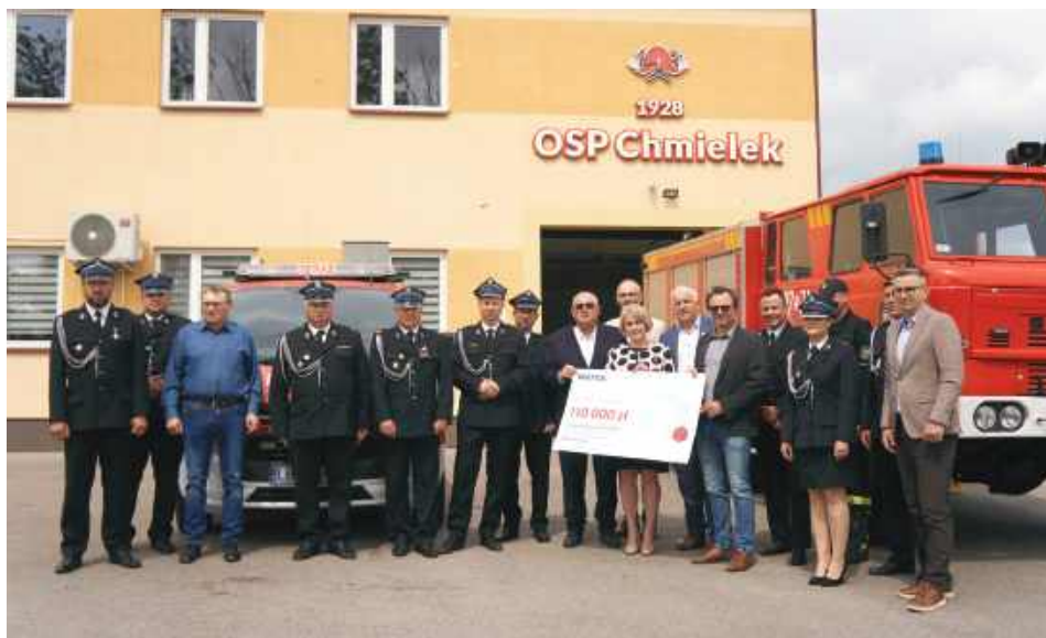
Przekazanie symbolicznego czeku.

Pożar, który wybuchł 5 maja, objął ogromny obszar Puszczy Solskiej. Jak podsumowały Lasy Państwowe, żywił strawił 1157 hektarów lasu. W kulminacyjnym momencie z ogniem walczyło ponad 3 tys. strażaków z Państwowej Straży