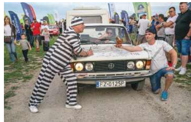
Fantazja uczestników nie zna granic.