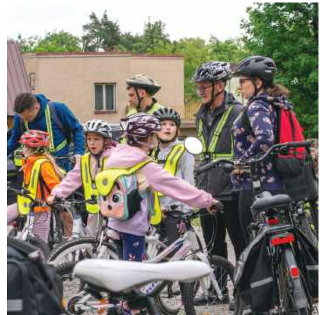
Rajd był okazją do rodzinnej integracji i aktywnego spędzenia czasu w otoczeniu przyrody.

W niedzielę, 31 maja, odbył się rodzinny rajd rowerowy „Na Szlaku Przygody”, którego organizatorami byli Powiat Tomaszowski oraz Stowarzyszenie Samorządów Powiatu Tomaszowskiego. Uczestnicy wyruszyli o godz. 10 z placu przy Muzeum Regionalnym im. dr. Janusza Petera w Tomaszowie Lubelskim, które było również metą wydarzenia. Trasa prowadziła przez malownicze tereny leśne Roztocza, miejscami przebiegając także przez bardziej wymagające, piaszczyste odcinki.