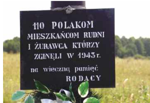
Tych miejscowości już nie ma na Wołyniu.

Warto wspomnieć, że zbrodnicę, za którą stała UPA, przeżyli nawet Niemcy. Polaków mordowano siekierami, kosami, przeżyłano piłami, palono żywcem. Na Wołyniu, w Małopolsce Wschodniej oraz na Lubelszczyźnie zginęło z rąk Ukraińców ponad 100 tys. Polaków, w tym kobiety