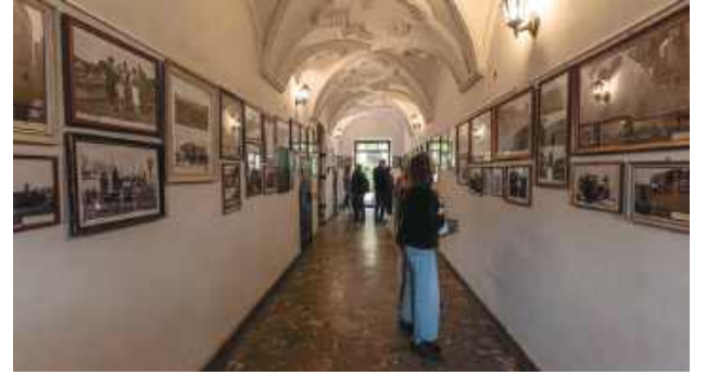
Łącznie (w obu miejscach) można zobaczyć blisko 100 fotografii.