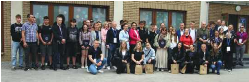
W wydarzeniu udział wzięły reprezentacje ośmiu szkół średnich prowadzonych przez miasto.

Uczestnicy musieli wykazać się zarówno wiedzą teoretyczną z zakresu bezpieczeństwa