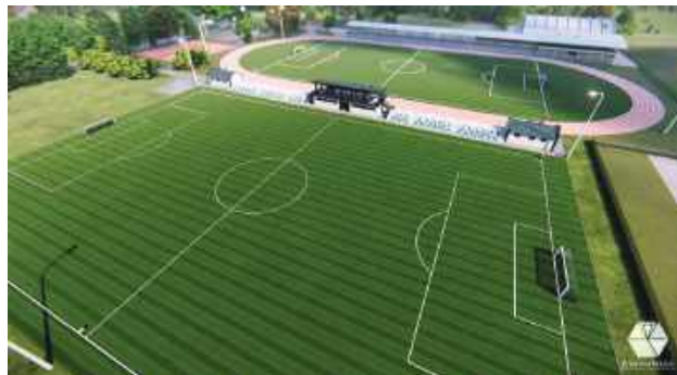
Wizualizacja nowego boiska w Biłgoraju.

Całkowita wartość przedsięwzięcia została oszacowana na 9 856 138 zł. W ramach inwestycji