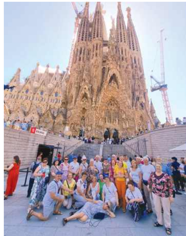
Podczas pobytu w Hiszpanii chór Roztocze również zwiedzał. Chórzyści zobaczyli m.in. Bazylikę Sagrada Familia. Śpiewali też w krypcie Antoniego Gaudiego.