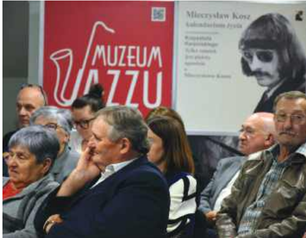
Podczas spotkania autor opowiedział o kulisach powstawania monografii poświęconej Koszowi.

Rozmowa o jego książce zatytułowanej „Tylko smutek