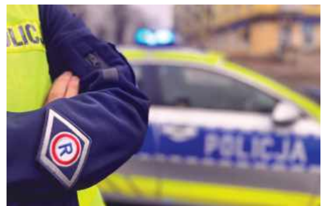
20- i 19-latek urządzili sobie wyścigi na ulicy Zamościa. To przestępstwo, za które teraz odpowiadzą.

Za kierownicą Mercedesa siedział 20-letni mieszkaniec