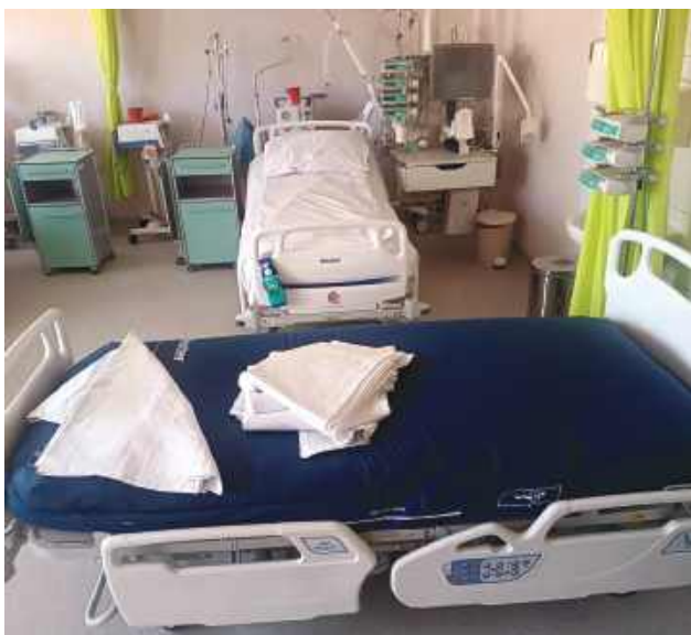
Inwestycja ma również ułatwić pracę personelu medycznego, usprawniając organizację opieki i proces podejmowania decyzji klinicznych.

W ramach projektu „Poprawa jakości opieki kardiologicznej poprzez wyposażenie w nowoczesny sprzęt Sali Intensywnej Opieki Kardiologicznej