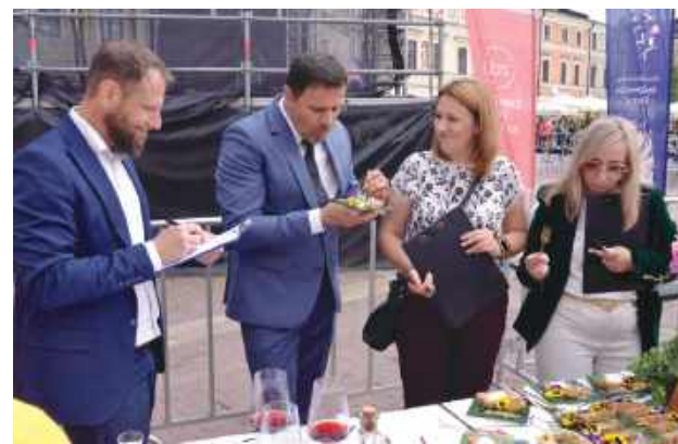
W trakcie 32. Jarmarku Hetmańskiego rozstrzygnięto Konkurs Potraw „Smaki Zamościa i Roztocza”.