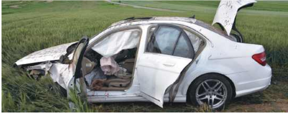
16-latek po alkoholu zabrał rodzicom Mercedesa, auto wypadło z drogi.