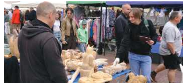
Nie zabrakło rękodzieła.