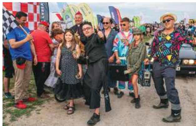
Rajd Koguta to wyjątkowo barwna impreza.