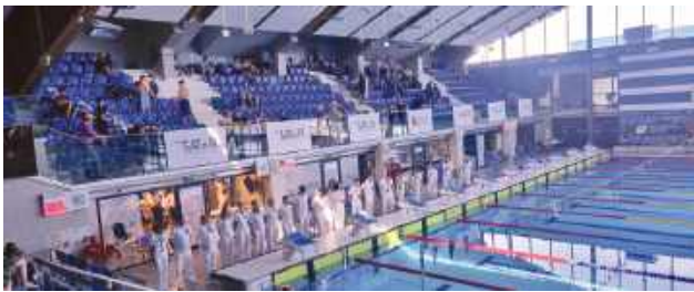
Dla Tomasovii sukces podczas mistrzostw jest wyjątkowym prezentem przed zbliżającym się jubileuszem pięciolecia działalności klubu.

Znakomicie zaprezentowali się zawodnicy Tomaszowskiego Stowarzyszenia Sportowego „Tomasovia” podczas Głównych Mistrzostw Województwa Lubelskiego w Pływaniu, które odbyły się w dniach 30-31 maja na pływalni