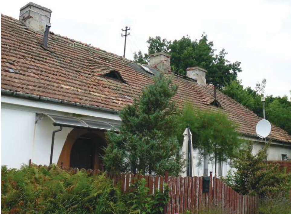
Oficyna w pobliżu ruin pałacu

Zachęcamy Czytelników do dzielenia się wspomnieniami i opiniami na temat zabytków w Górze.