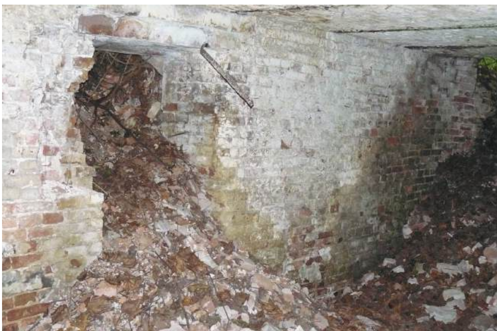
Stan piwnic dużego pałacu w Górze