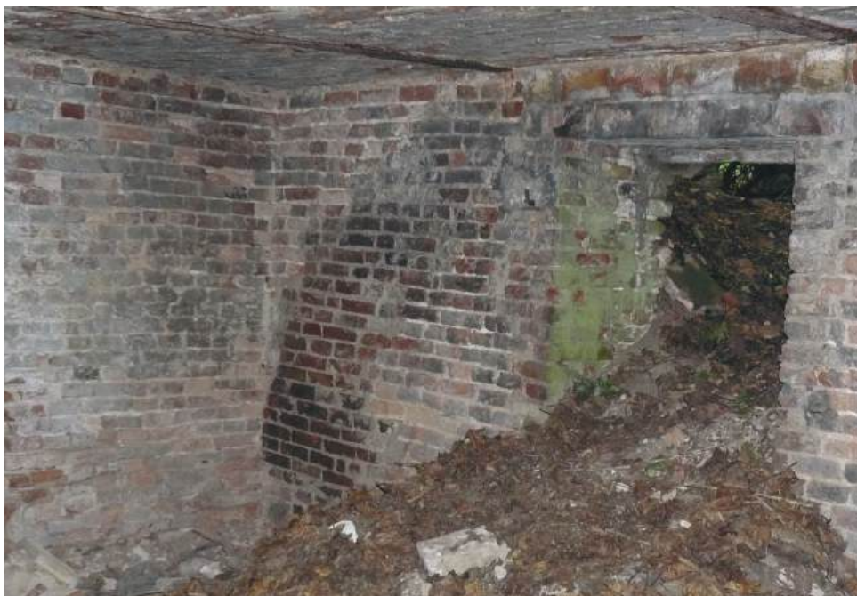
Stan piwnic dużego pałacu w Górze