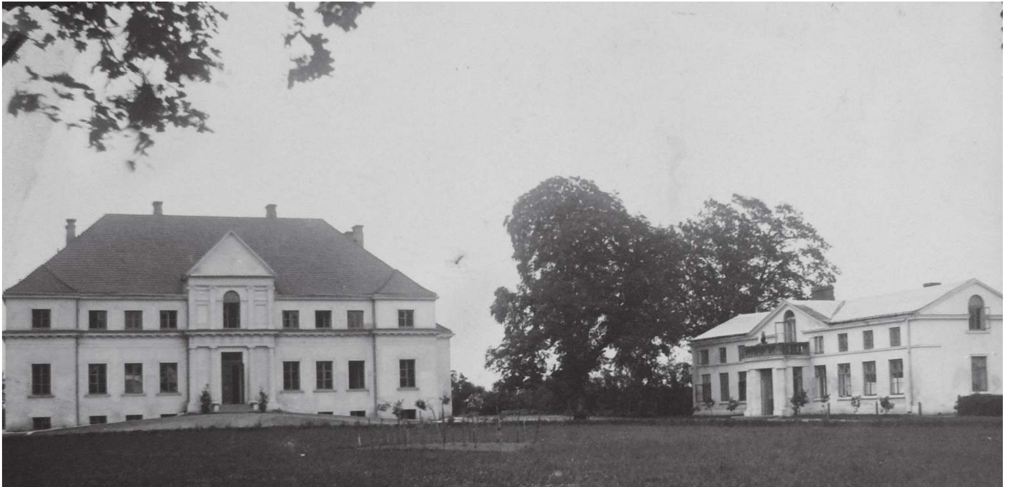
Duży pałac w Górze i mały przed 1939 r.