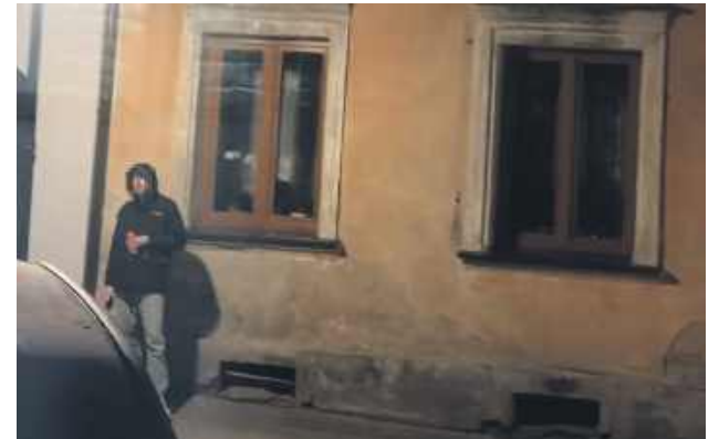
Taki był rok 2025 na pultusk24.pl

Mieszkańcy jednej z kamienic stali się ofiarami agresywnego mężczyzny, który przez kilka dni nękał ich pod pretekstem szukania wymagowanej „przyszłej żony”. Agresja eskalowała od wulgarnych krzyków do wybicia cegłą szyby w oknie balkonowym.