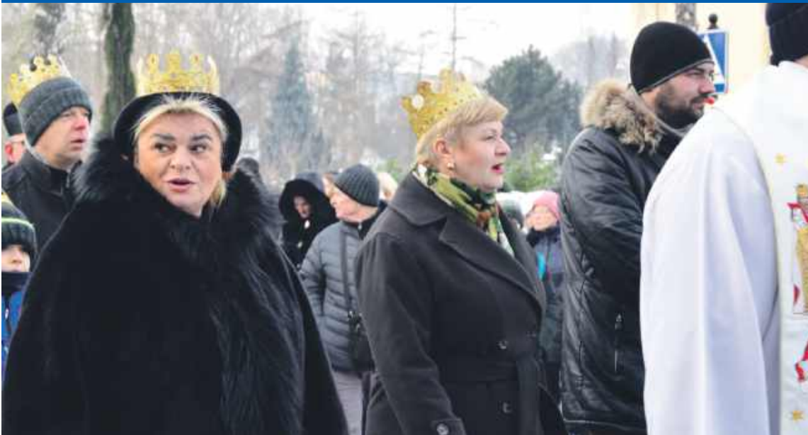
Taki duży taki mały może królem być, Taka ja i taki ty możesz królem być...