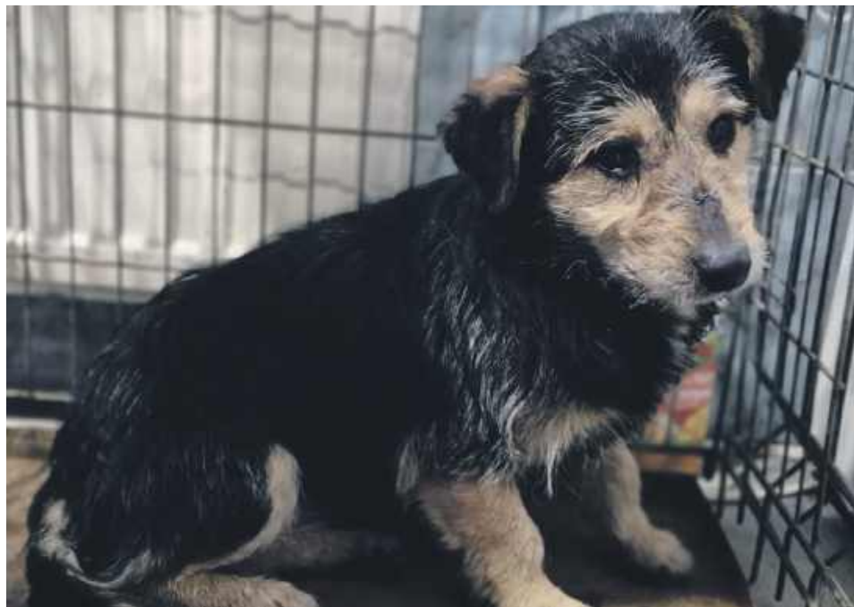
Jeden z psów przebywających w Tymczasowym Miejscu Przechowywania Zwierząt w Pułtusku.

W gminie Pułtusk kwestię sprzątania po psach reguluje Uchwała nr XXXII/298/2020 Rady Miejskiej z dnia 30 września 2020 r. w sprawie uchwalenia Regulaminu utrzymania czystości i porządku na terenie Gminy Pułtusk. W rozdziale 7 § 23 ust. 1 pkt 2 są nałożone obowiązki na osoby utrzymujące zwierzęta domowe, polegające na niezwłocznym usunięciu odchodów i innych zanieczyszczeń pozostawionych przez psy i inne zwierzęta domowe. Sprzątanie po psach to obowiązek prawny i społeczny, który świadczy również o kulturze człowieka i szacunku do innych. Straż Miejska w Pułtusku nie odnotowała