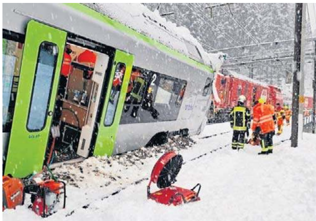
MIĘDZY GOPPENSTEIN A BRIG WSTRZYMANO RUCH POCIĄGÓW. Wszyskiemu winne nowe opady śniegu

Do katastrofy kolejowej doszło kilka dni po tym, jak szwajcarskie władze podniosły poziom zagrożenia lawinowego do wysokiego. W środę Szwajcarski Federalny Instytut Badań Lasów, Śniegu i Krajobrazu (WSL) podniósł poziom zagrożenia do czwartego, drugiego najwyższego w skali. Jak wynika ze strony internetowej organizacji, w poniedziałkowy poranek poziom zagrożenia utrzymywał się na bardzo wysokim poziomie - głównie przez opady świeżego śniegu, który pokrył starszą warstwę - a to stworzyło warunki sprzyjające zejściu lawiny. PAP