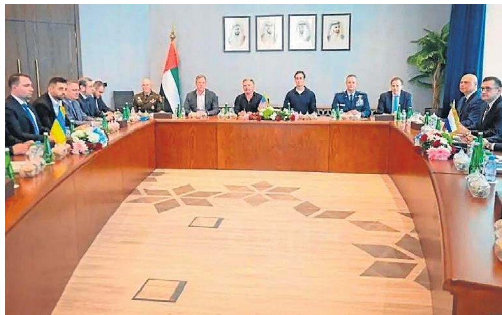
Rozmowy trójstronne w Abu Zabi między delegacjami USA, Ukrainy i Rosji trwały dwa dni i przez strony ukraińską i amerykańską zostały określone jako konstruktywne

„Ważne, aby zaplanowane w Genewie negocjacje były skuteczne, i dziękuję Stanom Zjednoczonym Ameryki za konstruktywne podejście. Poruszyliśmy również kwestię kolejności działań. Istotne jest, aby nastąpił postęp w sprawach gwarancji bezpieczeństwa oraz odbudowy gospodarczej” - napisał prezydent Ukrainy po monachijskim spotkaniu z szefem amerykańskiej dyplomacji Markiem Rubio.