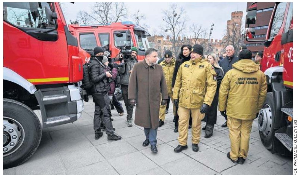
Minister Kierwiński wziął udział w odprawie ze strażakami we Wrocławiu, podczas której przedstawił inwestycje w ramach Programu Ochrony Ludności i Obrony Cywilnej

– Na Dolny Śląsk trafiło prawie 300 mln zł, ale zdajemy sobie sprawę, że to początek wielkiej drogi, która przed nami.