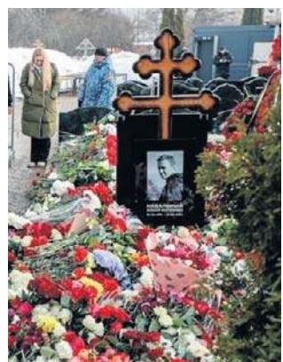
Pogrzeb Nawalnego zgromadził tłumy

Dodała: - Myślę, że to potrawa jakiś czas, ale odkryjemy,