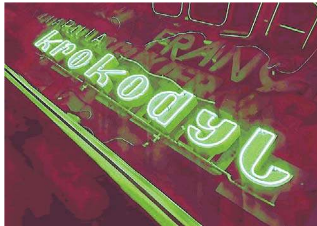
Legendarny neon „Krokodyl”, który zdobił wejście do sklepu ze skórzaną galanterią znów działa.

W 2024 roku Tomasz Kosmański, pomysłodawca Galerii Neon Side znalazł go na inter-