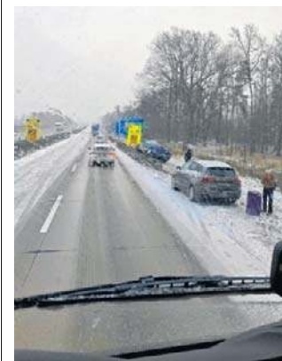
FOT. ADRIAN SKROBAN

Najgorzej było między Legnicą a zjazdem na A18 - tam ruch był spowolniony na obu pasach. ©©