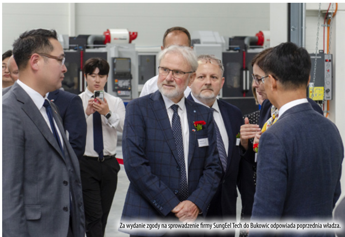
Za wydanie zgody na sprowadzenie firmy Sungeel Tech do Bukowic odpowiada poprzednia władza.