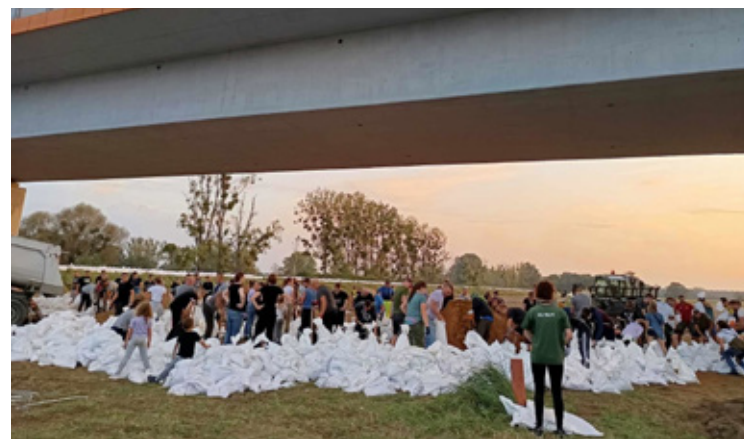
Ostatnie zagrożenie powodzią pokazało jak zaniedbane są wały. Gminę uratowano dzięki tytanicznej pracy mieszkańców.