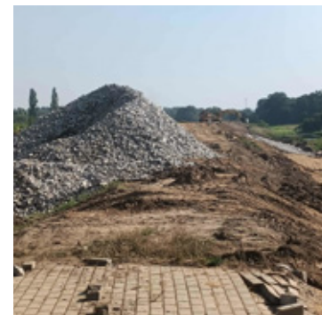
Inwestorem są Wody Polskie.