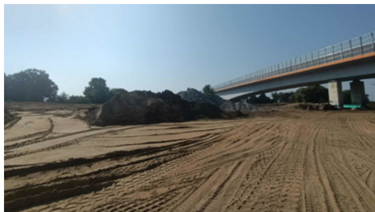
Prace zakończą się w przyszłym roku.

W Brzegu Dolnym trwają intensywne prace przy modernizacji wałów przeciwpowodziowych na odcinku od Pyszącej do miasta. To inwestycja o ogromnym znaczeniu dla mieszkańców – zwłaszcza po wrześniowej powodzi w 2024 roku, która pokazała, jak bardzo potrzebna jest skuteczniejsza ochrona przeciwpowodziowa. Wówczas wysoka fala na Odrze doprowadziła do podtopień terenów rolniczych, uszkodzeń infrastruktury i konieczności zabezpieczenia mieszkańców z naniżej położonych części miasta.