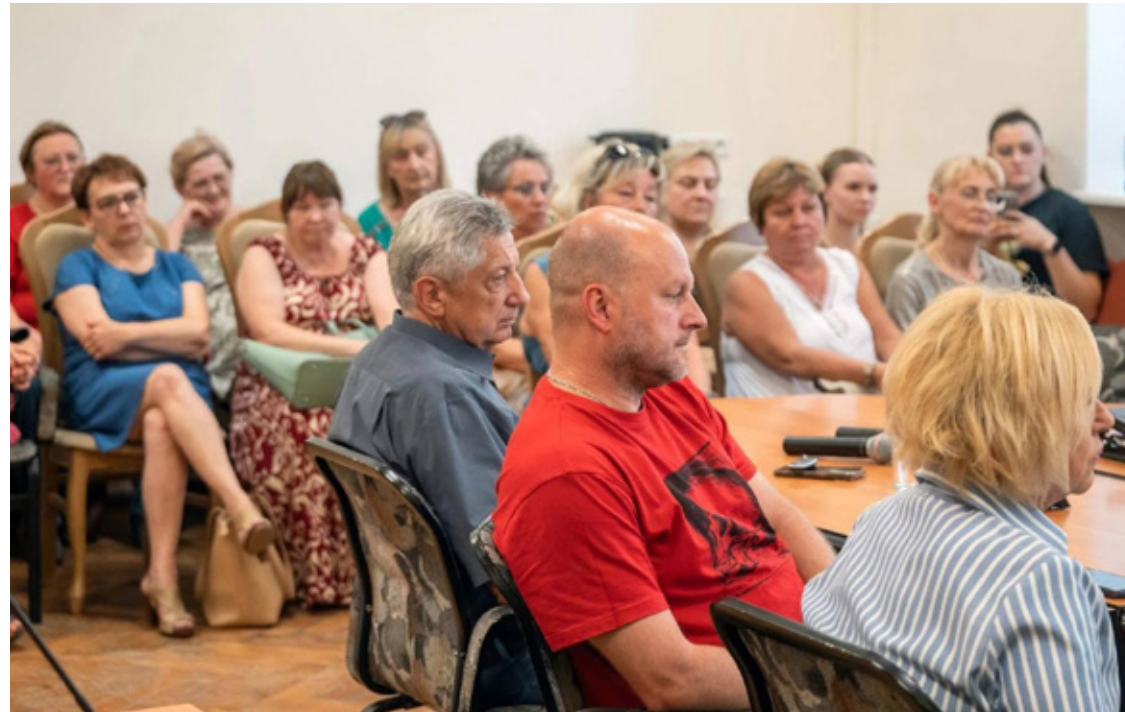
Ponad miesiąc temu na sesję przyszli pracownicy dolnobrzeskiej przychodni zaniepokojeni zmianami. Nic nie wskórali.