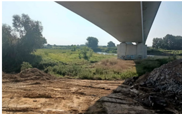
Obecne prace przy wałach.

Po dramatycznych doświadczeniach wrześniowej powodzi w 2024 roku w Brzegu Dolnym ruszyła kompleksowa modernizacja wałów przeciwpowodziowych. Na odcinku od Pyszącej do miasta powstają wzmocnienia, które mają ochronić mieszkańców przed skutkami coraz częstszych wezbrań Odry. Roboty są już wykonane w 70%, a zakończenie inwestycji planowane jest na przyszły rok.