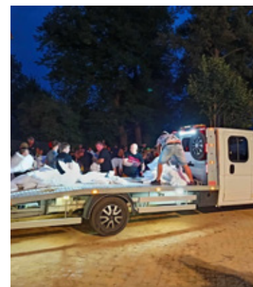
Ludzie ratowali swój dobytek umacniając wały ... workami z piaskiem.

Po dramatycznych doświadczeniach wrześniowej powodzi w 2024 roku w Brzegu Dolnym ruszyła kompleksowa modernizacja wałów przeciwpowodziowych. Na odcinku od Pyszącej do miasta powstają wzmocnienia, które mają ochronić mieszkańców przed skutkami coraz częstszych wezbrań Odry. Roboty są już wykonane w 70%, a zakończenie inwestycji planowane jest na przyszły rok.