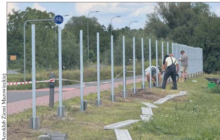
Urząd Miasta Płocka

Na terenie wokół lotniska w Płocku powstało ogrodzenie o długości ponad 1,5 km. – To krok, który realnie wpłynie na bezpieczeństwo operacji lotniczych, w tym szkoleń przyszłych pilotów, prowadzonych przez wszystkich użytkowników naszego lotniska, które pozostaje obiektem użytku publicznego – dowiadujemy się w Aeroklubie Ziemi Mazowieckiej, które sprawuje pieczę nad tym terenem.