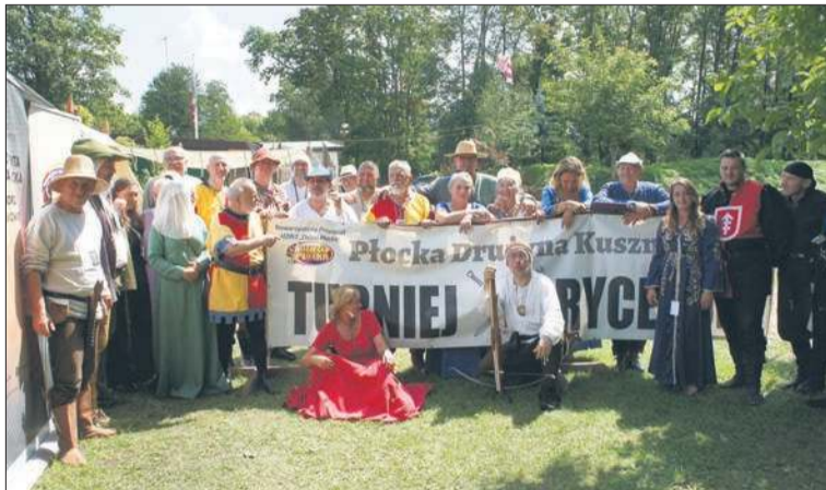
Uczestnicy tegorocznych Mistrzostw Polski w Strzelaniu z Kuszy Historycznej

– Poza tym Płocka Drużyna Kusznicza kultywuje tradycje epoki późnośredniowiecznej. Jesteśmy rekonstruktorami tej epoki. Pomimo, że strzelnica