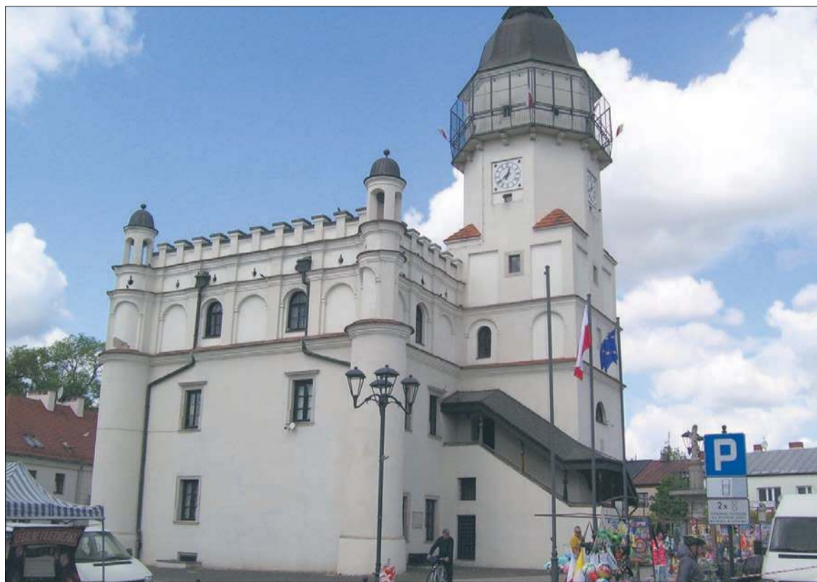
Renesansowy ratusz na Rynku Wielkim