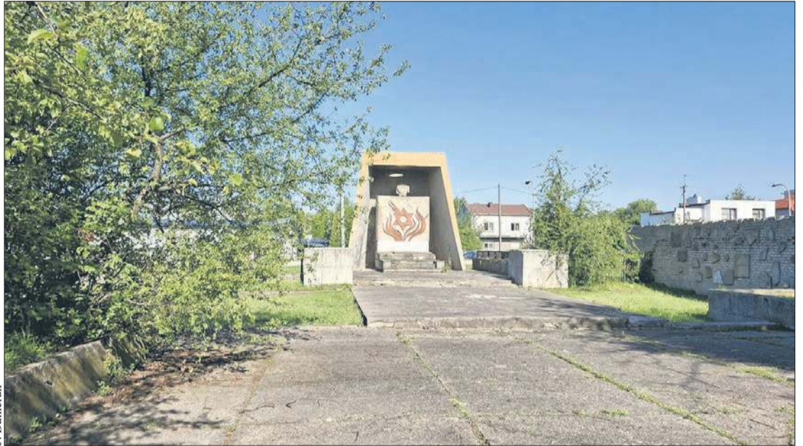
Cmentarz Żydowski przy ul. Mickiewicza

ORLEN instaluje kolejne morskie turbiny wiatrowe