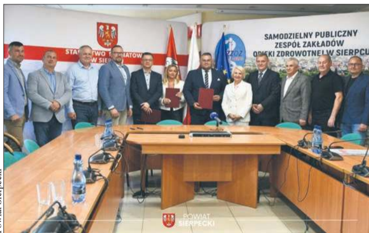
Podpisanie dokumentów dotyczących rozbudowy ZOL odbyło się w siedzibie Starostwa Powiatowego w Sierpcu

Na stronie gminy można zobaczyć galerię zdjęć przedstawiającą Samorządowe Przedzskole w Łącku po zakończeniu remontu elewacji. Po przerwie wakacyjnej placówka powita dzieci odświeżonym wyglądem.