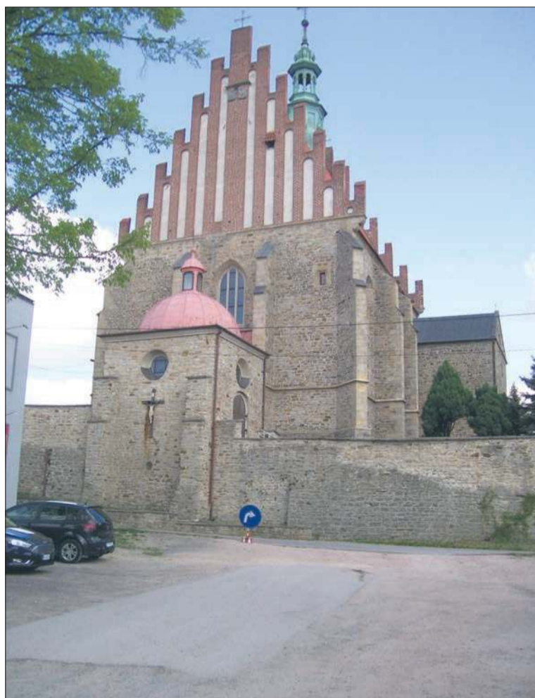
Kościół pw. św. Zygmunta w południowej pierzei Rynku Wielkiego