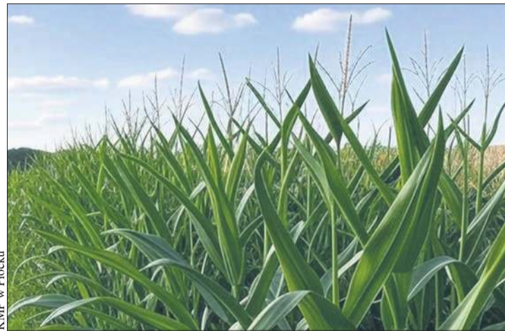
KMP w Płocku

– Mężczyzna usłyszał zarzut i przyznał się do winy, tłumacząc swoje zachowanie alkoholem. Za fałszywe zawiadomienie o przestęp-