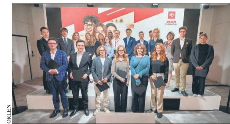
Startuje nowa inicjatywa Bona Fide

Społeczność Alumnów zaoferuje stypendystom dwie ścieżki współpracy – mentorską i ambasadorską. Pierwsza z nich zapewni wsparcie młodszymi koleżankom i kolegom. Absolwenci będą dzielić się wiedzą o wyborze kie-