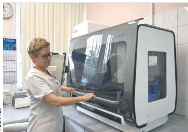
Sprzęt do wykrywania genotypów wysokoonkogenego wirusa HPV metodą polimerazy łańcuchowej w czasie rzeczywistym w Zakładzie Patomorfologii WSZ w Płocku

W przypadku dodatniego wyniku testu szpital wojewódzki robi cytologię na podłożu płynnym (z tej samej próbki materiału pobranej do testu HPV HR). Pacjentka mająca dodatni wynik cytologii kierowana jest do etapu eksperckiego i jest w tzw. monitoringu onkologicznym.