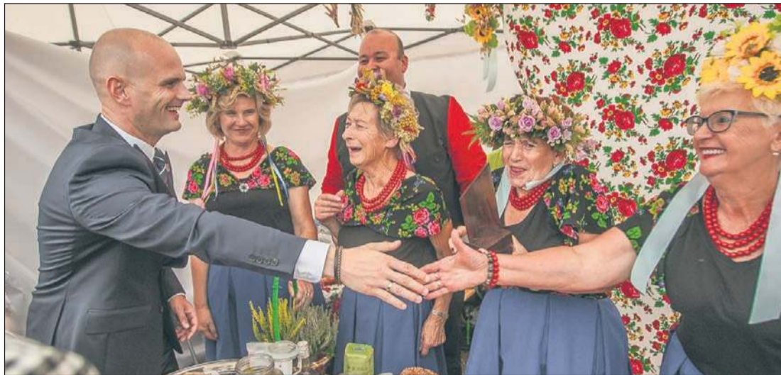
Jarmark Kół Gospodyń Wiejskich promuje zarówno dziedzictwo kulturowe, jak i rolnictwo regionu płockiego

Tak jak przed rokiem Jarmark Kół Gospodyń Wiejskich będzie towarzyszył dożynkom powiatowym. Obie imprezy odbędą się w niedzielę, 7 września w Brudzeniu Dużym. Tak jak do tej pory partnerem jarmarku będzie Samorząd Województwa Mazowieckiego.