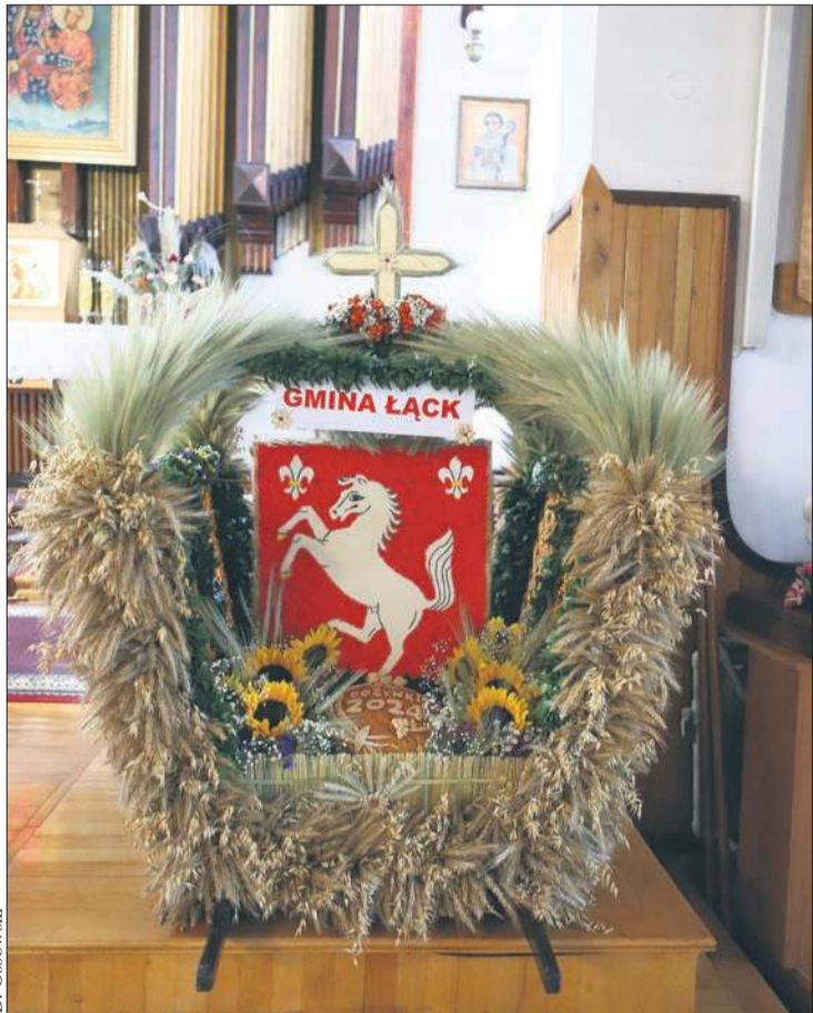
Konkurs na „Najładniejszy wieniec dożynkowy” będzie cześcią tegorocznych uroczystości dożynkowych