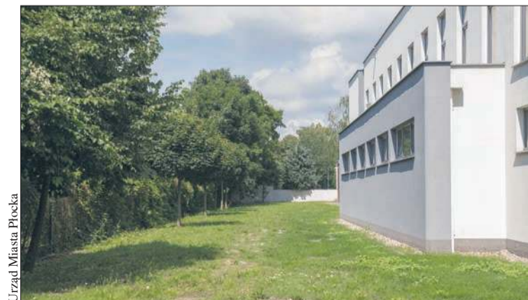
To tu powstanie bieżnia przy Zespole Szkół Technicznych