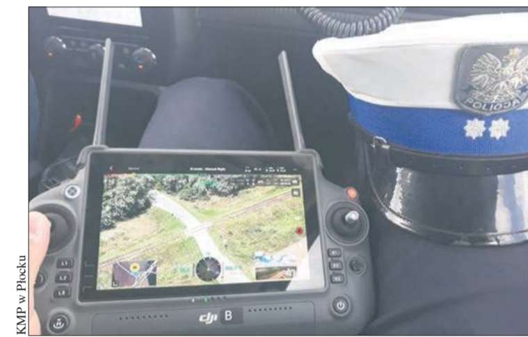
Działania sierpeckiej drogówki na terenie pow. sierpeckiego z użyciem drona

– Czterech kierowców zostało ukaranych mandatami karnymi w kwocie 300 złotych oraz otrzymało po 8 punk-