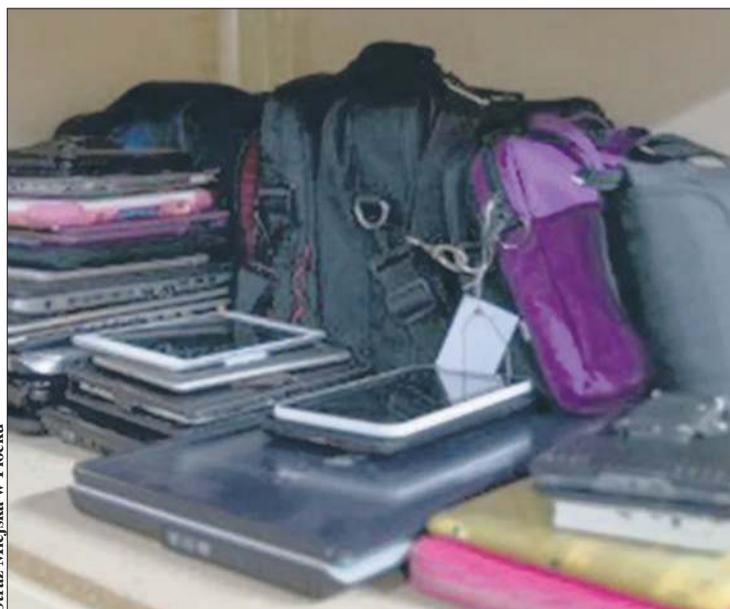
Straż Miejska w Płocku