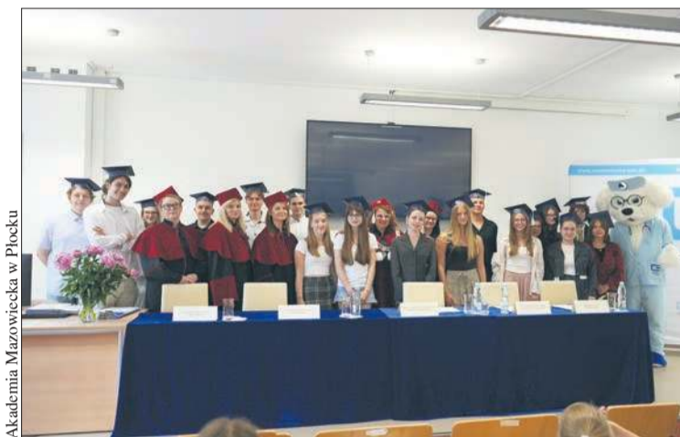
Uczestnicy projektu podczas uroczystego Dyplomatorium Absolwentów

Na realizację projektu uczelnia otrzymała ze środków budżetu państwa, przyznanych przez Ministra Nauki dofinansowanie w kwocie 134 080 zł. Całkowita wartość realizowanego projektu wyniosła 159 080 zł. – Głównym celem projektu „Nauka dla zdrowia od Juniora do Seniora” jest oparta na dowodach naukowych międzypokoleniowa integracja dydaktyczno-zdrowotna, poprzez kształtowanie zachowań prozdrowotnych oraz kreowanie postaw współodpowiedzialności za zdrowie młodszych i starszych pokoleń – informuje uczelnia.