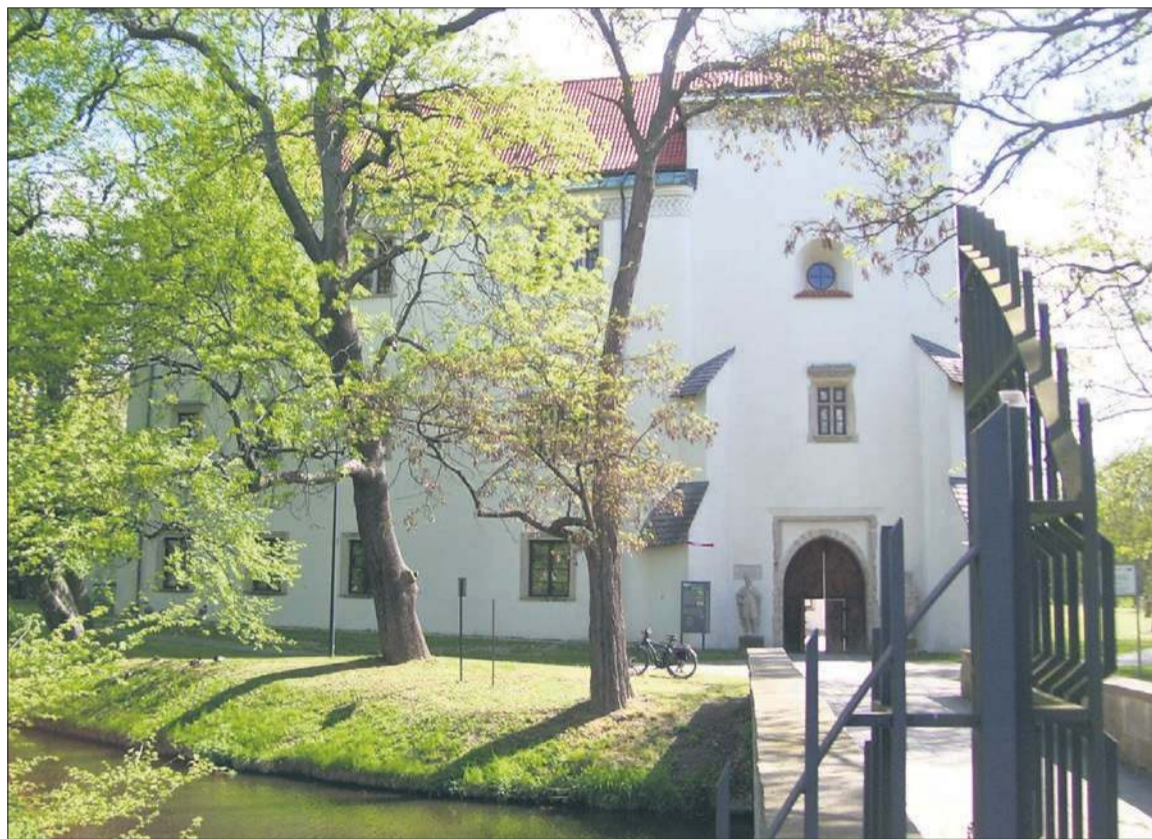
Zamek Szydłowieckich i Radziwiłłów w Szydłowcu

Rynek, dawniej nazywany też Rynkiem Polskim, wytyczony zo-