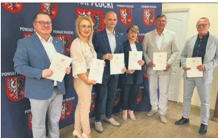
Samorząd powiatu płockiego podpisał umowy na wybudowanie kolejnych dróg