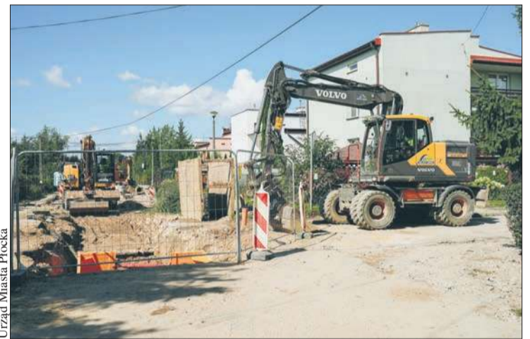
Urząd Miasta Płocka