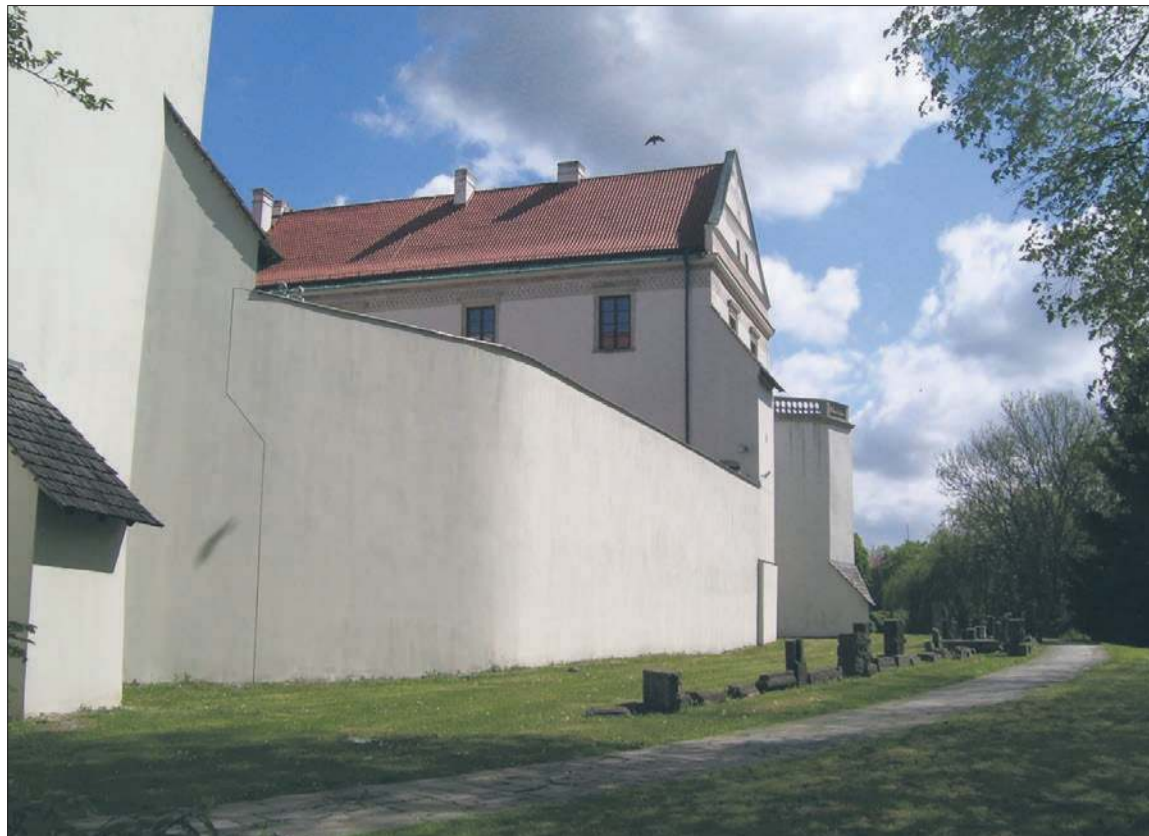
Szydłowiecki zamek od strony zachodniej