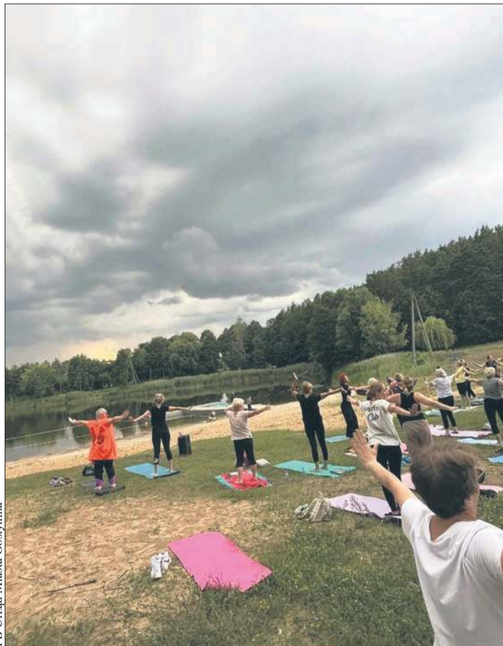
FB Urząd Miasta Gostynina

Deszczowe chmury nie przeszkodziły uczestnikom „Poniedziałkowej OdNowy”