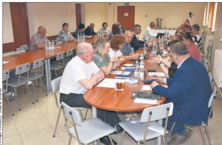
Podczas lipcowej sesji radni gminy Stara Biała podjęli decyzje o zmianach w budżecie

Ochrona ludności i obrona cywilna na Mazowszu