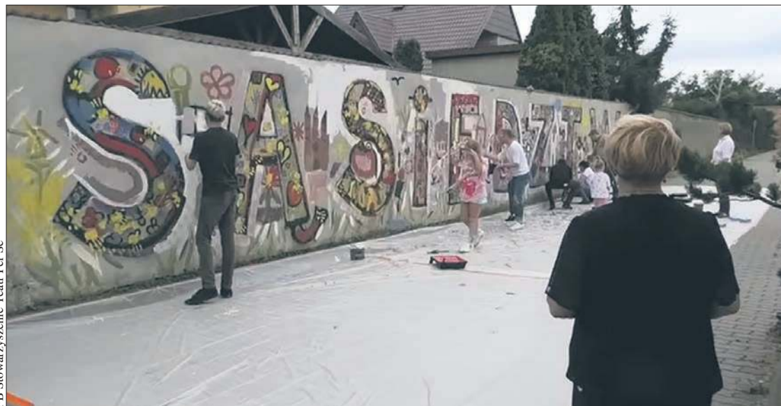
Kolorowy mural powstał przy Szkole Podstawowej nr 20