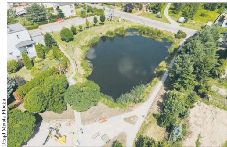
Trwa modernizacja skweru rekreacyjnego przy ul. Parkowej