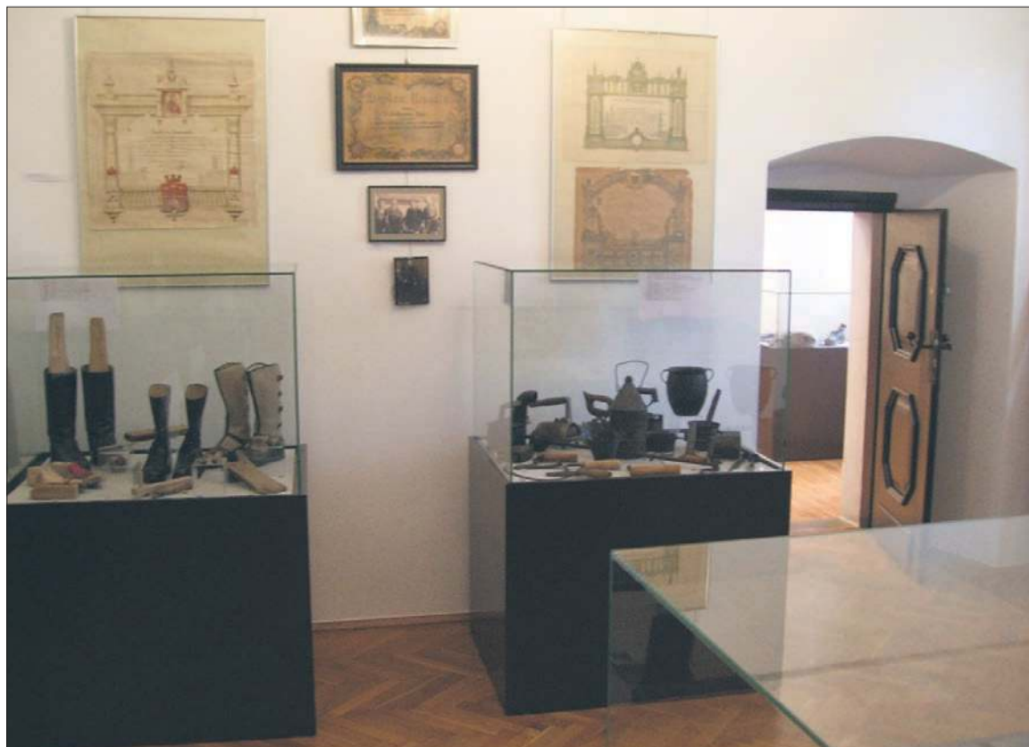
Pracownia Historii Szydłowca – muzeum historii miasta