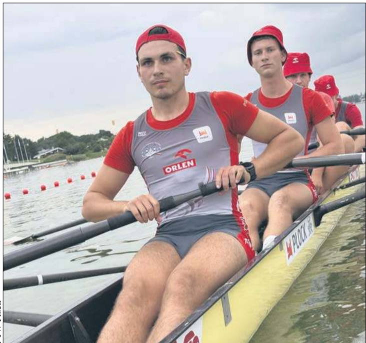
Srebrna czwórka bez sternika