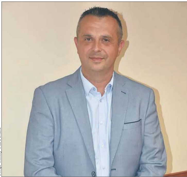
Urząd Gminy Stara Biała