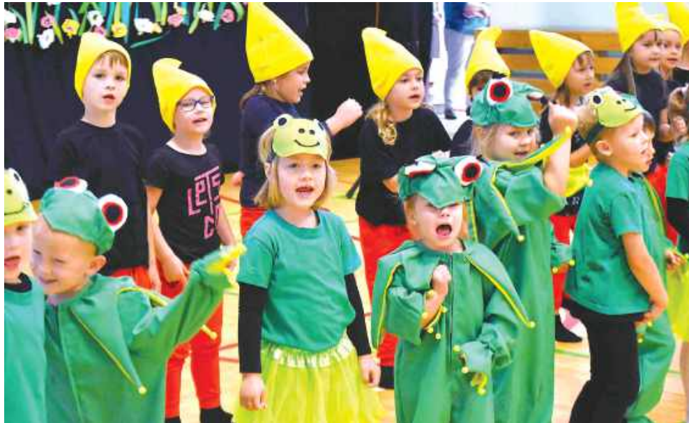
■ Przedszkole nie jest samodzielną placówką, a wchodzi w skład Szkoły Podstawowej w Krostoszowicach

W trakcie uroczystości, przekazując dyrektor placówki symboliczny klucz, wójt przypomniał o okolicznościach, które doprowadziły do budowy obiektu. O tym, że nie byłoby tego obiektu, gdyby nie dobra wola sąsiada szkoły, który zgodził się na sprzedaż swojej działki. Ta najpierw była wykorzystywana na plac zabaw, później również na parking, a ostatecznie po-