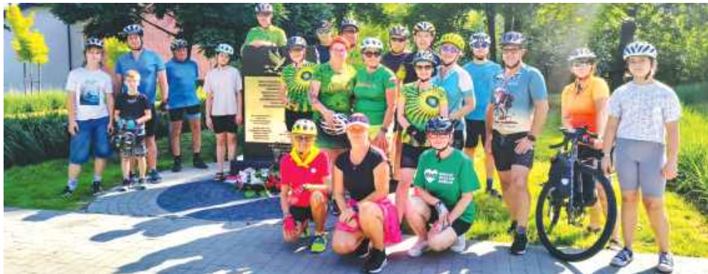
■ Dziesiąta edycja „Biegu dookoła Radlina” odbyła się 15 czerwca

Na mecie każdy uczestnik otrzymał ręcznie wykonany medal. Na trasie znajdował się punkt odżywczy przy „kapliczce” na posesji Państwa Rek, który od lat jest stałym elementem imprezy. W tegorocznej edycji wzięło udział 90 osób. Organizatorem 10 BdR2025 jest nieformalna grupa Radlinioki w biegu.