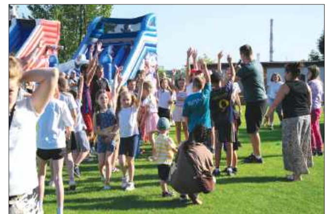
■ Wydarzenie, współorganizowane m.in. przez Radę Dzielnicy Wilchwy oraz lokalne szkoły, odbyło się 14 czerwca.