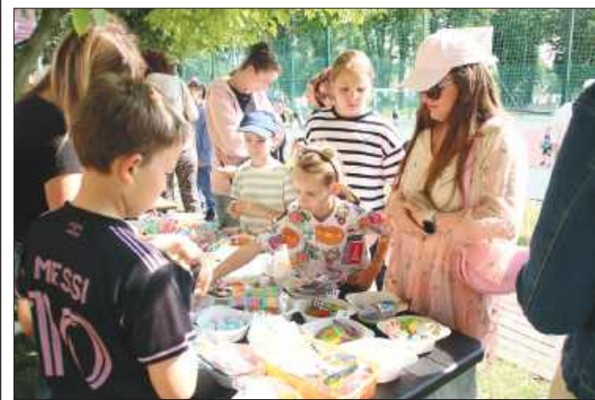
Podczas festynu przygotowano wiele atrakcji