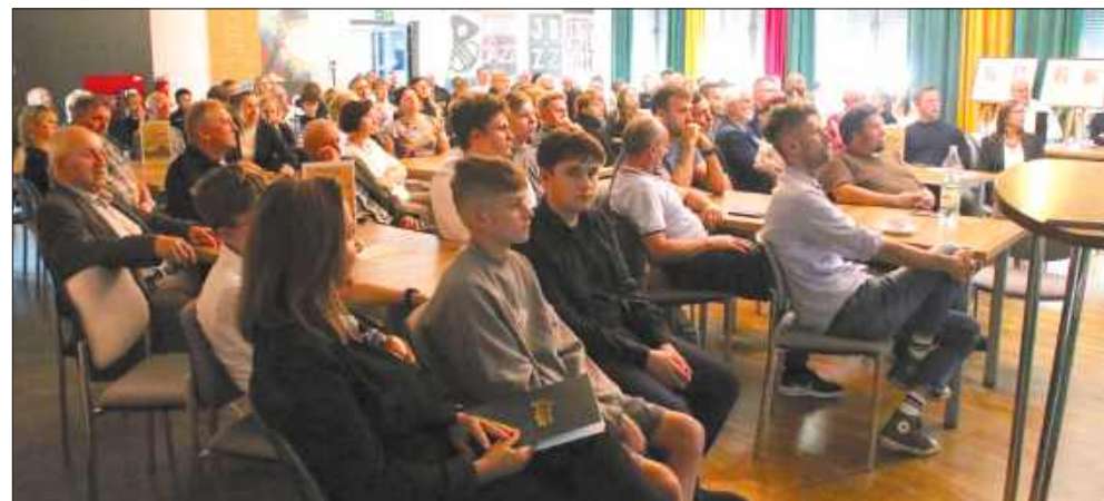
■ Konferencja w GCK przyciągnęła wielu pasjonatów historii, a także młodzież.