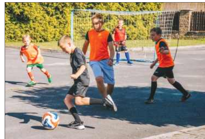
■ Zacięta rywalizacja sportowa