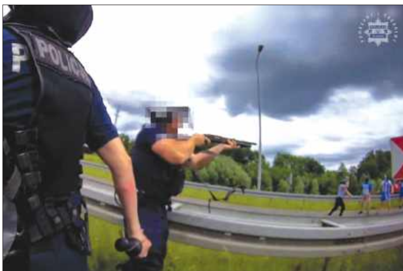
■ Policjanci OPP w Katowicach, pełniący służbę w ramach zabezpieczenia przejazdu kibiców, zapobiegli eskalacji poważnego zagrożenia bezpieczeństwa publicznego.

MSZANA Na A1 doszło do niebezpiecznej sytuacji. Kibice Ruchu Chorzów zablokowali przejazd autokarów, którymi podróżowali kibice GKS-u Jastrzębie. Do konfrontacji nie doszło dzięki zdecydowanej reakcji policji.