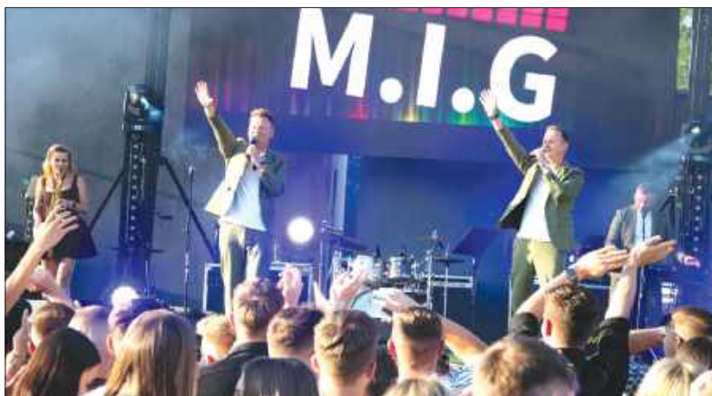
■ Kiedy na scenie pojawił się zespół MIG, przed sceną zrobiło się bardzo tłoczno