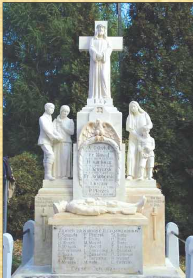
■ Pomnik powstańców w Markłowicach