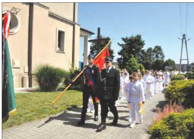
■ Wierni oraz poczty sztandarowe wzięli udział w jubileuszowej procesji