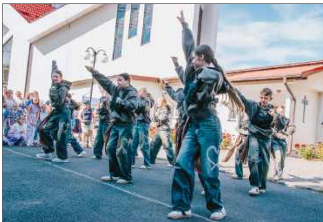
■ Widowiskowe pokazy grup tanecznych