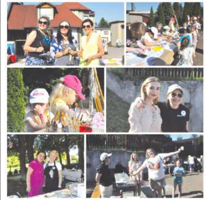
■ Dzień otwarty odbył w siedzibie stowarzyszenia przy ulicy Pszowskiej. (d)