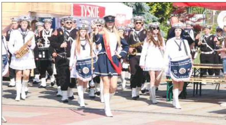
■ Świętowanie rozpoczęło się występem młodzieżowej orkiestry dętej