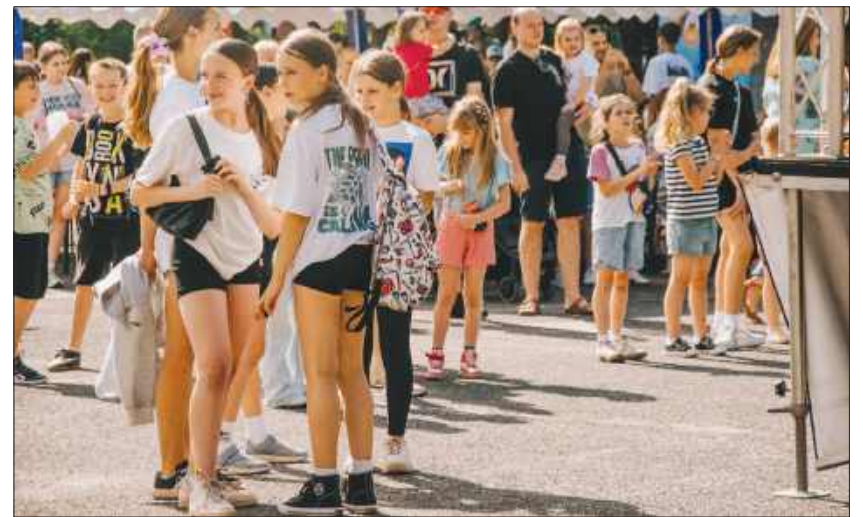
■ Dzięki ciekawym atrakcjom i pogodzie, jak z bajki, w wydarzeniu uczestniczyły tłumy mieszkańców