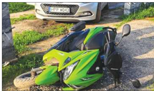
■ Policjanci przypominają, że nietrzeźwi uczestnicy ruchu drogowego stanowią realne zagrożenie na drodze, nie tylko dla siebie, ale również dla innych.