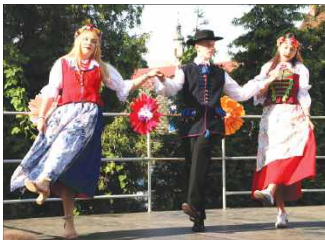
■ Podczas festynu zaprezentowano m.in. pokazy taneczne i występy muzyczne.