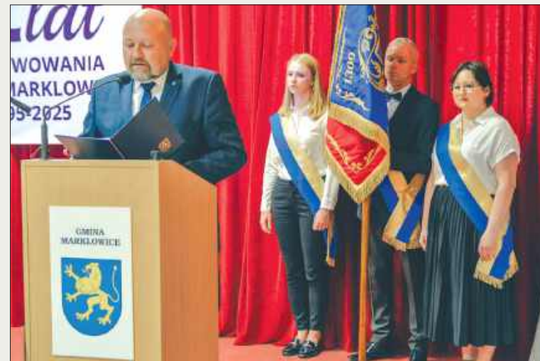
■ Podczas uroczystości 30-lecia gminy uhonorowano zasłużonych dla gminy oraz przyznano tytuł Honorowego Obywatela Gminy Marklowice

W piątek, 13 czerwca 2025 roku, w podniosłej i serdecznej atmosferze odbyły się uroczyste obchody 30-lecia reaktywowania Gminy Marklowice – wydarzenie, które zgromadziło licznych mieszkańców, gości honorowych i przyjaciół gminy.