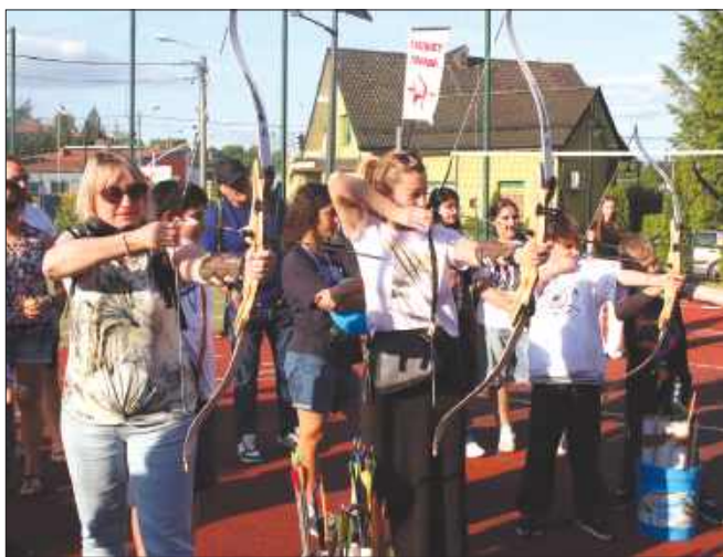
■ Była to również okazja do strzelania z łuku.