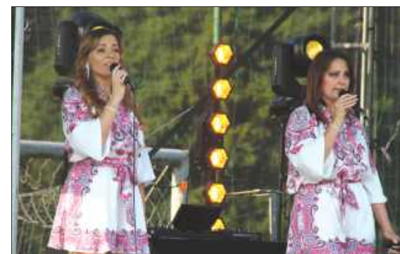
■ Duet Kobiety na Walizkach zabrał słuchaczy w muzyczną podróż