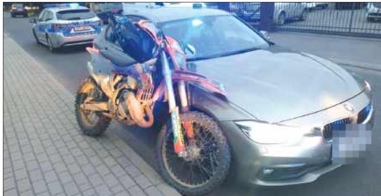
■ Motocykl prowadził 15-letni mieszkaniec powiatu wodzisławskiego, bez uprawnień

– Mundurowi wydali sygnały świetlne i dźwiękowe do zatrzymania tego pojazdu. Wówczas pasażer spojrzął za siebie, a kierujący dynamicznie przyspieszył i rozpoczął ucieczkę, ignorując sygnały policjantów do zatrzymania się – relacjonuje przebieg zdarzeń oficer prasowa wodzisławskiej komendy, asp. sztab. Małgorzata Koniarska.