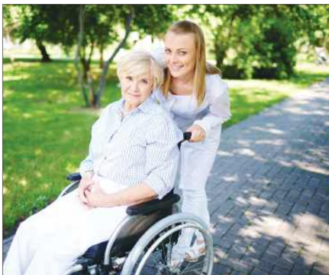
■ Część środków zostanie przeznaczona na szkolenia, np. opiekunów osób starszych.

POWIAT Blisko milion złotych trafi do mieszkańców powiatu wodzisławskiego w ramach programów wspierających zatrudnienie. Urząd Pracy będzie m.in. finansował staże, szkolenia i zakładanie działalności gospodarczej.