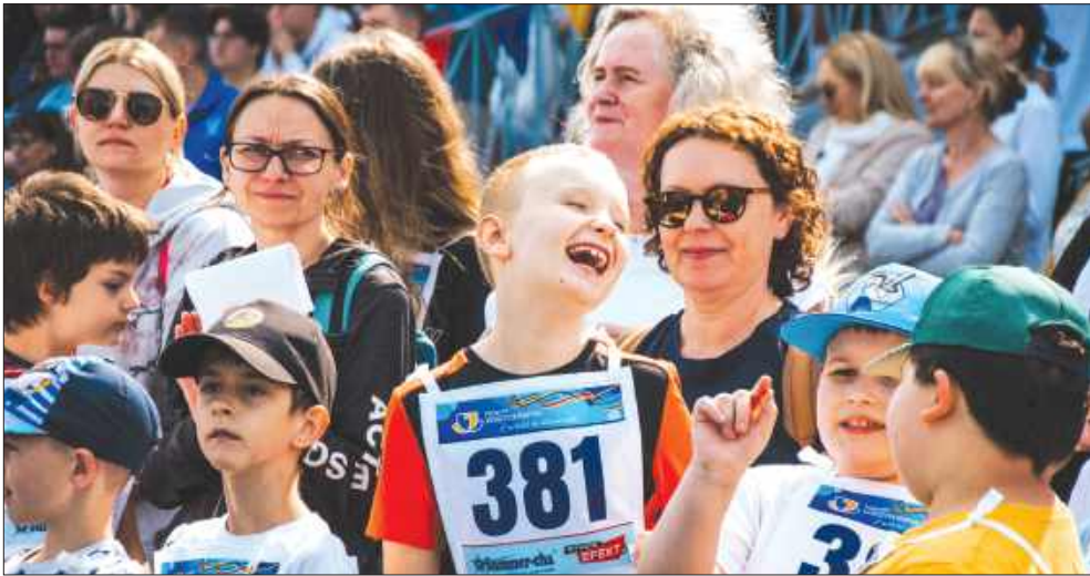
■ XXI Powiatowa Olimpiada dla Osób z Niepełnosprawnościami im. Tadeusza Skatuły odbyła się we wtorek 10 czerwca