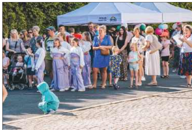
■ Parafianie chętnie przyszli na festyn, a dzięki wymśnieniej pogodzie zabawa trwała do późna

drobne przekąski zniknęły w mgnieniu oka, tworząc idealne tło do sąsiedzkich rozmów i wspólnego świętowania. Nie zabrakło również występów na żywo. AgaKa