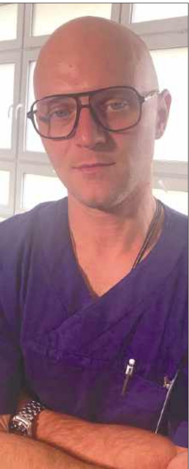
...m Nr 3, przewiduje, że po bniku

i onkologicznym w sumie pracuje 45 położnych, po dwie na zmianę. Rozmawiam z kolejną – ma 25 lat stażu, na oddziale widziała wszystko, tłumaczy mi zdecydowanym głosem: "Proszę pana, u nas zawsze muszą być dwie na położniczym, dwie na ginekologii, i po dwie na porodówce i patologii ciąży. My tutaj dwunastki mamy i naprawdę się nie nudzimy".