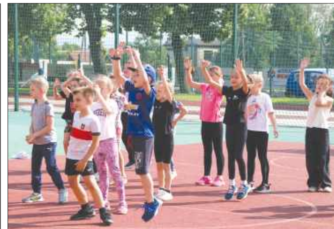
Sporym zainteresowaniem dzieci cieszyła się gra w zbijaka. Była to jedna z wielu festynowych atrakcji.