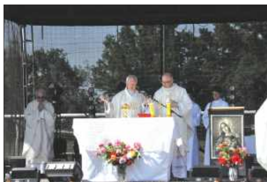
■ Uroczystości rozpoczęły się połową mszą świętą