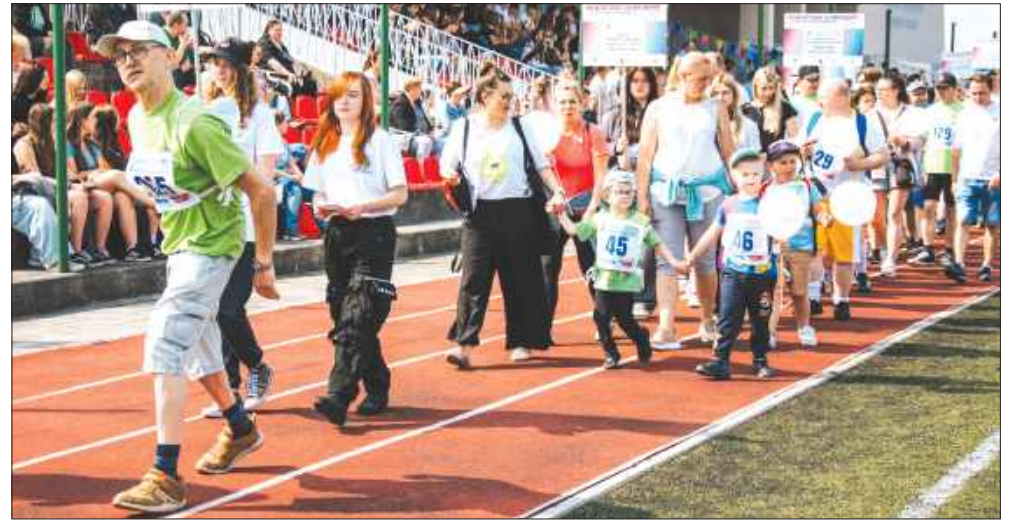
■ W olimpiadzie udział wzięli zawodnicy z 29 ośrodków