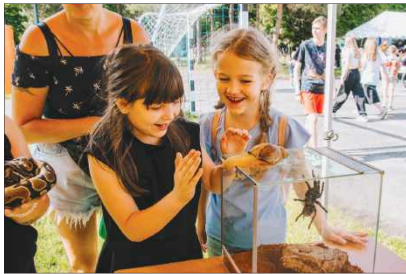
■ Dużym zainteresowaniem cieszyła się strefa zwierząt