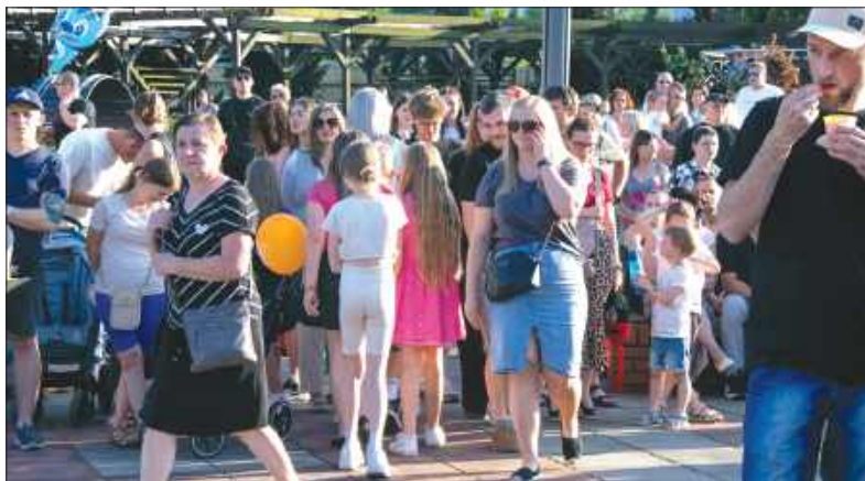
■ Koncertowy wieczór przyciągnął tłumy fanów disco polo oraz zespołu Maanam