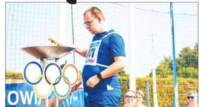
■ Wydarzenie zostało objęte honorowym patronatem Polskiego Komitetu Paraliimpijskiego

XXI Olimpiada w Wodzisławiu to nie tylko sportowa rywalizacja, ale przede wszystkim symbol integracji, równości i przełamania barier. Wydarzenie