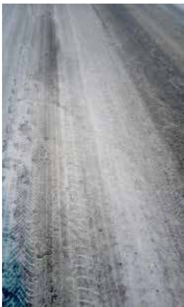
Tak wyglądała droga, na której doszło do wypadku

Do tragicznego w skutkach wypadku doszło w piątek, 30 stycznia, kilka minut przed godziną 10:00 na drodze pomiędzy Bagnami a Dębicami. Jadąca tą drogą samochód osoby wypadł z niej i uderzył w rosnące na poboczu drzewo. Po przybyciu na miejsce służb ratunkowych natychmiast podjęto akcję. Polegała ona na zabezpieczeniu miejsca zdarzenia,