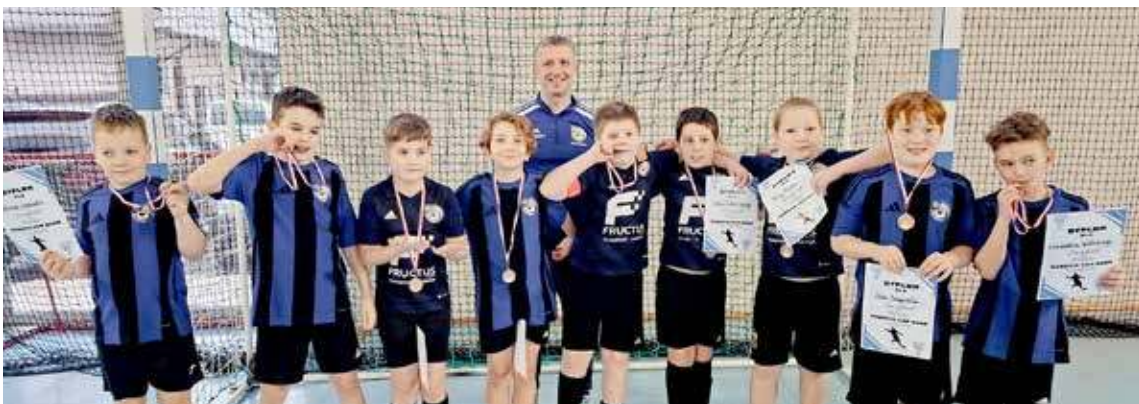
Młodzi piłkarze Hanzy Goleniów

i dobra zabawa. Po turnieju każdy piłkarz otrzymał pamiątkowy dyplom, a na szyi zawisł pamiątkowy medal. DJ