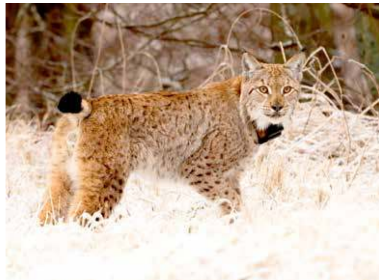
Ryś Lolek trafił do Puszczy Goleniowskiej