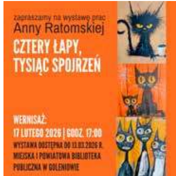
Wystawa o kotach