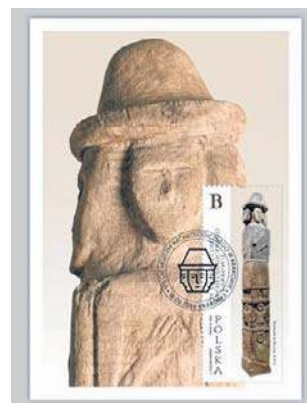
Światowid ze Zbrucza trafił na znaczki pocztowe

Światowid znalazł się na pierwszej Wystawie Starożytności i od tego momentu stanowi