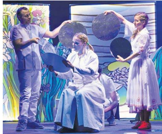
Witraże Stanisława Wyspiańskiego na scenie dla najmłodszych

- Wyzwaniem było, jak pogodzić małego odbiorcę z wielkim artystą, a spektakl kierujemy