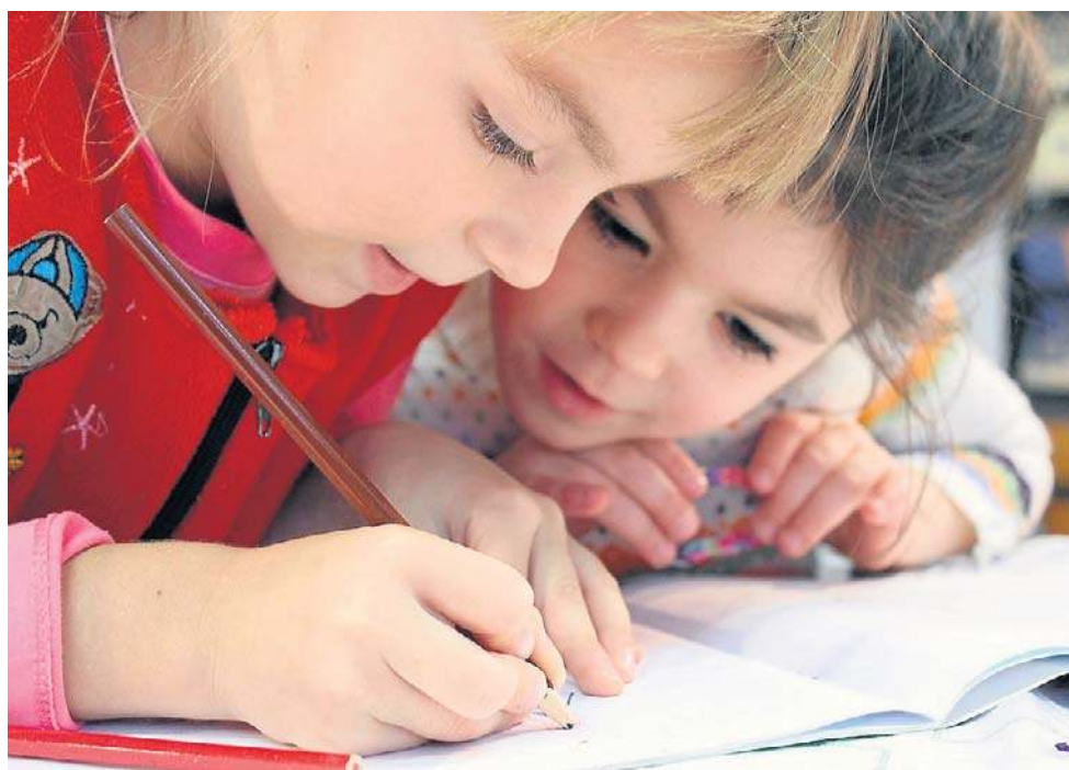
Coraz mniej dzieci. Na forach samorządowców wręcz mówi się o zapaści demograficznej

Rodzice dzieci z SP 104 domagają się więc wstrzymania procesu łączenia szkół, a magistrat tłumaczy, że miasto podejmuje działania zmierzające do znalezienia nowej, docelowej lokalizacji dla XXI LO. „Obecnie miasto