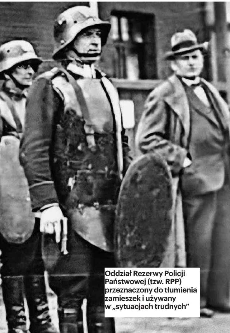
Oddział Rezerwy Policji Państwowej (tzw. RPP) przeznaczony do tłumienia zamieszek i używany w „sytuacjach trudnych”

znaczoną do zwalczania zamieszek i demonstracji ulicznych była Rezerwa Policji Państwowej (RPP). Pierwsze jednostki rezerwy powstały w 1923 roku po masowych wystąpieniach robotników, m.in. po zamieszkach krakowskich 1923 r.