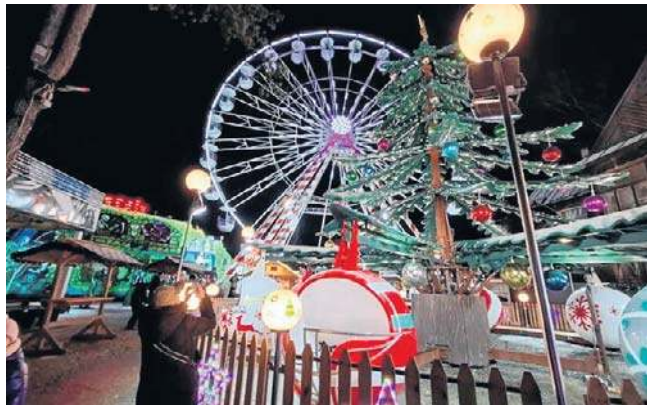
Lunapark i koło młyńskie wpisują się w szerszy obraz zmian nastawionych na oczekiwania turystów

Gdy zwinęła się, lunapark został tylko jeden - na działce między ul. Zaruskiego i Ogrodową. Dla biznesu to miejsce idealne - z Krupówek doskonale je widać, zwłaszcza po zmroku, gdy koło młyńskie miga, błyszczy i zachęca. Kto tam nie dociera, robi sobie zdjęcie na Krupówkach z kołem młyńskim w tle. A jak ktoś już tam dotrze, znajdzie różne atrakcje rodem z cyrku - łącznie ze strzelnicą. A nawet karu-