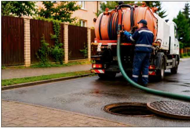
Do niemodlińskiej kanalizacji trafiają odpady, które powodują kosztowne awarie sieci.

Jak podkreśla NPGK, do kanalizacji wciąż trafiają odpady, które nigdy nie powinny się tam znaleźć. Chodzi między innymi o pieluchy, podpa-