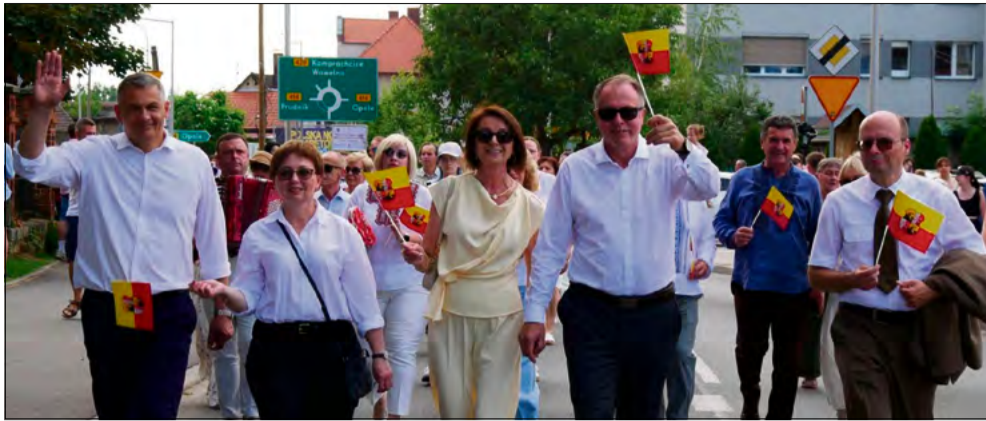
W paradzie wzięli udział przedstawiciele m.in. władz gminy, Sejmu, województwa opolskiego czy ukraińskiego miasta partnerskiego Wyhoda.

Prószkowska Parada Orkiestr Dętych na stałe wpisała się w kalendarz najważniejszych wydarzeń kulturalnych Opolszczyzny. W tym roku zorganizowano już 16. odsłonę wydarzenia. Za przygotowanie