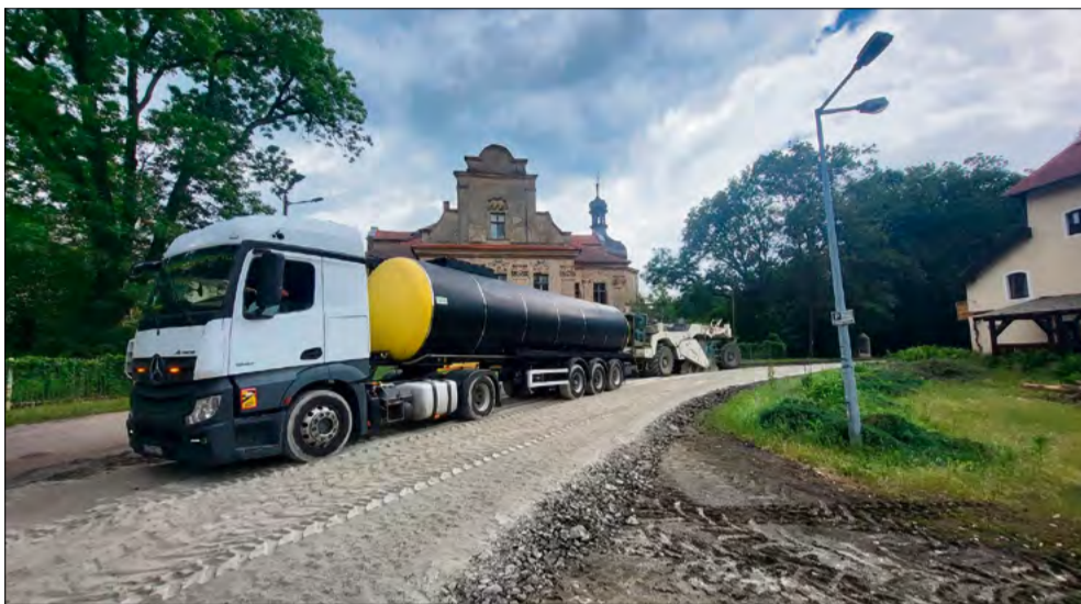
Remontowany odcinek ul. Kościuszki w Turawie ma zyskać nową nawierzchnię i służyć kierowcom przez kolejne lata.