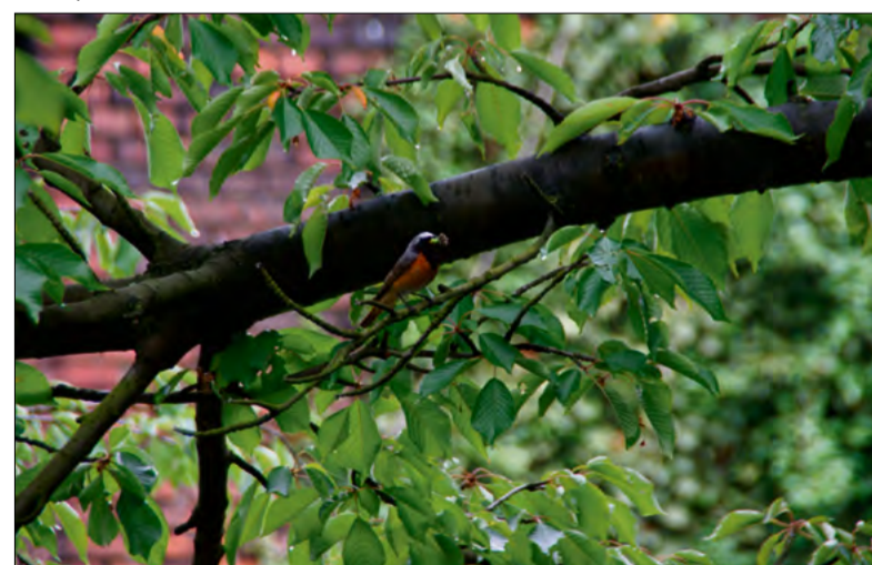
Pleszka zwyczajna to jeden z gatunków ptaków, które można spotkać również w miejskich parkach i ogrodach.

Zmiany klimatyczne wpływają na fizjologię, zachowanie i dobrostan zwierząt, a w skrajnych przypadkach decydują o przetrwaniu całych gatunków. Naukowcy wskazują, że w XXI wieku mogą stać się jednym z