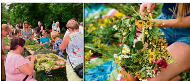
Podczas Nocy Świętojańskiej odbyły się warsztaty z plecienia wianków.