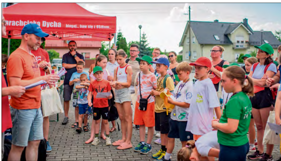
Gminny Ośrodek Pomocy Społecznej zaangażował się w organizację gry terenowej w Komprachcicach.

Ośrodek realizował również szeroki zakres usług niematerialnych, w tym poradnictwo specjalistyczne, wsparcie psychologiczne, usługi opiekuńcze oraz dzia-