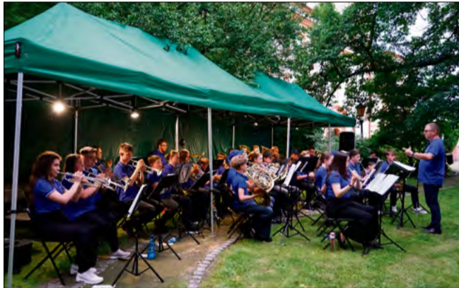
Występy orkiestr dętych oglądano na dwóch scenach.

Ostatni dzień wydarzenia, 21 czerwca, miał charakter rodzinny i rekreacyjny. Rozpoczął się od programu „Kolorowe Wakacje”, przygotowany specjalnie dla dzieci i rodzin. W programie znalazły się m.in. animacje, bitwa