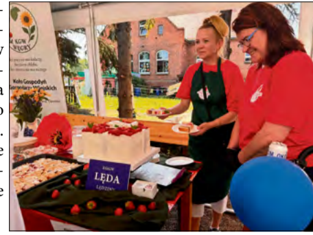
Podczas imprezy nie zabrakło słodkich truskawkowych przysmaków – ciast, deserów i domowych przetworów.

Już od godziny 14 na terenie zielonym przy świetlicy w Lędzinach czekało mnóstwo atrakcji dla całych rodzin. Najmłodszy rozpoczął świętowanie od Balu Owoco-