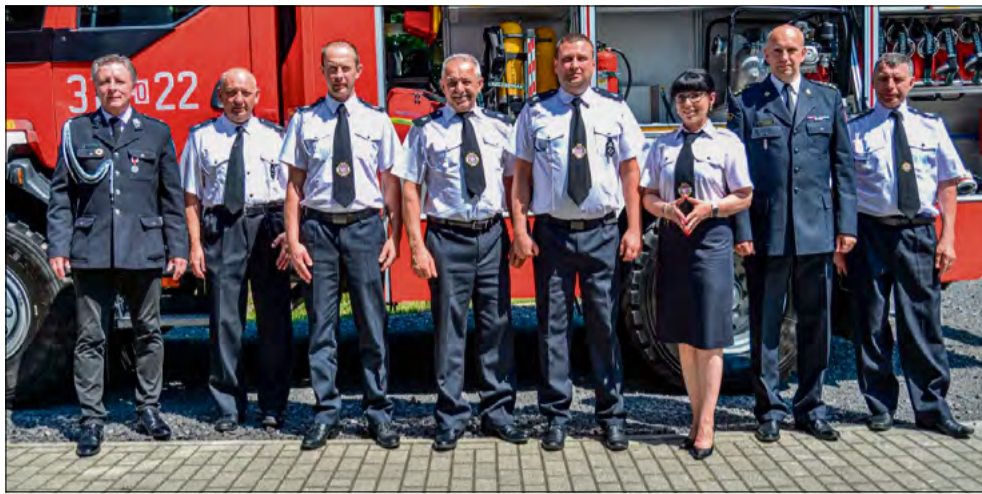
Podczas zjazdu podpisano umowę użyczenia samochodu, który został przekazany z jednostki OSP Chróścina do OSP Żelazna.

Podczas zjazdu przeprowadzono również wybory władz Oddziału Gminnego ZOSP RP na kadencję 2026–2031. W wyniku przeprowadzonych wyborów wyłoniono nowy skład zarządu oddziału gminnego ZOSP RP. Na kolejną kadencję prezesem ponownie została wybrana wójt