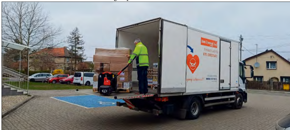
W ramach pomocy żywnościowej wydano około 6 ton żywności oraz przygotowano 67 paczek żywnościowych.

Małgorzata Łyczak, Fot. (OSiR w Komprachcicach)