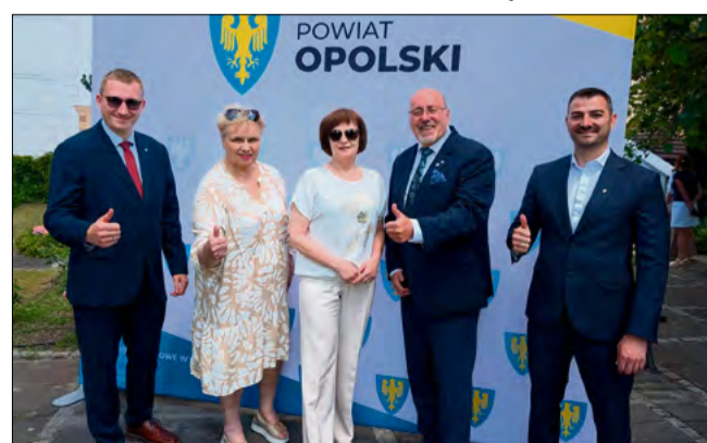
Zarząd Powiatu na czele ze starostą Henrykiem Lakwą otrzymał wotum zaufania i absolutorium za 2025 rok.

Starosta opolski Henryk Lakwa podkreśla, że sukcesy samorządu są efektem pracy wielu osób i dobrej współpracy na różnych szczeblach.