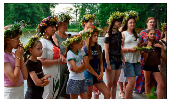
Puszczanie wianków i słowiańskie rytuały nad stawem w Parku Dworskim w Chróście.

Wydarzenie miało na celu pielęgnację tradycji Nocy Świętojańskiej oraz integrację mieszkańców. Uczestnicy podkreślali, że