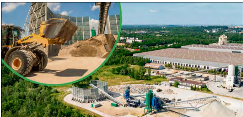
Recycled Cement Paste (RCP), czyli odzyskany zaczyn cementowy, trafia do Cementowni Góraźdze.

W zakładzie w Dąbrowie Górniczej Heidelberg Materials Polska przetwarza odpady rozbiórkowe na materiały budowlane. Dzięki technologii ReConcrete z betonowego złomu powstają kruszywa, piasek oraz odzyskany zaczyn cementowy, który trafia do produkcji niskoemisyjnego cementu.