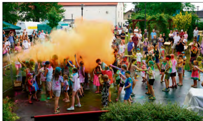
Najmłodszym uczestnikom spодobała się zabawa z pianą i kolorowymi proszkami.

Małgorzata Łyczak, Fot. Małgorzata Łyczak