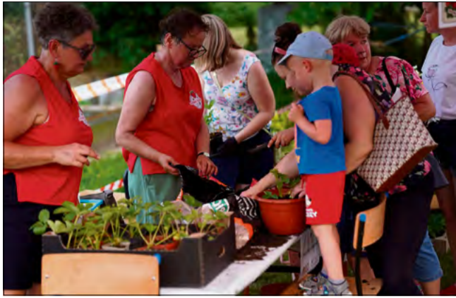
Warsztaty ogrodnicze z truskawką w roli głównej cieszyły się dużym zainteresowaniem najmłodszych uczestników festiwalu.

Pomysł organizacji festiwalu zrodził się w Kole Gospodyń