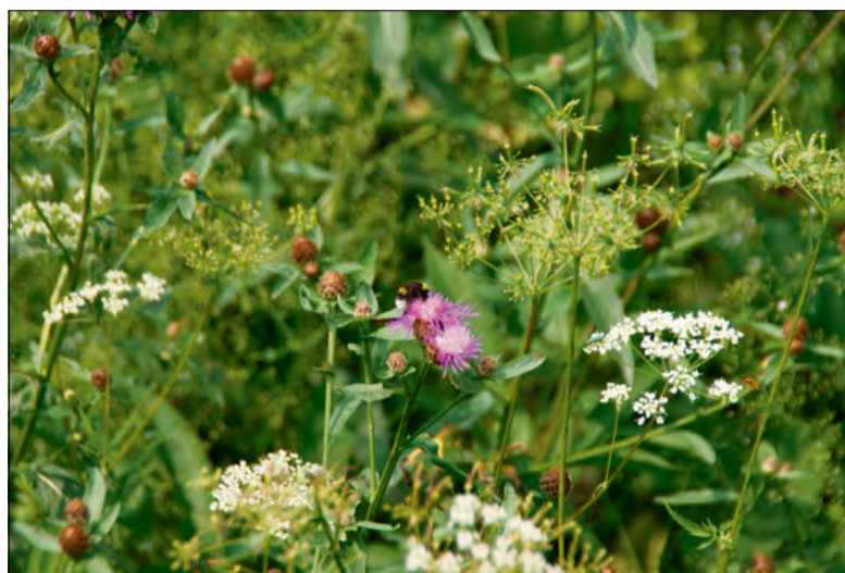
Dzikie zapylacze są szczególnie narażone na skutki suszy i wysokich temperatur.

Skutki przegrzania mogą być bardzo poważne – od osłabienia organizmu i spadku zdolności rozrodczych po niewydolność narządów, a nawet śmierć. Dlatego dostęp do wody, schronienia i zacienionych miejsc ma kluczowe znaczenie dla przetrwania wielu gatunków podczas letnich fal upałów.