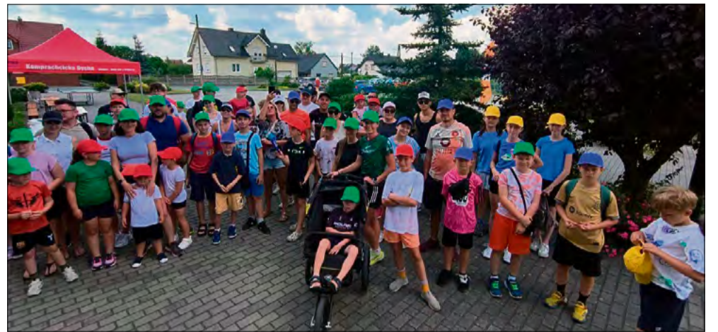
Grę terenową ukończyły 22 drużyny.

W minioną niedzielę w Komprachcicach odbyła się gra terenowa, która po raz drugi zgromadziła mieszkańców gminy i okolic. Wydarzenie miało charakter edukacyjno-rekreacyjny i pozwalało uczestnikom nie tylko aktywnie spędzić czas, ale także poznać historię miejscowości, ważne postacie związane z regionem oraz miejsca, które kształtowały jego przeszłość i współczesność.