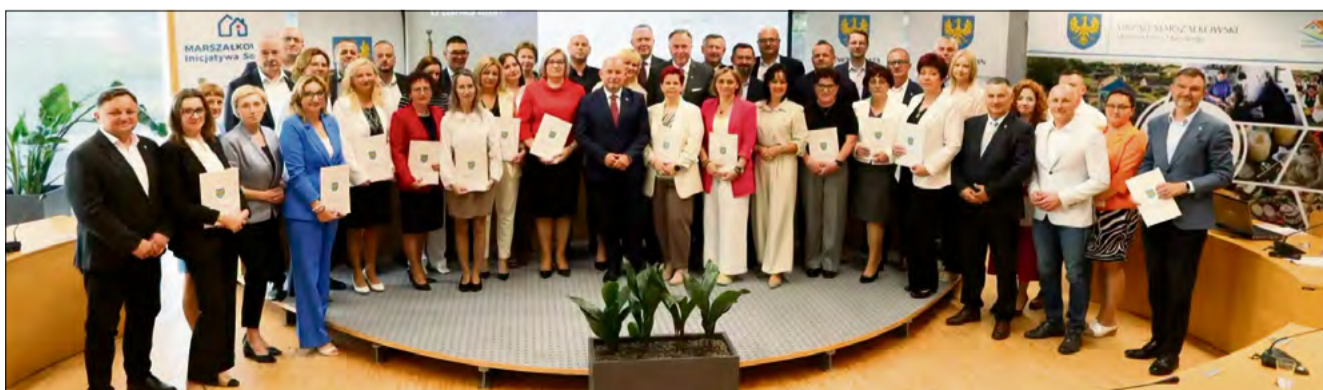
Łączna wartość zaplanowanych do realizacji zadań zamyka się w kwocie niespełna 35 tys. zł

Dzięki pozyskanym środkom wsparcie otrzymają cztery sołectwa: Grodziec, Mnichus, Pustków i Schodnia. W Groźcu zaplanowano wyposażenie kuchni świetlicy wiejskiej oraz zakup parasoli grzewczych. W Mnichusie środki zostaną przeznaczone