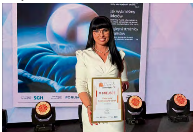
Jak podkreśla wójt gminy Dąbrowa, skuteczność samorządu opiera się m.in. na dobrym planowaniu.

Jak podkreślają przedstawiciele gminy Dąbrowa, wyróżnienie to stanowi ważne potwierdzenie słusznego kierunku rozwoju oraz rzetelnej pracy całego samorządu. Zaznaczają