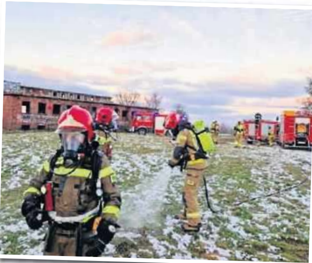
W akcji uczestniczyło wiele jednostek strażackich