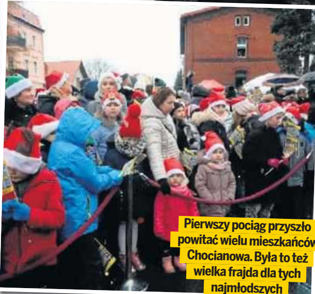
Pierwszy pociąg przyszło powitać wielu mieszkańców Chocianowa. Była to też wielka frajda dla tych najmłodszych

Rewitalizacja tego odcinka w połączeniu z równoległą rewitalizacją linii nr 316 w relacji Chojnów - Rokitki umożliwi ponowne włączenie Chocianowa do sieci regionalnych połączeń kolejowych. Mieszkańcy gminy Chocianów będą mogli dojechać m.in. do Legnicy i Wrocławia.