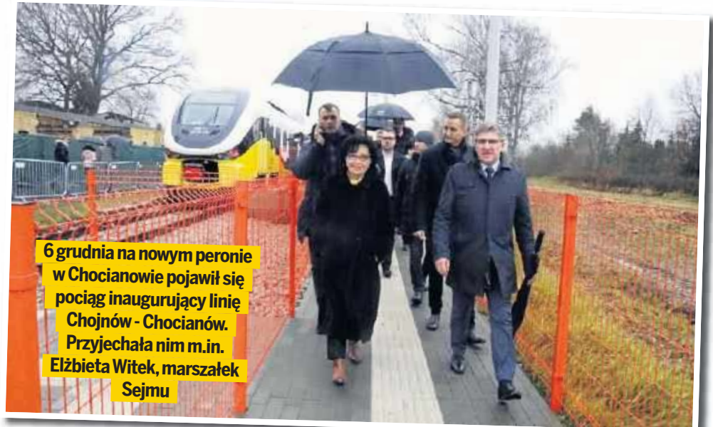
6 grudnia na nowym peronie w Chocianowie pojawił się pociąg inauguracyjny linii Chojnów - Chocianów. Przyjechała nim m.in. Elżbieta Witek, marszałek Sejmu