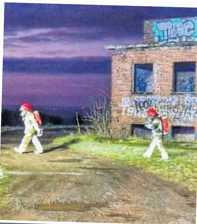
Zawartość pojemników sprawdzą specjaliści z WIOS

W Stanisławowie w powiecie jaworskim trwały działania straży pożarnej. Jak podaje portal Jawor 998, płonęły pojemniki z chemikaliami nieznanego pochodzenia.