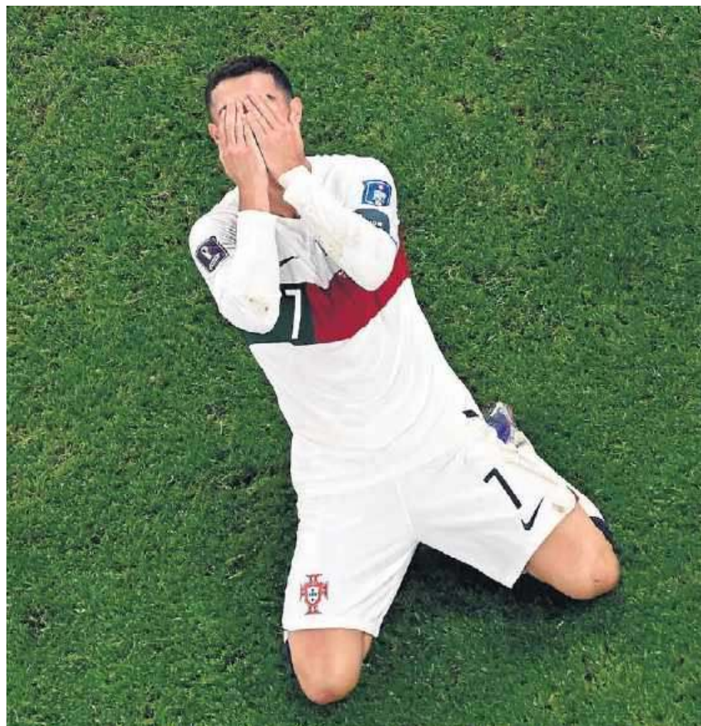
czy Cristiano Ronaldo przejdą do historii piłkarskich mistrzostw świata...

Piłkarstwo Zwycięstwo Maroka nad Portugalią i pierwszy w historii awans drużyny afrykańskiej do czołowej czwórki mundialu to najważniejsze wydarzenie w ćwiećfinalach MŚ