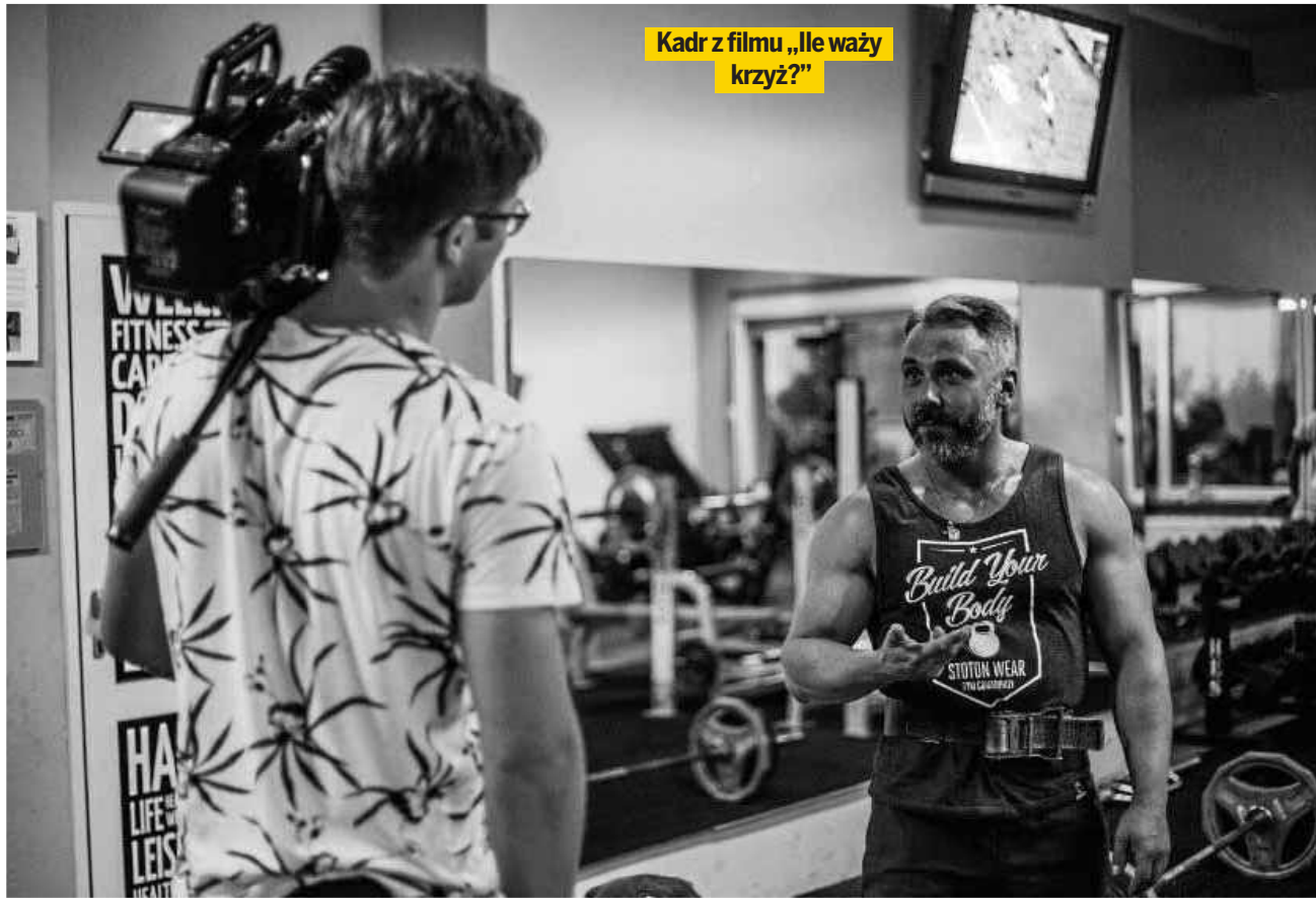
Kadr z filmu „Ile waży krzyż?”