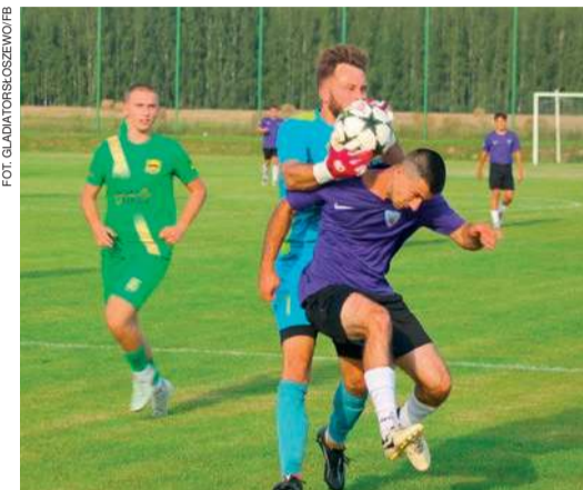
Słoszewianie lepsi na starcie od Ostrovii