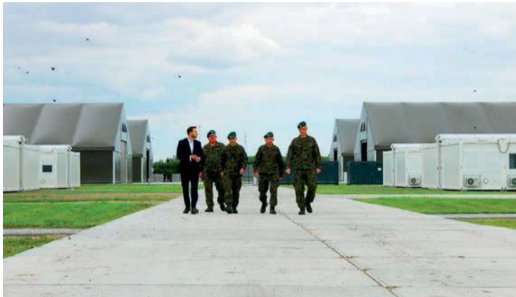
Tymczasowe obozowisko kontenerowe – z kwaterami, sanitariatami, kuchnią i magazynami – jest już gotowe

– Ciechanów to można powiedzieć mózg i serce naszej dywizji, bo tu jest