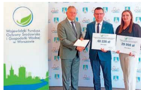
Pieniądze na działania ekologiczne otrzymała m.in. gmina Ojrzeń

– To konkretne wsparcie, które przekłada się na czystsze powietrze, bezpieczniejsze otoczenie i lepszą jakość życia w naszych gminach – podkreślali obecni na podpisaniu umów samorządowcy. erem