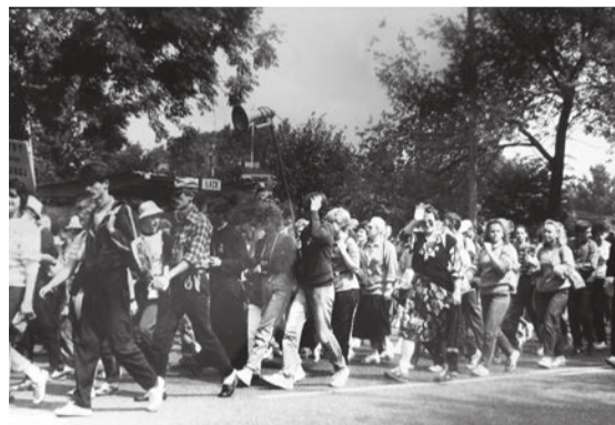
Na pielgrzymim szlaku (Łąck)