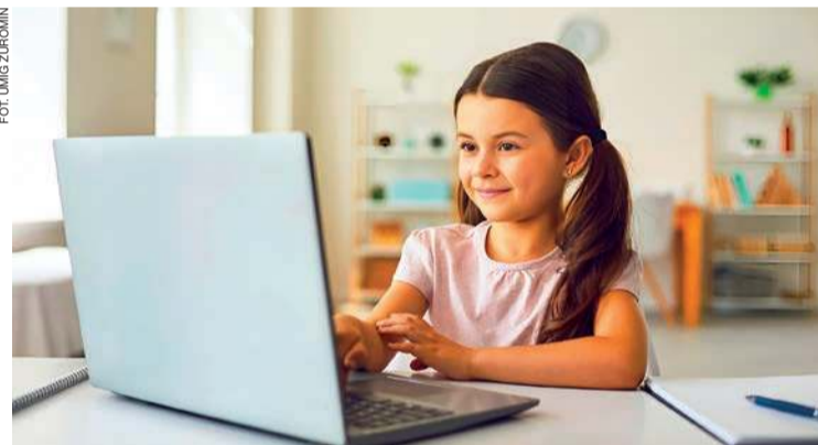
Z projektu skorzysta ponad 600 uczniów szkół podstawowych

Uczniowie i nauczyciele wiejskich szkół w Chamsku, Racynach i Poniatowie będą także mieli bezpłatny dostęp do aplikacji rozwijających różne kompetencje. Będą także zabezpieczone środki finansowe dla nauczycieli za prowadzenie zajęć pozalekcyjnych związanych z poszerzaniem kompetencji przez uczniów. W planie są też wycieczki dla uczniów tychże szkół i warsztaty dla nauczycieli. W.D.