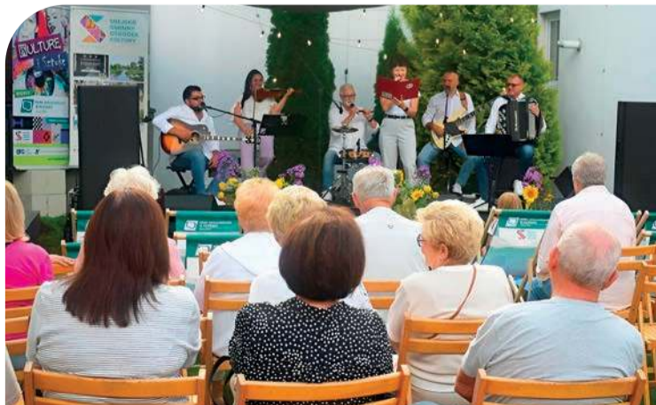
Tym razem gościem sochocińskiej letniej sceny była Kapela Fakiry

Można było również się posilić, w zamian za datek do puszki, bowiem