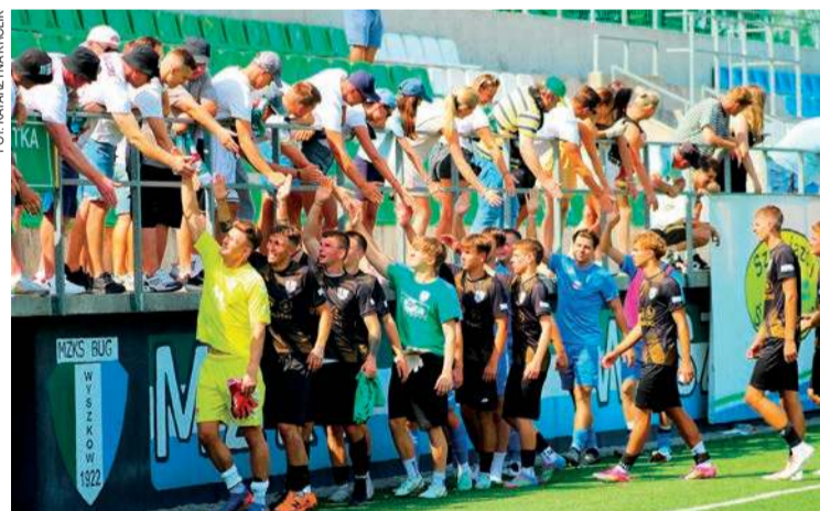
W meczu zaprzyjaźnionych klubów lepszy okazał się Bug Wyszków

2. kolejka (16-17 sierpnia): MKS Ciechanów - PAF Płońsk (16 sierpnia, godz. 15.00), Drukarz - Huragan, Polonia II - Escola, Nadnarwiarka - Stoczniovec (16 sierpnia, godz. 16.00), PRO - Wicher, Żbik - Sokół (16 sierpnia, godz. 15.00), Kasztelan - Naprzód, Bug - Narew