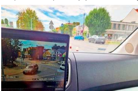
Działania z użyciem iCAM

- W wyniku przeprowadzonych działań ujawniono 14 wykroczeń popełnio-