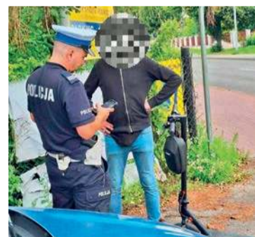
W Płońsku rozpoczęto działania kontrolne dotyczące użytkowników hulajnóg i rowerów

Działania „e-HULAJNOGA, e-ROWER - lokalnie” mają na celu poprawę bezpieczeństwa niechronionych uczestników ruchu drogowego. Obejmują monitoring i wspólne patrole policjantów i strażników miejskich