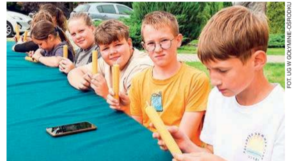
Dzieci poznawały fascynujący świat pszczoł