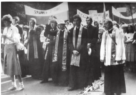
Wejście na Jasną Górę