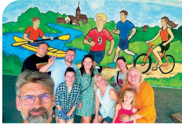
I tak powstał cudny mural na sochocińskiej scenie

w Sohocinie. W piątkowe popołudnie, 1 sierpnia powstał obrys muralu, dzień później go pokolorowano. We wspólne malowanie zaangażował się również sochociński Guzik – Luzik.