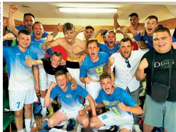
Radość piłkarzy Korony po wygranej w Żurominie

Ostrovia - Strzegowo, Konopianka - Gładiator, Mławianka II - Narew II