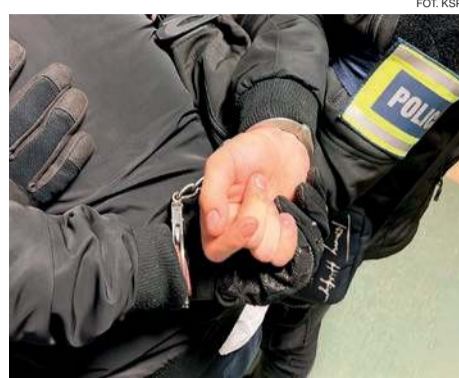
Mieszkańcowi Ciechanowa postawiono dwa zarzuty usiłowania zabójstwa

Podjeznanym o oddanie strzałów jest 39-letni mieszkaniec Ciechanowa. Usłyszał on dwa zarzuty usiłowania zabójstwa. Mężczyzna w przeszłości był karany za udział w bójkę i odbywał karę pozbawienia wolności, dlatego będzie odpowiadał w warunkach recydywy. Podczas przesłuchania nie przyznał się do winy i odmówił składania wyjaśnień,