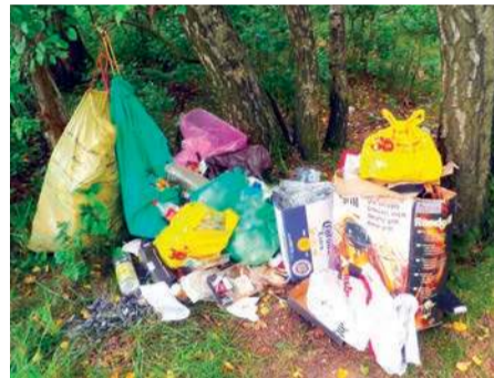
Taką porcję śmieci pozostawili po sobie nad zalewem jacyś uczestnicy pikniku