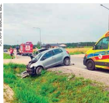
Zdarzenie w Różanie

31 lipca około godziny 11:00 w miejscowości Różan doszło do zdarzenia drogowego, którego prawdopodobną przyczyną było nieustąpienie pierwszeństwa przejazdu.