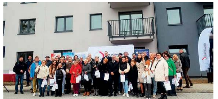
Pierwszy blok SIM w Płońsku oddano do użytku w marcu. Wkrótce rozpoczną się prace projektowe drugiego bloku

W czwartek, 7 sierpnia rada miasta Płońska przyjęła uchwałę w sprawie podjęcia działań zmierzających do wnieśienia mienia do spółki SIM Północne Mazowsze. Chodzi o działkę przy zbiegu ulic Klonowej i Żołnierzy Wyklętych,