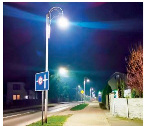
Wymieniono 83 oprawy lamp na energooszczędne