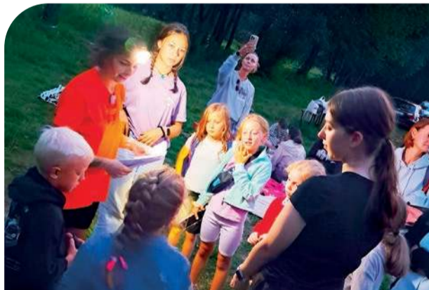
Najpierw grano w planszówki a potem była gra terenowa i ognisko

Stowarzyszenie Razem dla Sohocina zorganizowało wspólne malowanie sceny