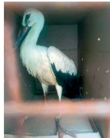
Bocian miał złamaną nogę