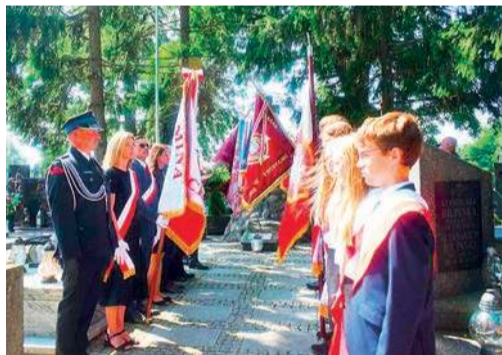
W uroczystości wzięły udział poczty sztandarowe

Sochocińskie obchody 105. rocznicy wojny polsko – bolszewickiej rozpoczęły się mszą świętą, po której uczestnicy uroczystości, wraz z orkiestrą przeszli na parafialny cmentarz – na grób żołnierzy, poległych w walkach nad Wkrą w 1920 r.