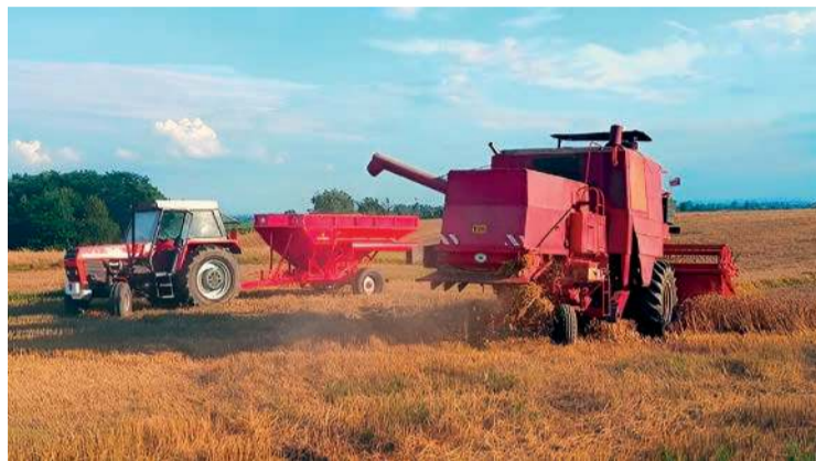
W porównaniu z 2024 r. tegoroczne żniwa zapisały się już jako trudniejsze

Tegoroczny sezon żniwny w regionie północnego Mazowsza – głównie w powiatach ciechanowskim, ostrołęckim i sierpeckim – wkracza w decydującą fazę. Po trudnym początku, naznaczonym przymrozkami, gradobiciem i czerwcową suszą, lipiec przyniósł poprawę sytuacji na polach. Teraz, w pierwszej połowie sierpnia, widać już efekty tej odmiany, choć kapryśna pogoda wciąż zmusza rolników do pracy w niestandardowym rytmie.