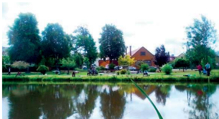
Łowisko Borek - tutaj są zawody i treningi wędkarskie