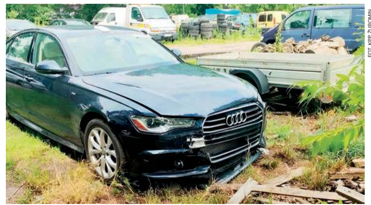
Poszukiwane trzecie auto - audi

Jak poinformował nas, nadkomisarz Tomasz Wnuk, zastępca komendanta żuromińskiej policji, funkcjonariusze prowadzą działania operacyjne i zostały one rozszerzone także poza granice powiatu żuromińskiego. W.D.