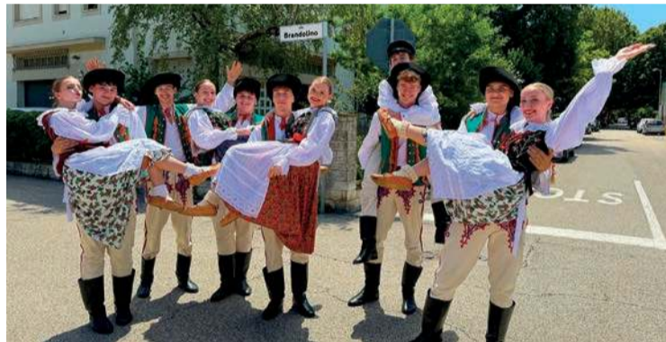
Tancerze z Ciechanowa na ulicach Rimini