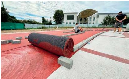
W miejscu wysłużonego stadionu powstaje nowy. Obecnie budowana jest bieżnia