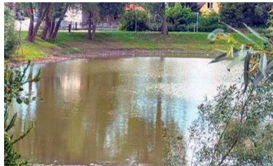
Gmina Załuski przebuduje kroczewskie stawy

W ramach zadania planowana jest przebudowa 2 stawów na terenie zabytkowego, zrewitalizowanego parku w Kroczewie oraz łączącego je stumetrowego kanału i rowu melioracyjnego biegnącego przez miejscowość. Zakres prac obejmuje również nasadzenia roślinności retencyjnej, wykonanie ogrodów deszczowych oraz budowę ścieżki przyrodniczo - dydaktycznej.