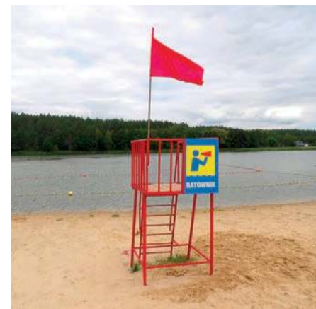
Kąpielisko w Rudzie w dniach, gdy było ono zamknięte