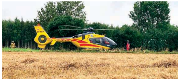
Poszkodowanego do szpitala zabrał śmigłowiec LPR

– Kombajnem kierował 57-letni mężczyzna. Był trzeźwy – przekazała nadkom. Jolanta Bym z KPP w Ciecha-