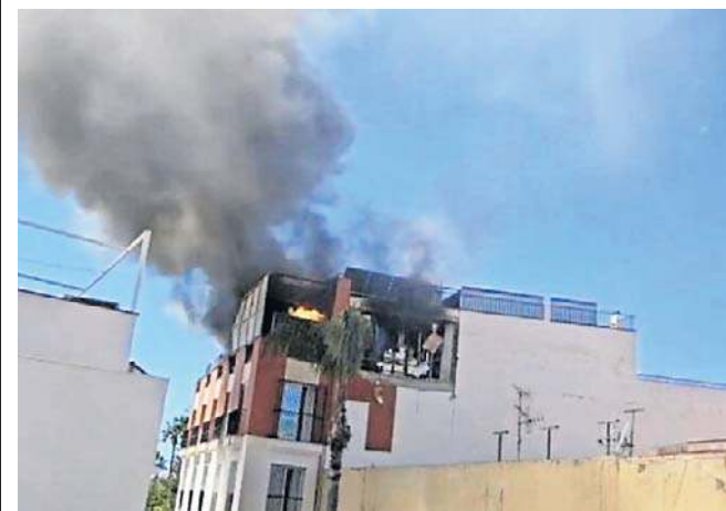
Mówi się o cudzie, że nikt nie zginął podczas pożaru w hiszpańskim mieście Almunecar