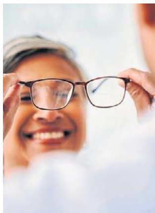
Wizyty u optometrysty są bardzo ważne

Optometrysta, który często jako pierwszy bada wzrok pacjenta, może szybko zauważyć niepokojące objawy i skierować go na dalszą diagnostykę okulistyczną. Takie podejście pozwala skrócić ścieżkę pacjenta i zwiększyć skuteczność opieki.