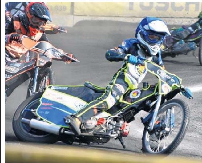
Mini żużlowy sezon 2026 oficjalnie rozpoczęły zawody w podgorzowskim Wawrowie. Kolejna impreza 9 maja

W tym sezonie na mini torze w Wawrowie rozegranych zostanie 19 imprez (takiej dawki mini żużla jeszcze tu nie było). Najbliższe zawody odbędą się 9 i 10 Drużynowy i Indywidualny Puchar Ekstraligi. ©