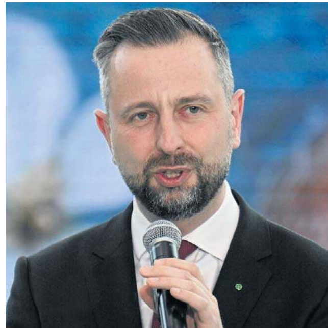
Władysław Kosiniak-Kamysz: Bezpieczeństwo Polski jest absolutnym priorytetem

Firma Lockheed Martin w 2025 roku wyprodukowała ok. 600 takich pocisków, a tylko przez pierwsze 16 dni wojny z Iranem, amerykańska armia zużyła ich ponad 1,5 tysiąca. Oznacza to, że odtworzenie tego, co wystrzelono w tak krótkim czasie, zajmie Amerykanom dwa lata, a konflikt trwa.