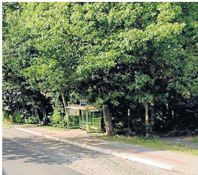
Park przy ul. Szczekocińskiej został wpisany do projektu planu ogólnego Zielonej Góry jako „teren zielony” dzięki zaangażowaniu mieszkańców

- Moją intencją jest zachowanie terenów zielonych. Pragnę uspokoić i odnieść się do tych wystąpień, bo jak najbardziej mieszkańcy mają prawo zabrać głos - komentował. Zapowiedział, że plan ogólny będzie weryfikowany i aktualizowany za ok. trzy lata.