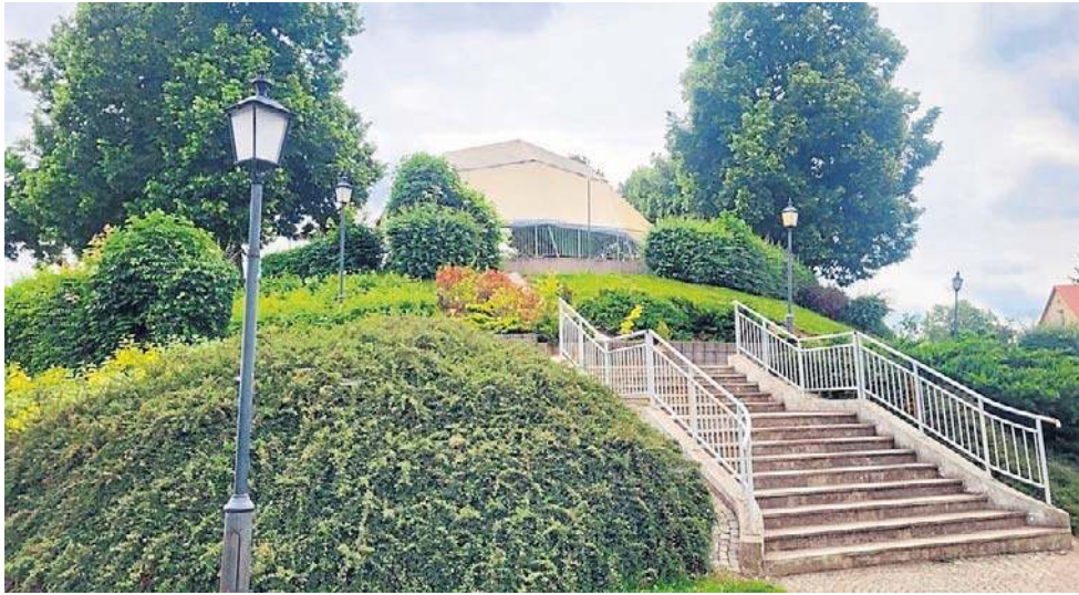
Zmieni ma się się m.in. teren wokół Magazynu Solnego, ul. Żwirki i Wigury, dawna kaplica ewangelicka na cmentarzu, a także Harcerska Górka (na zdjęciu)

Teraz zmieni się m.in. teren wokół budynku. Ten zabytek stał się nową placówką kultury, w której odbywają się choćby koncerty czy wystawy. W ramach kolejnej inwestycji na tamtym terenie powstanie fontanna. Zmiany czekają też pobliską ul. Żwirki i Wigury.