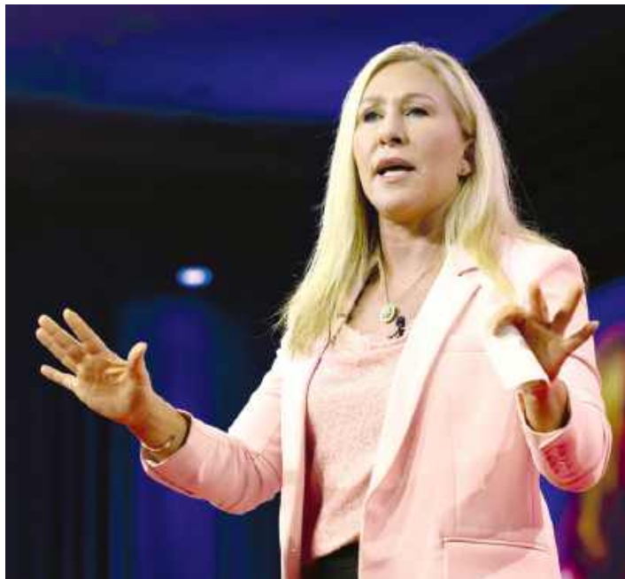
Była kongresmenka Marjorie Taylor Greene, najsurowsza w tej chwili krytyczka Trumpa z łona jego własnego ruchu, oskarżyła prezydenta o beczelną hipokryzję.

wywiadów z innych części świata Trump każe Amerykanom wierzyć, że Iran szykował się do zmasowanych ataków raketowych na amerykańskie cele na Bliskim Wschodzie.