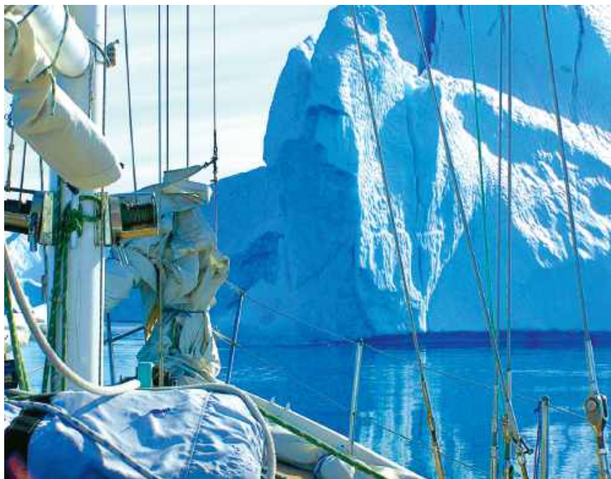
Góry lodowe na Zatoce Disco.