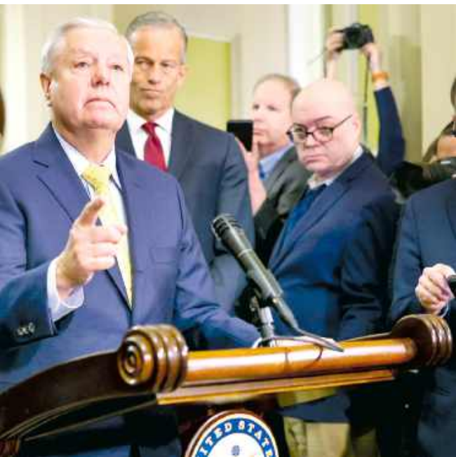
Republikański senator Lindsey Graham: America First to nie izolacjonizm. America First to śmierć ludziom, którzy nam źle życzą.