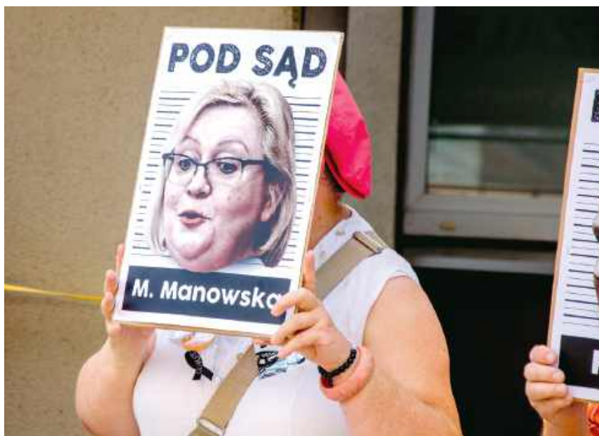
Pikieta pod hasłem „Zatrute państwo, zatrute społeczeństwo, zatruta Odra” pod Sądem Rejonowym w Zielonej Górze, 18 sierpnia 2022 r.