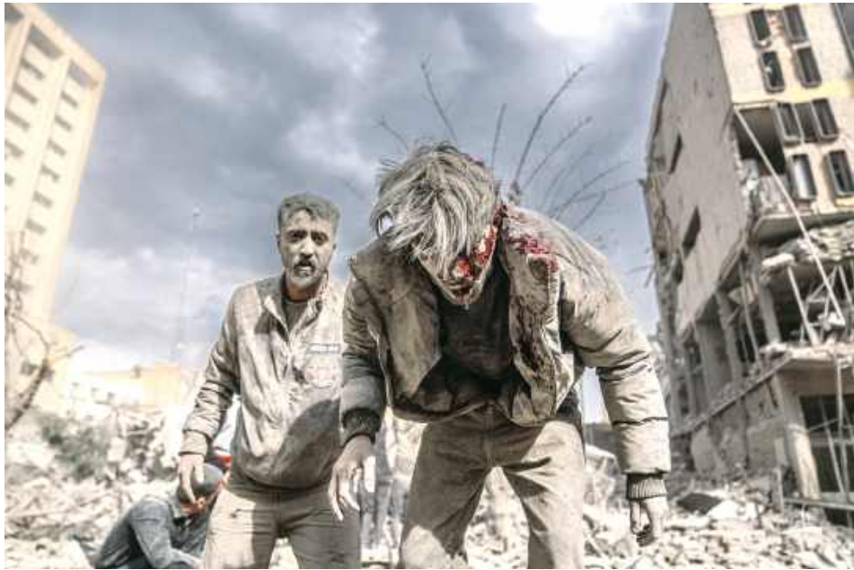
Centrum Teheranu po nalocie, 2 marca 2026 r.

Trudno się dziwić, że śmierć Chameneiego podczas ataku na jego rezydencję 28 lutego nie wywołała zupełnego chaosu w strukturach władzy. Ajatollah miał już niemal 87 lat i jego najbliższe otoczenie było przygotowane na to, że wkrótce trzeba będzie go zastąpić. Następcę