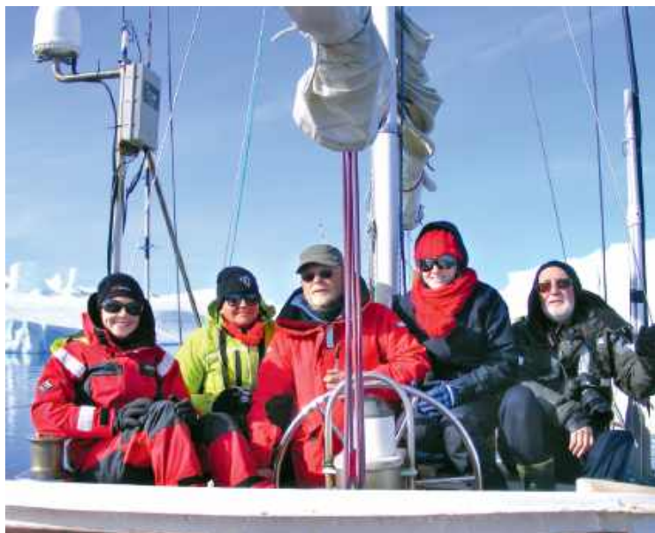
Załoga „Berga” w komplecie. Kapitan oczywiście za kołem sterowym, z nieodłączną fajką. Klasyka.