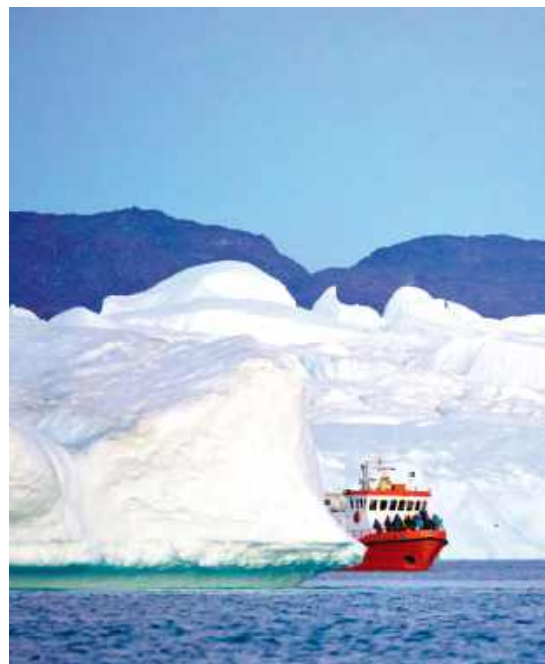
Podpłynąć najbliżej, jak się da.