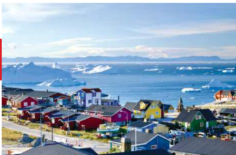
Widok z pensjonatu w Ilulissat, gdzie mieszkałem z kilkoma amatorami fotografii i grenlandzkiej przyrody. Nazwa miasta oznacza w języku miejscowym góry lodowe – i to widać, gdziekolwiek się spojrzy.