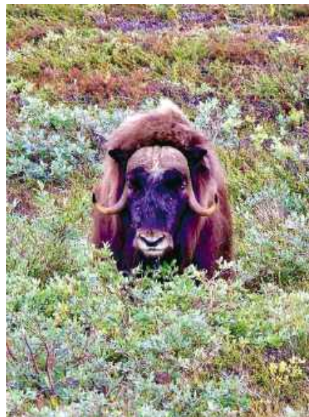
Wół piżmowy w tundrze nad Kangerlussuaq. Jego uprzejmości nie testowaliśmy.