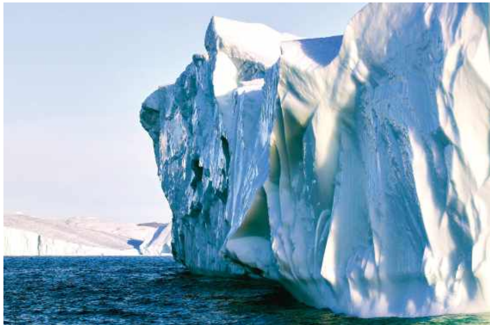
Wśród gór lodowych na Zatoce Disco.