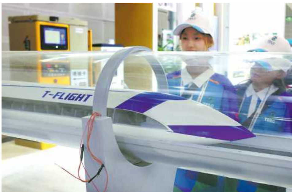
T-Flight ma połączyć chińskie megamiasta i znacznie skrócić czas podróży.

Co ciekawe, doświadczenia z eksploatacji tej linii posłużyły do budowy nowojorskiej sieci poczty pneumatycznej, która była używana do 1953 r. Pomysł Beacha, przypominający pod pewnymi względami projekt kolei pneumatycznej Elona Muska