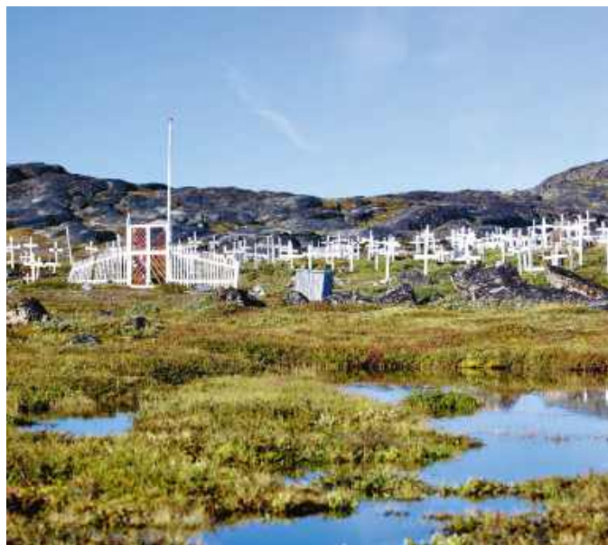
Cmentarz w Ilulissat.