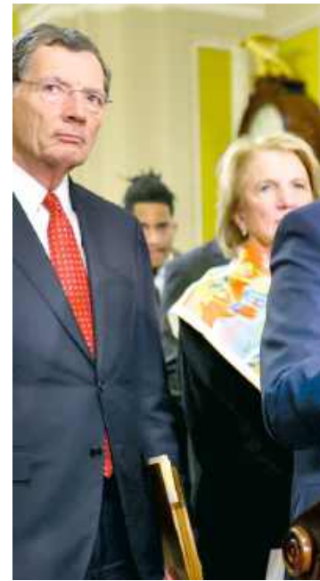
Tucker Carlson nazwał ataki „diabelskimi i obrzydliwymi”.