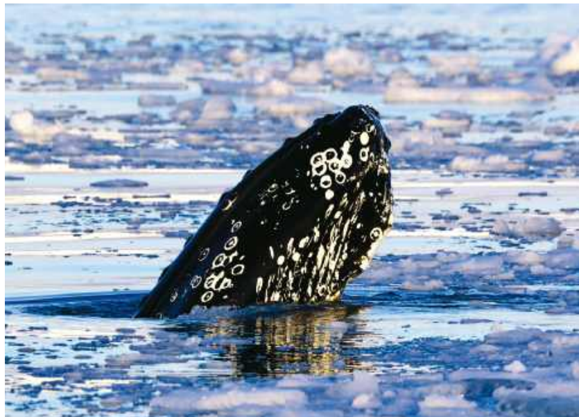
Mieliśmy szczęście, często spotykaliśmy wieloryby.