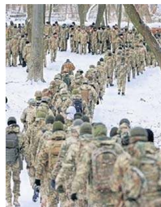
W 2025 roku zginęło ćwierć miliona rosyjskich żołnierzy

Nie podano liczby ofiar w armii rosyjskiej, jednak Media-