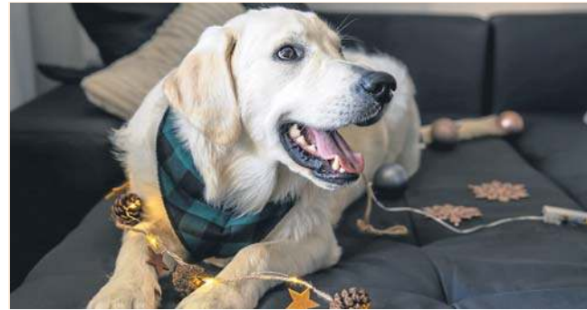
W sylwestra (ale także w dni po nim) trzymaj swojego zwierzaka w domu

Upewnij się, że drzwi i okna są bezpiecznie zamknięte. Jeżeli świętujesz w domu, poproś gości o zachowanie ostrożności podczas wchodze-