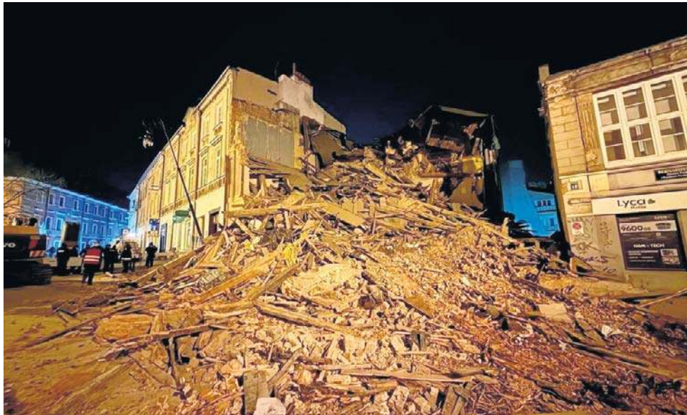
Katastrofa budowlana w centrum Lublina. 18 stycznia zawaliła się kamienica przy ul. Bernardyńskiej 10

● Do 2029 r. ma wreszcie powstać kompleks Alchemia. To inwestycja na terenie między ul. Świętoduską a ul. Lubartowską,