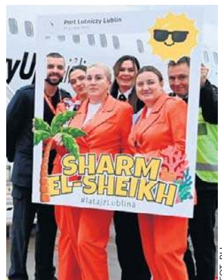
Co niedziela można polecieć do Egiptu

Bilety na loty do Sharm el-Sheikh można nabyć na stronie internetowej touroperatora Join UP oraz u pośredników.