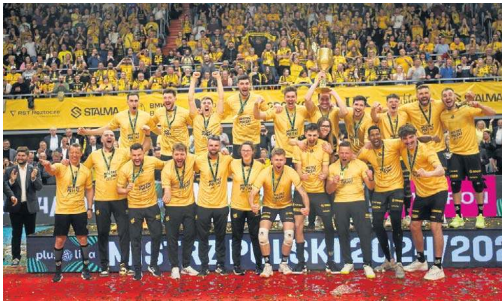
Lubelski Klub Przyjaciół Siatkówki założono w 2013 roku. Teraz drużyna z Lublina jest mistrzem Polski. Występuje również w elitarniej Lidze Mistrzów