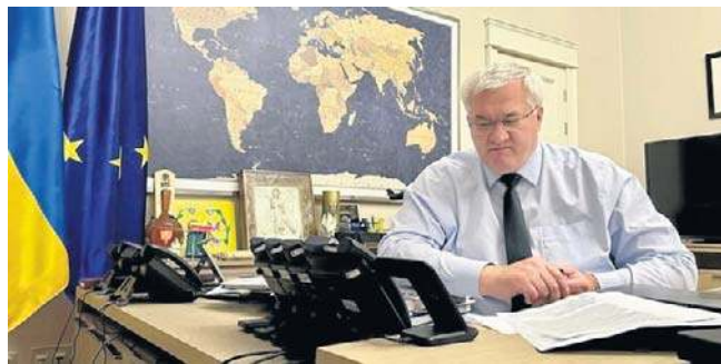
Szef ukraińskiego MSZ Andrij Sybiha ocenił, że fałszywe oskarżenia są sztandarową taktyką Rosji