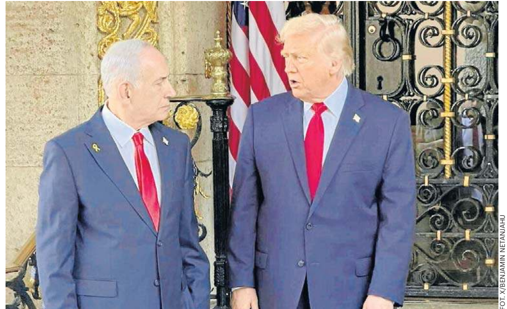
Spotkanie Donalda Trumpa z Benjaminem Netanjahu w Mar-a-Lago na Florydzie. Prezydent USA stanowczo poparł działania Izraela w Strefie Gazy

Sprawa zagrożenia z powodu dalszych działań Teheranu na rzecz budowy broni jądrowej była jednym z głównych tematów poniedziałkowego spotkania Trumpa z premierem Izraela Benjaminem Netanjahu. Inny to sprawa planu pokojowego w Strefie Gazy.