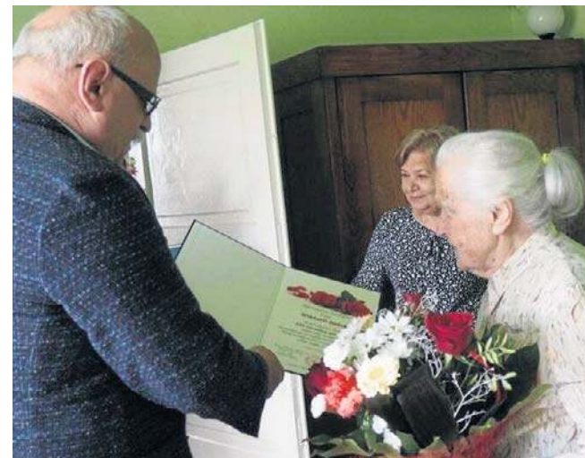
100. urodziny w 2021 r., wójt gminy Wielopole Skrzyńskie wręcza jubilatce dyplom i kwiaty