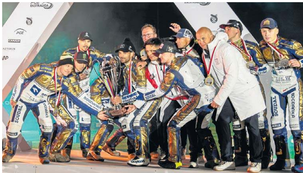
Lubelscy żużlowcy od 2021 roku nie schodzą z podium mistrzostw Polski. W tym czasie sięgnęli po dwa srebra (2021 i 2025) oraz trzy złota (2022, 2023 i 2024)

Zawodniczki PGE MKS Fun-Floor Lublin zostały wicemi-