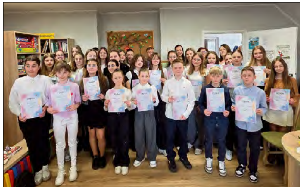
W konkursie wzięło udział 29 uczestników w dwóch kategoriach wiekowych.

Za nami XV Gminny Konkurs Recytatorski w Strzeleczkach. Dzięki współpracy Szkoły Podstawowej oraz Gminnej Biblioteki Publicznej w Strzeleczkach miłośnicy słowa mogli przeżyć prawdziwą ucztę pełną emocji, wzruszeń i pięknych interpretacji. Były momenty, gdy pojawiały się ciarki, były chwile uśmiechu, a talent młodych recytatorów niejednokrotnie odbierał mowę.