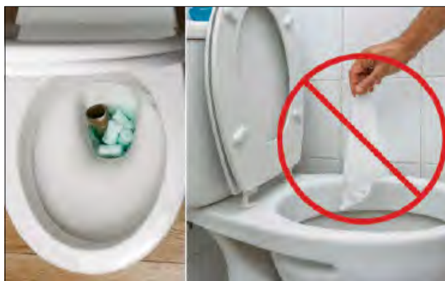
Nieświadomi mieszkańcy zapychają kanalizację i generują ogromne koszty.

Do tego dochodzą produkty higieniczne, takie jak podpaski, tampony, pieluchy, a także pozornie niegroźne patyczki do uszu.