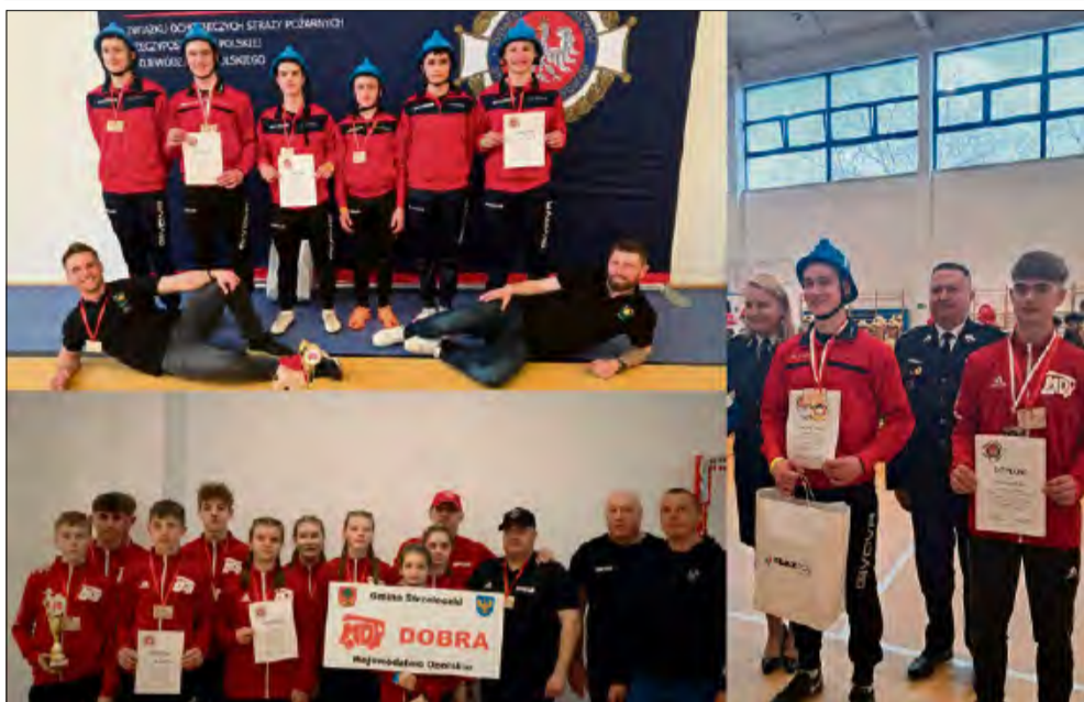
Ogromny sukces młodych strażaków z powiatu krapkowickiego.

Drużyna Młodzieżowej Drużyny Pożarniczej z Kórnicy sięgnęła po tytuł Mistrzów Opolszczyzny podczas Wojewódzkich Halowych Zawodów Sportowo-Pożarniczych. Po zaciętej rywalizacji MDP Dobra uplasowała się na drugim stopniu podium.