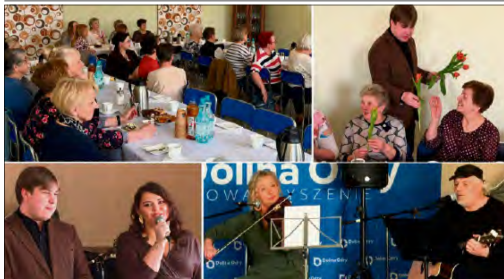
W trakcie popołudnia panie mogły cieszyć się rozmowami, wspólną atmosferą i muzyką na żywo.

Mieszkanke Zdzeszowic spotkały się w sobotę 14 marca w Starówce, by wspólnie świętować Dzień Kobiet. Inicjatywa zgromadziła liczne mieszkanki osiedla oraz zaproszonych gości.