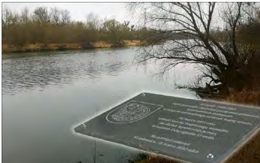
W tym miejscu na Odrze 16 marca 1951 roku doszło do tragicznej katastrofy promu, w której zginęło 17 pracowników Śląskich Zakładów Obuwia w Otmęcie wracających z pracy do domu.

Tego dnia na pokład weszło jednak znacznie więcej osób, niż przewidywały możliwości