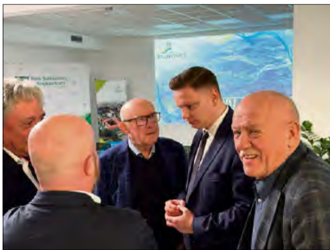
Forum było doskonałą okazją do wymiany zdań i doświadczeń biznesowych.

Piętnasta edycja Krapkowickiego Forum Gospodarczego przeszła do historii. Wydarzenie, które na stałe wpisało się w kalendarz najważniejszych spotkań biznesowych w regionie, w tym roku odbyło się w odświeżonej formule, kładącej nacisk na promocję lokalnych firm i ich osiągnięć. Gospodarzem i głównym organizatorem spotkania była gmina Krapkowice.