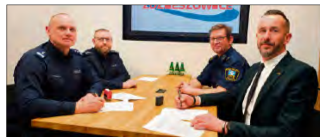
Jak ustalono, wzmożone służby potrwają od 10 marca do 30 listopada 2026 roku.

Funkcjonariusze będą obecni w przestrzeni publicznej głównie w godzinach popołudniowych i nocnych. Jak pod-