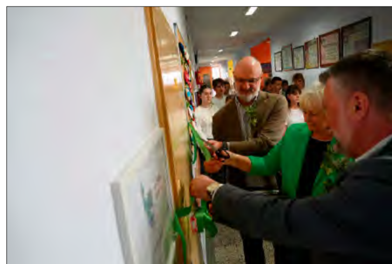
Drugą eko-klasę otwarto w marcu. Mieści się ona w Publicznej Szkole Podstawowej nr 3 w Gogolinie.

Eko-klasa w PSP nr 3 powstała dzięki dofinansowaniu, które umożliwiło remont pomieszczenia klasowego i jego wyposażenie w sprzęt komputerowy i multimedialny oraz nowoczesne pomoce dydaktyczne z zakresu biologii, geografii i ekologii. Uczniowie mogą korzystać między innymi z mikroskopów,