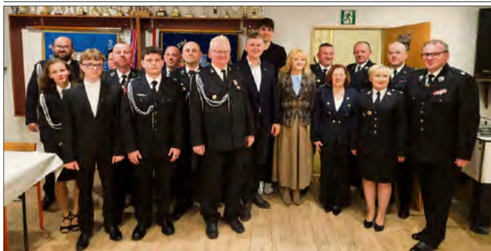
W wydarzeniu udział wzięli druhowie, a także przedstawiciele lokalnych władz samorządowych.

W sobotę 7 marca w Ochotniczej Straży Pożarnej w Góraźdżach odbyło się zebranie sprawozdawczo-wyborcze. Druhowie podsumowali działalność jednostki za miniony okres, a następnie przystąpili do wyboru nowego zarządu na kolejną kadencję.