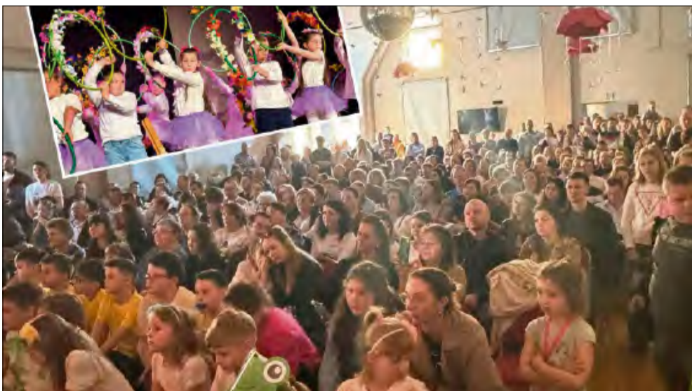
Tego dnia sala Gminnego Ośrodka Kultury w Strzeleczkach pękała w szwach.

W niedzielę 15 marca w domu kultury w Strzeleczkach odbył się tradycyjny Wielkanocny Kiermasz Charytatywny. Wydarzenie udało się zorganizować dzięki zaangażowaniu Szkoły Podstawowej w Strzeleczkach, Szkoły Podstawowej w Raclawiczkach, Przedszkola w Strzeleczkach oraz Gminnego Ośrodka Kultury w Strzeleczkach.