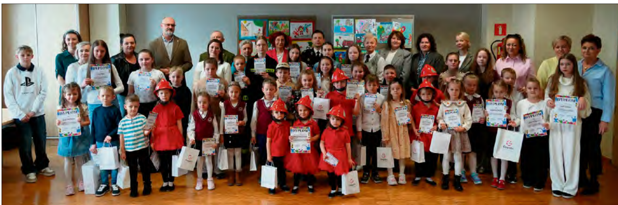
Młodych talentów w gminie Gogolin nie brakuje.

W czwartek 12 marca w Gminnym Centrum Kultury im. Jerzego Lipki w Gogolinie odbyło się wręczenie nagród w eliminacjach gminnych Ogólnopolskiego Strażackiego Konkursu Plastycznego.