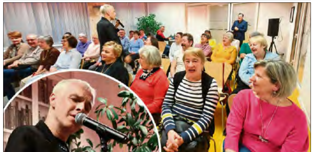
Artur Chamski śpiewem oczarował publiczność.

5 marca Miejska i Gminna Biblioteka Publiczna w Krapkowicach wypełniła się dźwiękami miłości. Artysta znany z telewizyjnego ekranu Artur Chamski zaprezentował recital, który na długo pozostanie w pamięci słuchaczy. Spotkanie zorganizowane w ramach akcji „Zaczytane Opolskie” było nie tylko okazją do wysłuchania znanych przebojów, ale także do bliższego poznania drogi artystycznej gościa.