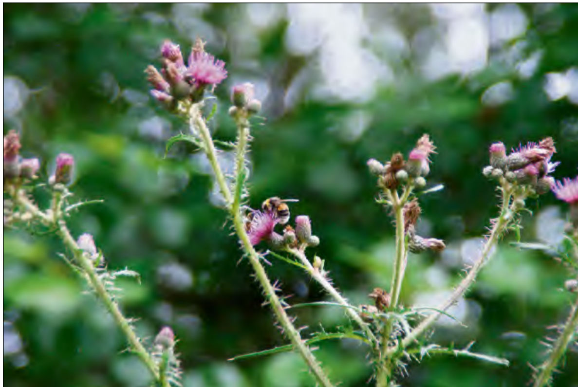
Nauką może być wszystko - nawet chaszczki za domem.

Kontakt z przyrodą nie musi jednak oznaczać dalekich wypraw. Równie wartościowe mogą być obserwacje w najbliż-