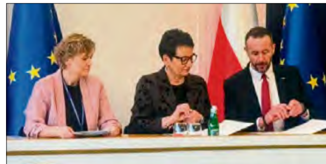
Do podpisania umowy doszło w Urzędzie Wojewódzkim w Opolu.