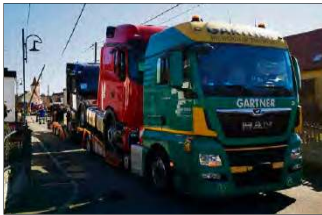
Do zdarzenia doszło w sobotę 14 marca około godziny 10.50 na ulicy Kopernika w Malni.

Sprawa błędzących tirów w Malni nie jest świeża. Już w 2020 roku opisywaliśmy podobne sytuacje. Kierowcy pojazdów ciężarowych chcąc dostać się do zakładu pracy powinni to zrobić za pośrednictwem specjalnie wybudowanej, szerokiej ulicy Józefa Cebuli, która wprost prowadzi do miejsca docelowego. Niestety, część niezaktualizowanych map nawigacyjnych wciąż kieruje samochody