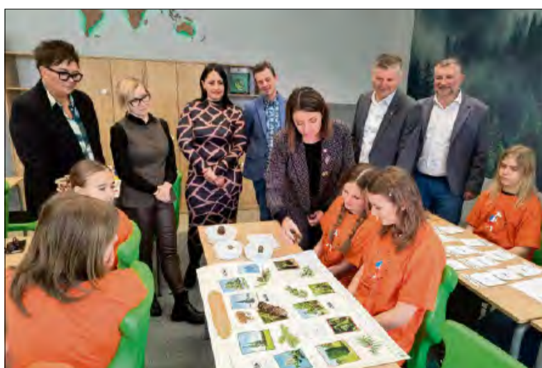
Pierwszą z eko-klas (w PSP nr 2 w Gogolinie) oddano do użytku w lutym.