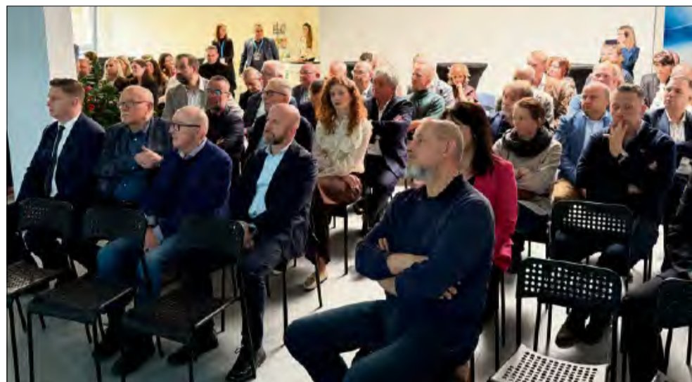
Lokalni przedsiębiorcy chętnie odpowiedzieli na zaproszenie organizatora forum.

Głos w dyskusji zabrał również reprezentujący jednego z laureatów, pre-