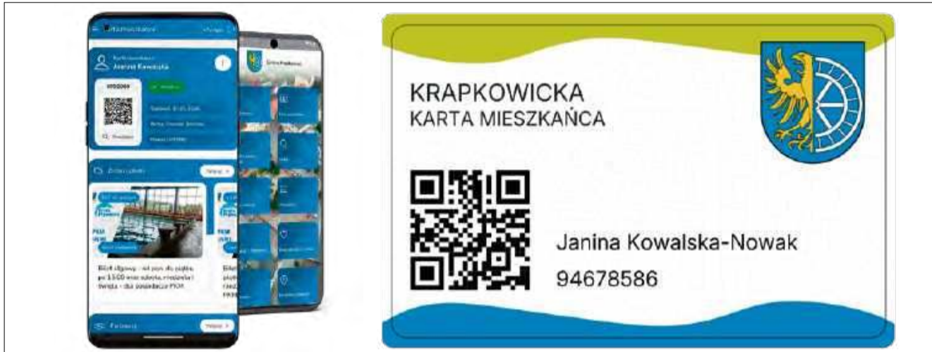
Karty będą dostępne w formie tradycyjnej oraz w ramach aplikacji Gmina Krapkowice.

• Młodzież i studenci: osoby zameldowane w gminie do 26. roku życia (korzystające z „ulgi dla młodych”) oraz uczniowie i studenci w wieku 18–26 lat.