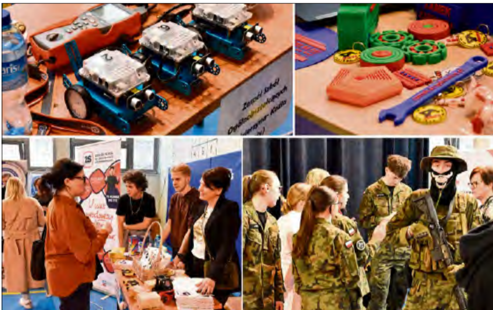
Wydarzenie skierowane do uczniów ostatnich klas podstawówek oraz ich rodziców.

Za nami Targi Szkół Ponadpodstawowych, które 10 marca zorganizowano w Publicznej Szkole Podstawowej nr 3 w Zdieszowicach. Wydarzenie skierowane do uczniów ostatnich klas podstawówek oraz ich rodziców miało ułatwić młodym ludziom podjęcie jednej z ważniejszych decyzji w życiu - wybór dalszej ścieżki edukacji.