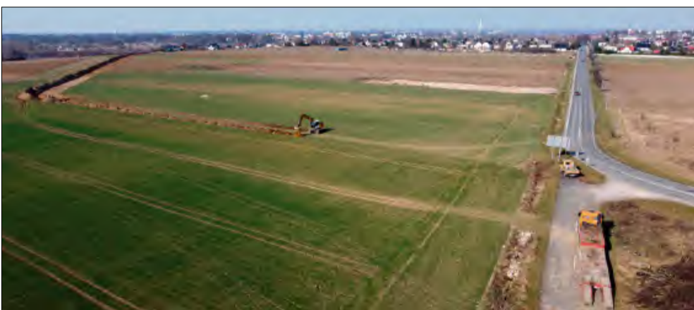
Prace rozpoczęły się od wytyczenia technicznej drogi do miejsca budowy mostu.

W ubiegłym tygodniu rozpoczęły się pierwsze prace związane z budową Mostu Południowego. Od skrzyżowania ul. Żeromskiego z drogą wojewódzką nr 423 ruszyły przygotowania do wytyczenia drogi technicznej, którą w najbliższym czasie zaczną przemieszczać się ciężki sprzęt.