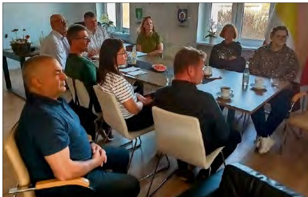
Kolejne spotkanie Rady ds. Ekologii zaplanowano na czerwiec. Będzie ono okazją do dalszej pracy nad tematami związanymi z ochroną siedlisk oraz gatunków występujących na terenie gminy Gogolin.