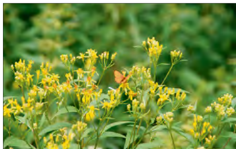
Każda rzecz jest powiązana z innymi rzeczami - to jedno z praw ekologii.

Dobrym przykładem są ścieżki dydaktyczne. W powiecie krapkowickim szczególnie warte uwagi są m.in. ścieżka „Z Żyrowej do Góry św. Anny przez rezerwat Lesisko” czy