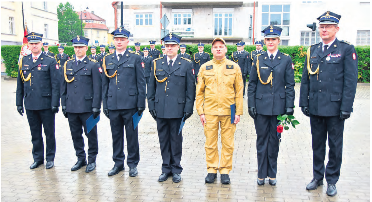
Awans na wyższy stopień podoficerski otrzymało 4 funkcjonariuszy i funkcjonariuszka tucholskiej KP PSP.

– Współczesna straż pożarna to nie tylko działania ratownicze. To również coraz szerszy obszar związany z ochroną ludności, reagowaniem kry-