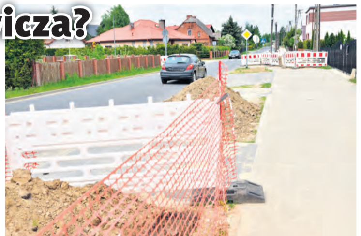
Po nieudanym remoncie ulica Mickiewicza objęta jest jeszcze okresem 5-letniej gwarancji. Z uwagi na to, ENEA Operator podpisał umowę z gwarantem. Przebudowę drogi realizowało Przedsiębiorstwo Budowy Dróg i Mostów ze Świecia.

W bydgoskim oddziale dystrybucji ENEA słyszymy, że zakres inwestycji obejmuje kablowanie istniejącej, napowietrznej infrastruktury elektroenergetycznej średniego napięcia 15 kV na terenie Tucholi, co wiąże się również