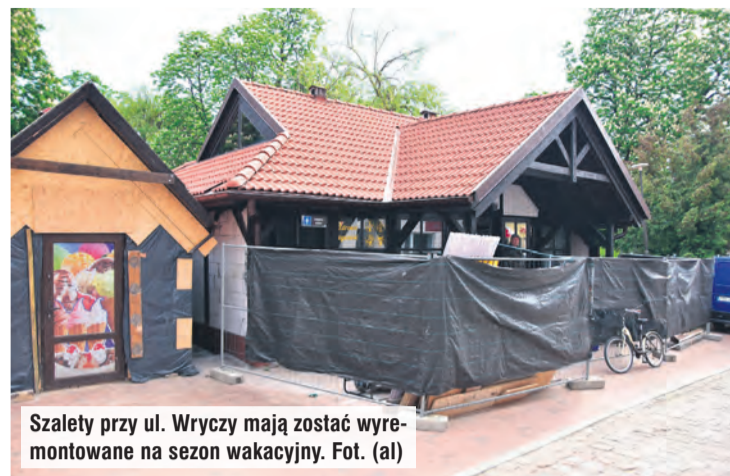
Szalety przy ul. Wryczy mają zostać wyremontowane na sezon wakacyjny.

– Jako że poruszamy się w strefie staromiejskiej, mamy już uzgodnione z konserwatorem zabytków, że te obiekty będą wyglądały praktycznie identycznie, tzn. elewacja będzie wykonana w stylu muru pruskiego, a na da-