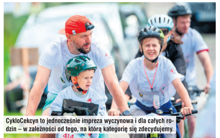
CykloCekcyn to jednocześnie impreza wyczynowa i dla całych rodzin – w zależności od tego, na którą kategorię się zdecydujemy.