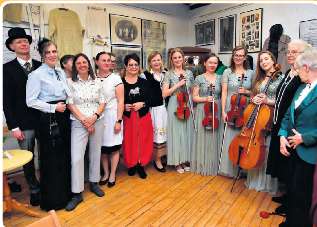
Do pamiątkowego zdjęcia z artystkami z Bydgoszczy ustawiły się pracownicy muzeum oraz osoby zaangażowane w organizację i urozmaicenie wydarzenia.

W placówce można było spotkać także leśników z Nadleśnictwa Zamrzenica, którzy – w nawiązaniu do czasowej wystawy