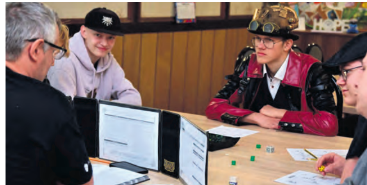
Wydarzenie organizowane przez Klub Gier Planszowych K20 ma już stałe grono fanów, a z roku na rok dołączają kolejni.