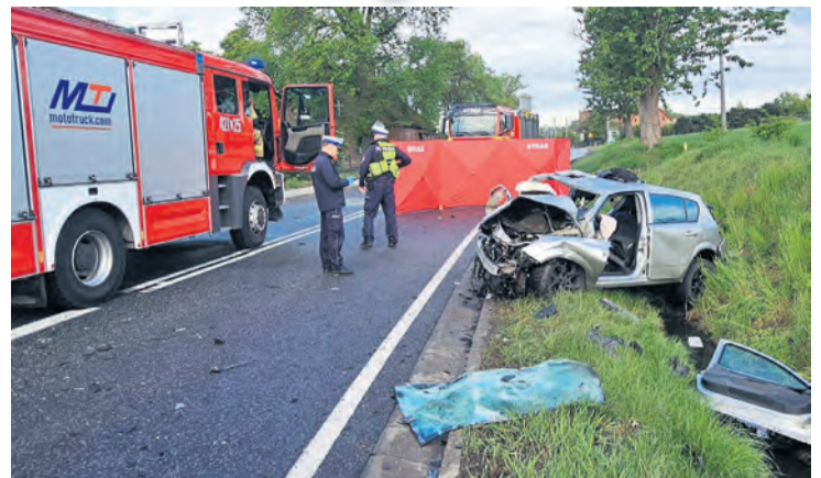
Dokładne przyczyny i przebieg zdarzenia są przedmiotem policyjnego śledztwa.

Tucholi oraz podróżująca z nim 43-letnia pasażerka, mieszkanka Chojnic. Trzeci uczestnik zdarzenia, 36-latek z Cekcyna, został przetransportowany do szpitala – informuje Agnieszka Prokop, oficer prasowa KPP w Człuchowie.