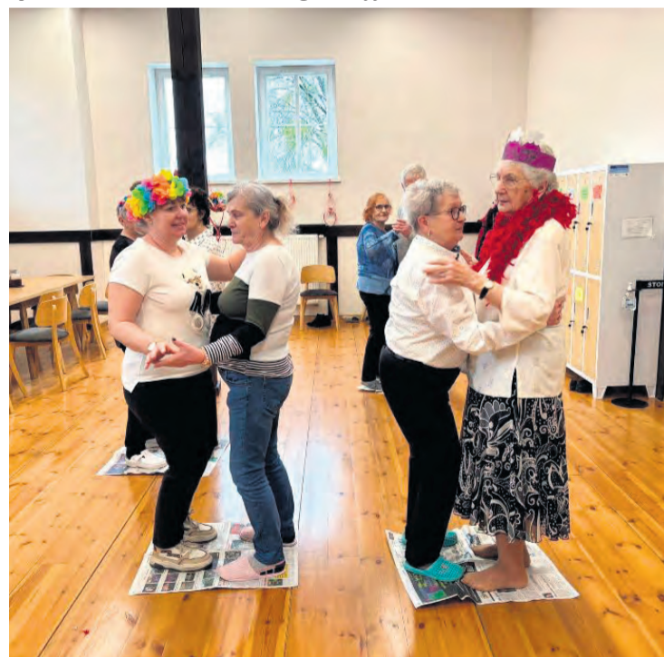
Taniec jest jedną z ulubionych aktywności ruchowych, osób korzystających z DDP. Ogłoszenie płatne

Dzienny Dom Pomocy w Śliwicach nie jest wyłącznie skierowany na seniorów! Jest otwarty dla domowników jest po prostu