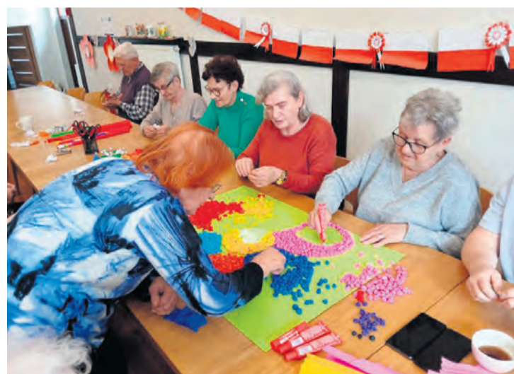
Dzienny Dom Pomocy w Śliwicach funkcjonuje od poniedziałku do piątku.

potrzebują wsparcia w codziennym funkcjonowaniu nie tylko z powodu wieku, ale również stanu zdrowia i niepełnosprawności.