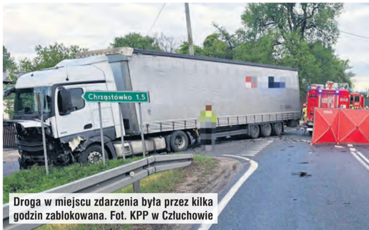
Droga w miejscu zdarzenia była przez kilka godzin zablokowana.

– W wyniku zdarzenia na miejscu zginął kierujący oplem 43-letni mieszkaniec