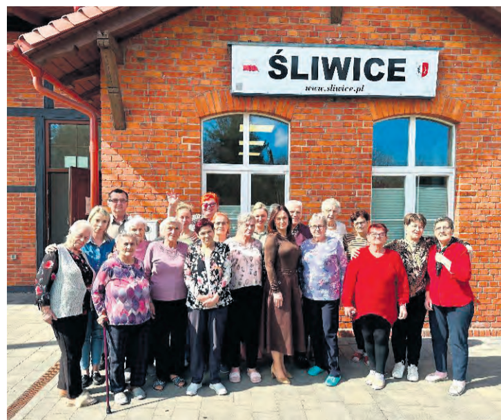
Najważniejszą kwestią dla osób rozważających dołączenie do DDP, to zniwelowanie bariery komunikacyjnej poprzez zapewnione dojazdy.

Dzień w śliwickim DDP ma stały harmonogram. Domownicy przyjeżdżają około godziny 8:30, potem mają śniadanie. Udają się na poranną gimnastykę. Kolejne godziny to dedykowane zajęcia ze specjalistami bądź wyżej wymienione aktywności. O godzinie 14:00 jest obiad, a po nim chwila odpoczynku. Po godzinie 15:00 rozpoczynają się odwozy mieszkańców, które realizowane są w kilku turach, bo korzy-