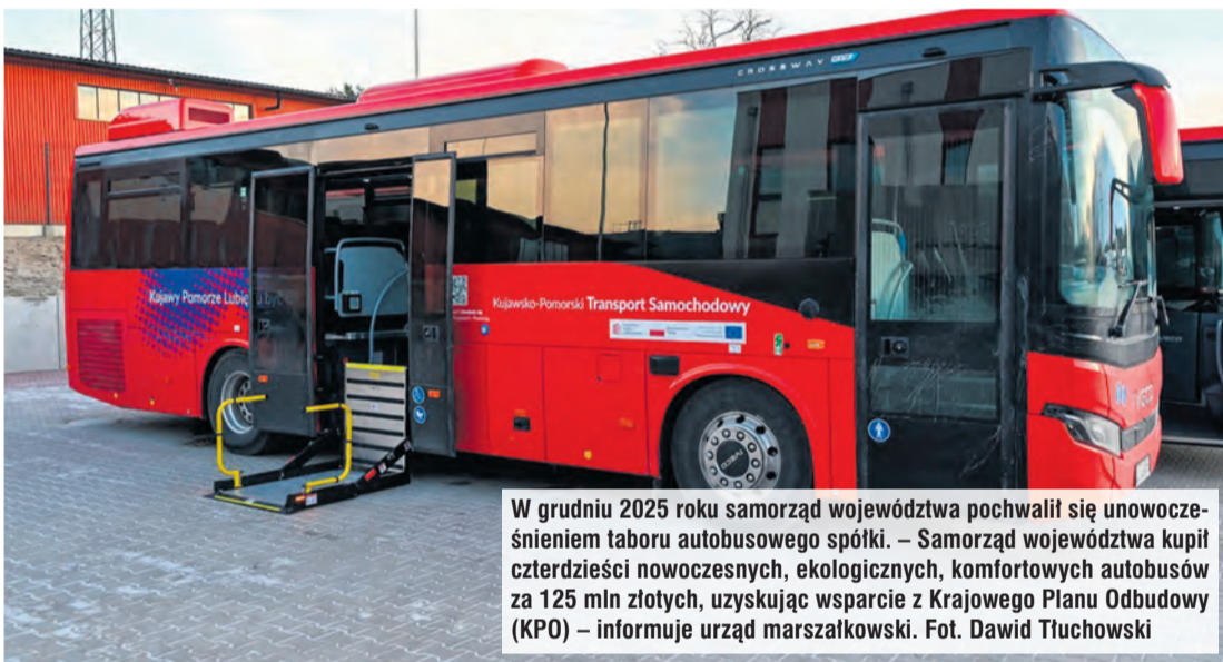
W grudniu 2025 roku samorząd województwa pochwalili się unowocześnieniem taboru autobusowego spółki. – Samorząd województwa kupił czterdzieści nowoczesnych, ekologicznych, komfortowych autobusów za 125 mln złotych, uzyskując wsparcie z Krajowego Planu Odbudowy (KPO) – informuje urząd marszałkowski.