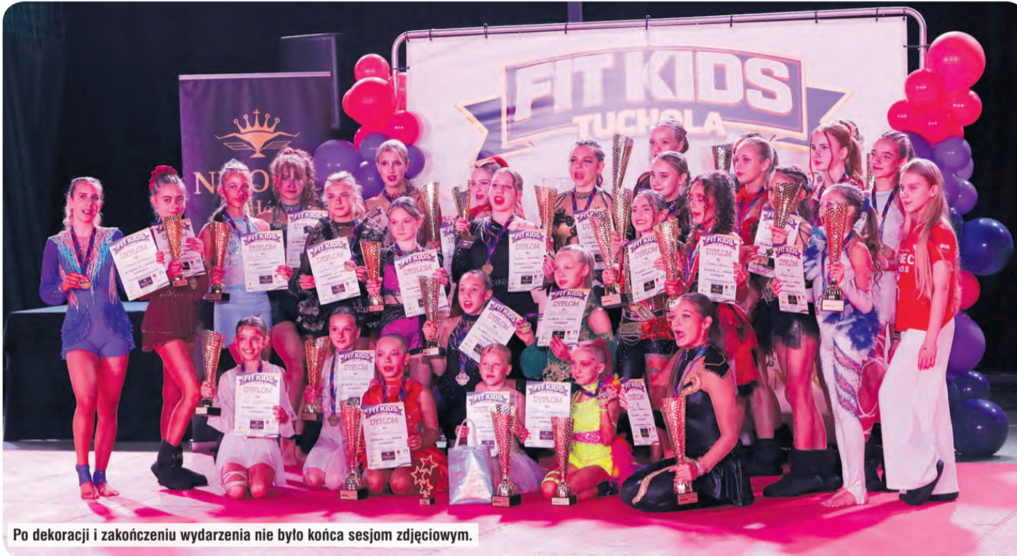
Po dekoracji i zakończeniu wydarzenia nie było końca sesjom zdjęciowym.

Kilka godzin popisów na najwyższym, europejskim poziomie mogli oglądać licznie zgromadzeni ludzie w tucholskiej hali sportowej. Mowa o poziomie Europy, bo wielu mistrzów kontynentu zaprezentowało swój talent podczas sobotniego wydarzenia zorganizowanego przez Fitness Sportowy Tuchola. Choć podium ma trzy miejsca, każde dziecko zostało zaproszone do dekoracji. My już wiemy, że na pierwszej edycji Fit Kids Tuchola z pewnością się nie zakończy.