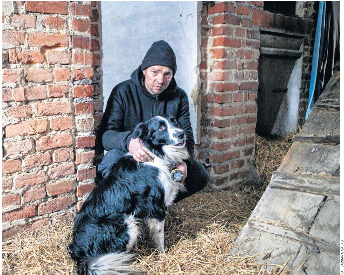
Pan Przemysław zamieszkał w pustostanie, bez prądu, gazu i bieżącej wody, ale ze swoim wiernym przyjacielem

Zaprasza do środka. Ciemno. Urządził się w jednym