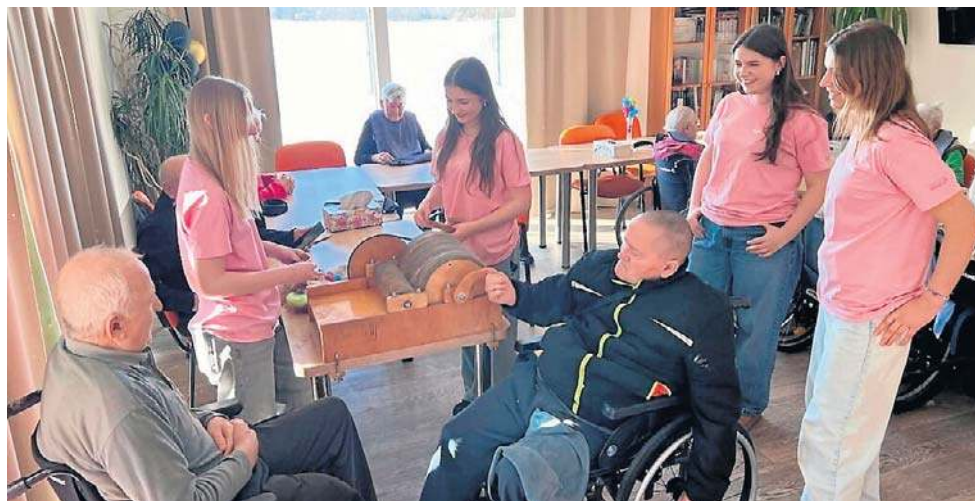
Wolontariuszki pokazują, że empatia i zaangażowanie nie są pustymi hasłami

Być może najważniejsze w tym projekcie jest to, że opiera się on na czymś bardzo podstawowym - na czasie i uważności. A tego, mimo rozwoju technologii i zmieniających się trendów, wciąż najbardziej potrzebujemy jako ludzie.