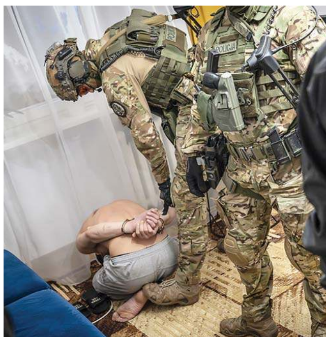
Policjanci wspierani byli przez z Samodzielną Pododdział Kontrterrorystyczny Policji w Gdańsku

Jest to były partner ofiary, jego matka oraz znajomy. Funkcjonariusze doprowadzili ich do prokuratury,