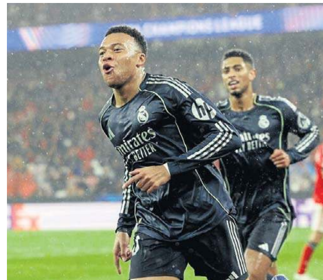
Real Madryt w ostatniej kolejce fazy ligowej LM przegrał 2:4 na Estádio da Luz i został zepchnięty do baraży