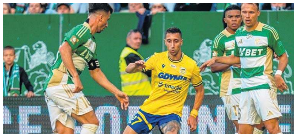
Derby Trójmiasta będą do obejrzenia z trybun praktycznie tylko dla fanów Arki

Trwa otwarta sprzedaż biletów na mecz Arka Gdynia - Lechia Gdańsk. Na trybunę rodzinną GOSiR bilety kosztują 50 zł (normalny), 40 zł (ulgowy) oraz 25 zł (dziecięcy). Na Tory bilet normalny kosztuje 60 zł, a ulgowy 50 zł. Na Górkę odpowiednio 50 i 40 zł, a na Olimpijską 65 i 55 zł. Bilet do strefy VIP to 160 zł, a VIP Gold 325 zł. ©©