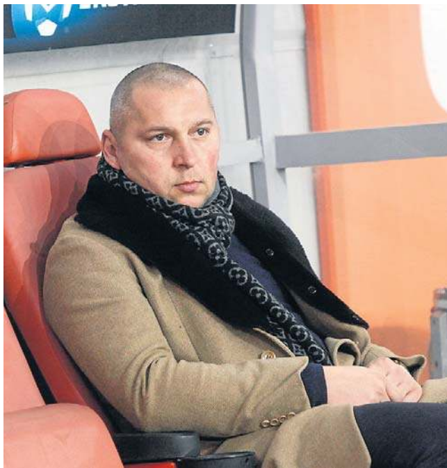
Lewandowski: Na wszystko trzeba czasu. W Legii też...

Poziom naszej ekstraklasy systematycznie się podnosi, sprowadzani są coraz lepsi piłkarze i mają coraz lepsze kontrakty. Potentaci często wydają dużą kasę na transfery,