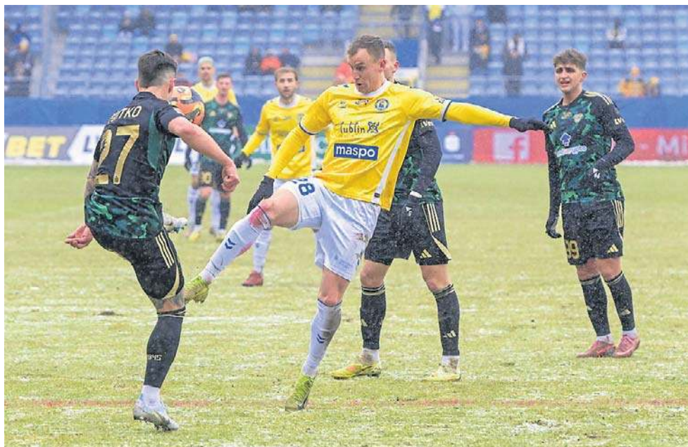
Lechia Gdańsk zasłużenie wygrała z Motorem w Lublinie