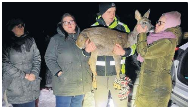
Dzięki pomocy świadków zdarzenia i pracowników ośrodka Jelonki, sarna otrzymała pomoc weterynaryjną

- Funkcjonariusze przybyli na miejsce i uwolnili samą z siatki, mając bezpośredni wgląd w jej stan zdrowia - relacjonuje zdarzenie Ośrodek Okresowej Rehabilitacji Zwierząt Jelonki - Sarna doznała rozległego, otwartego złamania kończyny - kość wystawała na zewnątrz, a dolna część kończyny utrzymywała się wyłącznie na fragmencie skóry. Mimo oczywistego, ciężkiego i zagrażającego życiu urazu, funkcjonariusze straży miejskiej odstąpili od dal-