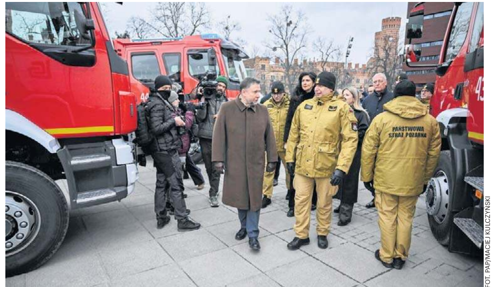
Minister Kierwiński wziął udział w odprawie ze strażakami we Wrocławiu, podczas której przedstawił inwestycje w ramach Programu Ochrony Ludności i Obrony Cywilnej

– Na Dolny Śląsk trafiło prawie 300 mln zł, ale zdajemy sobie sprawę, że to początek wielkiej drogi, która przed nami.