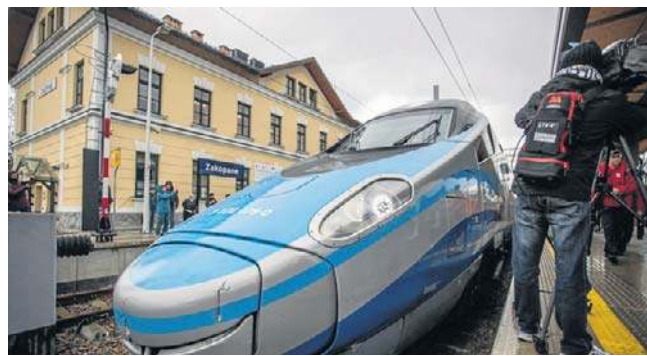
Bydgoszczanie nie będą już zazdrościli „dziobaków” mieszkańcom pozostałych miast wojewódzkich

Co skłoniło decydentów do zmiany zdania? Okazuje się, że to nie tylko kwestia transportu, ale przede wszystkim potężnego impulsu gospodarczego. Rząd uznał, że planowane gigantyczne inwestycje w bydgoską branżę IT - w tym budowa Międzynarodowego Centrum Przetwarzania Danych oraz powstanie „Tech-Hubu Bydgoszcz” - czynią z naszego miasta jeden z najważniejszych punktów na gospodarczej mapie nie tylko Polski, ale i całej Europy Środkowej.