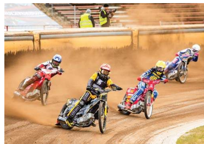
Abramczyk Polonia nie dała szans na swoim torze drużynie Bayersystem GKM. Dzisiaj rewanż w Grudziądzu

Wczorajsze zawody rozpoczęły się od bardzo mocnego uderzenia Abramczyk Polonii, która najpierw dwa razy wygrała 4:2, a potem 5:1 i objęła prowadzenie 18:6! Po 8. wyścigu Bayersystem GKM zbliżył się na 6 pkt. (27:21), ale w kolejnych dwóch startach Bydgoszczanie ponownie dominowali na torze, wygrali podwójnie i praktycznie zapewnili sobie zwycięstwo w sparingu - było 37:23. W końcówce poloniści