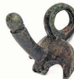
Amulet znaleziony w Borach Tucholskich

Takie przedmioty noszono najczęściej przy pasie, na szyi albo przy elementach stroju. Wierzono, że chronią właściciela przed nieszczęściem. Jak podkreślają badacze, w staro-