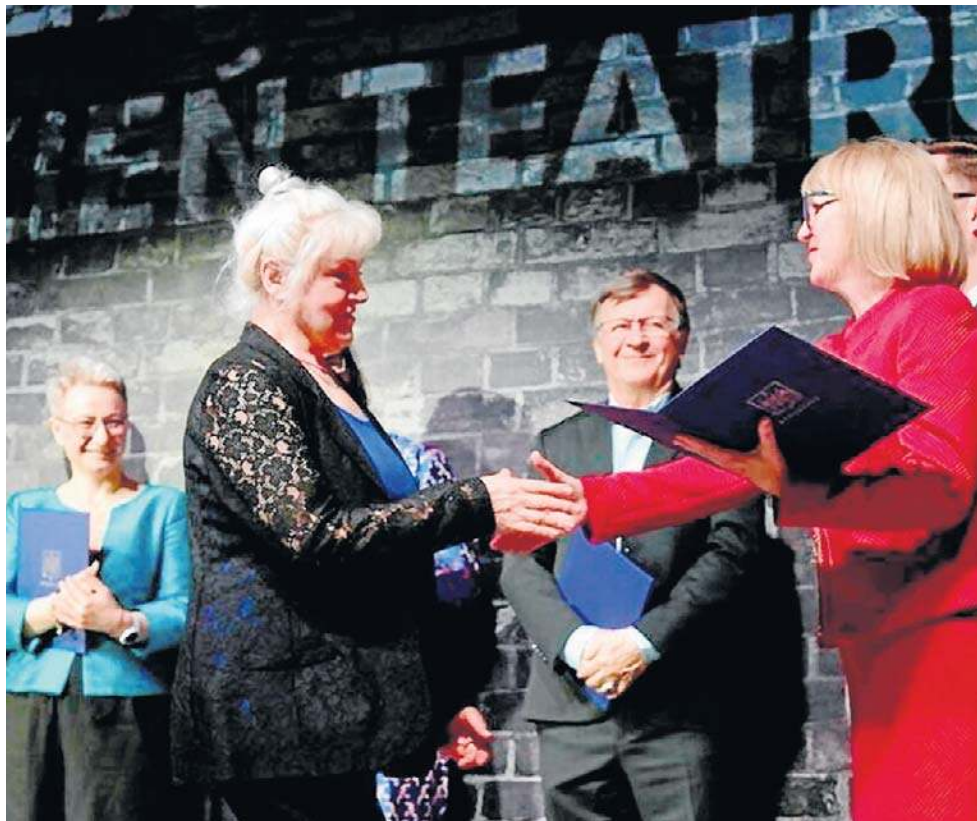
Ludzie związani z działalnością teatralną w Bydgoszczy otrzymali wyróżnienia na gali

- Życzę wszystkim związanym z teatrem sukcesów i satysfakcji. Jestem przekonana, że kolejny Międzynarodowy Dzień Teatru świętować będą