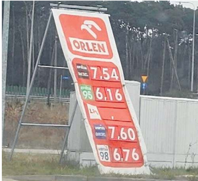
We wtorek w Pawłótku PB95 kosztowała jak na większości stacji w regionie 6,16 zł, a diesel - 7,54 zł

Sprawdziliśmy, jak wczoraj kształtowały się ceny benzyny i diesla w Kujawsko-Pomorskim.