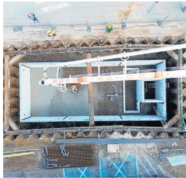
Trwa projekt „Bydgoszcz zielono-niebieska”. W niektórych miejscach prace zaczynają się, w innych kończą się

W ramach pierwszego pakietu zadań inwestycyjnych prace planowane są jeszcze na Raclawickiej, Podchorążych, Lubelskiej, Nakielskiej i Inowro-