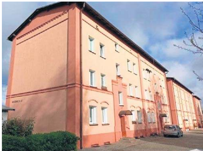
Lokale w Toruniu i Bydgoszczy od PKP - są za nieco ponad 200 tysięcy złotych

W Toruniu PKP aktualnie ma w ofercie dwupokojowe mieszkanie przy ul. Urzędniczej 12/6. Ten lokal na Podgórzu mieści się na drugim pię-