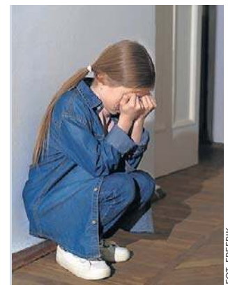
Dziewczynki mogą być nadmiernie grzeczne

- Rozpoznanie i zrozumienie własnych cech to nie tylko ulga, ale też szansa na życie w większej zgodzie ze sobą. Diagnoza nie zamyka, lecz otwiera na nowe możliwości, relacje i świadome dbanie o siebie - podsumowuje psychiatra Konrad Jurczakowski.