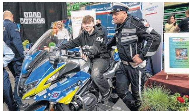
Bydgoskie szkoły ponadpodstawowe w atrakcyjnej formie przedstawiły swoją ofertę edukacyjną

Wydarzenie, organizowane przez Miasto Bydgoszcz, adresowane było przede wszystkim do młodzieży z klas VII i VIII szkół podstawowych. Ci ostatni już niebawem będą musieli podjąć decyzję: w której szkole dalej się uczyć? Odpowiedź na to pytanie miał im ułatwić udział w Bydgoskim Forum Szkół CV 2026. Młodzież mogła nie tylko porozmawiać z przedstawicielami szkół ponadpodstawowych i dowiedzieć się wielu ciekawych rzeczy dotyczących nauki w danej szkole. Uczniowie mogli też uzyskać informację o możliwościach rozwijania tam swoich zainteresowań i pasji. Była okazją do rozmów