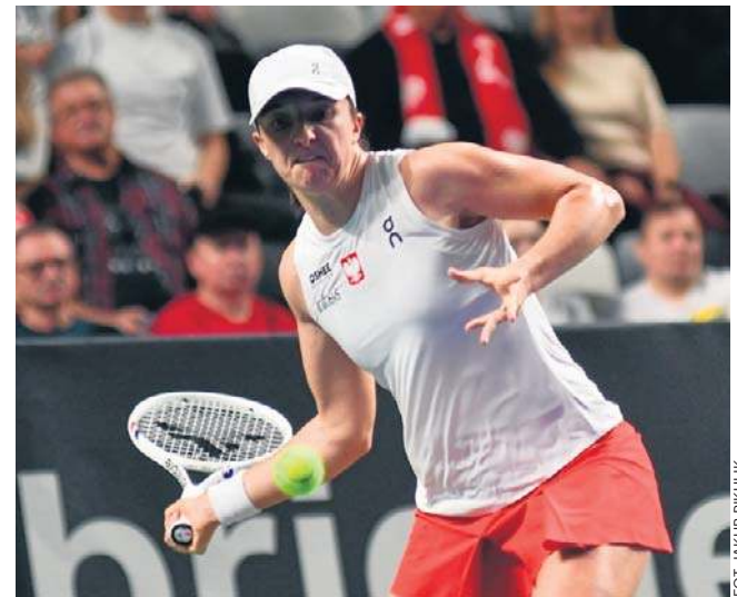
Iga Świątek zrezygnowała z gry w reprezentacji Polski w meczu przeciwko Ukrainie w Billie Jean King Cup