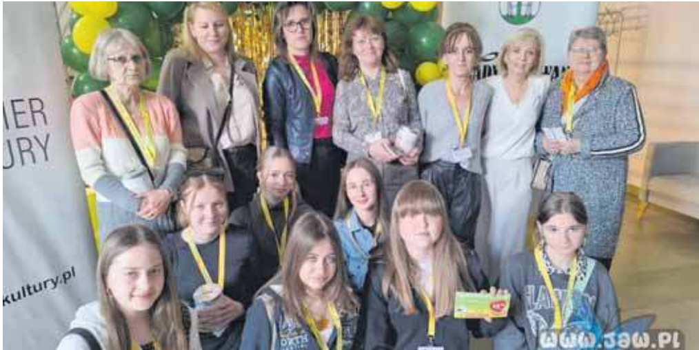
Wolontariusze jaworznickego hospicjum

J aworznicke Hospicjum Homo-Homini im. św. Brata Alberta po raz 21. zainaugurowało akcję Pola Nadziei. Wydarzenie miało miejsce na scenie ATELIER Kultury w Jeleniu w niedzielę 15 marca.