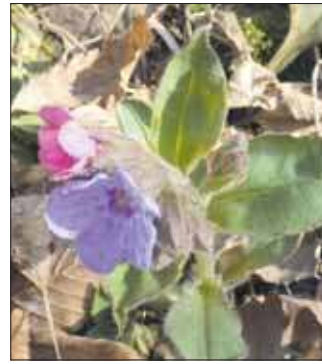
Miodunka ćma, Babia Góra, Szklary