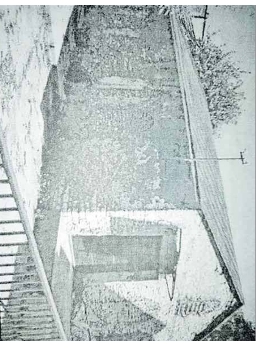
Bożnica przy ul. Stojajłowskięgo – stan 2003 rok

W potoczny m języku dnia codziennego słowo fusyt jest określeniem rozpowszechnionym. Oznacza zaś osobę wybredną, grymasną, wybrzydającą przy stole. Bardzo często kierowane było i jest do dzieci. Używali go niegdyś dziadkowie czy rodzice. Do dziś jest zresztą znane i używane. Co jednak ma wspólnego z Jaworzniem?