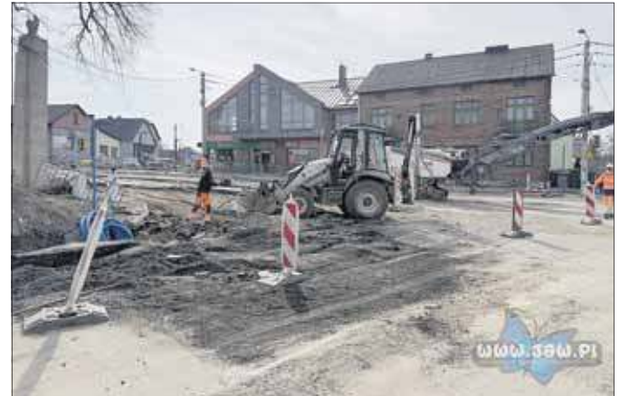
Przebudowa głównego skrzyżowania w Byczynie

W Byczynie trwa przebudowa głównego skrzyżowania oraz starodroża. Prace z tygodnia na tydzień postępują, a teraz na skrzyżowaniu ulic Krakowskiej, Abstorskich i Gwardzistów wprowadzono ruch wahadłowy, który sterowany jest sygnalizacją świetlną. Docelowo w tym miejscu ma powstać rondo.