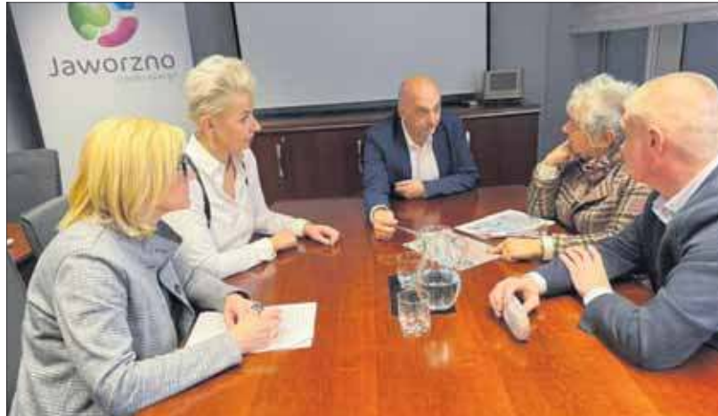
Spotkanie w sprawie przyszłości dworca w Szczakowej.

– Opowiedziałam mu o tym dworcu, o tym, jak wiele emocji budzi i jak ważny jest dla mieszkańców. To nie jest zwykły budynek, ale część lokalnej historii i tożsamości. Cieszę się, że przyjechał, zobaczył to miejsce i że rozpoczęły się rozmowy.