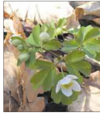
Zdrojówka rutewkowata, rezerwat Dolina Szklarki

niejsze było wiosenne kwiatowe uderzenie. Oczywiście wzgórze, lasy, pola skałki oraz rezerwat będący przy okazji obszarem Natura 2000 też są ważne.