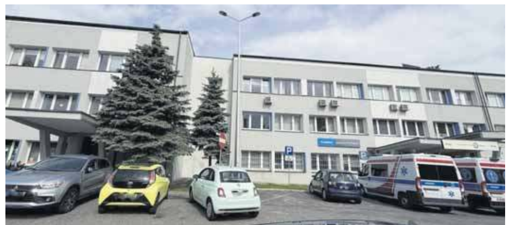
Przychodnia Elvita przy ulicy Gwarków

Elvita Jaworzno będzie realizować rehabilitację kardiologiczną dla pacjentów Szpitala Uniwersyteckiego w Krakowie. Spółka wygrała konkurs ofert ogłoszony przez szpital. Dzięki temu osoby po zawale serca zyskają dostęp do specjalistycznej rehabilitacji w sanatorium w Ustroniu.