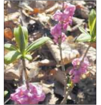
Wawrzynk wilczyłyko, Babia Góra, Szklary

niez trzy gatunki chrobotków. Na jednej ze skałek rozłożył się pięciolistkowy pięciornik piaszkowy. Dalej z okazałych drzew na szczególną uwagę zasłużyła zdziczała grusza domowa.