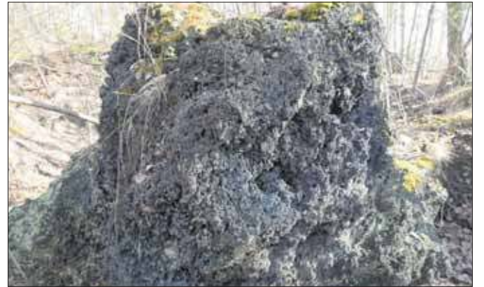
Czarne Skalki, Wapniówka