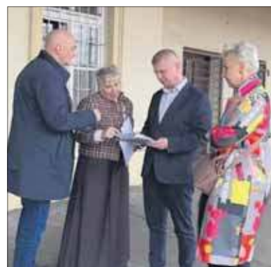
Spotkanie w sprawie przyszłości dworca w Szczakowej

Na razie szczegóły i postanowienia trzymane są w tajemnicy, ale po rozmowach pojawiła się zapowiedź zmian.