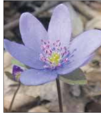
Przylaszczka pospolita, Babia Góra, Szklary

Do celu szliśmy ulicą Batorego. Teren zasadniczo jest piaszczysty. Po drodze dominują lasy z przewagą sosny zwyczajnej. Z drzew liściastych trafiły się gatunki obcego pochodzenia jako to robinia akacjowa oraz dąb czerwony. Są też rodzime brzozy brodawkowate. Piaszczysty grunt jest zdominowany przez mchy, raczej typowe i pospolite jak dla tego rodzaju terenu. To po prostu skalniczek siwy oraz pędzliczek wiejski. Zniżywszy się do ich poziomu, zauważyłem chrobotka z gatunku Cladonia foliacea. W drodze do osadników nie zaszły istotne zmiany. Tutaj bliżej prawego brzegu Koziego Brodu dominuje inwazyjny rdestowiec japoński. Na powierzchni osadnika także nie zaszły istotne zmiany. Są olsze czarne, są skupiska trzęślicy modrej z kruszczykami błotnymi. Obecnie największym zagrożeniem dla tego zbiorowiska jest spontaniczna sukcesja sosny zwyczajnej. Centralne miejsce zajmuje brzezina. W jej cieniu wyróżniają się żużlowe spieki nazywane przeze mnie czarnymi skałkami. Teraz na jednej z nich zauważyłem okazałą zanokcicę mурową. Z mchów trafił się rokiet cyprysowy. Pojawiły się rów-