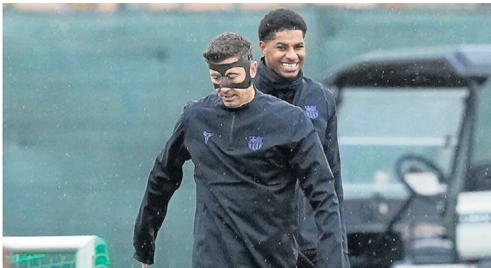
Robert Lewandowski w masce ochronnej i Marcus Rashford szykują się na strzelaninę na St. James' Park w meczu Newcastle United - Barcelona o ćwierćfinał Ligi Mistrzów

Większość meczów na ławce spędza Wojciech Szczęsny. Były reprezentant Polski pełni rolę rezerwowego i gra tylko, gdy nie może zagrać Joan Garcia. Lewandowski i Szczęsny we wtorek zmierzają się na St. James' Park z Newcastle. Średniak z Anglii jest groźny, zwłaszcza u siebie. W ostatnim meczu ligowym „Sroki”, ograły Manchester Uni-