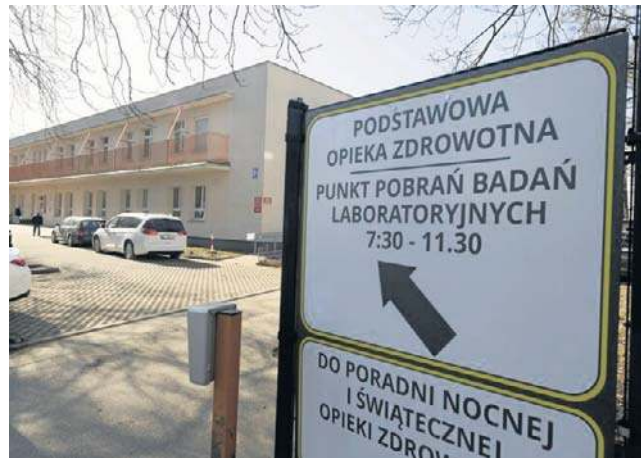
Zakład Pielęgnacyjno-Opiekuńczy działał przy ul. Wołodyjowskiego 2/1. Obecnie są tu szpitalne poradnie

W pierwszej kolejności na terenie Śniadecji powstanie nowy, czterokondygnacyjny budynek, do którego mają przenieść się