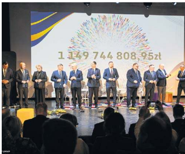
O efektach programu PROW 2014-2020 oraz nowych kierunkach wsparcia dla rolnictwa i obszarów wiejskich rozmawiano wczoraj podczas konferencji w OIFP

- Dzięki temu najważniejsze rzeczy, które mieliśmy do zro-