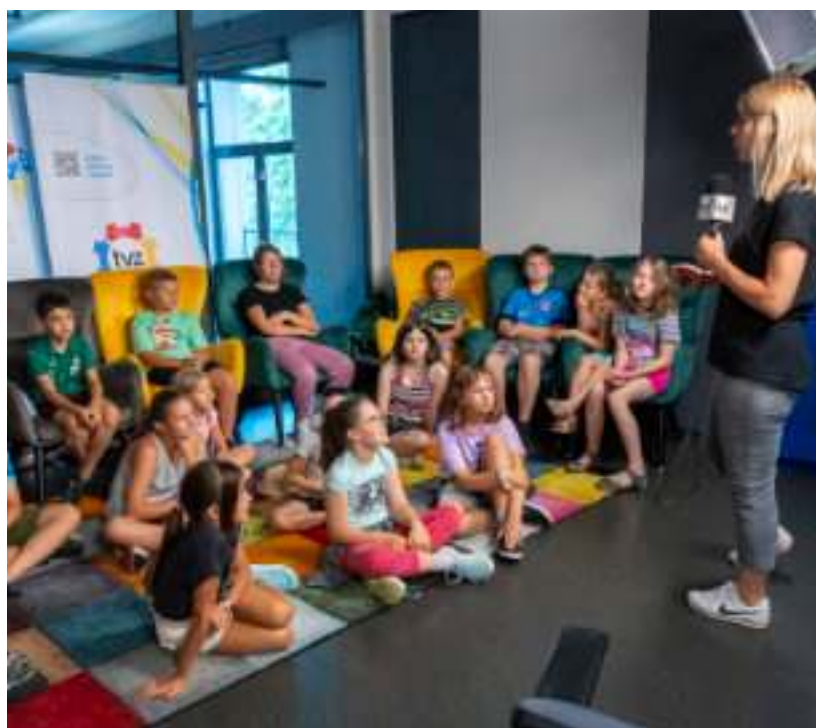
► Uczestnicy półkolonii w studiu Telewizji Zabrze

Janek. Do wypoczynku zachęca również geopark w Grzybowicach i nowo otwarte tężnie solankowe w Kończycach i Maciejowie. MM