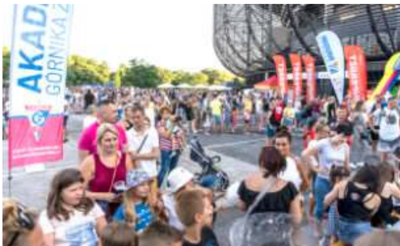
► Rodzinny piknik na promenadzie Areny Zabrze

W letniej przerwie działacze Górnika starali się aktywnie penetrować piłkarski rynek. Efektem tych poczynań było sprowadzenie do Zabrza 30-letniego środkowego obrońcy - Greka, Konstantinosa Triantafyllopoulosa. Piłkarską karierę zaczynał on w Panathinaikosie Ateny. Od sezonu 2019/2020 grał w