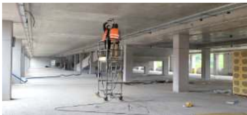
► Trwają roboty instalacyjne wewnątrz centrum