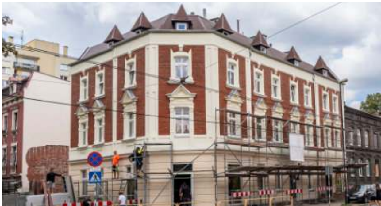
► Z kamienicy przy ul. 3 Maja 71 znikają wykorzystywane podczas remontu rusztowania

Dawny blask odzyskała kolejna kamienica w centrum naszego miasta. Tym razem to budynek przy ul. 3 Maja 71.