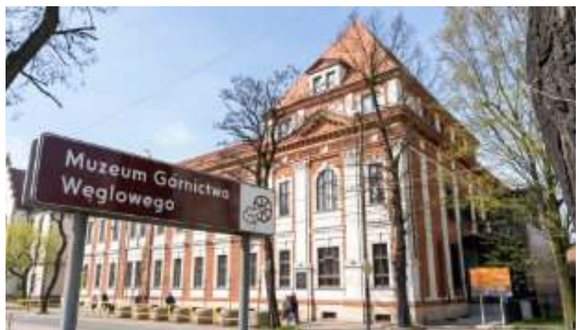
► Pierwsze starostwo a obecnie siedziba MGW przy ul. 3 Maja

w Rokitnicy. Na realizację tej inwestycji Zabrze również pozyskało dofinansowanie ze środków zewnętrznych. Od ubiegłego roku zachwyca z kolei kompleksowo odrestaurowany gmach Muzeum Górnictwa Węglowego przy ul. 3 Maja, w którym przed laty mieściła się siedziba pierwszego starostwa. GOR