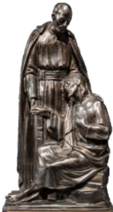
► Wręczana laureatom statuetka

- Jesteśmy dosyć małym zespołem, ale o szerokim zakresie działalności, bo operujemy nie tylko serca najmniejszych pacjentów, od noworodków po dorosłych z wro-