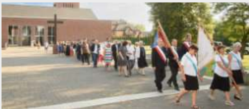
► Ubiegłoroczne uroczystości w Kończycach