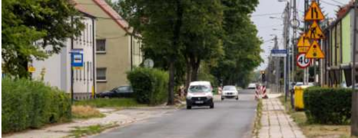
► Ulica 11 listopada zostanie wyremontowana

ZABRZE POZYSKAŁO DOFINANSOWANIE NA REMONT KOLEJNEJ DROGI