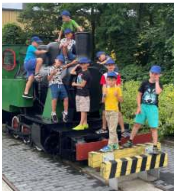
► Młodzi zabranie nie mogą narzekać na wakacyjną nudę