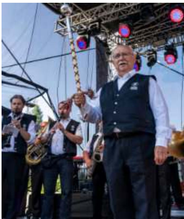
► Orkiestra Muzeum Górnictwa Węglowego