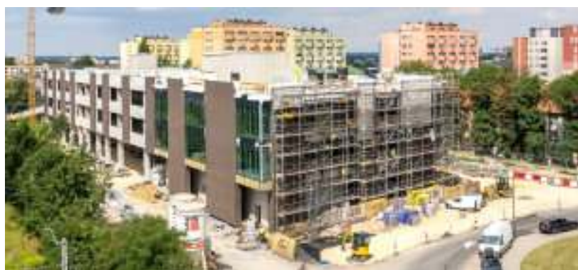
► Na budynku pojawiają się pierwsze elementy elewacji