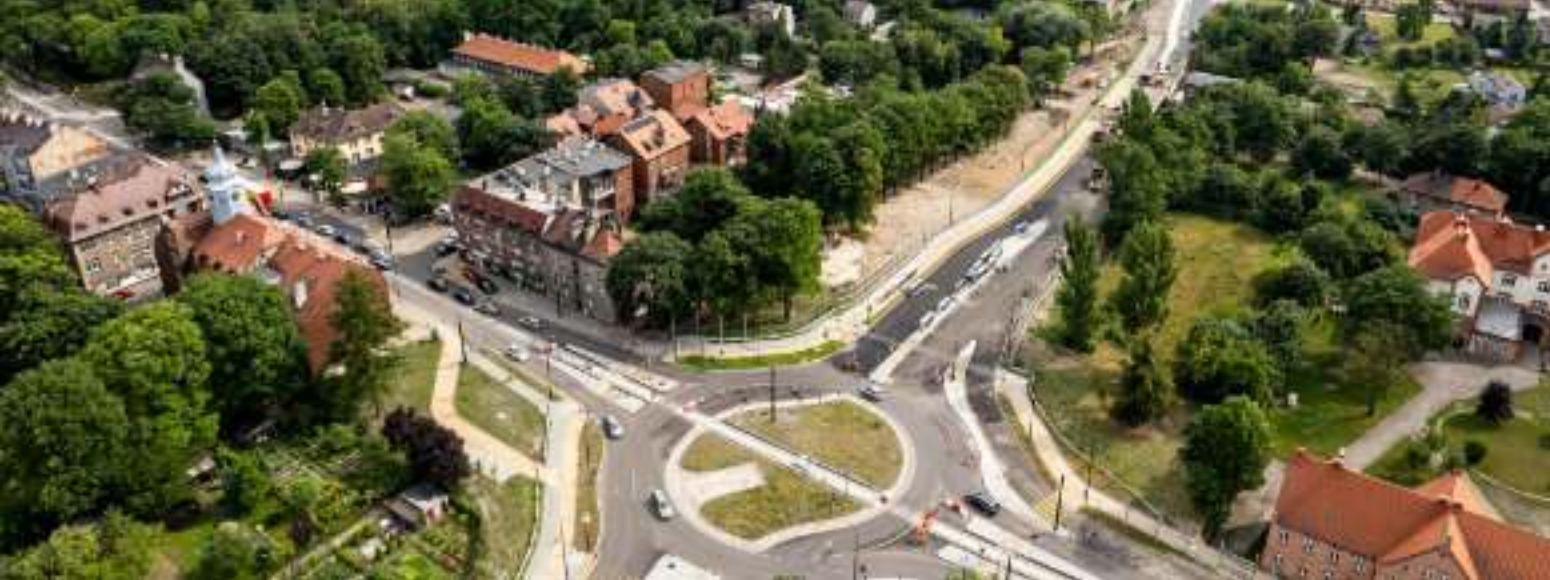
► W ramach inwestycji powstało m.in. rondo