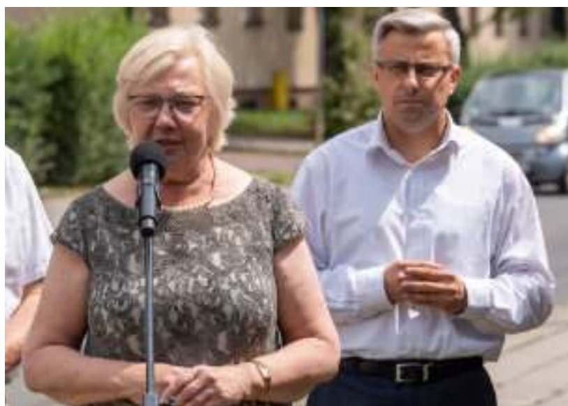
► Prezydent Małgorzata Mańka-Szulik i wojewoda śląski Jarosław Wiczołek

go, wymianę oznakowania pionowego, odtworzenie oznakowania poziomego, usunięcie 55 drzew zachodzących w skrajnie drogową i nasadzenie nowych drzew. Zgodnie z opracowaną dokumentacją remont skosztorysowano na 3,4 mln zł. Zadanie otrzymało 50 procent dofinansowanie z Rządowego Funduszu Rozwoju Dróg. GOR