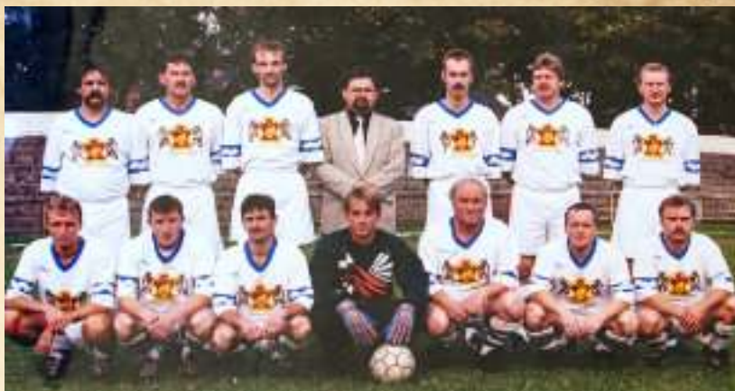
► 1997 r. Drużyna Arsenalu Mikulczyce na boisku Sparty Zabrze