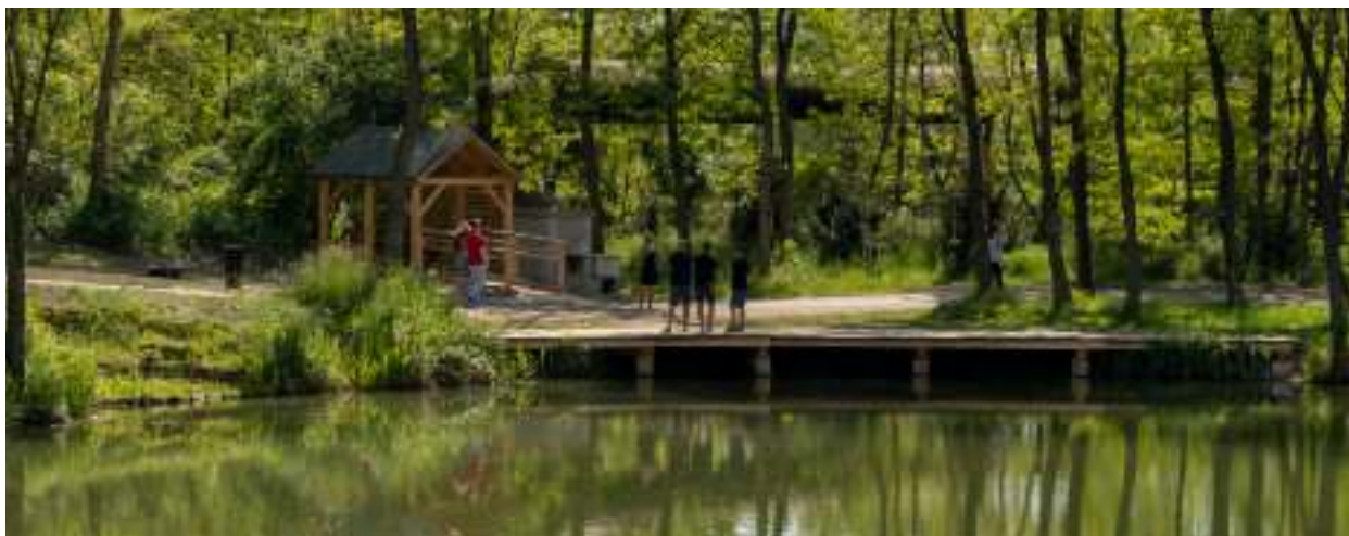
► W kompleksie czekają m.in. oczyszczone stawy

Dwa kilometry alejek do spacerowania, oczyszczone stawy, pomosty widokowe i stacjonarne grille to niektóre z atrakcji geoparku w Grzybowicach. Zreultywowane wyrobisko gliny stało się niezwykłym terenem rekreacyjnym, który warto odwiedzić podczas wakacji.