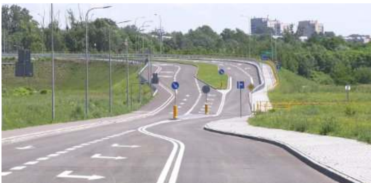
► Nowy układ drogowy w sąsiedztwie Drogowej Trasy Średnicowej

Równoległa do Drogowej Trasy Średnicowej droga łącząca Zaborze Południe z Zaborzem Północ i Porembą w lipcu została oddana do użytku. Nowa infrastruktura nie tylko ułatwi życie kierowcom, ale także umożliwi dojazd do znajdujących się nieopodal terenów inwestycyjnych należących do koncernu IKEA. To właśnie ta firma sfinansowała wartość prawie 50 mln zł przedsięwzięcie.