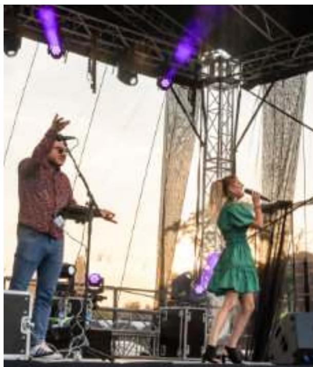
► Zespół „Piękni i Młodzi”