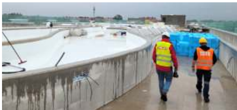
► Na dachu obiektu powstanie ogólnodostępny ogród