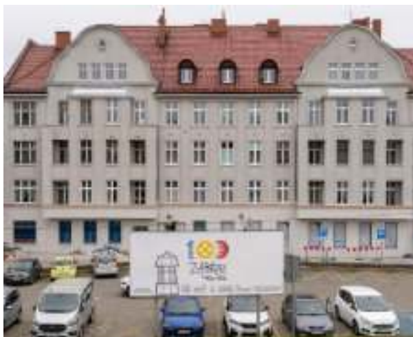
► ...i przy placu Dworcowym