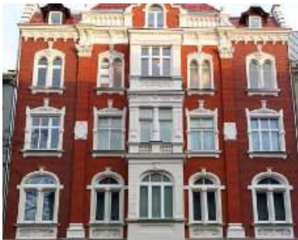
► Odnowiona kamienica przy ul. 3 Maja 6...