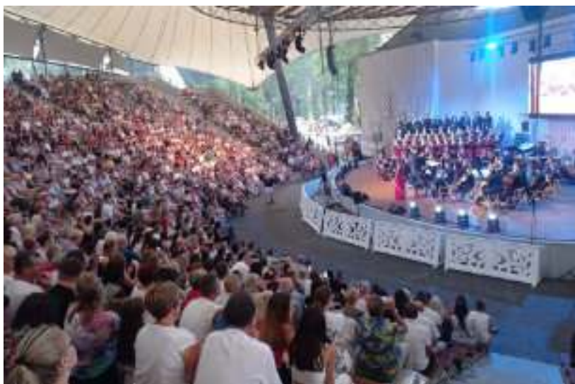
► Chór Resonans con tutti w Amfiteatrze pod Grójcem