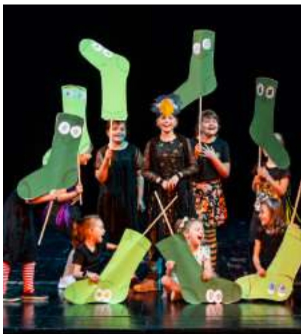
► Spektakl przygotowany przez uczestników warsztatów „Lato z teatrem”