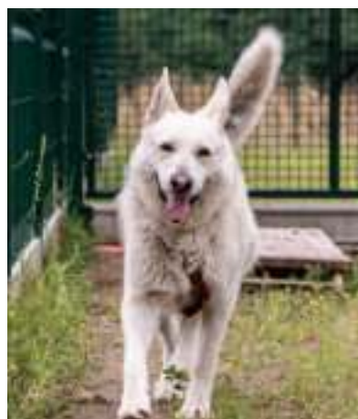
► Tu aż chce się biegać

Przypomnijmy, że budowa nowego schroniska kosztowała ponad 19 mln zł. Aż 17,6 mln zł Zabrze pozyskało z Rządowego Fun-