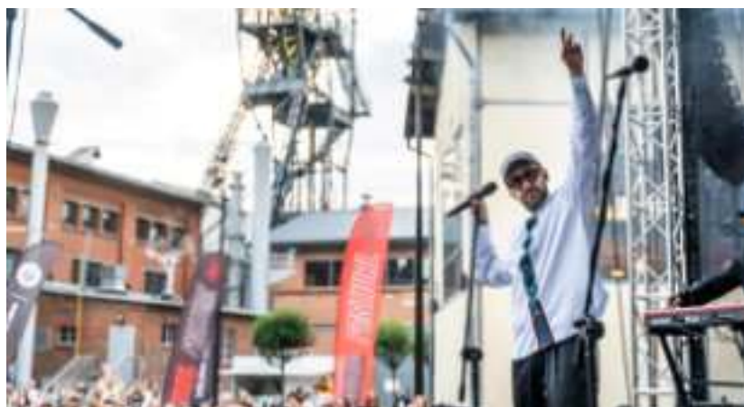
► Strefa Carnall Sztolni Królowa Luiza

stąpiły gwiazdy muzyki disco-polo. Na scenie usłyszeliśmy Pięknych