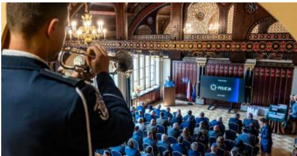
► Uroczystość odbyła się w Sali Witrazowej Muzeum Górnictwa Węglowego

W odrestaurowanej Sali Witrazowej gmachu Muzeum Górnictwa Węglowego przy ul. 3 Maja odbyły się zabrzańskie obchody Święta Policji. Uroczystość była okazją do podziękowania za codzienną służbę oraz wręczenia awansów i nagród wyróżniającym się funkcjonariuszom.