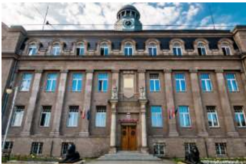
► Ratusz przy ul. Religi