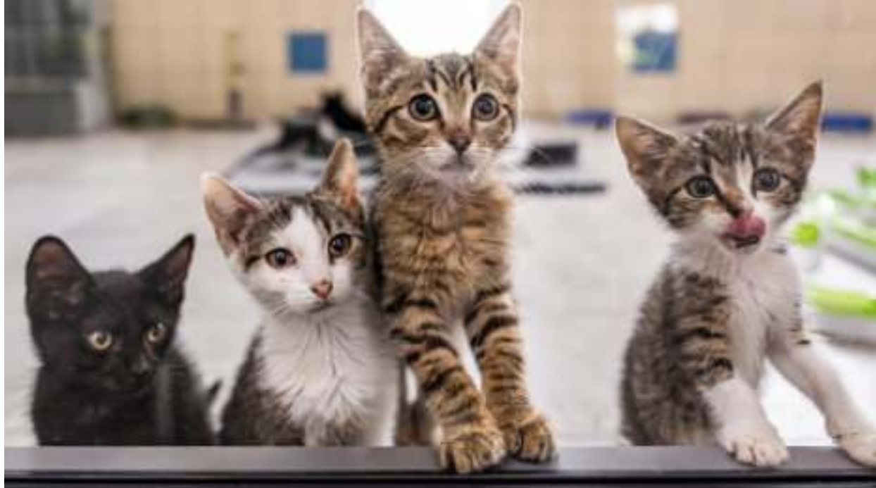
► Nowe przestrzenie szybko przypadły do gustu podopiecznym schroniska