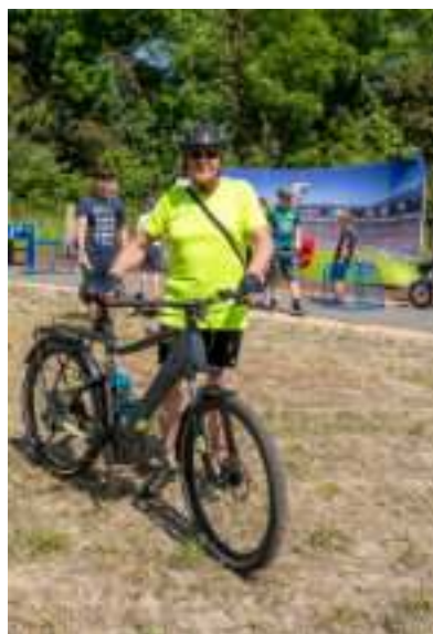
► Geopark to propozycja również dla rowerzystów

wana i wzbogacona została zielen. - To był bardzo nietypowy i trudny projekt rewitalizacji. Wy-