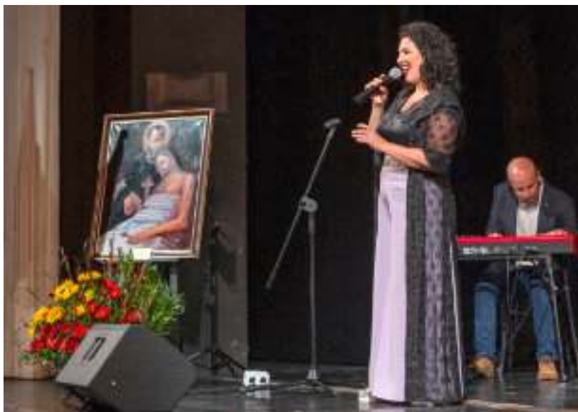
► Część artystyczna lipcowej uroczystości