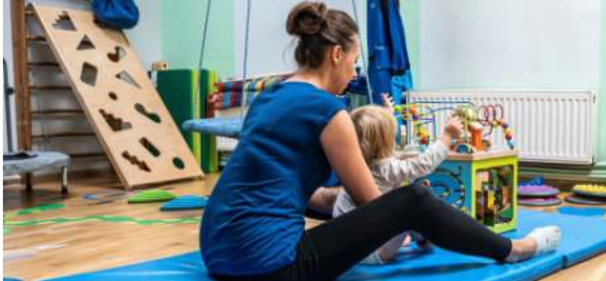
► Z ośrodka korzysta około 1,5 tysiąca osób rocznie

NOWA SIEDZIBA CENTRUM REHABILITACJI DZIECI I MŁODZIEŻY JUŻ GOTOWA