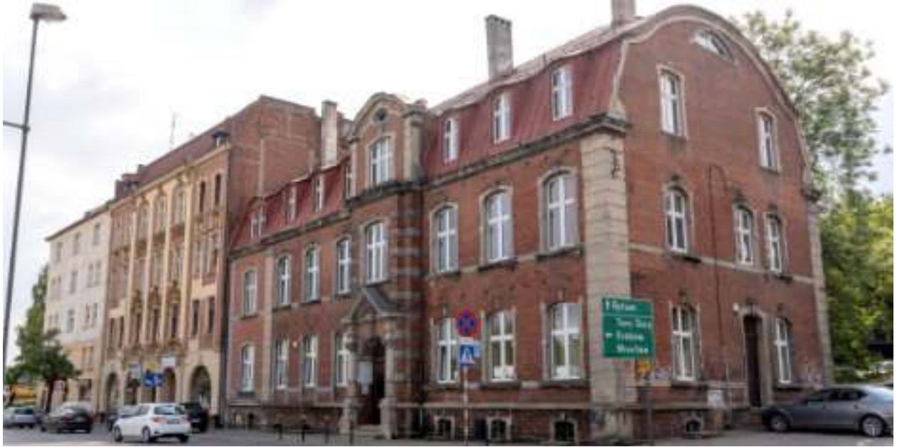
► Ratusz przy ul. Miarki