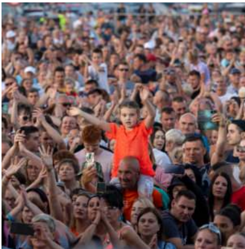
► Zabrze Summer Festival przyciąga tłumy