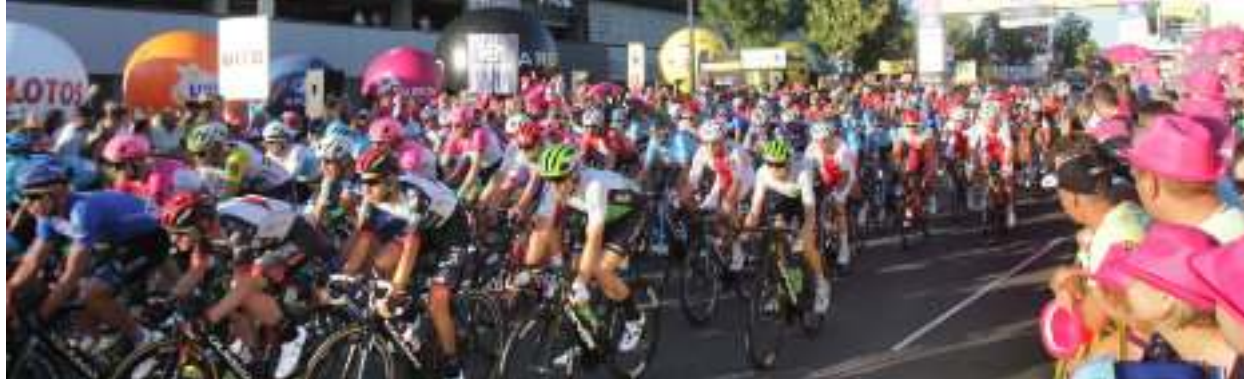
► Kolarski peleton na ulicach Zabrza

TRASA 80. EDYCJI WYŚCIGU TOUR DE POLOGNE PROWADZI PRZEZ ZABRZE