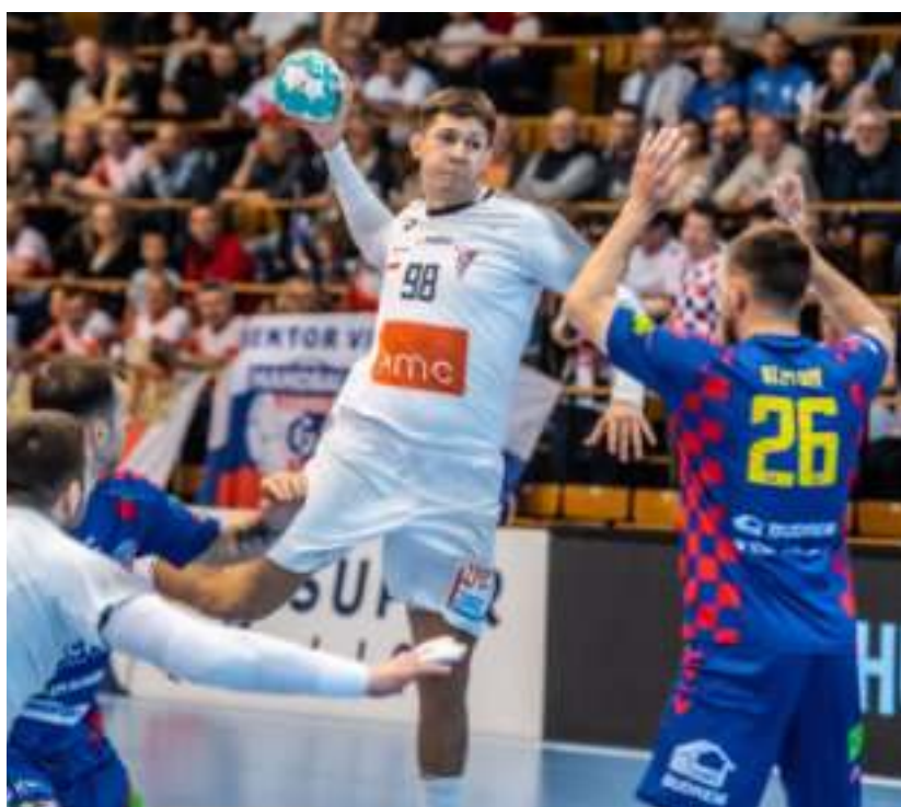
► Trzymamy kciuki za naszych szczypiornistów

Piłkarze ręczni Górnika Zabrze rozpoczną zmagania w Lidze Europejskiej od fazy grupowej. Losowanie rywali Trójkolorowych, z którymi zmierzą się w tym etapie rozgrywek, odbyło się pod koniec lipca w Wiedniu.