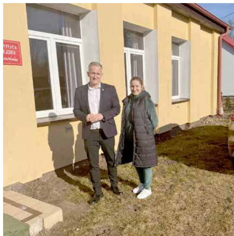
Jak widać My Wiatr spotkaliśmy się z p. sołtys