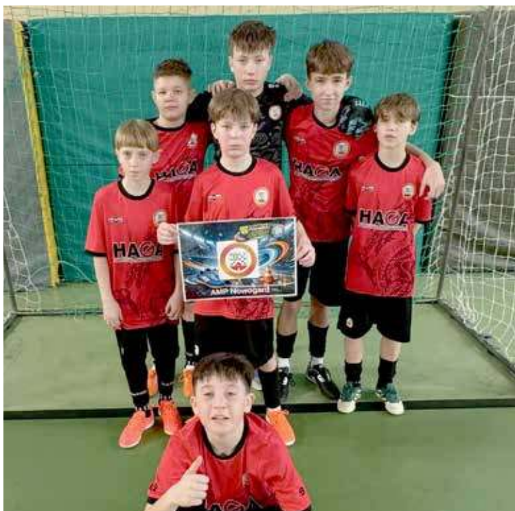
Drużyna powalczyła na parkiecie i zajęła szóste miejsce w turnieju