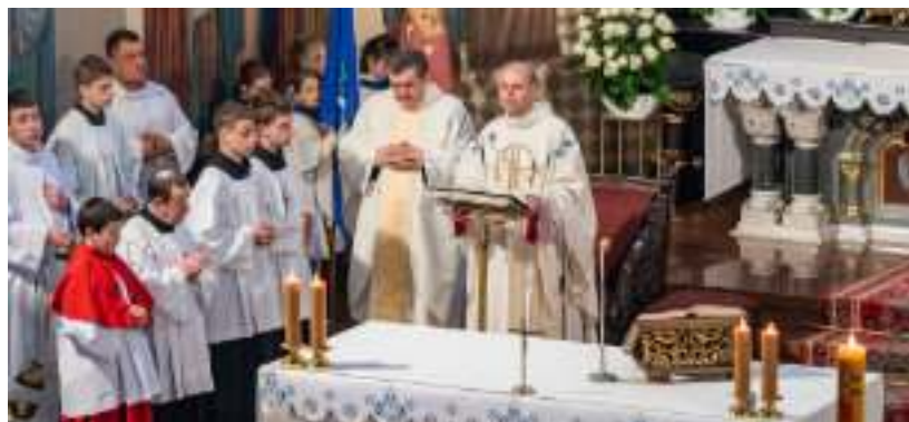
► Uroczysta msza w kościele św. Anny