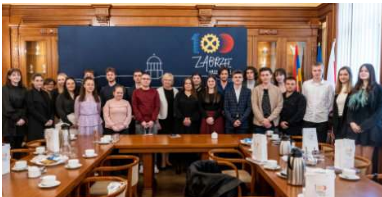
► Przedstawiciele tegorocznych maturzystów spotkali się w ratuszu z prezydent Małgorzatą Mańką-Szulik