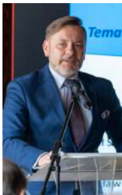
► Prezes POT Rafał Szmytke

– Pamiętam nasze pierwsze spotkania sprzed kilkunastu lat, kiedy proponowaliśmy, aby w Zabrzu rozmawiać o turystyce. Nie mieliśmy wątpliwości, że w naszym mieście możemy nie tylko rozmawiać na ten temat, ale także rozwijać turystyczną ofertę – mówi prezydent Zabrze Małgorzata