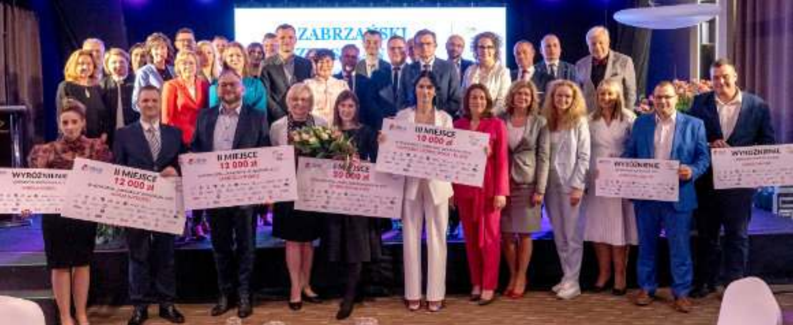
► Tegoroczni laureaci konkursu