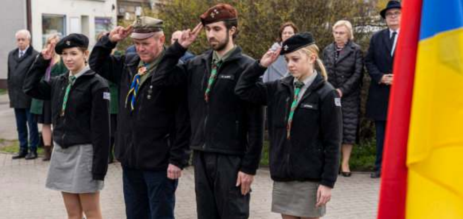
► W rocznicowych uroczystościach wzięli udział m.in. harcerze