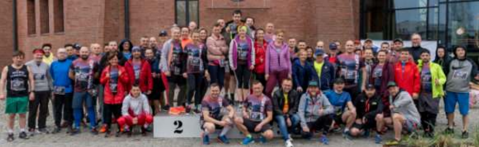
► Uczestnicy kwietniowego biegu u stóp zabytkowej wieży ciśnień

MIŁOŚNICY AKTYWNEGO SPĘDZANIA CZASU SPOTKALI SIĘ W ZABYTKOWEJ WIEŻY CIŚNIEŃ