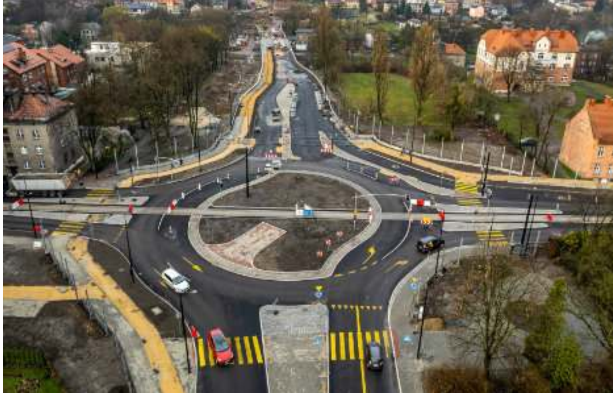
► Przedłużenie alei Korfantego ma być gotowe jesienią