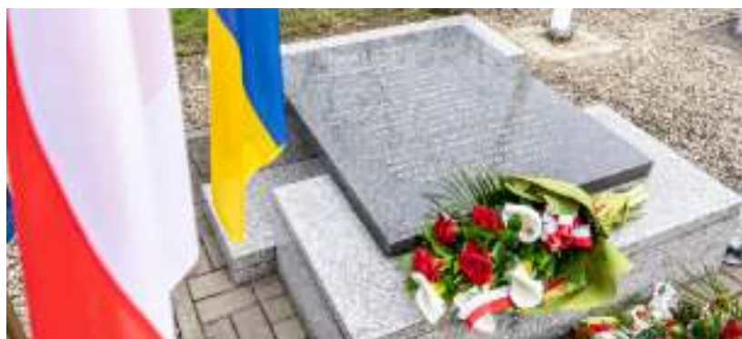
► Jedna z pamiątkowych tablic w zabrzańskim parku

rowski, wicemarszałkowie Sejmu i Senatu RP, parlamentarzyści, dowódcy Sił Zbrojnych RP, pracownicy Kancelarii Prezydenta RP, szefowie instytucji państwowych, przedstawiciele ministerstw, organizacji kombatanckich i społecznych, duchowni oraz załoga samolotu. Oba tragiczne wydarzenia upamiętniają tablice w parku przy ul. Dubiela. GOR