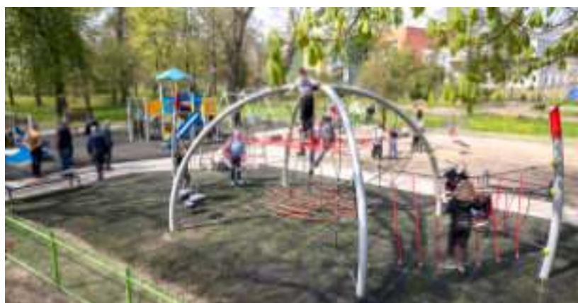
► Na placu zabaw nie brakuje efektownych urządzeń