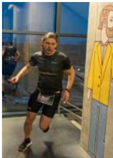
► Biegacze mieli do pokonania 7 pięter