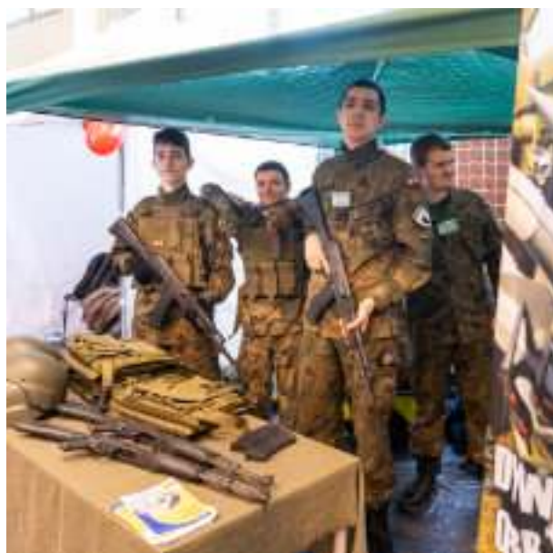
► Było coś zarówno dla miłośników militariów...