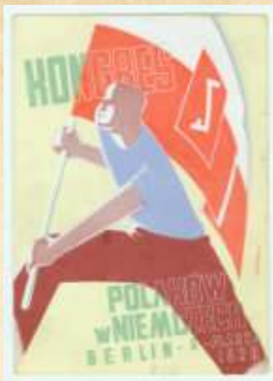
► Pocztaówka wydana z okazji Kongresu Polaków w Niemczech

Z klubów sportowych działających wśród niemieckiej Polonii wypada wymienić KS „Piast” Mikulczyce, KS „Unia” Zaborze i KS Zabrze. Ten ostatni, podczas święta sportowego młodzieży polskiej na Śląsku Opolskim, które odbyło się w Zabrze 1 czerwca 1930 r., pokonał KS Markowice 32 i zdobył tytuł mistrza piłki nożnej Śląska Opolskiego. W lutym 1936 r., kiedy to niemieccy Żydzi mieli trudności ze swobodnym uprawianiem sportu, doszło do dwumeczu drużyn tenisa stołowego KS