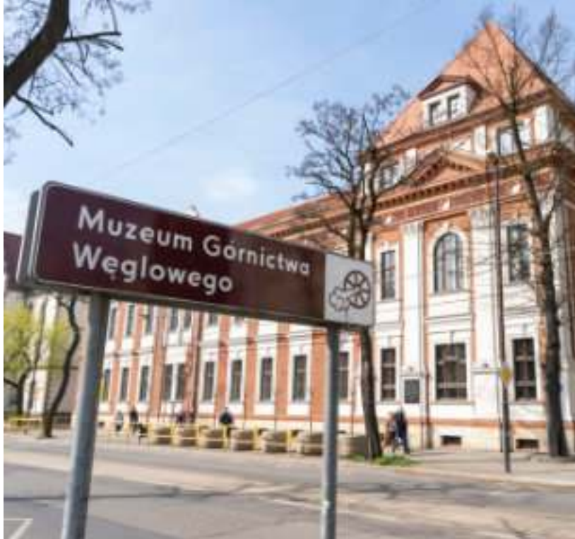
► Miejscem konferencji była wyremontowana siedziba MGW przy ul. 3 Maja