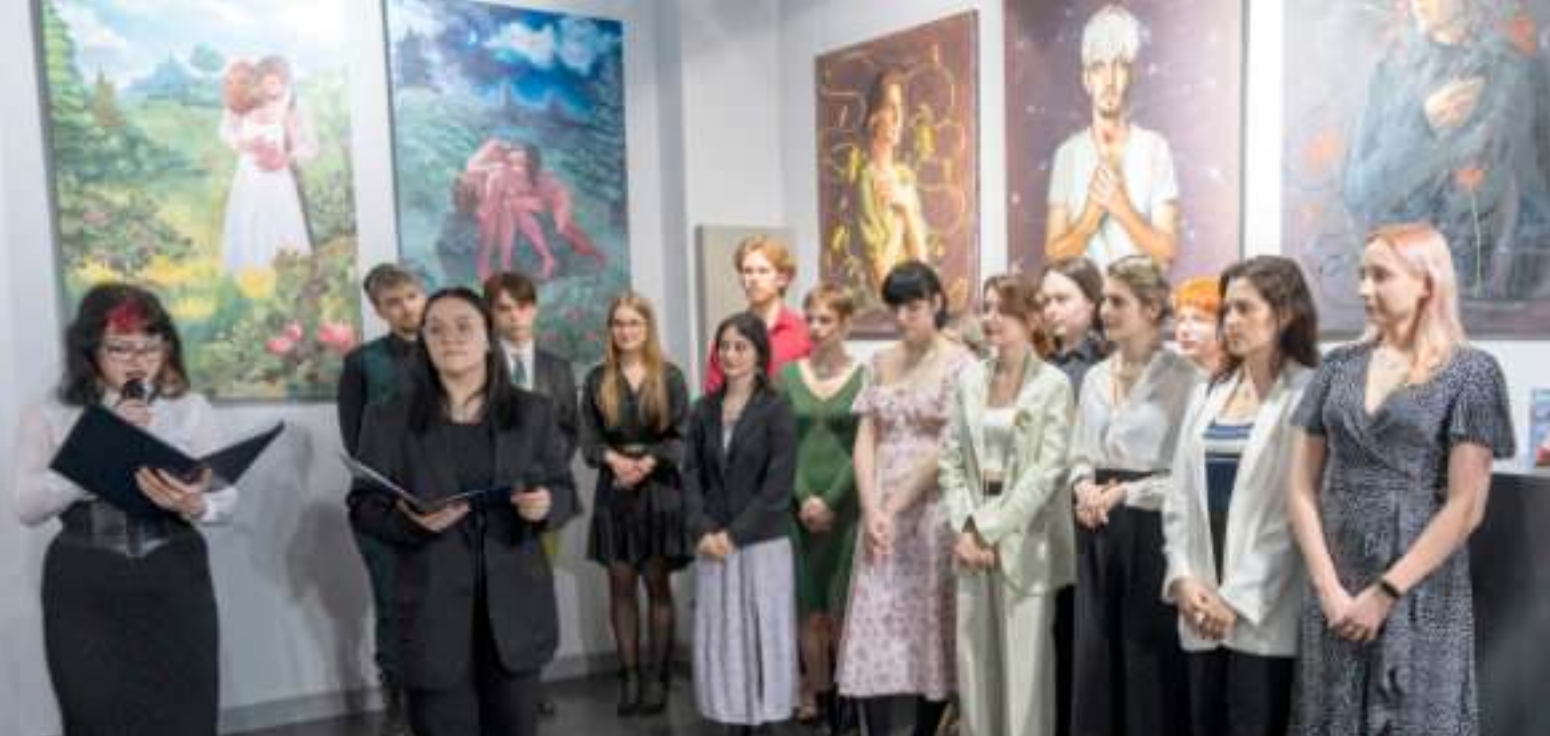
► Wernisaż wystawy w Galerii Café Silesia