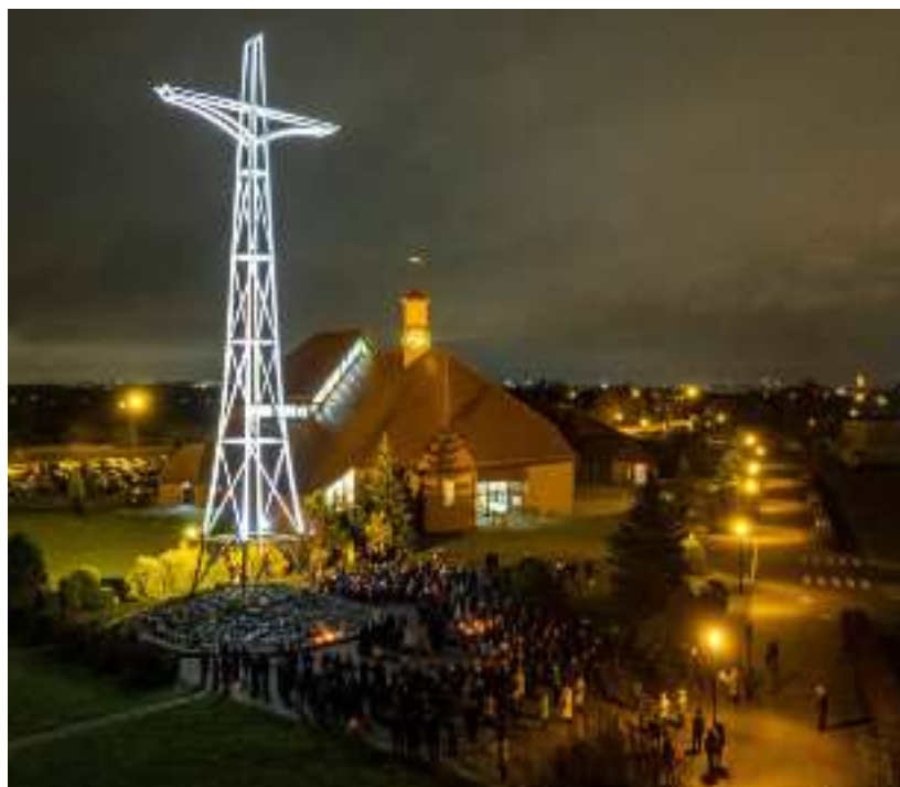
► Spotkanie pod Krzyżem Papieskim