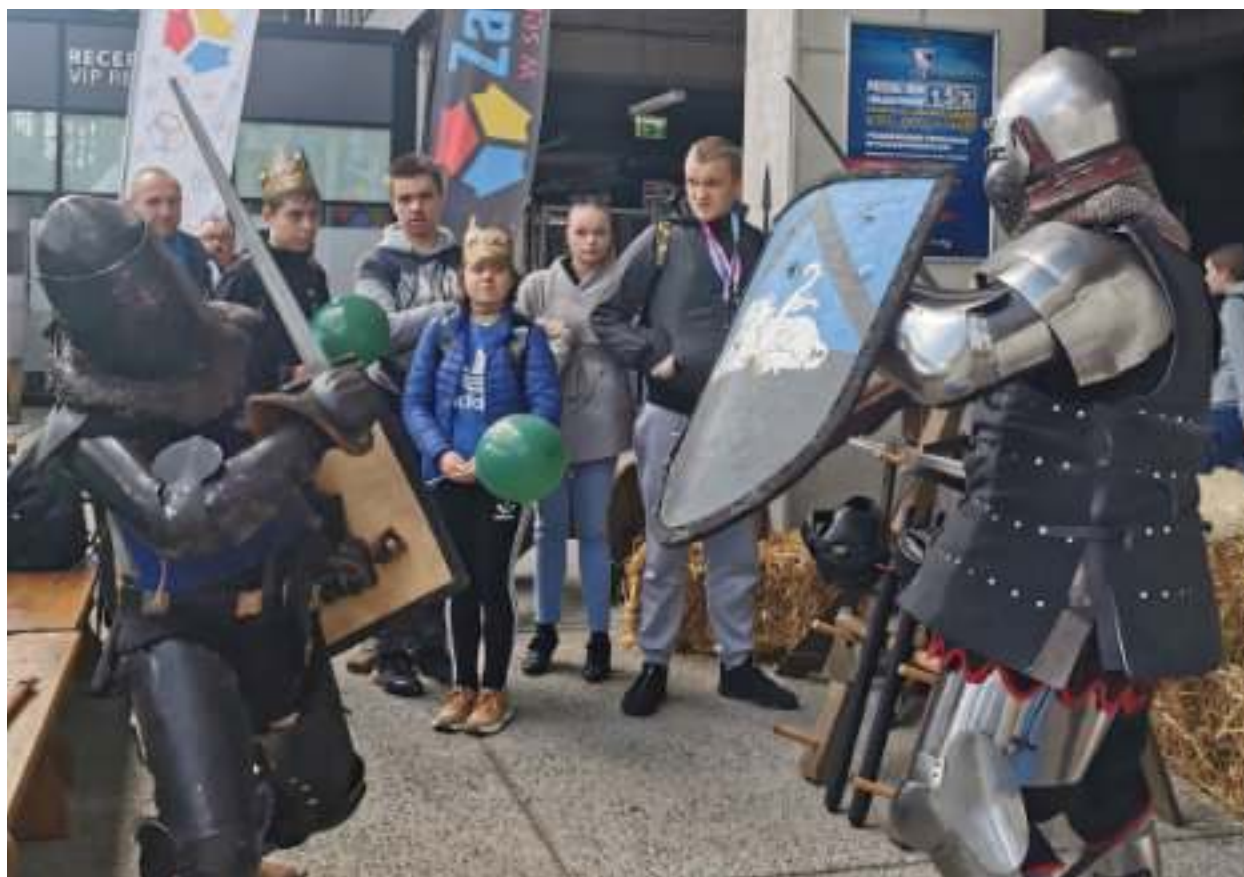
► Na stoisku Ogródzieńca można było m.in. zobaczyć pokazy walk rycerskich