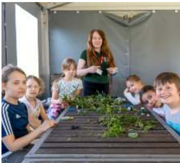
► Warsztaty ekologiczne w Parku 12C