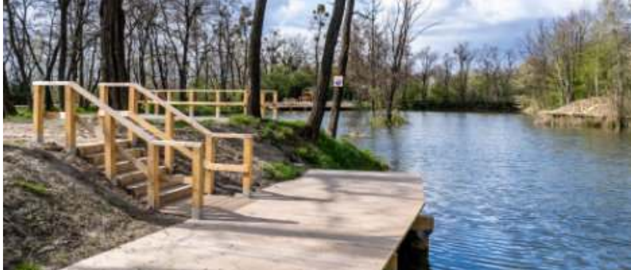
► Otwarcie geoparku zaplanowano na 1 czerwca