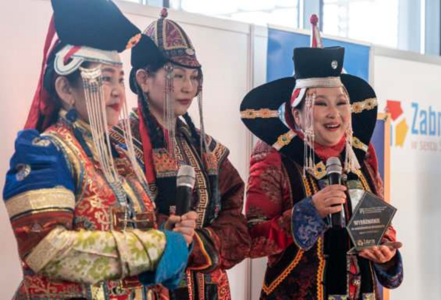
► Do swojego kraju zapraszały ubrane w tradycyjne stroje mieszkanki Mongolii

XIII MIĘDZYNARODOWE TARGI TURYSTYCZNE PRZYCIĄGNĘŁY TYSIĄCE ZWIEDZAJĄ