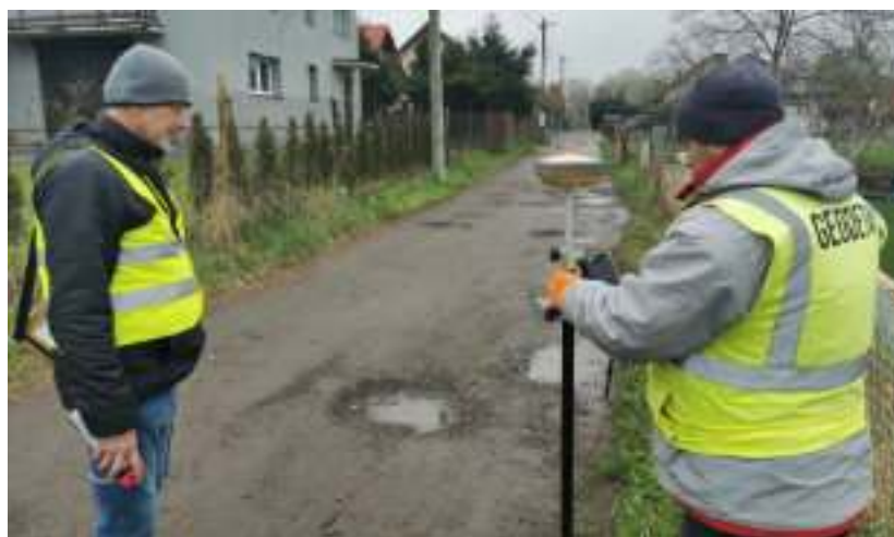
► Pomiary wzdłuż ul. Sudeckiej w Pawłowie