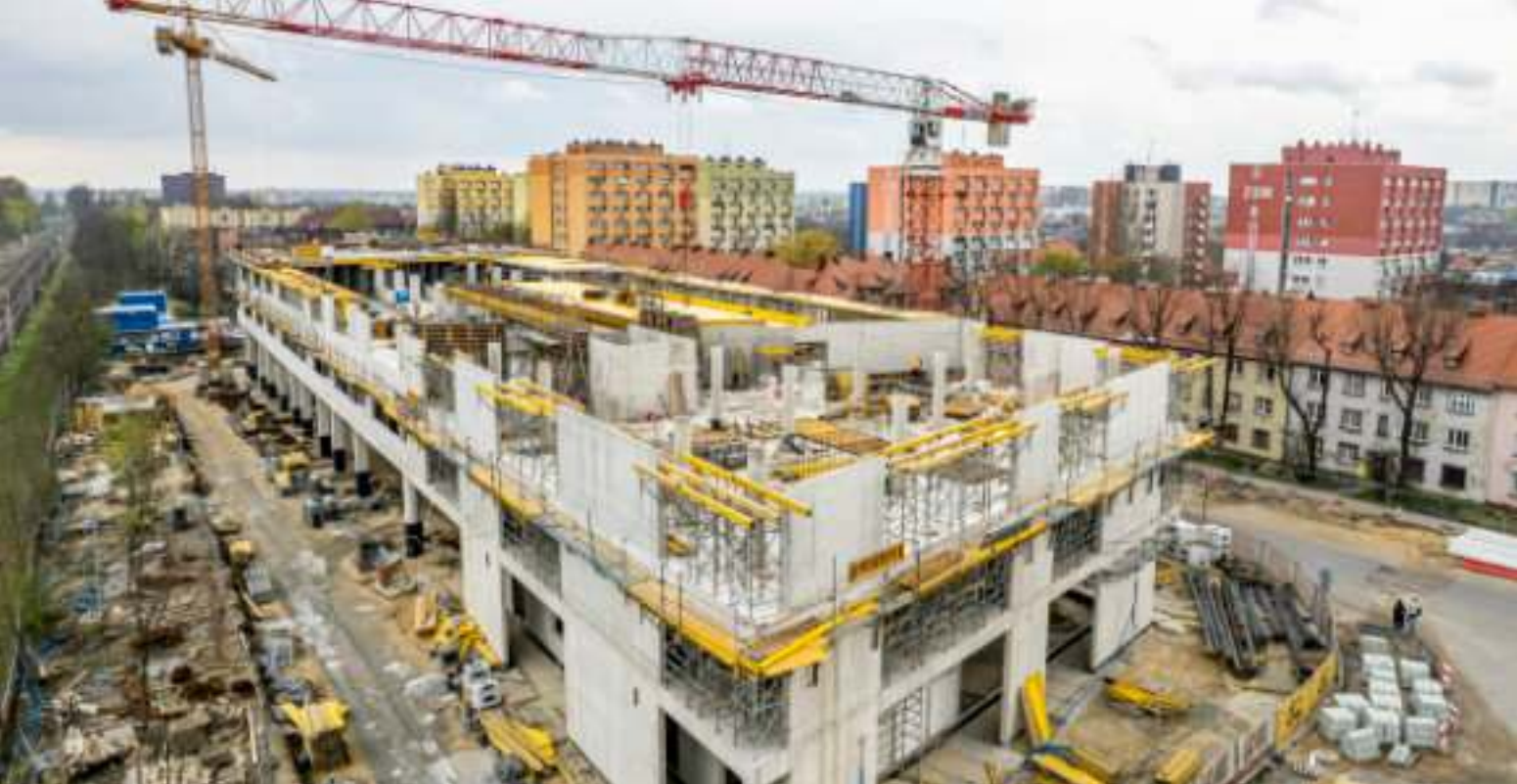
► W szybkim tempie postępują prace na budowie centrum przesiadkowego przy ul. Goethego