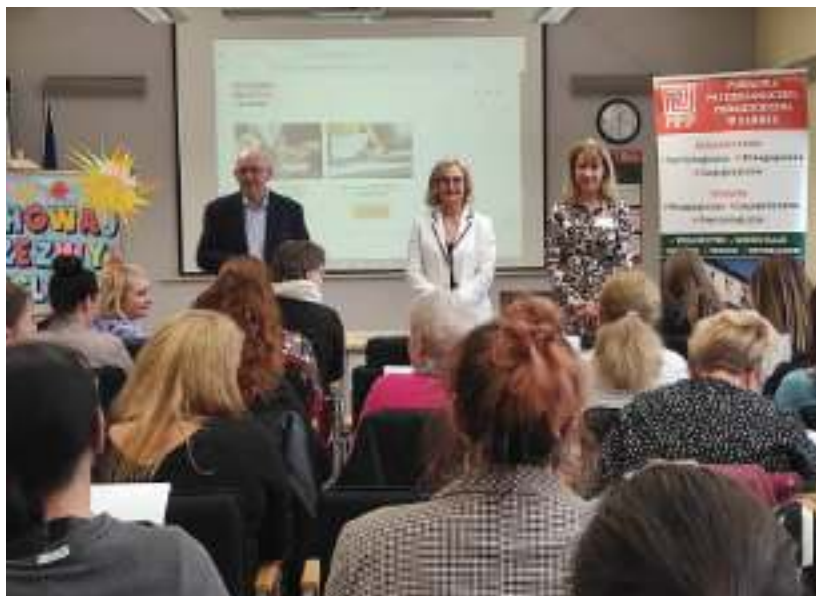
► Zabrzańscy koordynatorzy akcji podczas inauguracji tegorocznej edycji projektu

Projekt podnosi także kwalifikacje nauczycieli poprzez bezpłatne