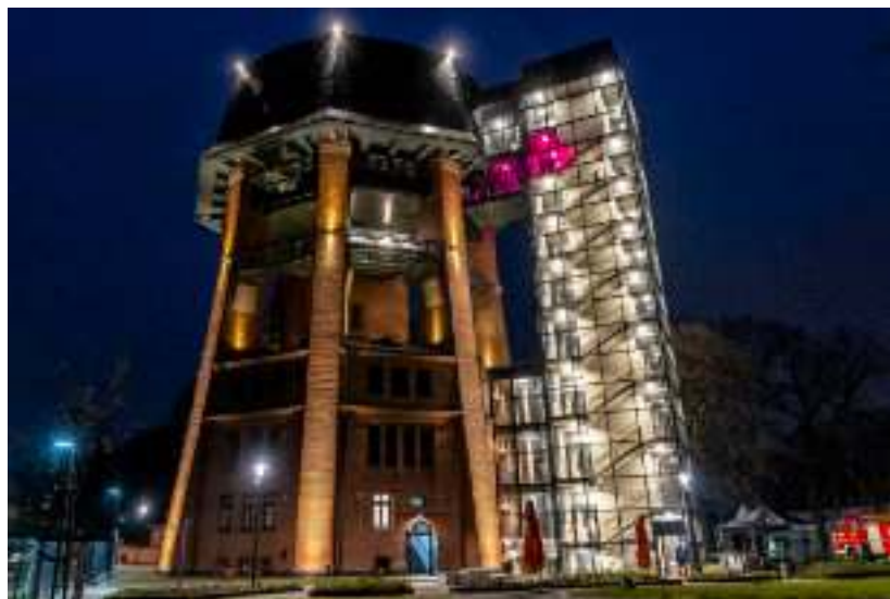
► Podświetlona wieża robi niesamowite wrażenie