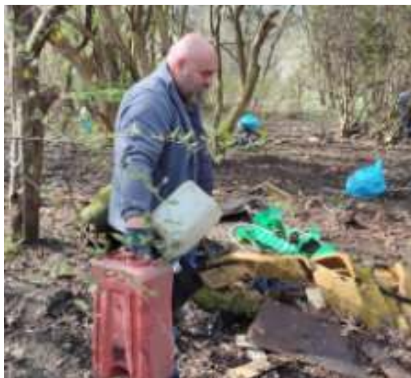
► Usuwanie dzikich wysypisk