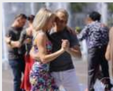
► Taneczne popisy

praszamy na bezpłatne milonga uliczne oraz spektakl w Teatrze Nowym – dodaje. Uliczne tańce zaplanowano w sobotę 27 maja w godzi-