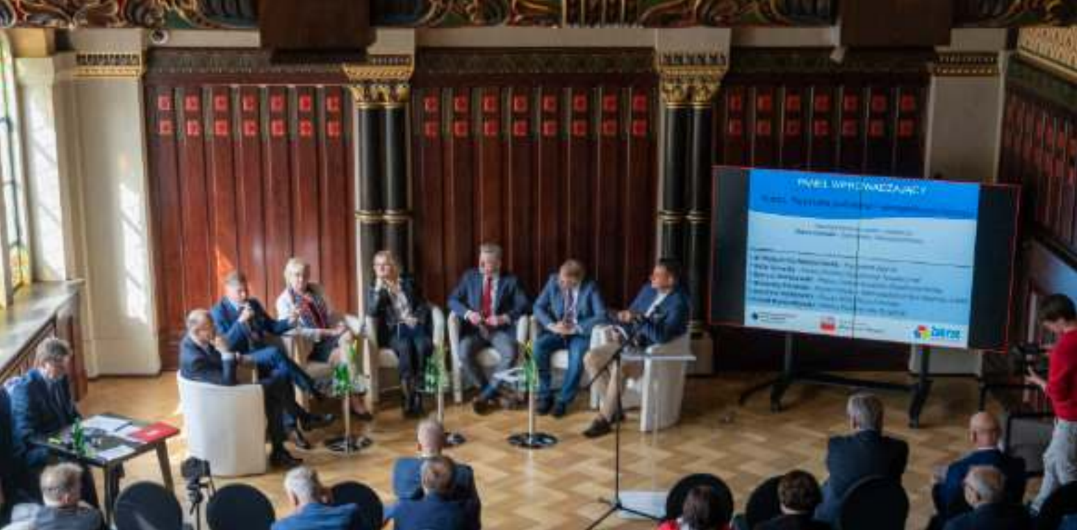
► Eksperti dyskutowali w efektywnej sali witrażowej