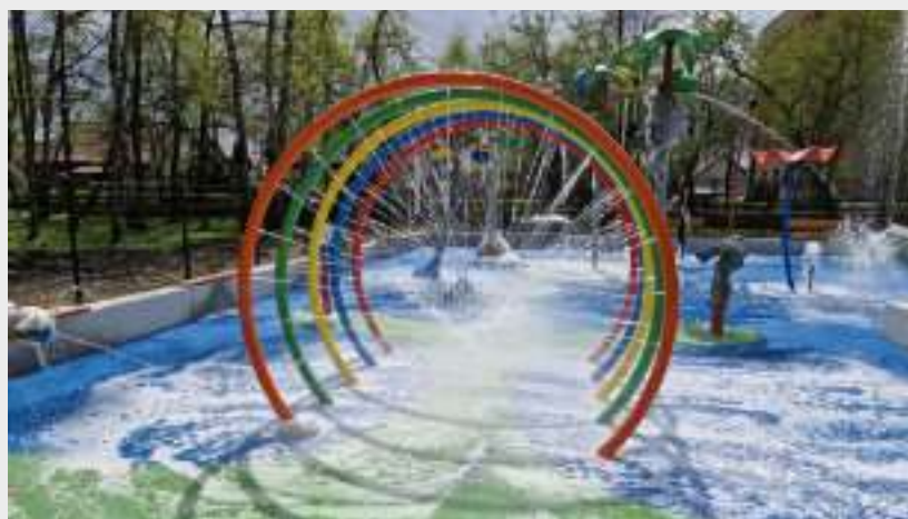
► W takim miejscu można się poczuć prawie jak na wakacjach