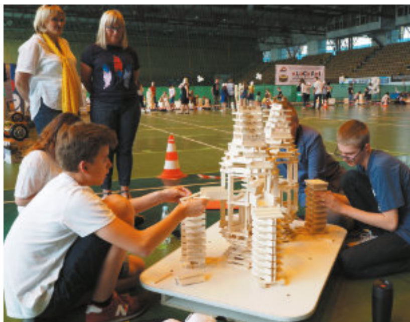
► Uczestnikom rywalizacji nie brakuje pomysłowości i precyzji