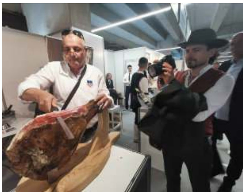
► Lokalnymi smakołykami częstowali goście z Bośni i Hercegowiny