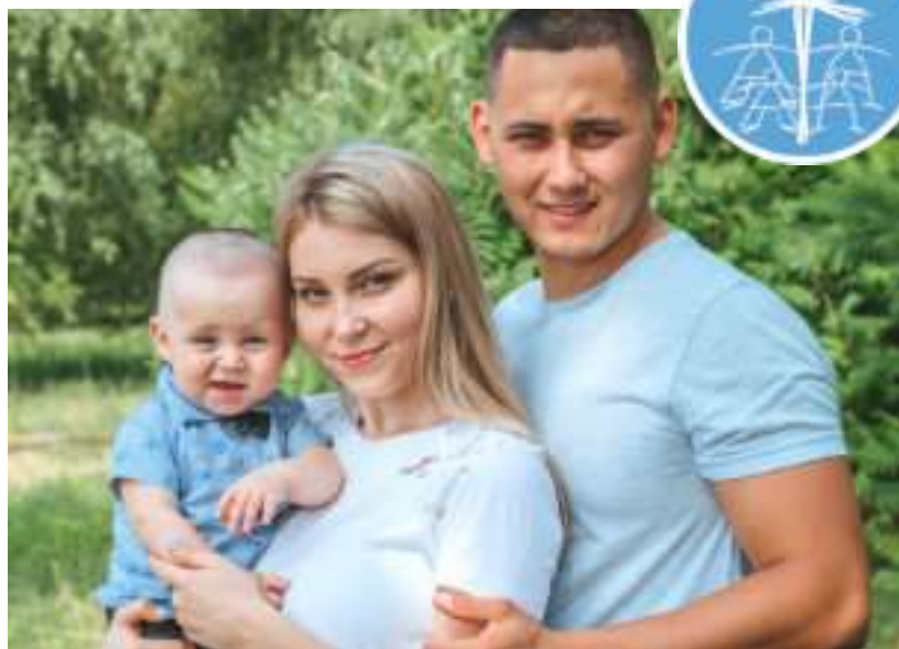
► Hasłem tegorocznej edycji MŚR są słowa „Rodzina - forum dialogu”

Hasłem tegorocznej edycji święta są słowa „Rodzina – forum dialogu”. – To właśnie w rodzinie spotykają się pokolenia, wymieniają się doświadczeniami, wzrasta się w wspólnym budowaniu świadomości