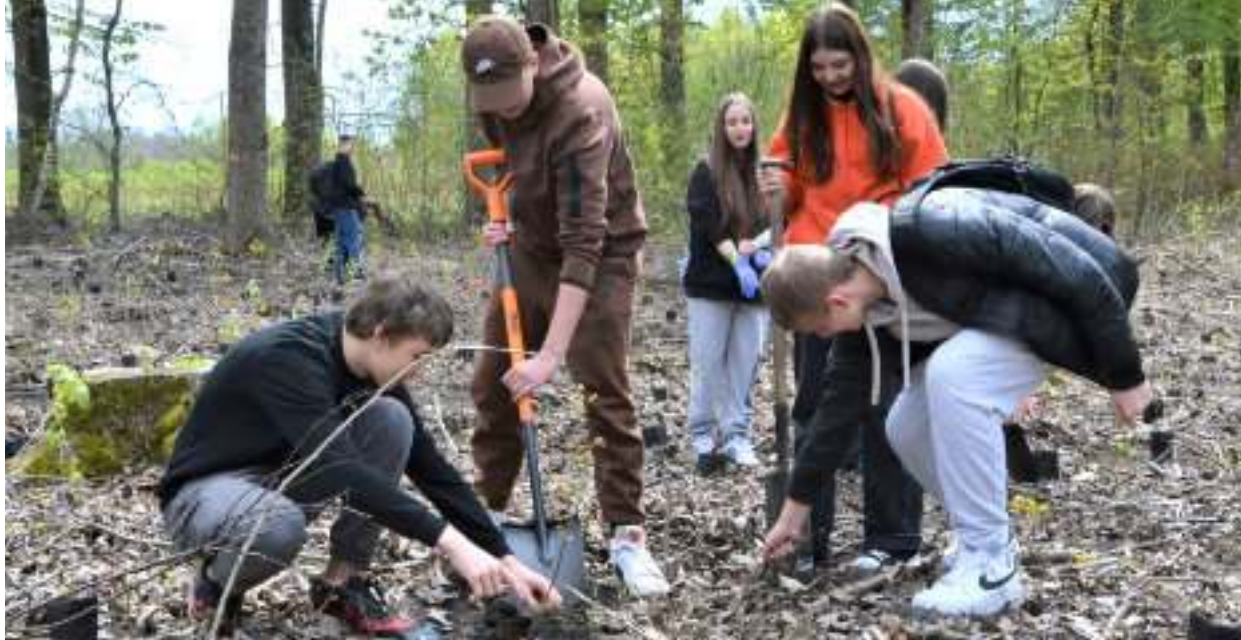
► Wiosenna akcja sadzenia drzew