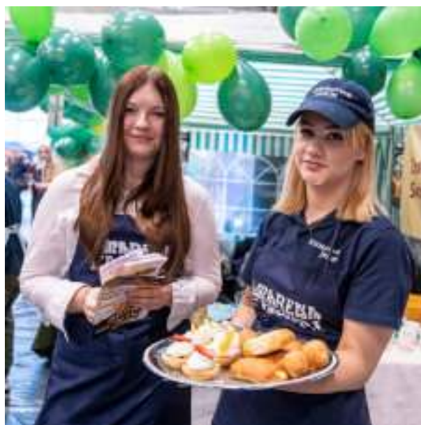
► ...jak i kierunków związanych z gastronomią