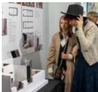
► Prace z aranżacji wnętrz

Zabrzański plastyk był pierwszą w Polsce szkołą prowadzoną przez samorząd. - Cieszę się ogromnie, że wśród wielu kierunków kształcenia ten artystyczny cieszy się w Zabrzu dużym powodzeniem i możemy oglądać piękną, dojrzałą wystawę – podkreśla prezydent Zabrze Małgorzata Mańka-Szulik. - Ta wystawa wzrusza tym bardziej, że ci młodzi ludzie z powodu pandemii musieli wiele pracy wykonać samodzielnie. Gratuluję młodzieży i rodzicom, że wspierali tych młodych ludzi i oczywiście wspaniałym pedagogom, którzy potrafią porwać do takiego działania. Wierzę, że nasi absolwenci odniosą ogromne sukcesy – dodaje.