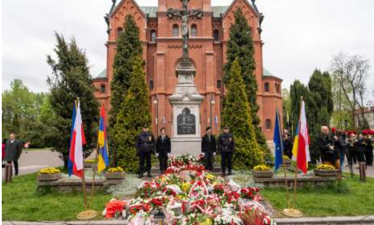
► Z okazji Święta Narodowego Trzeciego Maja przed kościołem św. Anny złożone zostały kwiaty