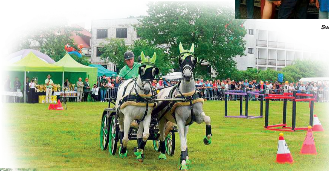
Swoje produkty oferowała Okręgowa Spółdzielnia Mleczarska z Ciechanowa

Mazowieckie Dni Rolnictwa to wyjątkowe wydarzenie, które od 25 lat buduje i wzmacnia swoją pozycję jako jedne