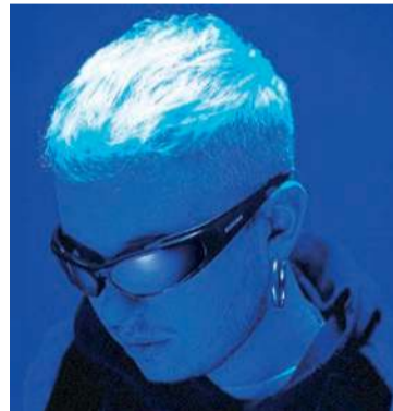
Młody raper może pochwalić się współpracą z czołowymi artystami polskiej sceny hipopowej