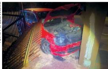
Zdarzenie na ul. Ludowej

- Jak wynika z ustaleń policjantów, kierujący samochodem osobowym marki Skoda Fabia, 36-letni mieszkaniec powiatu ciechanowskiego, zjechał z drogi i uderzył w ogrodzenie jednej z posesji. Mężczyzna miał w organizmie 2,5 promila alkoholu. Na miejsce zdarzenia skierowano patrol policji. Podczas interwencji funkcjonariusze przeprowadzili badanie stanu trzeźwości kierującego. Alkomat wykazał ponad 2,5 promila alkoholu w organizmie