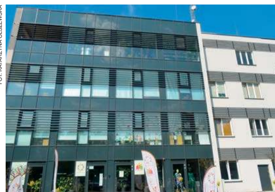
To jedyna na Mazowszu placówka, sprawująca pieczę zastępczą nad chorymi dziećmi. Mieści się w nowoczesnym i dostosowanym do potrzeb dzieci obiekcie.

W otwartym konkursie ofert na prowadzenie placówki wybrano Fundację Odzyskać Radość. Jest to organizacja