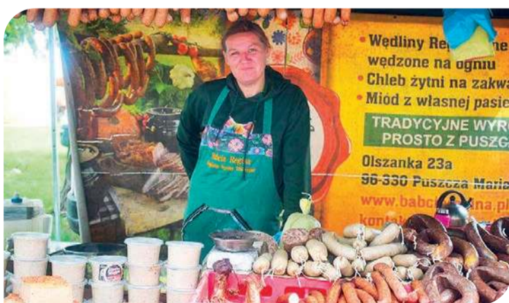
Mazowieckie Dni Rolnictwa to również produkty regionalne

z wodą w rolnictwie i zmianami klimatycznymi, można było porozmawiać ze specjalistami o wyzwaniach, z jakimi mierzy się rolnictwo oraz o praktycznych sposobach przeciwdziałania skutkom suszy i ekstremalnych zjawisk pogodowych, a także rolnictwie 4.0 – prezen-