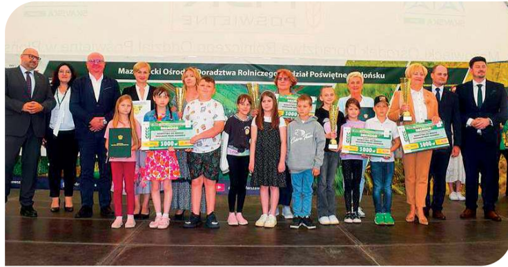
Dyrekcja MODR nagrodziła płońskie podstawówki za projekt dotyczący uprawy poletek przez dzieci

Jubileuszowe wydarzenie, które odbyło się w miniony weekend, 7-8 czerwca w płońskim oddziale Mazowieckiego Ośrodka Doradztwa Rolniczego, objęte