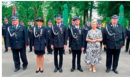
W OSP Nowe Miasto działa młodzieżowa drużyna pożarnicza