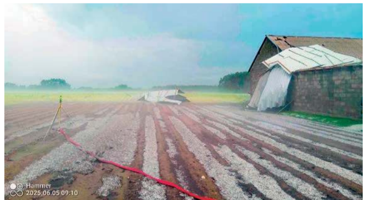
Nawałnica spowodowała duże straty. Grad zniszczył wiele upraw