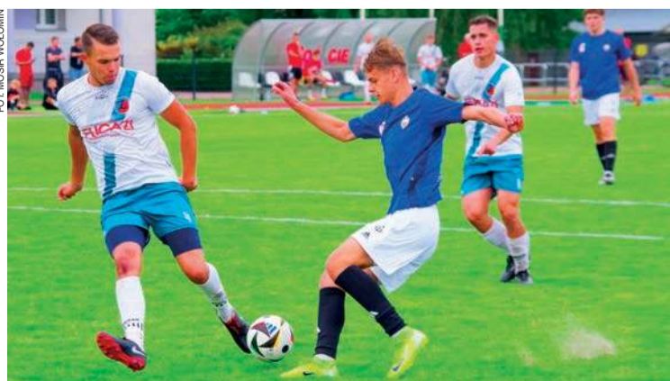
Piłkarze Żbika przegrali na wyjeździe w Wołominie

30. kolejka (14-15 czerwca): Drukarz - Bug, Delta - Narew, Wkra - Marcovia, Mazur - Łomianki, PAF - Huragan, Żbik - Sokół, Nadnarwianka - Polonia II