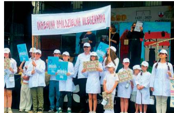
Wśród raciąskich zakładów pracy była Spółdzielnia Mleczarska