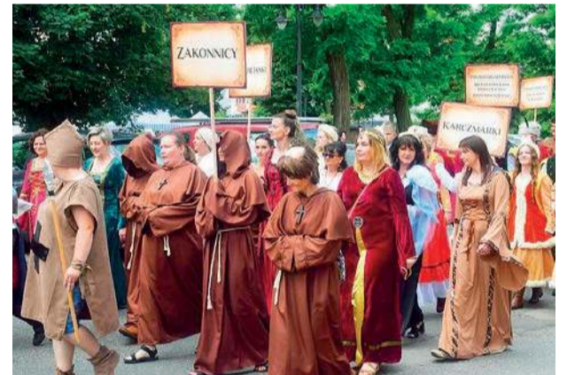
Szli i zakonnicy, i karczmarki

Szkół w Raciążu, i wojnę światową – Społeczne Towarzystwo Oświatowe STO w Raciążu, natomiast stowarzyszenia seniorów i mieszkańcy Raciąża wcielił się w rolę swoich przodków z okresu dwudziestolecia międzywojennego i II wojny światowej.