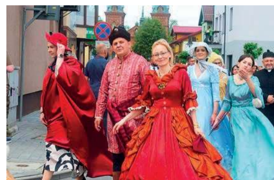
Korowód Dziejów Raciąża to było niezwykle, widowiskowe wydarzenie