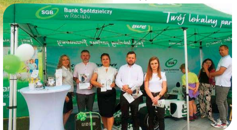
A wśród wystawców był również Bank Spółdzielczy w Raciążu