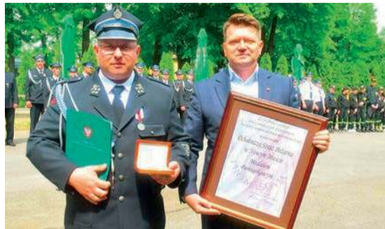
Jednostka OSP Nowe Miasto otrzymała pamiątkowy medal Pro Masovia