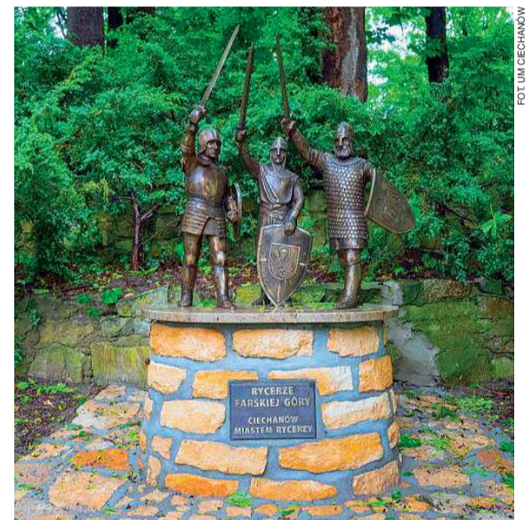
RK Rycerze Farskiej Góry

Jest to piąta z rzeźb na terenie Ciechanowa - przed zamkiem stoi Cieszo, na deptaku w centrum miasta Zygmunt Waleczny, przy przedszkolu na ul. Nadrzeczej Janusz I Starszy, a obok Hotelu Korona Onufry. Trzy nowe postaci rycerzy na Farskiej Górze jeszcze nie mają imion – wybiorą je mieszkańcy miasta w konkursie, który wkrótce zostanie ogłoszony.