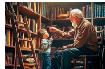
Piątkowe wydarzenie będzie niepowtarzalną okazją by usłyszeć o historii regionu z ust tych, którzy byli jej świadkiem

Podczas wydarzenia zaproszeni goście – osoby pamiętające ważne momenty z dziejów regionu – podzielą się swoimi wspomnieniami. Uczestnicy spotkania, między innymi młodzież szkolna wraz z opiekunami – będą