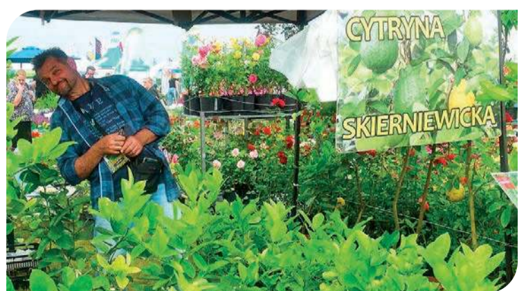
Kiermasz roślin w tym roku był wyjątkowo duży