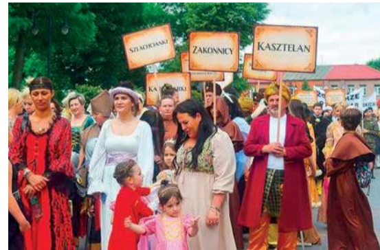
To była kolorowa i ciekawa opowieść o historii miasta