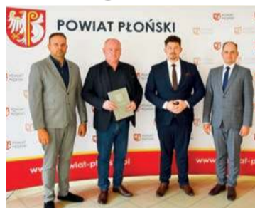
W płońskim starostwie podpisano umowę na przebudowę drogi

budowę przepustów i rowów przydrożnych, rozbiórkę kolidujących elementów infrastruktury drogowej i ogrodzeń, oraz wycinkę drzew i krzewów. Wykonane zostaną również prace związane z infrastrukturą techniczną, jak budowa przyłącza oświetleniowego (doświetlenie przejścia dla pieszych), budowa kanału technologicznego, rozbiórka i budowa kablowej sieci telekomunikacyjnej oraz budowa sieci kanalizacji deszczowej.