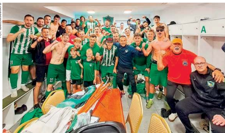
Piłkarze Makowianki zadowoleni po zwycięstwie nad MKS Piaseczno