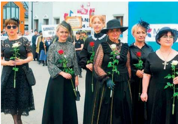
Można było podziwiać stroje z różnych epok