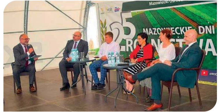
Odbyła się debata poświęcona rolnictwu