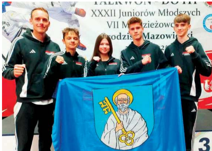
Drużyna Matsogi Ciechanów podczas zawodów w Grodzisku Mazowieckim