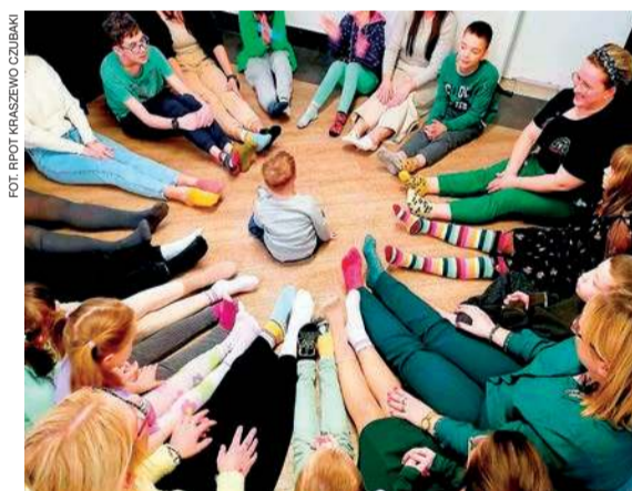
W finansowanej przez samorząd województwa mazowieckiego placówce podopieczni mają zapewnioną opiekę, która jest dostosowana do ich potrzeb.

nym, ze sprzężeniami, spektrum autyzmu, zespołem Downa, zespołem FAS, traumami dziecięcymi, zaburzeniem zachowania i więzi oraz chorobami współistniejącymi: neurologicznymi, kardiologicznymi, układu trawienia oraz zaburzeniami psychicznymi.