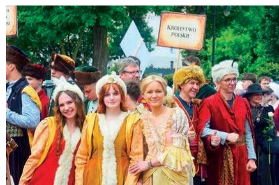
A kto nie był, niech żałuje

- I tym jest właśnie Raciąż, wspólnotą wielu pokoleń – powiedział.