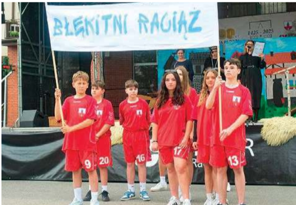
Sybolem miasta są również Błękitni Raciąż