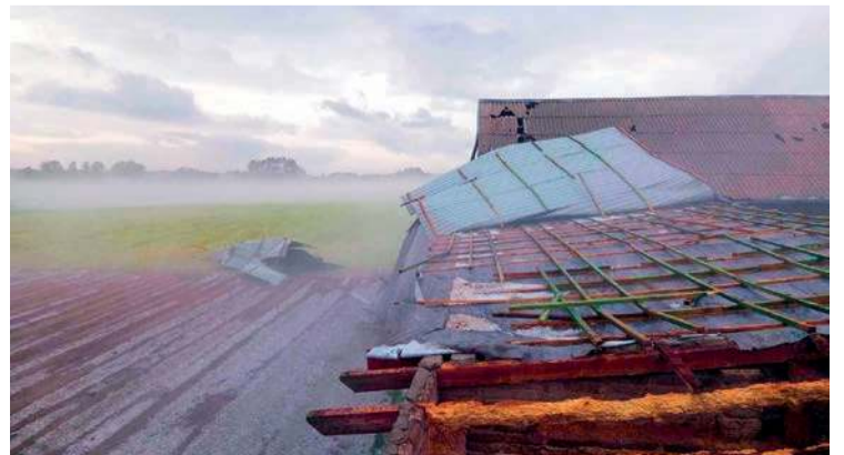
Krajobraz po burzy. Zerwane dachy, połamane drzewa, zniszczone uprawy