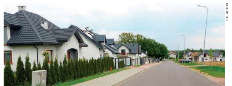
Fragment położonego tuż pod Mławą Szydłówka. Te nowe domy świadczą o tym, że jest to miejsce osiedlania się szczególnie młodych małżeństw

W obiekcie w Krzywonosiu, zaopatrującym w wodę siedem miejscowości (1,2 tys. mieszkańców), jedna studnia się „zapadła”, działa rezerwowa. Trzeba tu zbudować nowe ujęcie wody, odwiert