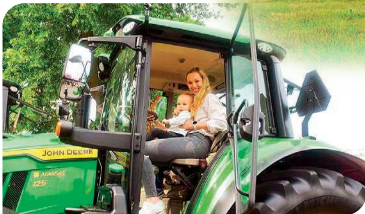
Jak dni rolnictwa, to i nowoczesne maszyny

Mazowieckim Dniom Rolnictwa towarzyszą różne konkursy, w tym m.in. – Amatorskie Zawody w Powożeniu Zaprzęgami – Memorial im. Jerzego Borowskiego, Hit Targowy, konkurs na najlepszy produkt naturalny, najciekawsze stoisko. W tym roku odbył się również konkurs umiejętności i poprawnej obsługi maszyn rolniczych, a także Mazowiecka Wystawa Zwierząt Hodowlanych – laureatów wszystkich konkursów podamy w kolejnym numerze TC.