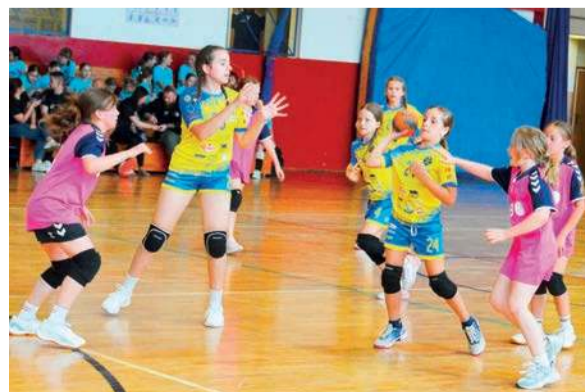
Turniej piłki ręcznej dziewcząt w Winnicy

W meczu o finał zawodniczki z Winnicy zmierzyły się z drużyną z Siemiatycz. Po znakomitej grze ponownie zwyciężyły i zameldowały się w wielkim finale turnieju, gdzie czekała na