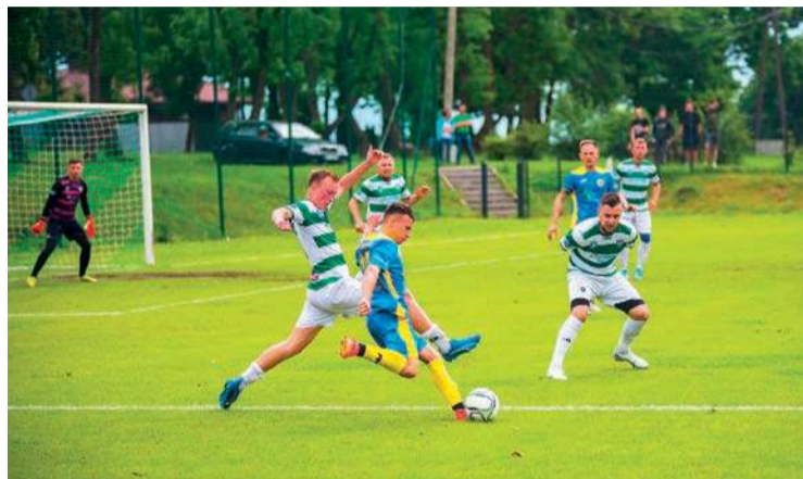
Opia wygrała wygrała u siebie z Wkrą Biezuń