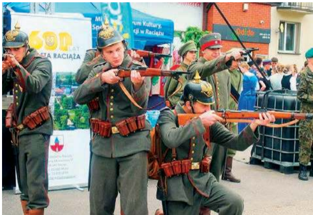
Organizatorzy opowiedzieli w ciekawy sposób historię miasta