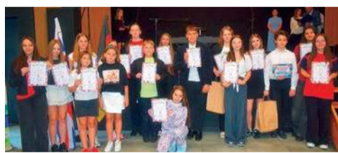
Laureaci tegorocznej edycji konkursu

Uczniowie prezentowali zgłoszone utwory pod koniec maja, a ich wyko-