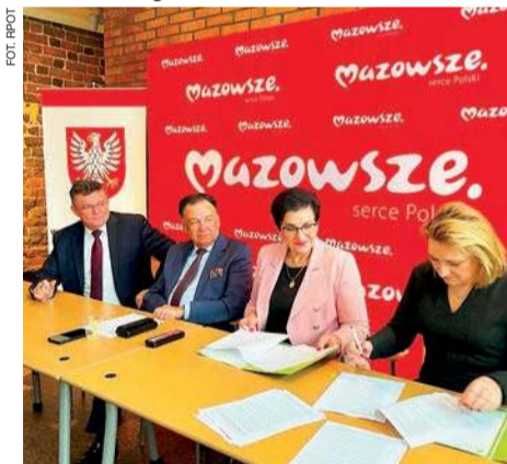
Podpisanie umowy na finansowanie placówki w Kraszewie-Czubakach.