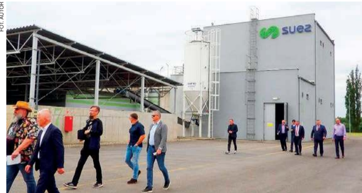
Miejska oczyszczalnia ścieków w Mławie

Miejska oczyszczalnia ścieków w Mławie, zbudowana, sfinansowana i zarządzana przez firmę SUEZ Woda S.A., jest dobrym przykładem partnerstwa publiczno-prywatnego (PPP) – nie mieli wątpliwości uczestnicy wizyty studyjnej w tym obiekcie i seminarium.