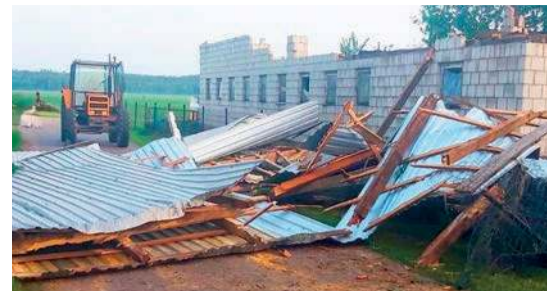
Zerwany dach przewrócił się na 72-letnią kobietę, która w czasie burzy wyszła na swoją posesję. Jej życia nie udało się uratować.

Zgłoszenie o incydencie wpłynęło do makowskiej strażnicy PSP o godzinie 18.24. Na miejsce wysłano dwa zastępy PSP i cztery zastępy OSP. W sumie do akcji ruszyło 26 strażaków.