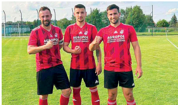
Korona Karolinowo zagra w przyszłym sezonie w A klasie

22. kolejka (14-15 czerwca): Żbik II - Korona, Żak - Jutrzenka, Orleńta - Boruta, Tamka - Gryf, Ciechanów - Świercze, Opia II - PAF II