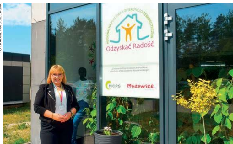
Działalność RPOT-u, prowadzonego przez Fundację Odzyskać Radość, jest finansowana z budżetu województwa mazowieckiego.

Ze względu na zapotrzebowanie w zakresie specjalistycznej opieki nad dziećmi zgłaszane przez powiaty samorząd województwa analizuje możliwość utworzenia kolejnej placówki na Mazowszu dla dzieci powyżej 1. roku życia, co pozwoliłoby objąć opieką większą liczbę dzieci – łącznie w dwóch placówkach mogłoby być ok. 60 podopiecznych.