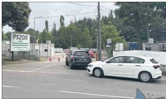
Punkt Selektywnego Zbierania Odpadów Komunalnych w Jaworznie