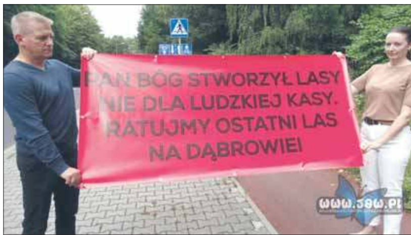
Mieszkańcy Dąbrowy Narodowej nie pozwolą na zniszczenie lasu

Dla mieszkańców to nie do zaakceptowania. Nie chcą w tym miejscu żadnych blokowisk. Chcą po prostu