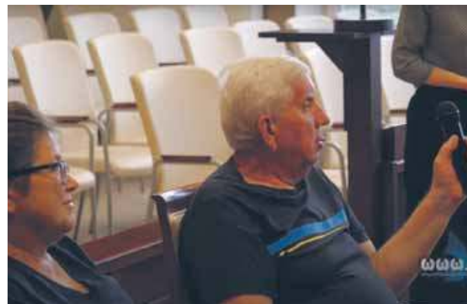
Spotkanie w sprawie miejscowego planu zagospodarowania przestrzennego „Góra Piasku Południe”

Zainteresowani mieszkańcy Góry Piasku uczestniczyli w otwartym spotkaniu konsultacyjnym w sprawie miejscowego planu zagospodarowania przestrzennego. Na nim został przedstawiony projekt, który przewiduje w przyszłości zabudowę mieszkaniową jednorodzinną.