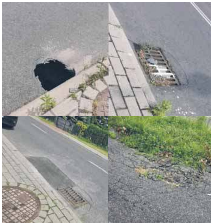
Uszkodzenia w infrastrukturze

Jednym z przykładów jest chodnik w pobliżu ron-