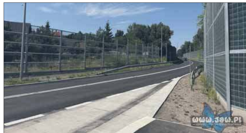
Otwarcie ulicy Nowoszczakowskiej

P ierwsze auta przejechały ulicą Nowoszczakowską w Jaworznie. 14 lipca chwilę po godzinie 11:00 udostępniono kierowcom nowy odcinek drogi o długości około 650 metrów – od ronda w Niedzielskich do skrzyżowania z ulicą Upadową.