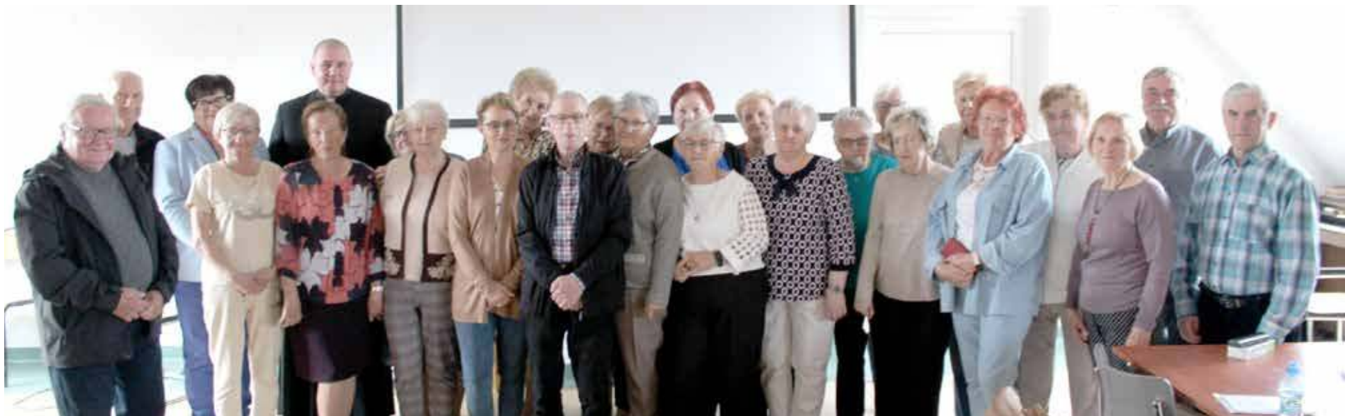
Już tradycyjnie na sam koniec wspólne zdjęcie

PS. XIV edycja Szkoły Cukrzycy przeszła do historii, a na dziś nie wiadomo czy i kiedy odbędzie się kolejna - XV edycja wydarzenia. Przypomnijmy, nowogardzkie Koło PSD nie otrzymało dotacji w ramach otwartych konkursów ofert na 2025 rok. Jeśli wierzyć oficjalnym przekazom urzędu, również nabór na tzw. małe granty, z których można byłoby sfinansować projekt, został w tych dniach zawieszony z uwagi na wykorzystanie dostępnej puli środków przez nasze organizacje. Przynajmniej więc w zakresie finansowania zadania, całość stoi pod dużym znakiem zapytania.