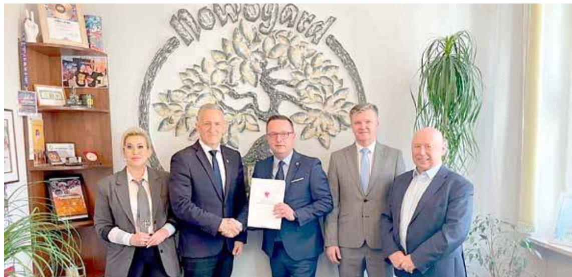
Na zdjęciu politycy firmujący to fatalnie skalkulowane i kontrowersyjne (Przedszkole w SP-4) przedsięwzięcie. Poczekamy na finał