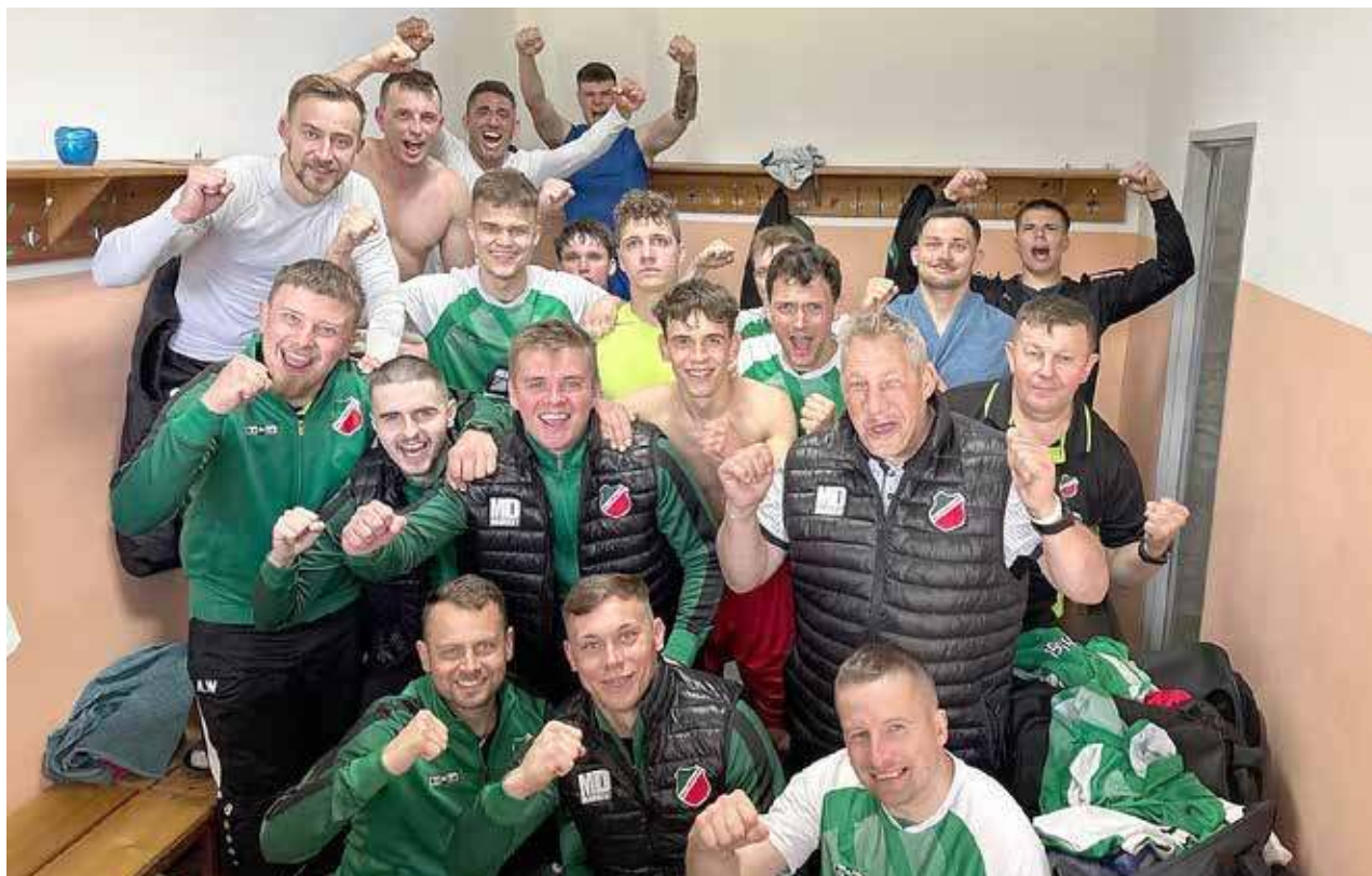
Awans zdobyty. Klasa okręgowa czeka