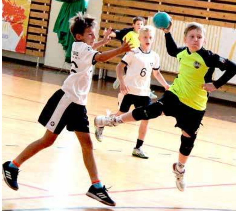
Nasi atakują w meczu z UMKS Dąbie

Stawka zespołów była bardzo wyrównana. Już w pierwszym meczu SPR Nowogard z Gwardią Koszalin przez cały mecz gra toczyła się w myśl zasady „bramka za bramką”. Dopiero w końcówce więcej zimnej krwi zachowali szczypiorniści z Ko-