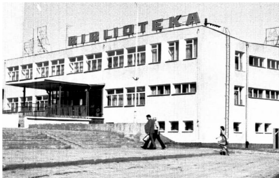
A tak „nie dawno” ją zbudowano

Jak potwierdził na Komisji Rewizyjnej Rady burmistrz Wiatr, biblioteka będzie mogła wkrótce odetchnąć od nachalnych Czytelników (chodzą oni ciągle do biblioteki i czytają książki, zamiast siedzieć przed komputerem na live, albo innym filmiku z burmistrzem),