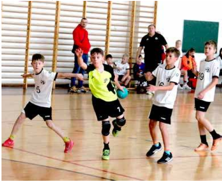
Większość spotkań toczono dosłownie bramka za bramką

szalina i to oni wyszli z pojedynku zwycięsko. Podobny przebieg miały dwa kolejne spotkania z SP Krzywina oraz UMKS Dąbie. W każdym z tych meczów brakowało bardzo niewiele do końcowego sukcesu. Walka i determinacja pomogła w meczu z KPR Gryfino II, co pozwoliło na zajęcie piątego miejsca w I Majowym Turnieju Piłki Ręcznej. Poza zasięgiem nie tylko naszego zespołu była tym razem ekipa KPR I Gryfino, która wygrała wszystkie swoje mecze i zajęła pierwszą lokatę. Gratulacje dla wszystkich zespołów biorących udział w zawodach!