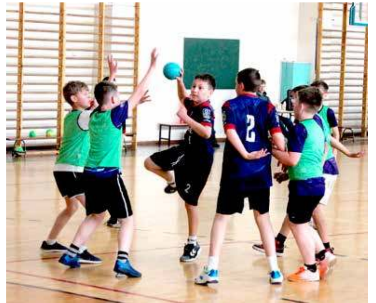
W natarciu KPR Gryfino I, czyli zwycięzcy turnieju