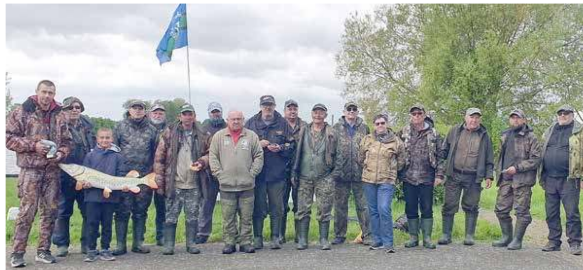
Już po zakończeniu zawodów