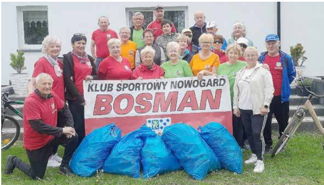
Grupa w komplecie cała i zdrowa zawitała do Brzozowa

Chcesz dać ogłoszenie - reklamę w gazecie na powiat: goleniowski, gryfiński, łobeski, stargardzki zadzwoń: 506 638 789 • napisz: karolinasb@djmedia.pl