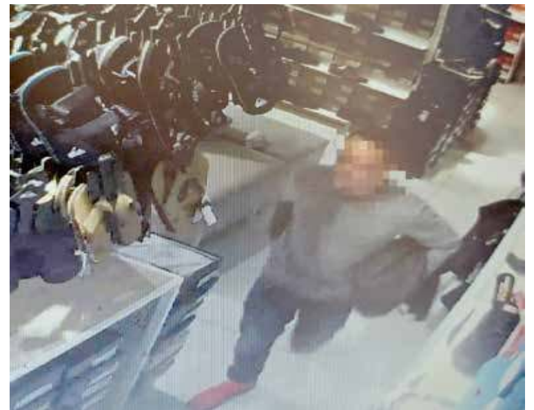
Do kradzieży doszło w jednym z popularnych sklepów z obuwiem

- Pracownicy natychmiast sprawdzili zapis na monitoringu i poinformowali Policję. Funkcjonariusze z Komendy Powiatowej Policji w Goleniowie szybko ustalili tożsamość właściciela telefonu i jednocześnie sprawcy wykroczenia. Wobec mężczyzny zostanie skierowany wniosek o ukaranie do sądu.- informuje st. post. Martyna Kowalska, rzecznik KPP w Goleniowie.