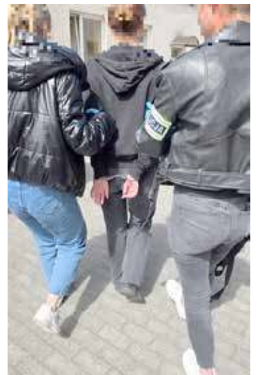
Zatrzymanie podejrzanych, którzy bezwzględnie wykorzystywali łatwowierność klientów w galerii handlowej

- Czynności dochodzeniowo-sledcze doprowadziły do ustalenia, że zatrzymany działał wspólnie i w porozumieniu ze swoją partnerką. Już następnego dnia kobieta została zatrzymana przez policjantów Wydziału do Walki z Korupcją i Przestępczością Gospodarczą KPP w Goleniowie. Funkcjonariusze ustalili, że para przemieszczała się po całej Polsce, stosując podobny mechanizm działania – mężczyzna wzbudzał współczucie, przedstawiał fałszywą historię o chorej matce, prosił