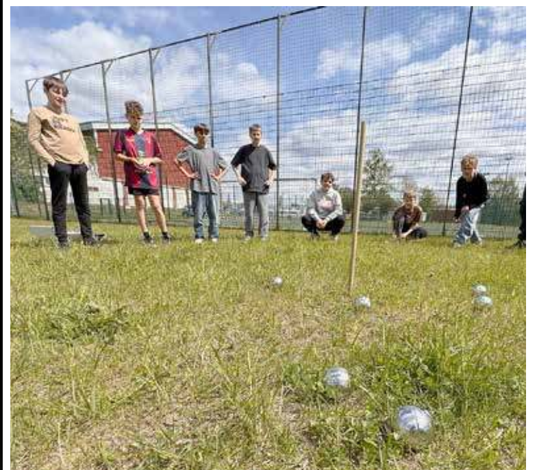
I Turniej w Boule rozegrany został w ramach lekcji wychowawczej