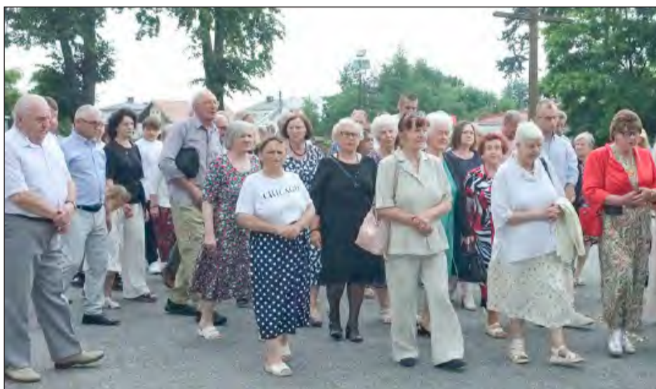
W drogę za Najświętszym Sakramentem udało się dziesiątki parafian i gości

Uroczystości zakończyły się odśpiewaniem pieśni eucharystycznej, litanią do św. Jakuba oraz procesją z Najświętszym Sakramentem wokół kościoła. W procesji udział wzięły delegacje kół gospodyń wiejskich w strojach ludowych, członkinie Odnowy w Duchu Świętym, bractwo Strażnicy Kościoła oraz po raz pierwszy od wielu lat, przedstawiciele Akcji Katolickiej. Ponieważ tego samego dnia