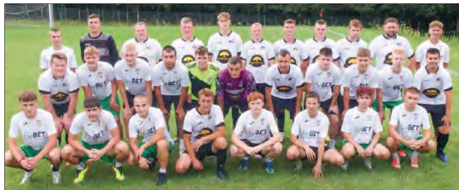
Ruch II Ryki i Orłęta Nowodwór spotkają się w lidze. W sparingu Ruch wygrał 4:1