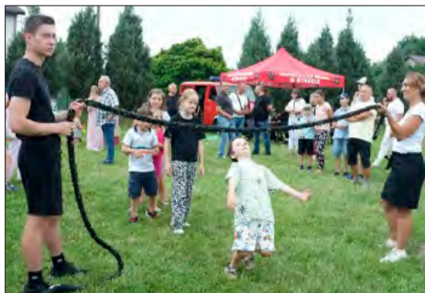
Nie łatwo było przejść pod rozciągniętą liną... Między innymi taką zabawę proponowali najmłodszym instruktorzy Centrum Kultury i Sportu w Rykach