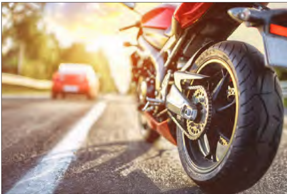
» Głośny ryk silników niemal każdej nocy zakłóca spokój mieszkańców w rejonie osiedla Kochanowskiego w Rykach

» Głośny ryk silników niemal każdej nocy zakłóca spokój mieszkańców w rejonie osiedla Kochanowskiego w Rykach. Problem, który nasilił się w okresie letnim, sprawił, że jeden z mieszkańców postanowił zaalarmować naszą redakcję