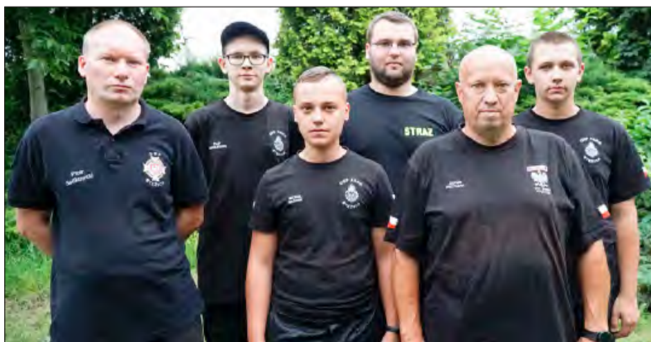
Druhowie z OSP Stężycy nie tylko zapewнили atrakcję dla dzieci udostępniając do zwiedzania wóz bojowy. Pomogli również przygotować i rozpalic Ognisko Pokoleń, ale przede wszystkim zadbał o bezpieczeństwo uczestników wydarzenia