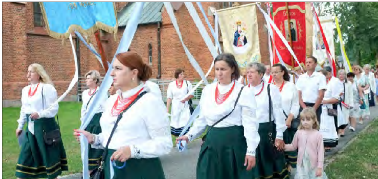
Barwny pochód wokół kościoła uświetniły panie z kół gospodyń w ludowych strojach. Na zdjęciu panie z KGW Nowa Dąbia