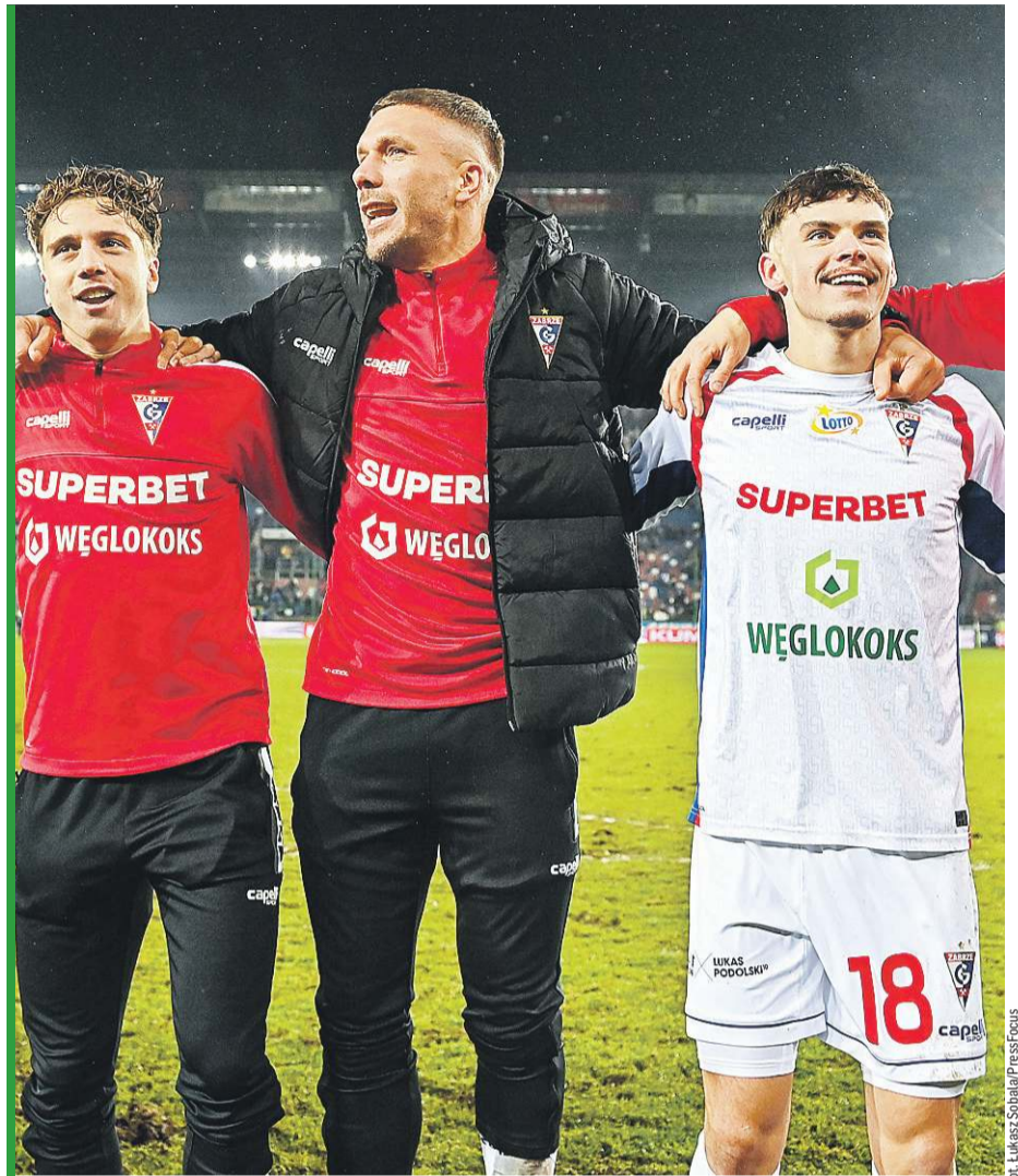
Górnik Zabrze znajduje się na trzecim miejscu w tabeli wszech czasów.