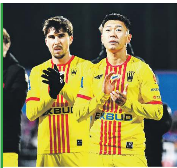
Kibice Korony czekają na powody do zadowolenia...