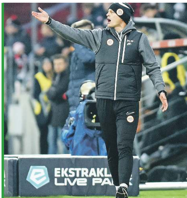
Czy szkoleniowiec lubinian znalazł zimą receptę na problemy zespołu?