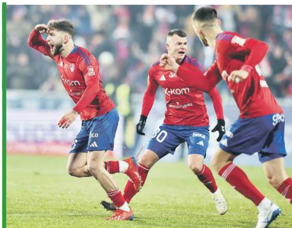
Spod Jasnej Góry widać wyraźnie cel, do jakiego podążać będą „Medaliki”.