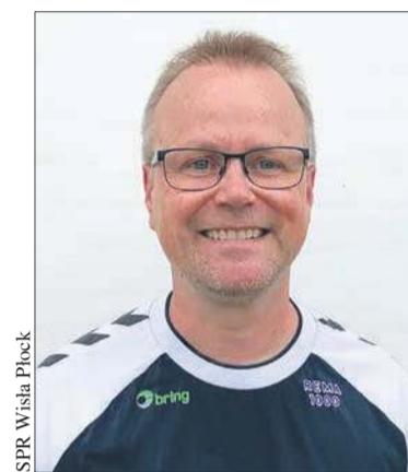
SPR Wisła Płock

Jak kibice wiedzą, SPR Wisła Płock zrezygnowała z prowadzenia drugiej drużyny ORLEN Wisły. Piłkarze rozje-