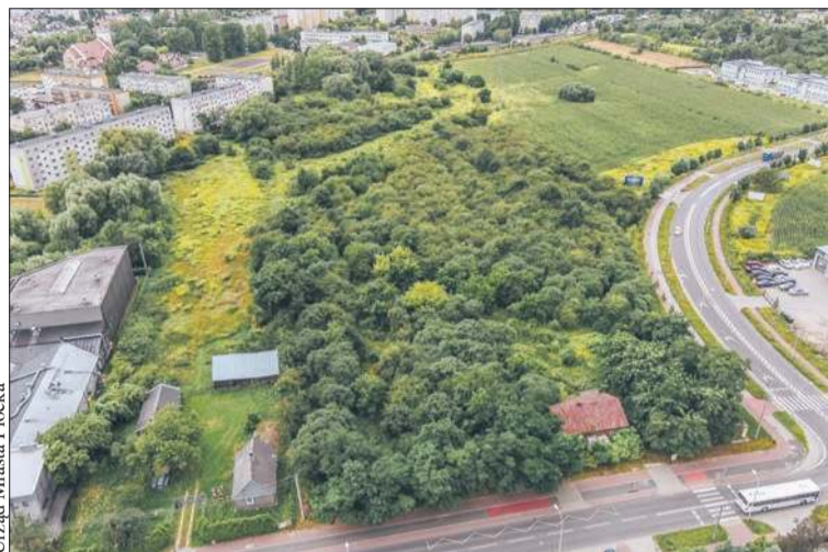
Urząd Miasta Płocka

Na osiedlu Międzytorze powstanie nowy park