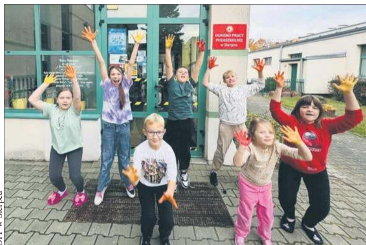
Rocznie w zajęciach prowadzonych w Ognisku Pracy Pozaszkolnej w Sierpcu uczestniczy ponad 400 dzieci

przeглядów i wystaw. Placówka stała się rozpoznawalna nie tylko w powiecie sierpeckim, ale w całym regionie Mazowsza za sprawą Regionalnego konkursu plastycznego „Najpiękniejsza kartka bożonarodzeniowa z duszą”, którego X edycja odbyła się w grudniu ubiegłego roku. Placówka organizuje również konkursy cykliczne tj.: Regionalny konkurs plastyczny „Sierpiec wizytówką Mazowsza”, Powiatowy konkurs plastyczno-profilaktyczny z cyklu „Człowiek, zdrowie i ja”, Powiatowy konkurs plastyczno-wiedzewo-multimedialny „Mistrz savoir vivre”, Regionalny konkurs plastyczno-literacki „Jego życie... o życiu i twórczości Jana Pawła II”, Powiatowy konkurs recytatorski poezji anglojęzycznej, Powiatowy konkurs dla przedszkolaków „Magiczne życie pszczół”, Powiatowy konkurs plastyczny „Moja babcia i dziadek z uśmiechem”. – Kolejnym ważnym zadaniem placówki jest właściwe zagospodarowanie czasu wolnego dzieci i młodzieży oraz pomoc rodzicom w ich w wychowaniu. W trakcie