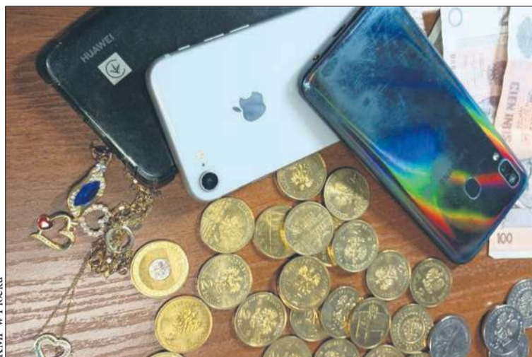
Funkcjonariuszom udało się odzyskać tylko część skradzionych przedmiotów

Wybili szybę w oknie tarasowym. Tak dostali się do domu jednorodzinny na jednym z płockich osiedli. Łupem złodziei padła m.in. biżuteria, pieniądze oraz monety i banknoty kolekcjonerskie o łącznej wartości ponad 17 tysięcy złotych.