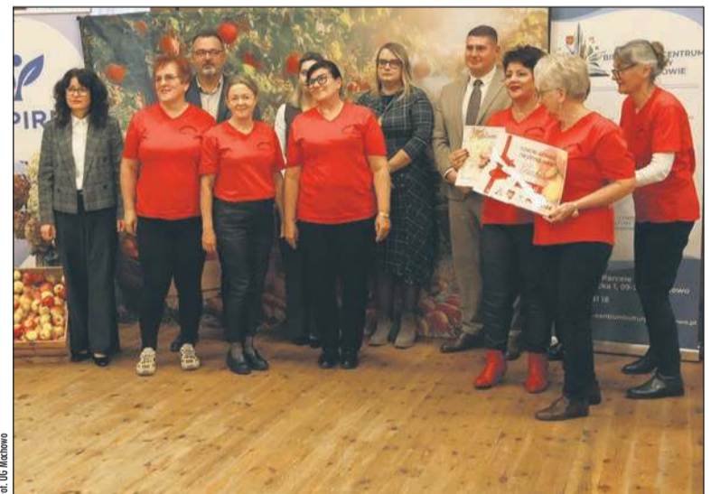
Towarzyszący warsztatom konkurs „(NIE)zwykle jabłko” był okazją do zaprezentowania wielkich talentów kulinarnych pań z KGW działających na terenie gminy Mochowo

Jabłko było także głównym bohaterem organizowanego podczas spotkania konkursu kulinarnego. Zaprezentowano tu mnóstwo potraw z jabłkiem w roli głównej i pomysłyowe dekoracje. Pomysły i propozycje uczestników konkursu oceniało jury