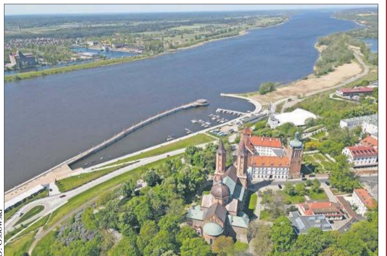
Wzgórze Tumskie to jedna z największych atrakcji turystycznych Płocka