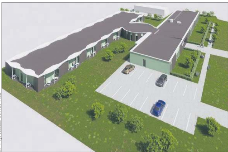
Tak będzie wyglądał Dom Pomocy Społecznej w Preciszewie