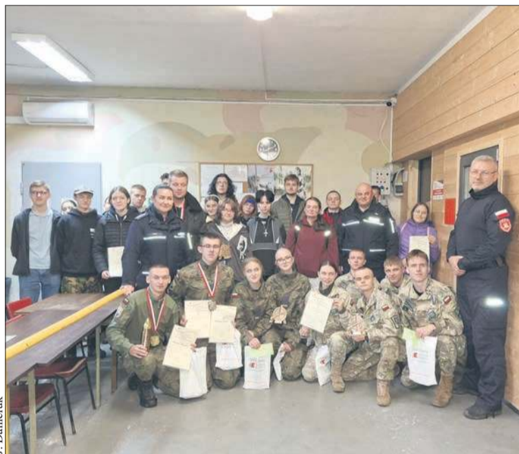
Uczestnicy turnieju strzeleckiego, który odbył się na strzelnicy LOK w Płocku

Z okazji 1000-lecia Królestwa Polskiego w całym kraju odbywał się w tym roku szereg wydarzeń – biegów, koncertów, spotkań. - Jako miłośnicy sportów strzeleckich, skupieni wokół strzelnicy LOK w Płocku, postanowiliśmy rów-