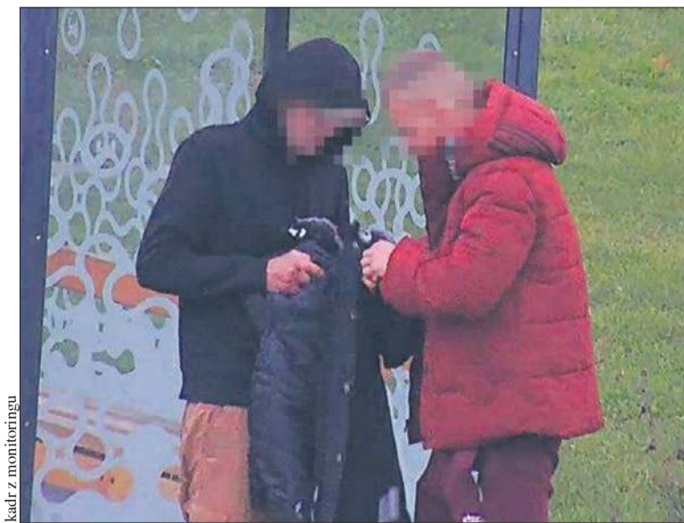
Mężczyźni zatrzymani na ul. Wyszogrodzkiej