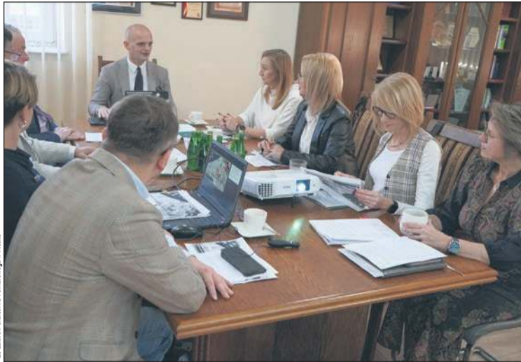
Głównym tematem posiedzenia Zarządu Powiatu był budżet na 2026 rok

W budżecie znajdują się środki na wspieranie mieszkańców, czyli m.in. program „Działaj Lokalnie” czy program pomocy Ochotniczym Strażom Pożarnym. Będą też środki na prowadzenie szkół powiatowych i Domów Pomocy Społecznej. Na pewno samorząd rozpocznie też budowę nowej siedziby Zespołu Szkół Specjalnych w Goślicach. Oczywiście nie zabraknie realizacji wielu zadań drogowych, na które czekają mieszkańcy, wśród nich inwestycji drogowych w ramach współpracy z ORLEN-em. W budżecie znajdują się również pieniądze na kolejne ścieżki rowerowe.