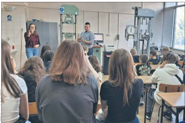
Filia PW w Płocku