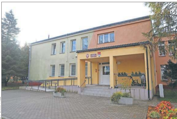
Budynek Miejskiego Przedszkola nr 14 w Płocku

W e-mailu skierowanym do naszej redakcji rodzice zaznaczają, że decyzja ta została podjęta bez konsultacji społecznych i bez wskazania realnych alternatyw. – Rodzice są zaskoczeni i zaniepokojeni. Wokół naszego przedszkola tworzy się zgrana społeczność dzieci, nauczycieli i rodzi-