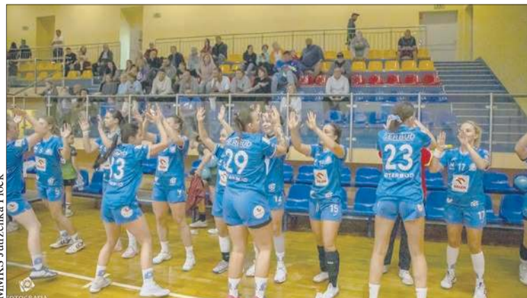
MMKS Jutrzenka Płock