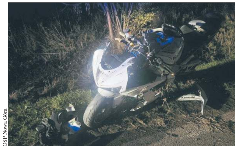
OSP Nowa Góra