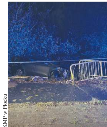
KMP w Płocku

poszkodowanemu oraz wezwał na miejsce służby. Sprawca kolizji próbował oddalić się z miejsca zdarzenia, jednak świadek skutecznie mu to uniemożliwił. Po chwili na miejscu był już patrol Policji – relacjonuje przebieg zdarzenia