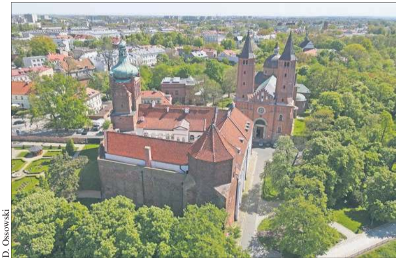
Na pierwszym planie widoczna Wieża Szlachecka

szych relikwii gotyckiego zamku i kościoła są prezentowane jako element ekspozycji. Jako unikat wyróżnia się ocalały w murach Wieży Żegarowej relikwii kamiennego palatium – czytamy na portalu zabytek.pl.