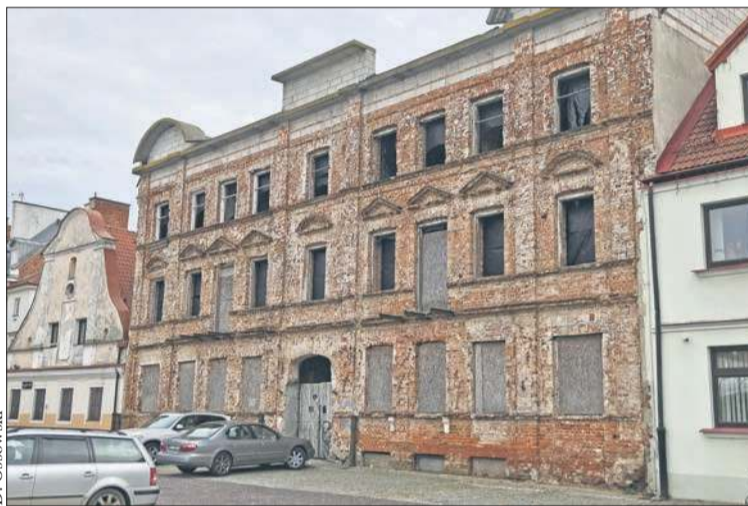
Kamienica przy Starym Rynku 22

Z uzasadnienia podjętej wówczas uchwały mogliśmy się dowiedzieć, że wartość działki przy ulicy Szpitalnej została oszacowana na 2 189 000 złotych. Natomiast wartość nieruchomości przy Starym Rynku 22 została przyjęta na poziomie 2 600 000 zł. Było to wynikiem negocjacji pomiędzy przedstawicielami samorządu i właścicielem nieruchomości – zgodnie z operatem szacunkowym jej wartość to ponad 3 miliony złotych. Do przekazanej nieruchomości przy ulicy Szpitalnej miasto musiało dopłacić ponad 400 tysięcy złotych. (jac)