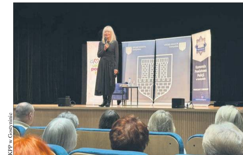
Gościem finału akcji „Gostynin – miejsce mocy bez przemocy” była Anna Maria Wesołowska

W spotkaniu uczestniczyli również policjanci z Komendy Wojewódzkiej Policji z siedzibą w Radomiu, Komendy Miejskiej Policji w Płocku oraz Komendy Powiatowej Policji w Sierpcu. Wymiana doświadczeń i poglądów pomiędzy