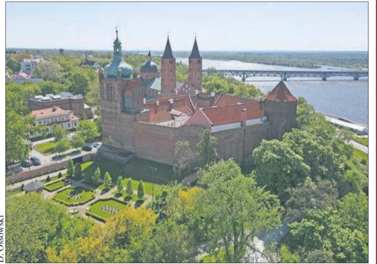
Zespół dawnego Zamku Książąt Mazowieckich i opactwa pobenedyktyńskiego

Obecnie trwa realizacja – dofinansowanego ze środków Unii Europejskiej – projektu pod nazwą „Podniesienie atrakcyjności turystycznej zespołu dawnego opactwa benedyktyńskiego z elementami Zamku Książąt Mazowieckich”. To szerokie przedsięwzięcie obejmujące różnorodne działania. Prace budowlane i konserwatorskie obejmują remont elewacji północnej i zachodniej – odnowienie ceglanych murów i kamiennych fragmentów, uzupełnienie ubytków oraz przywrócenie historycznego wyglądu elewacji; konserwację Wieży Szlacheckiej (zamkowej) – wzmocnienie i odnowienie tej średniowiecznej baszty, której dolna część ma charakter obronny, a gór-