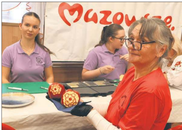
Podczas spotkania odbyły się warsztaty z carvingu, czyli sztuki rzeźbienia w owocach