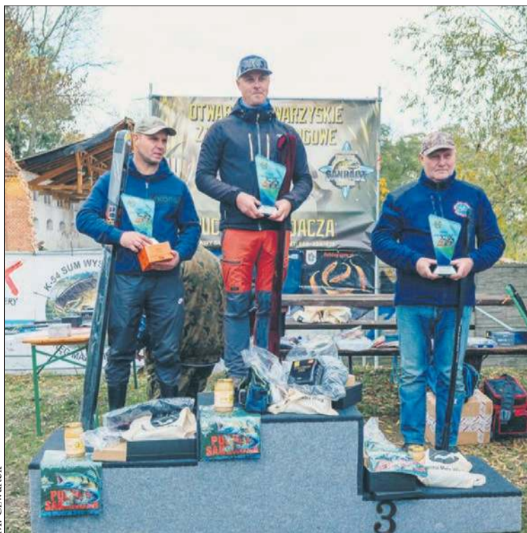
Czołowi zawodnicy otrzymali atrakcyjne nagrody