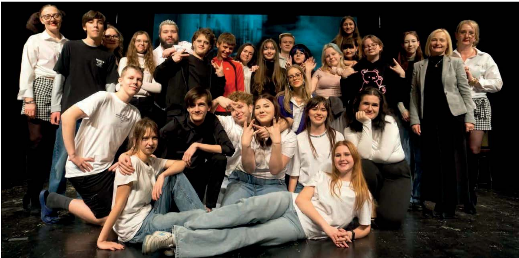
Grupa teatralna działająca przy ZSECh w Trzebinii.