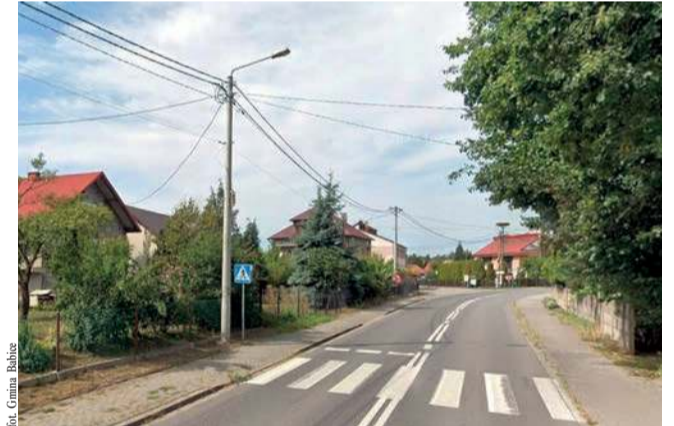
To przejście dla pieszych w Jankowicach zostanie doświetlone

Przejście dla pieszych w Jankowicach na ul. Wadowickiej (droga wojewódzka nr 781), niedaleko skrzyżowania z ul. Jabłonka, zostanie doświetlone. Prace zostaną dofinansowane z programu „Poprawa bezpieczeństwa na przejściach dla pieszych w ciągu dróg wojewódzkich Województwa Małopolskiego”. Udział gminy Babice w finansowaniu tej inwestycji wyniesie 30 procent kosztów całego zadania, ale nie więcej, niż 12 tysięcy złotych.