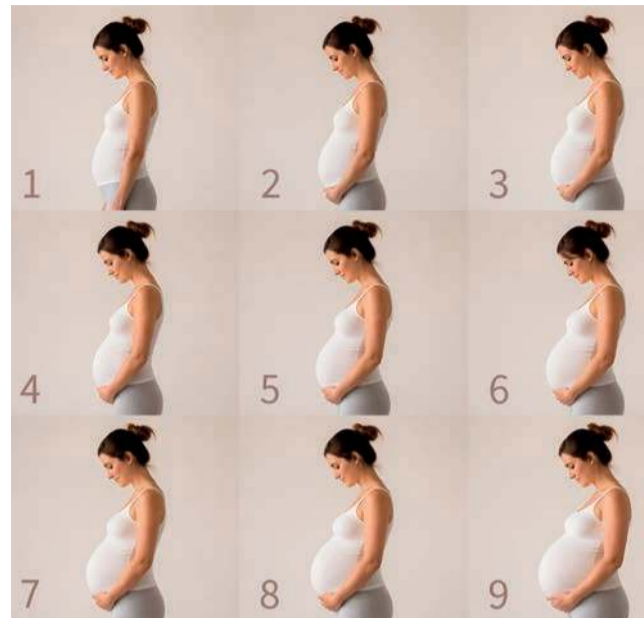
Brzuch kobiety w okresie ciąży

Poprzez odpowiednie ćwiczenia oraz techniki przygotowujące ciało do porodu, w tym m.in. pracę z tkankami kroczka. Pomoże w tym fizjoterapeutka uroginekologiczna.