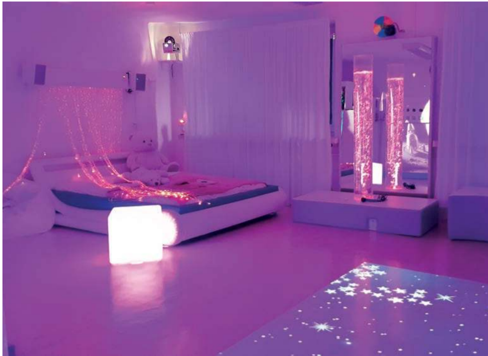
Sala doświadczenia świata w nowej odsłonie. Uczniowie bardzo lubią w niej przebywać