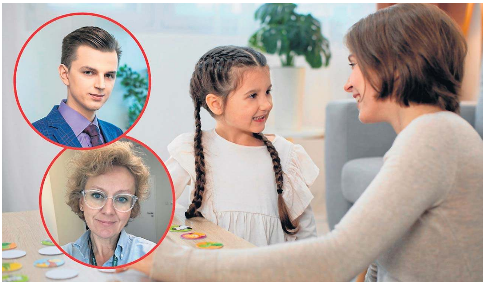
Eksperti podkreślają, że diagnoza autyzmu u kobiet bywa wyzwaniem

Jak podkreśla ekspert, zamiast wycofania dziewczynki mogą być nadmiernie grzeczne lub próbować zyskać akceptację,