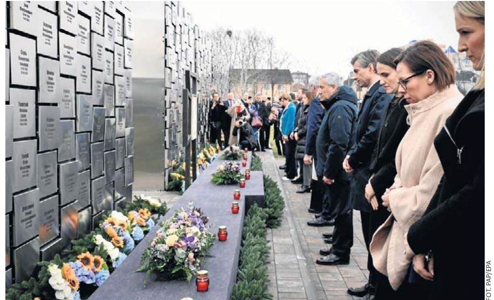
Ministrowie złożyli znicze pod pomnikiem ofiar zbrodni w Buczy i oddali hołd pamięci Ukraińców, brutalnie zamordowanych w tym miejscu cztery lata temu

„To scenariusz, który Rosja stosuje wszędzie tam, gdzie