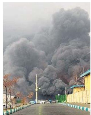
Kłęby dymu widać było z daleka

Według dziennika, który powołuje się na anonimowego amerykańskiego urzędnika, wojsko wykorzystало w nocy „dużą liczbę” wazących po około 900 kg bomb przeciwbunkrowych do zniszczenia arsenału. Prezydent USA Donald Trump zamieścił na platformie Truth Social trzydziestojednosekundowe nagranie, na którym widać potężne eksplozje. Osobno telewizja CNN potwierdziła