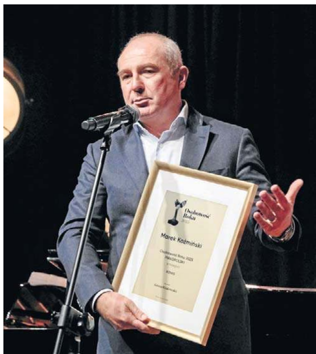
Marek Koźmiński, były reprezentant Polski w piłce nożnej, medalista olimpijski, a teraz współwłaściciel KG Group