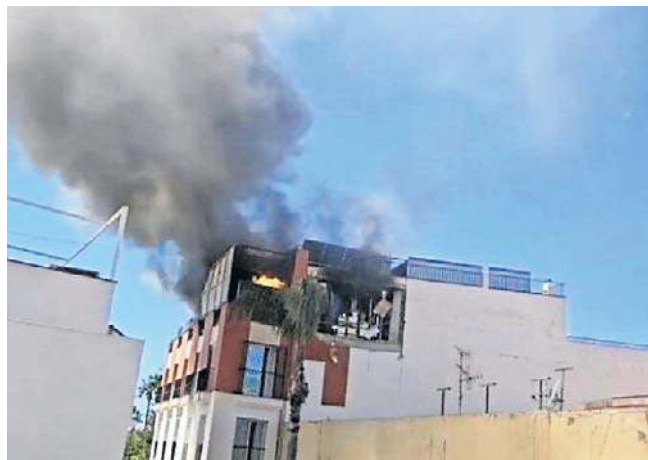
Mówi się o cudzie, że nikt nie zginął podczas pożaru w hiszpańskim mieście Almunecar