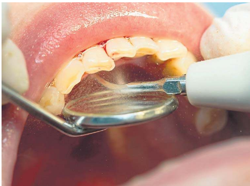
Za darmo na NFZ możesz wykonać raz w roku usunięcie kamienia nazębnego

Oba rodzaje są niebezpieczne dla zdrowia, ponieważ mogą prowadzić do rozwoju chorób przyzębia i w efekcie nawet do utraty zębów. Przyczyniają się one także do rozwoju stanu za-