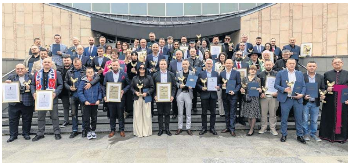
– Emocje były wielkie do samego końca – mówili zwycięzcy. Wszystkim laureatom i uczestnikom plebiscytu Osobowość Roku 2025 serdecznie gratulujemy!