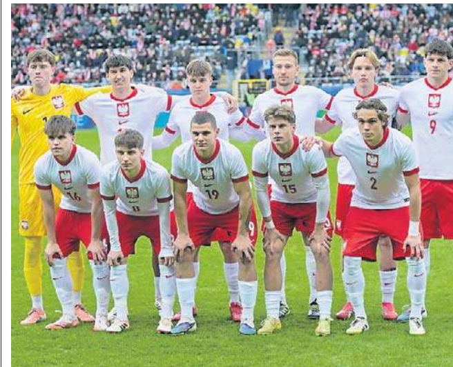
Reprezentacja Polski U-20 przed wczorajszym meczem z rówieśnikami z Niemiec, który został rozegrany w Lublinie