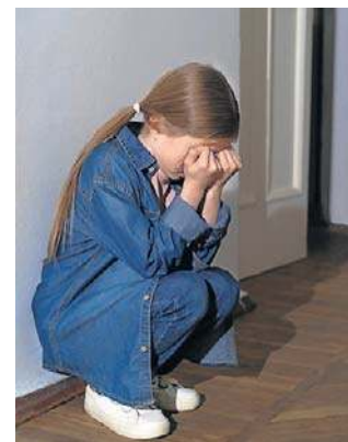
Dziewczynki mogą być nadmiernie grzeczne

- Rozpoznanie i zrozumienie własnych cech to nie tylko ulga, ale też szansa na życie w większej zgodzie ze sobą. Diagnoza nie zamyka, lecz otwiera na nowe możliwości, relacje i świadome dbanie o siebie - podsumowuje psychiatra Konrad Jurczakowski.