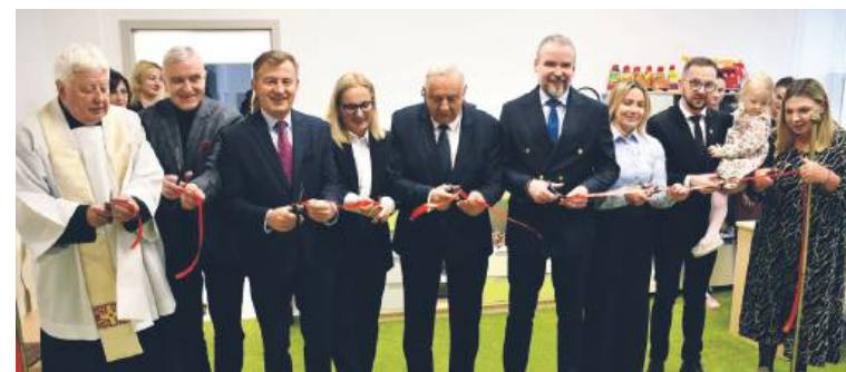
Otwarcie zmodernizowanego żłobka,

Modernizacja Żłobka Miejskiego w Krasnymstawie była możliwa dzięki dofinansowaniu z rządowego programu „Aktywny Maluch 2022–2029”, współfinansowanego ze środków KPO oraz EFS. Był to pierwszy tak duży remont placówki od czasu jej powstania w 1979 r. Dzięki inwestycji żłobek powiększył się o 20 miejsc opieki nad maluchami, do 95. W ramach prac wymieniono instalację