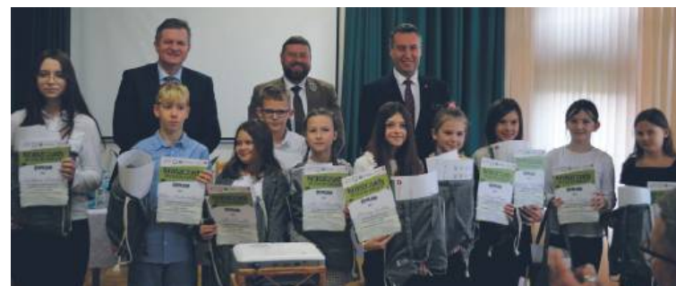
Podczas wydarzenia ogłoszono wyniki konkursu fotograficznego „Koniec lata w Kraszczadach”, organizowanego przez Instytut Rozwoju Samorządu Terytorialnego Województwa Lubelskiego.

– Z inwestycji, w najbliższym czasie chcemy zrewitalizować zespół parkowo-dworowski w Wielkopolu, co byłoby