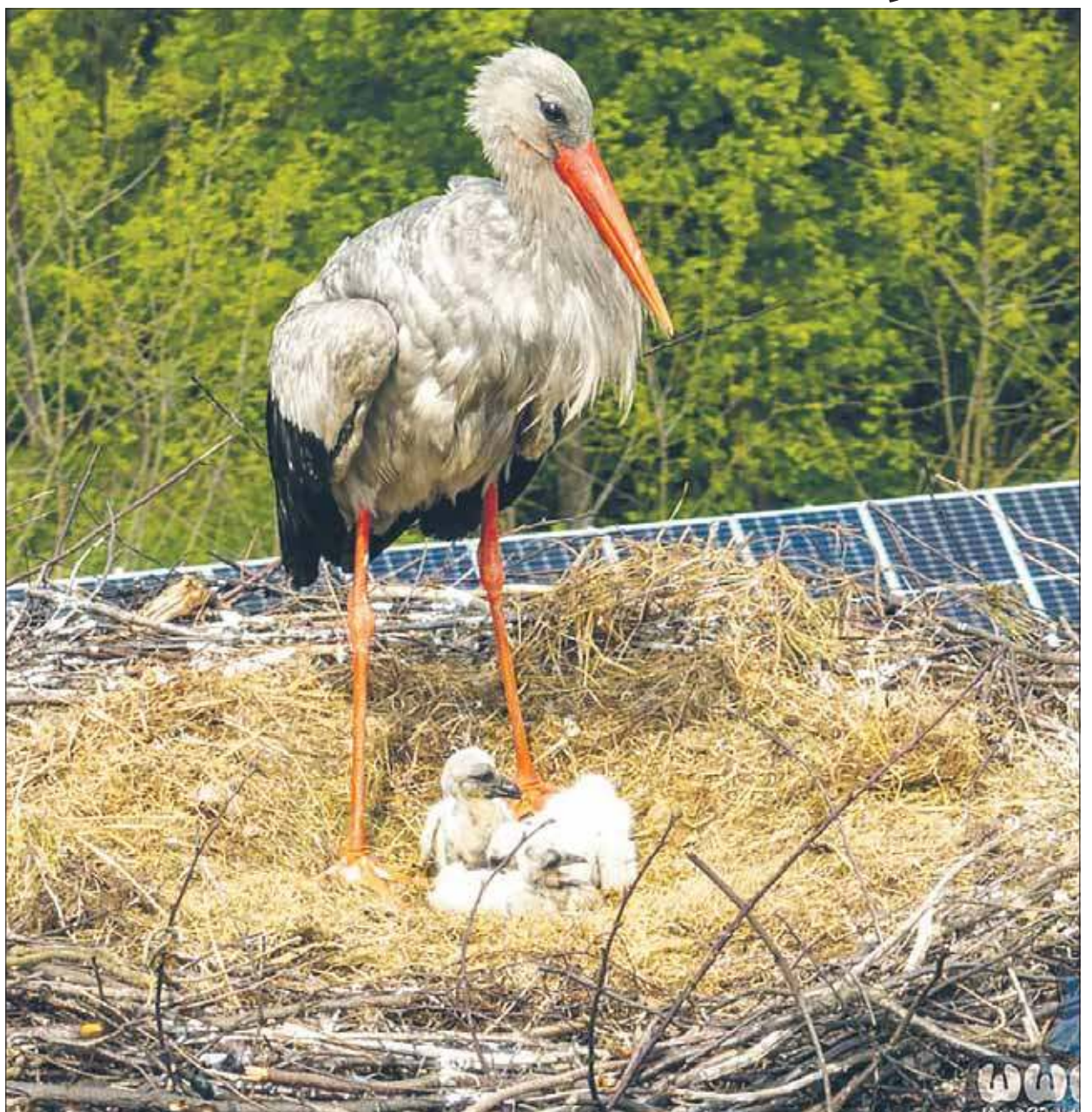
Nowe pokolenie bocianów wychowuje się na kominie piekarni Stanisława Bigaja