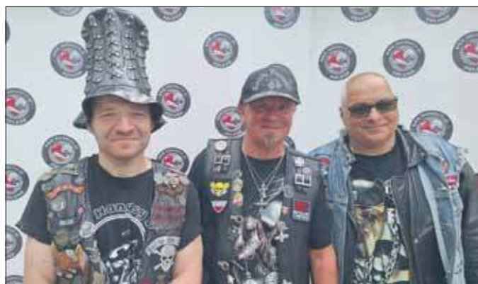
Barwne grono motocyklistów