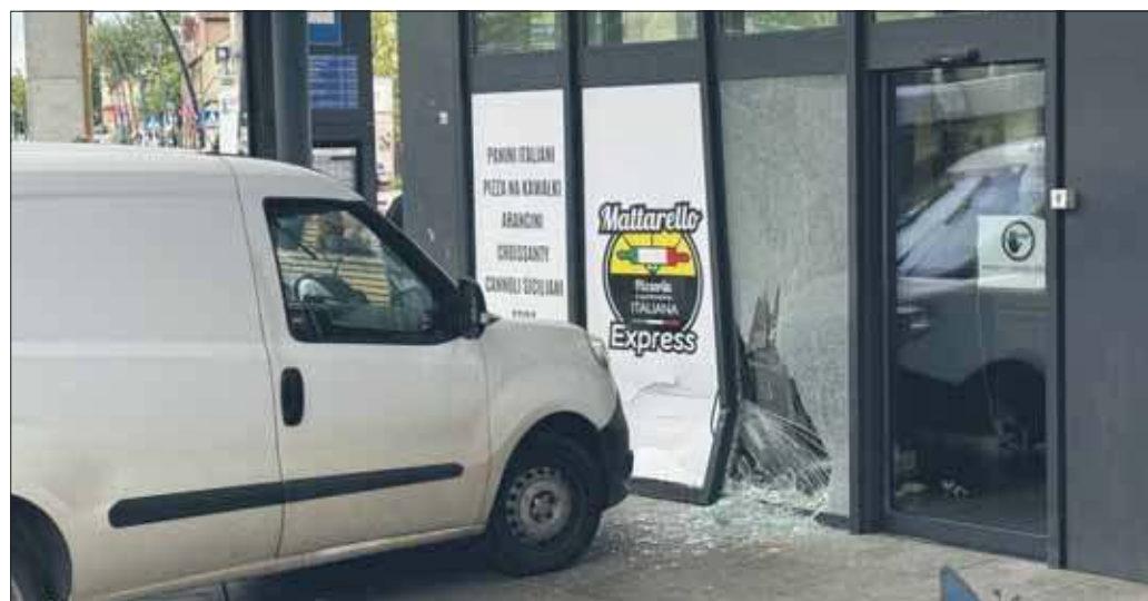
Samochód wjechał w lokal Mattarello

Na miejscu pojawiła się policja, która ukarała mieszkańca Rudy Śląskiej mandataми na łączną kwotę 1600 złotych i 11 punktami karnymi. Za wjechanie w lokal otrzymał mandat w wysokości 1500 zł i 10 punktów karnych, a za wjazd na ścieżkę rowerową 100 zł grzywny i 1 punkt karny. Weronika Palka