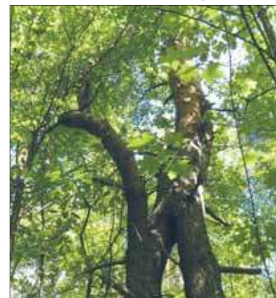
Osobliwie zrosnięta sosna zwyczajna

Od pewnego czasu jaworznicka Tarza jest przedmiotem podwójnego zainteresowania. Po pierwsze stowarzyszenie Zielone Jaworzno uważa, że najlepiej byłoby ustanowić tutaj jakąś formę ochrony, a przynajmniej użytek ekologiczny. Z drugiej strony władająca skrawkiem tego obszaru Spółka Restrukturyzacji Kopalni chciałaby zbyć swoją część. Pierwsza próba jak wiadomo skończyła się niepowodzeniem. 21 maja temat podjęła Telewizja Katowice. Wówczas zostałem poproszony o wyrażenie swojego zdania w tej materii. Najważniejsza konkluzja jest jasna. Każdy, kto wejdzie w posiadanie części przeznaczonej na sprzedaż, powinien mieć świadomość, że będzie miał po sąsiedzku prawie rezerwat. Ponadto i na swoim kawałku co i rusz będzie się potykał o rośliny chronione a storczyki z rodzaju kruszczyk przede wszystkim.