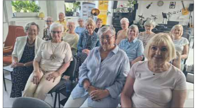
Klubowicze z klubu To i Owo

4 czerwca – godz. 11.00 , Zatrzymane w Klubowym Kadrze – otwarcie wystawy fotografii z wydarzeń i przedsięwzięć organizowanych w klubie i z udziałem klubowiczów, to przegląd zdjęć z klubowych kronik w nieco większym formacie, 4 czerwca – godz. 15.00 , Jubileuszowy Klubowy Turniej Brydżowy o tytuł „Pary 10-lecia Klubu To i Owo”, 5 czerwca – godz. 11.00 , Uroczyste rozstrzygnięcie Konkursu Artystycznego „Klubowe Inspiracje”, konkurs