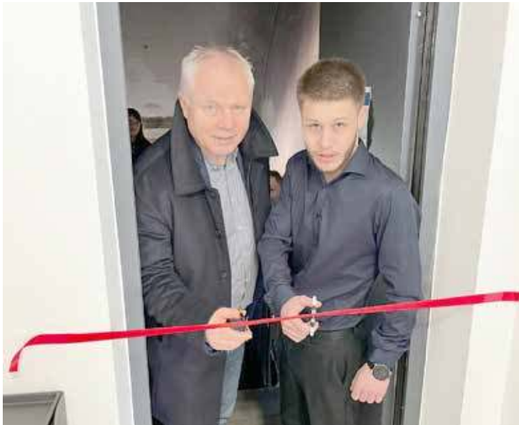
Nastąpiło przecięcie wstęgi mieszkań treningowych w Gminie Goleniów

Same mieszkania treningowe mają zapewnić młodym osobom usługi bytowe, naukę niezależności, nabieranie sprawności w zakresie samoobsługi, trening