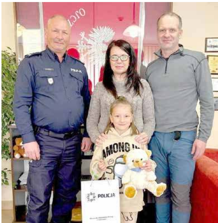
Dziewczynka odwiedziła Komendę wraz z rodzicami

mendzie na właściciela krótko. Właściciel odnalazł się bardzo szybko. I jest z pewnością bardzo