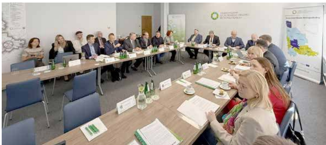
Samorządowcy z okolic Szczecina spotkali się