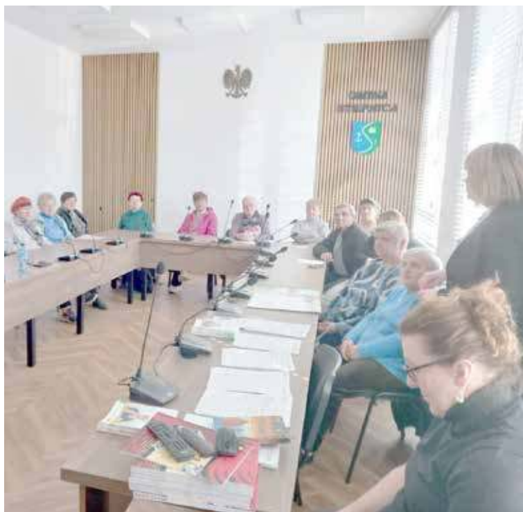
Spotkanie cieszyło się sporym zainteresowaniem