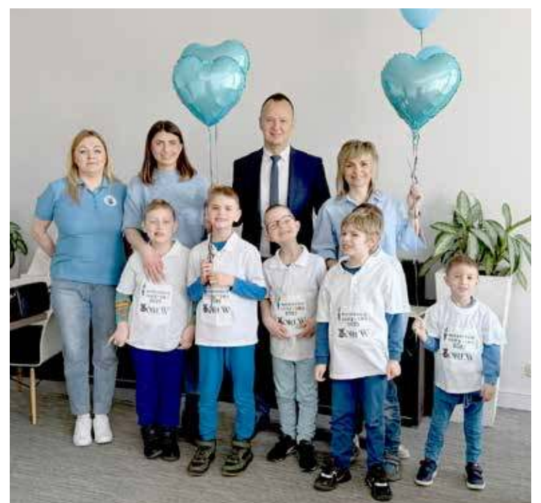
Urząd odwiedziła grupa dzieci