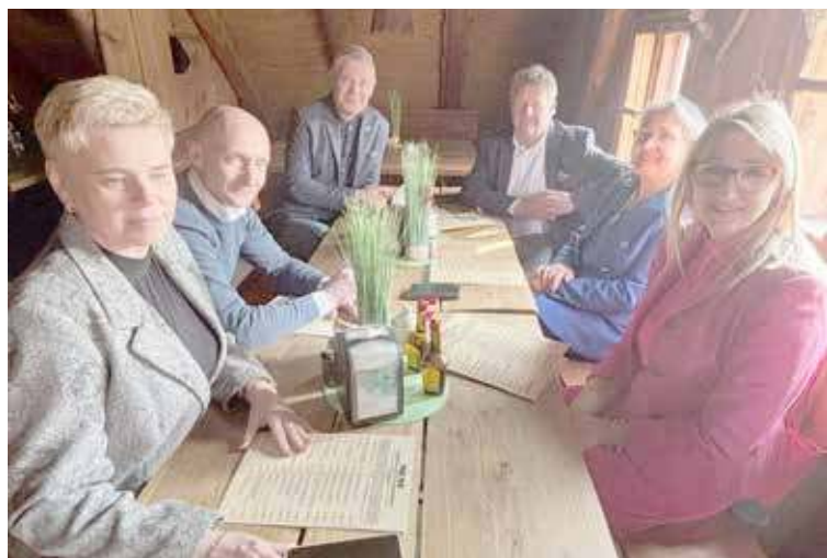
Gmina Przybiernów miała gości z Dolnego Śląska