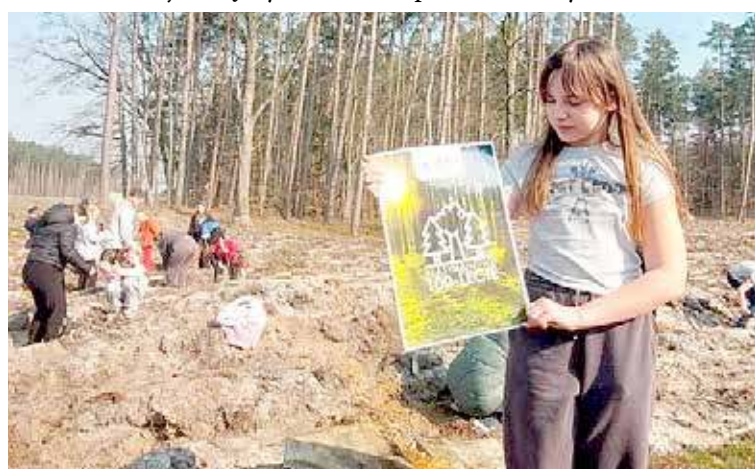
Akcja miała na celu zalesienie terenów oraz zwiększenie świadomości o ochronie środowiska