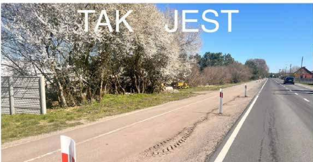
Ścieżka prezentuje się znacznie lepiej