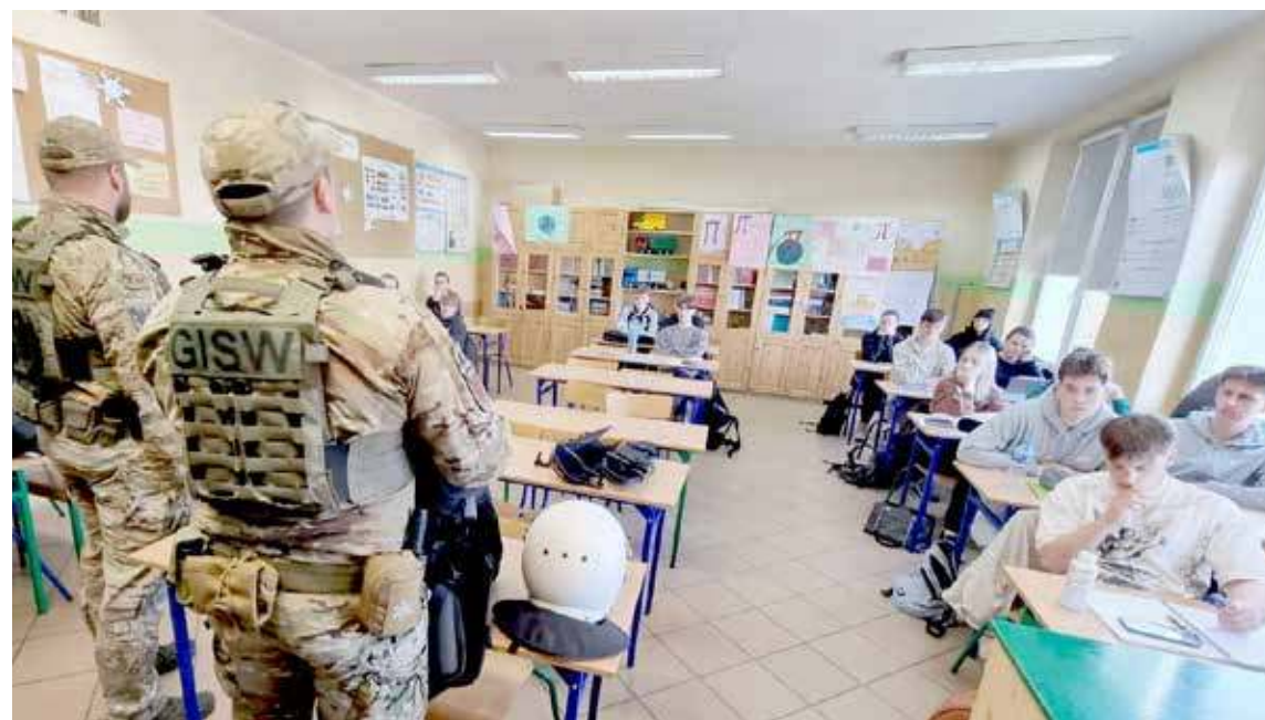
DD Funkcjonariusze ZK spotkali się z maturzystami

Wielu uczniów skorzystało z możliwości uczestniczenia w spotkaniu. I byli żywo zainteresowani jego tematyką – zadawali wiele pytań dotyczących warunków pracy, możliwości rozwoju oraz specyfiki funkcjonowania jednostki penitencjarnej. Jest więc całkiem możliwe, że niektórzy z nich wybiorą właśnie tę ścieżkę kariery.