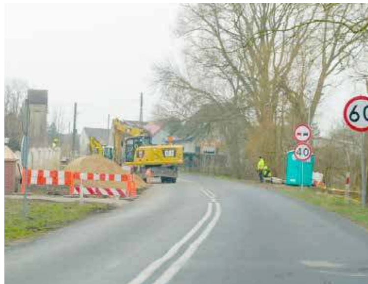
Jenikowo zyskuje chodnik

Jenikowo znajdujące się w Gminie Maszewo już niebawem zyska komfort lepszej komunikacji pieszej. Powstaje tam chod-