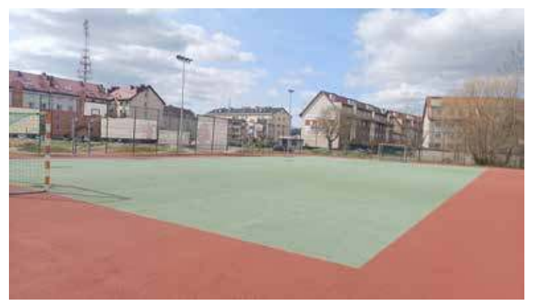
Orlik na Szkolnej będzie odnawiany

Ośrodek Sportu i Rekreacji w Goleniowie ogłosił przetarg na realizację inwestycji modernizacji Orlika znajdującego się przy ulicy Szkolnej. Powodem jest zły stan obiektu. Zainteresowani mogą składać oferty do 9 kwietnia.