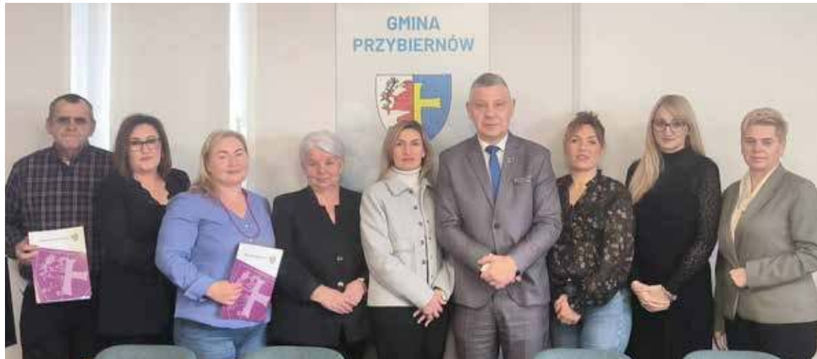
Umowa na realizację zadań została podpisana