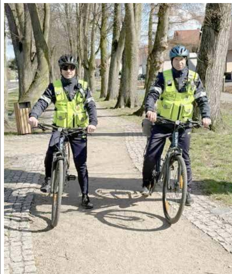
Rowerowa Straż Miejska