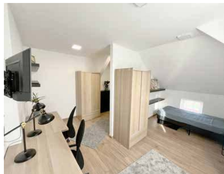
Jedno z otwartych mieszkań