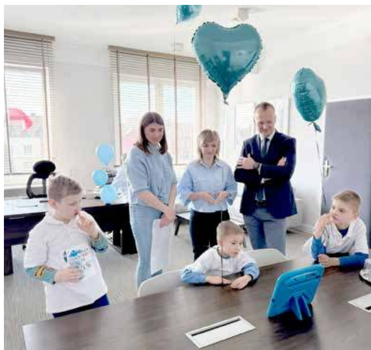
Dzieci z ciekawością dowiadywały się o pracy Urzędu