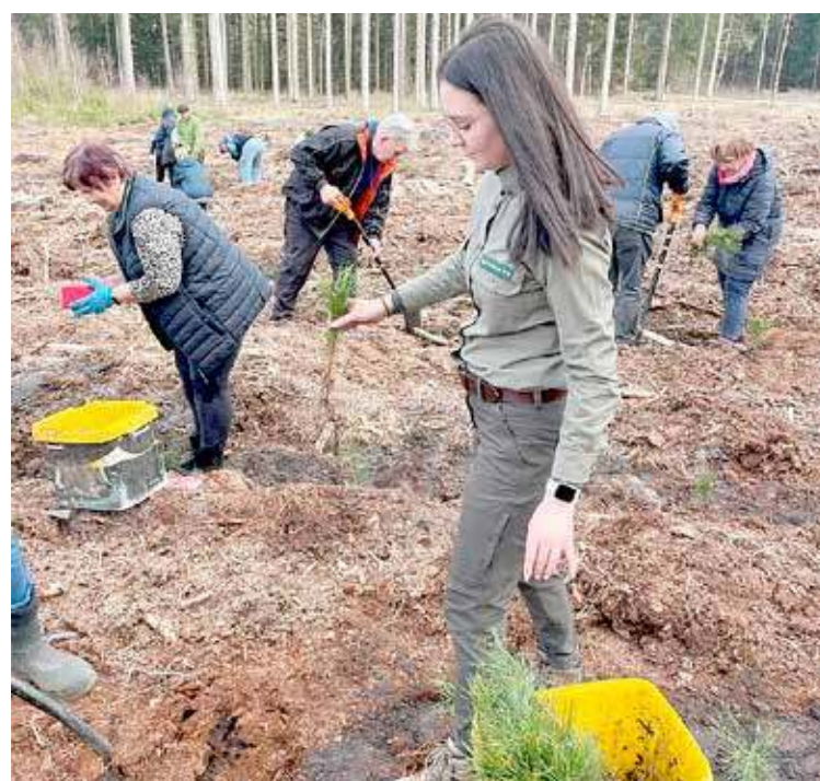
Każdy mógł zasadzić drzewko