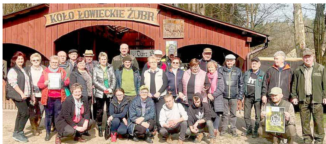
W akcji uczestniczyło wiele osób