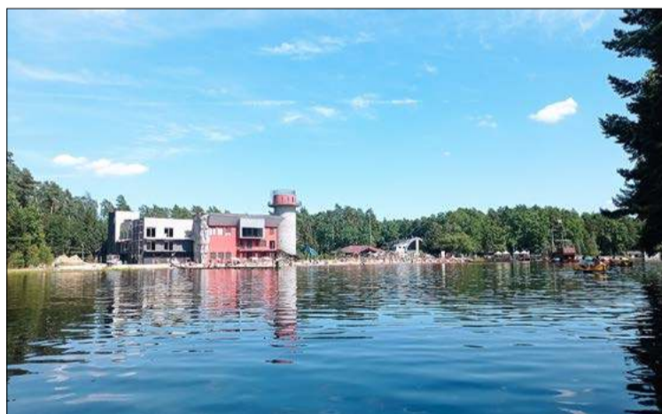
Osrodek w Chotowej widziany z rowerka wodnego.