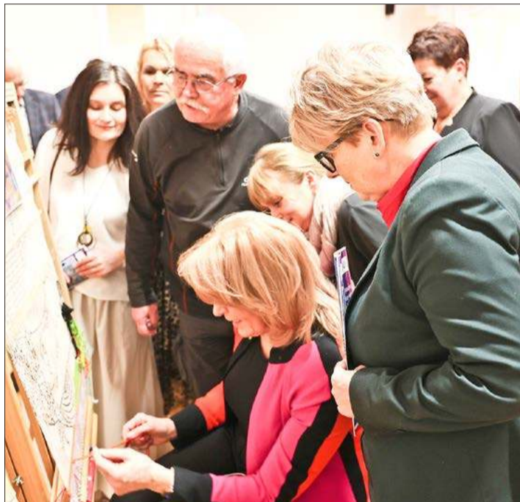
Pokaz tkactwa podczas wernisazu.

Prace, które powstają podczas spotkań grupy, od czterech lat oglądać można podczas corocznych wystaw środowiskowych przy Akademickiej 8. Tym razem panie postanowiły jednak wyjść dalej ze swoją twórczością, stąd pomysł na wystawę pt. Utkane z pasji, którą do 30 kwietnia oglądać można w Powiatowym Centrum Edukacji Kulturalnej w Ropczycach.