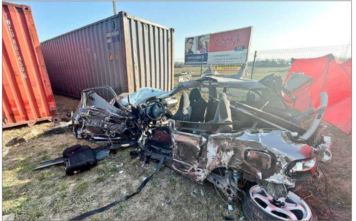
Samochód został poważnie uszkodzony. Kierowca nie przeżył zderzenia z kontenerami.

- Prawdopodobnie ten ostatni ruch kierownicą wykonał gwałtownie, przez co złapał pobocze. Odbił kierownicą w lewo, by wyprowadzić pojazd na prosty tor jazdy i wtedy stracił nad nim panowanie - mówi naczelnik dębickiej drogowki.