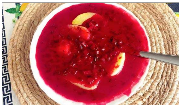
Taki barszczyk mi się marzy.