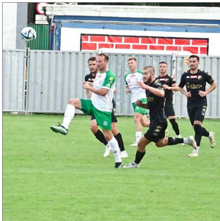
W sierpniu na swoim boisku Wisłoka przegrała 1:3, w Chełmie wygrała 2:1.

Jarosław Czernysz w pojedynkę rozmontował całą linię defen-