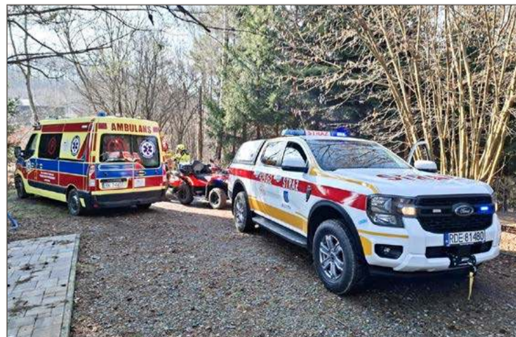
Strażacy przetransportowali chorego do karetki.