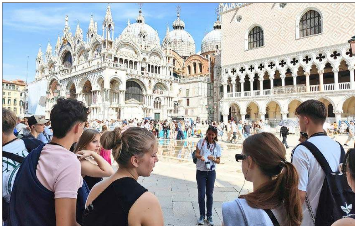
W zeszłym roku młodzież z Kwiatka zwiedzała m.in. Wenecję. W tym polecą jeszcze dalej.