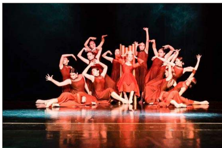
W sobotę na festiwalu wystąpią trzy grupy ze Szkoły Tańca Fame.

W weekend 15 i 16 marca w DK Mors odbywać się będzie XII Festiwal Tańca Złoty Gryf.