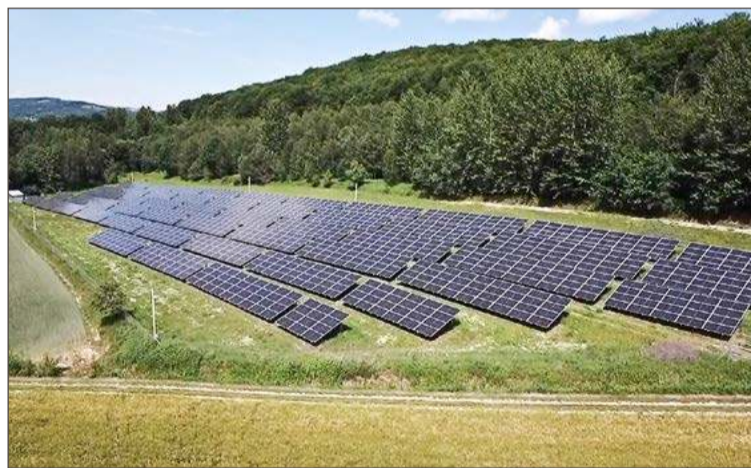
Prąd zasilający budynki użyteczności publicznej w gminie pochodził będzie m.in. z potężnej farmy fotowoltaicznej w Dęborzynie.

- Mniej będzie kosztowało nas utrzymanie np. szkół, a pieniądze te będzie można wydać na inwestycje, np. drogowe - podkreśla wójt.