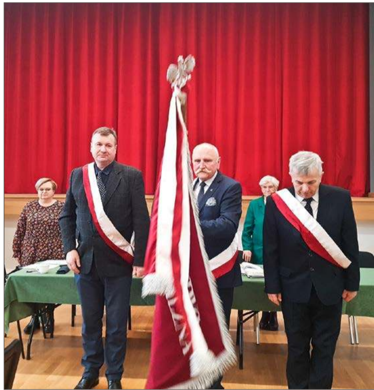
Walne Zebranie Członków TPPiZP odbyło się w Domu Kultury w Pilźnie.

W nowej siedzibie TPPiZP będzie miało okazję działać już w odświeżonym składzie. Z zarządu odeszła