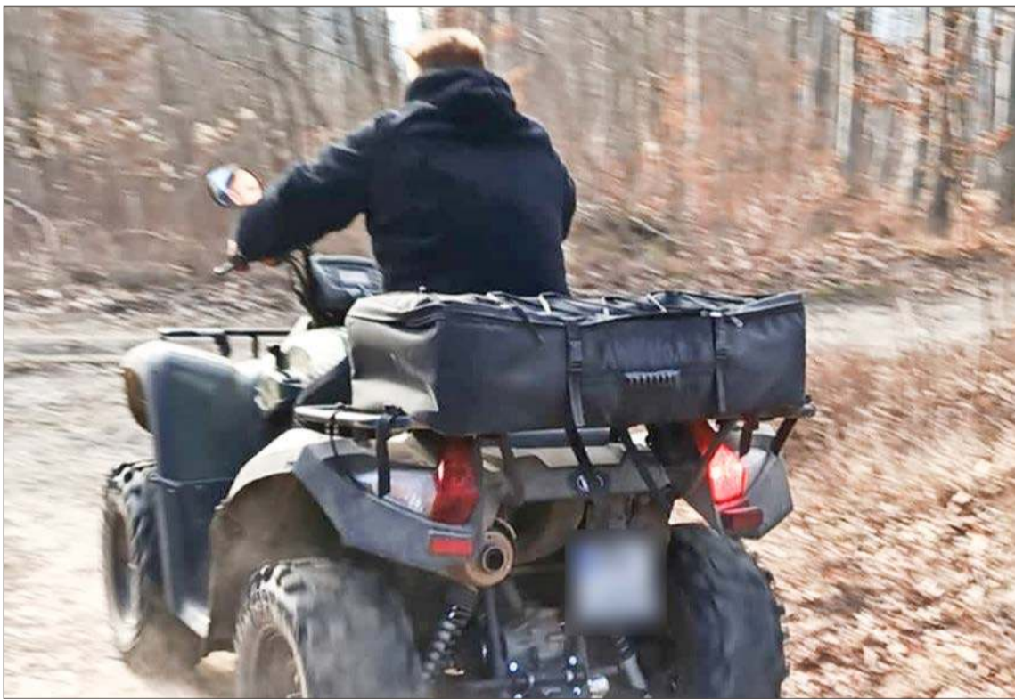
Ten kierowca quada został ukarany mandatem przez Straż Leśną.

Ale to nie oznacza, że w naszych lasach nie ma też innych zagrożeń. Rzecznik odradza uprawianie tam jakiegokolwiek aktywności kiedy mamy wietrzną pogodę. W każdej chwili na biegacza, spacerowicza czy rowerzystę może spaść odłamana gałąź, a w bardziej skrajnych przypadkach także drzewo.