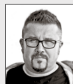
ratuszniak@ol.com.pl tel. 14 670 27 80