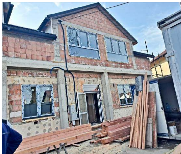
W tym budynku będzie się mieścić poczta w Żyrakowie.

Ale zaraz dodają, że w ostatnich tygodniach mogły wystąpić przejściowe trudności w doręczaniu