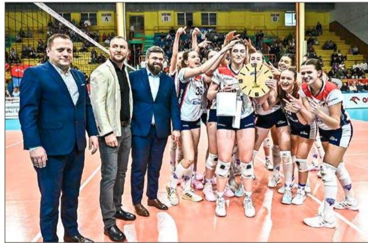
Drużyna z Poznania straciła w Dębicy tylko jednego seta.