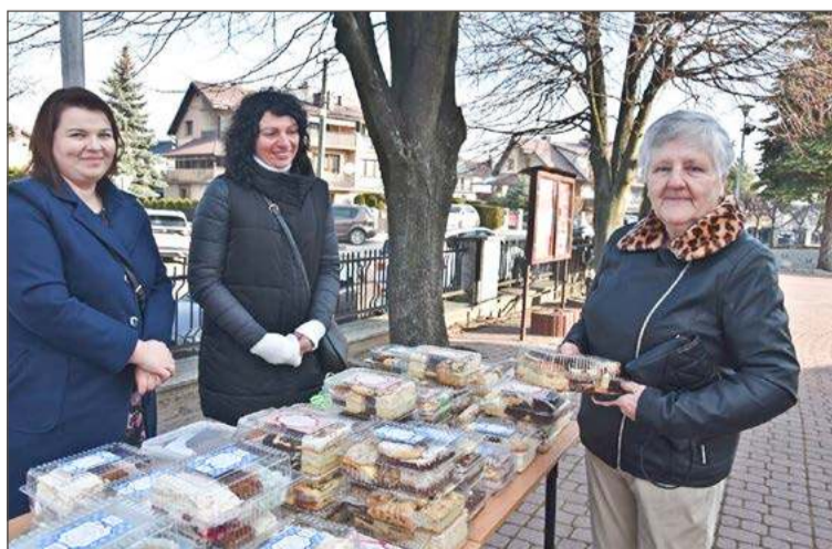
Przedstawicielki Rady Rodziców zachęcały do zakupu pysznych ciast.