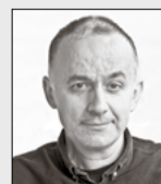
grajcar@ol.com.pl tel. 14 670 27 80