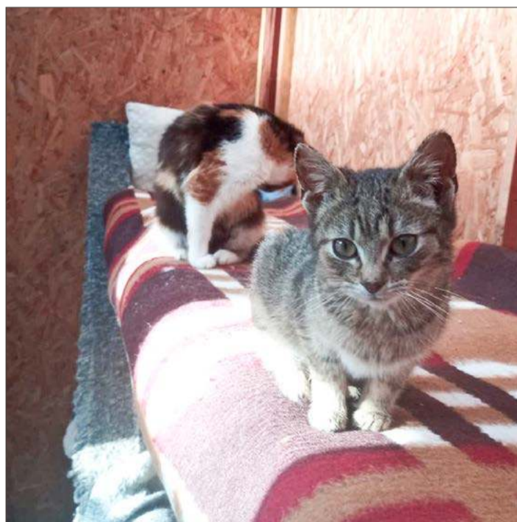
Tylko miasto Dębica ma własne schronisko zarówno dla psów, jak i kotów.

Ale nie ukrywa, że jednym z powodów zakwestionowania pro-