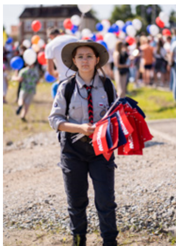
Fot. Dagmara Ziełńska