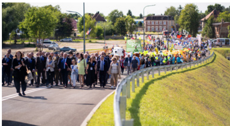
Korowód przeszedł ulicami miasta.