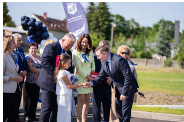
Fot. Dagmara Ziełńska