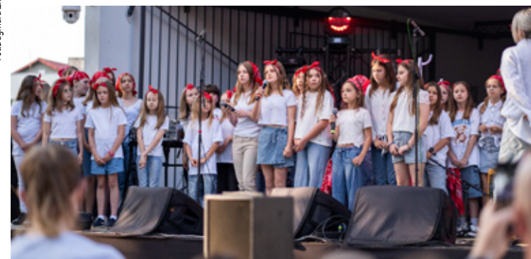
Fot. Dagmara Ziełńska