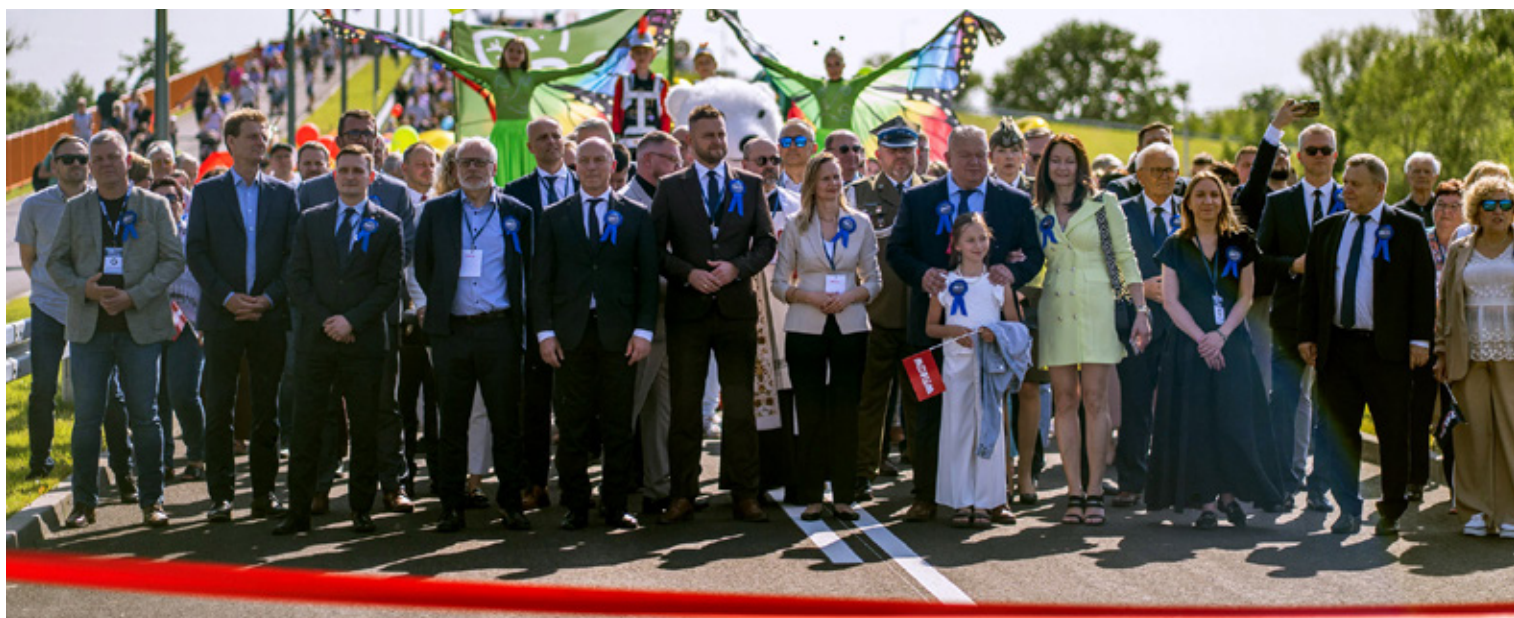
Na otwarcie przybyli goście: posłowie, radni wojewódzcy, inwestorzy i wszyscy, którzy przyczynili się do tego sukcesu.

Po oficjalnym przemówieniu burmistrza i przecięciu wstęgi, uczestnicy wydarzenia mogli przejść lub przejechać się