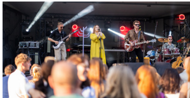
Lokalna duma na scenie - Lovers` Rehab.