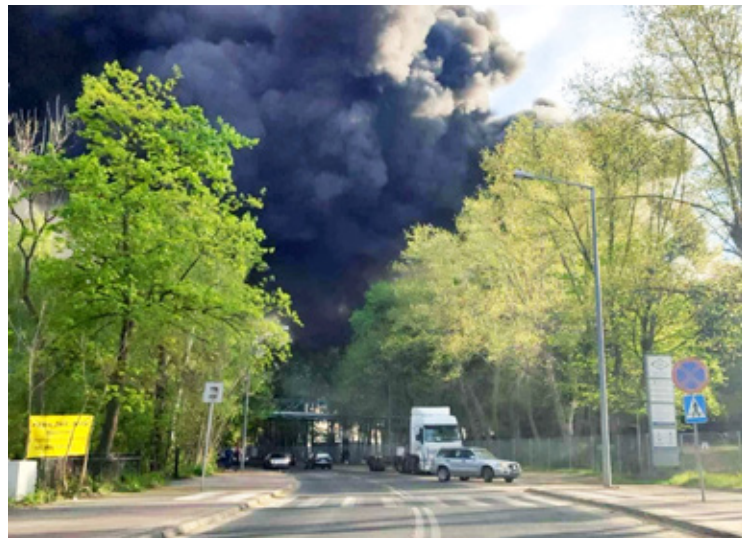
Pożar w PCC Rokita S.A.

Najwięcej emocji wśród mieszkańców wywołał jednak całkowity brak jakiegokolwiek informacji ze strony gminy i służb. W momencie, gdy płomienie trawiły obiekty zakładów chemicznych, a czarny dym był widoczny z wielu kilometrów, nie uruchomiono żadnego systemu ostrzegania: nie wysłano SMS-ów, nie użyto syren, mega-