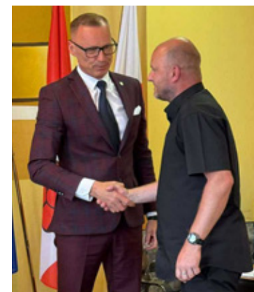
Fot. Brzeg Dolny

Strzałkowski to radny wybrany z komitetu Kamila Jeżyny, byłe-