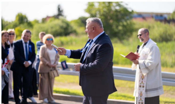
Burmistrz pokropił wodą święconą nową drogę i gości.