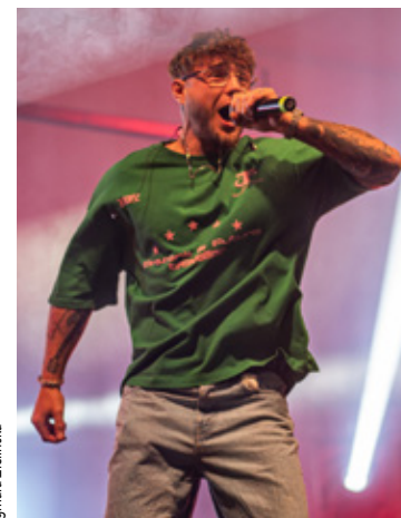
Fot. Dagmara Ziełńska