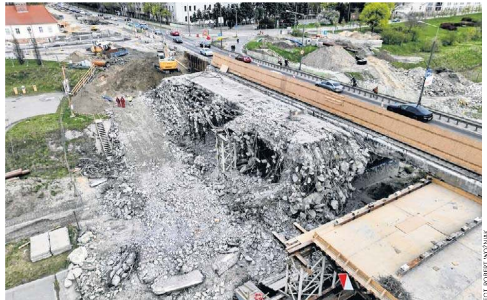
W rejonie Wieżowej powstało wąskie gardło - ulica jest zamknięta, kierowcy z rejonu Zagórze i Ostrowa Tumskiego muszą mocno nadrabiać drogi, do tego w korkach

Poznańskie Inwestycje Miejskie zamknęły w poniedziałek 13 kwietnia część ulicy Wieżowej, zaraz przy rozbiieranym moście - jak informują: z powodu prac w zakresie infrastruktury podziemnej - sieci wodociągowej, które wiążą się z wykopem w jezdni. Tym samym nie ma możliwości wjazdu ani wyjazdu z ul. Wieżowej na ul. Wyszyńskiego.