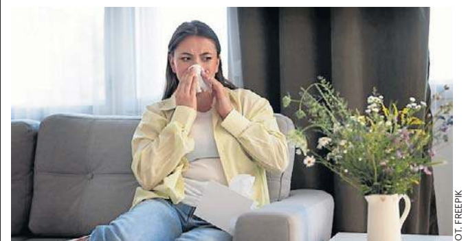
Wyniki badań są istotne dla codziennego życia alergików, szczególnie w zanieczyszczonych miastach

Konieczne jest zatem korzystanie zarówno z aplikacji monitorujących pyłki, jak i zanieczyszczenia powietrza.