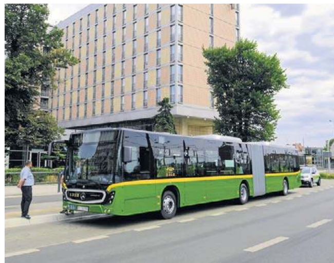
Dojazd komunikacją miejską na lotnisko Ławica będzie wygodniejszy. Linie 148 i 159 pojadą częściej.

Ze zmian cieszą się z pewnością pasażerowie dojeżdżający komunikacją publiczną na lotnisko. W godzinach szczytu (rano i po południu) linie 148 i 159 pojadą co 15 minut, a poza nimi i w weekendy - co 20 minut. Oznacza to, że czas oczekiwania na autobus na lotnisko np. na przystanku Bałtyk nie będzie dłuższy niż 7-8 minut w godzinach szczytu i 10 minut poza nimi i w weekendy. Dodatkowo linia 148 dojeżdżać będzie na dworzec Poznań Główny. ZTM tłumaczy te zmiany poprawą obsługi komunikacyjnej lotniska Ławica oraz osiedli Grunwaldu. Gorzej będą mieli pasażerowie linii 177 - ta jeździć będzie rzadziej. Co 30 minut w godzinach szczytu i co 40 minut poza nimi i w weekendy.