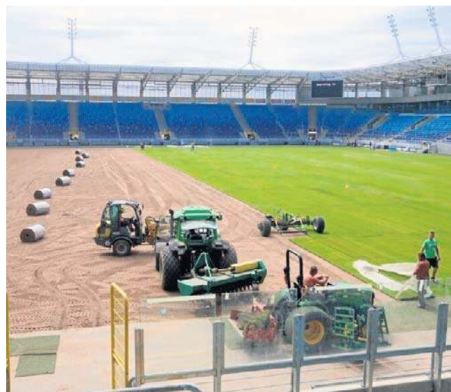
Ostatni raz murawa na Arenie Lublin była wymieniana w sierpniu 2019 roku