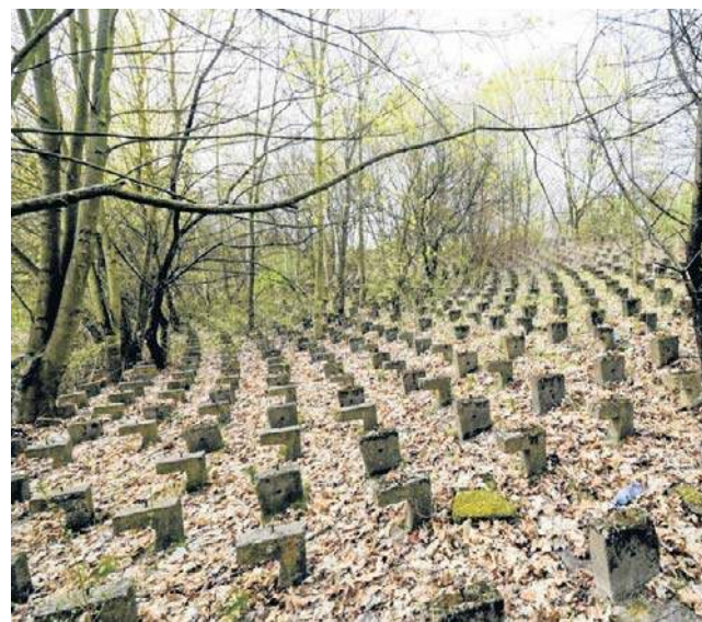
Stadion Szycy na poznańskiej Wildzie dziś jest porośnięty dziką roślinnością

Zwraca uwagę, że miasto nie jest przygotowane, aby do ści-