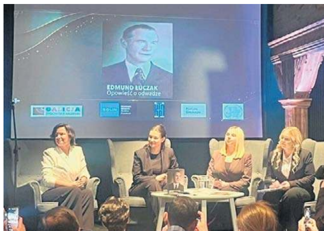
Uczennice Ekonomika na premierze książki „Opowieść o odwadze” w kaliskim Akceleratorze Kultury

Prace nad książką trwały kilkanaście miesięcy. Autorki prowadziły kwerendy w archiwach i muzeach, a także przeprowadzały rozmowy ze świadkami historii. Projekt miał nie tylko wymiar edukacyjny, ale również osobisty - jak podkreślają, był to czas budowania relacji i przyjaźni.