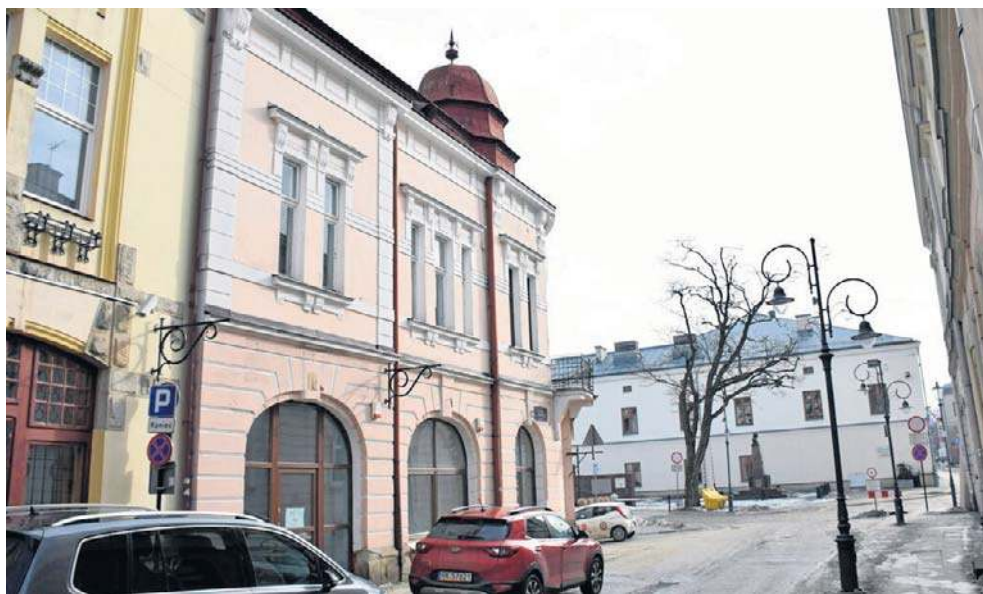
W zabytkowej kamienicy przy ul. Blich 1 zostanie urządzona nowa przestrzeń wystawiennicza Muzeum Rzemiosła

Przetarg wygrała firma Texom, która ma już doświad-