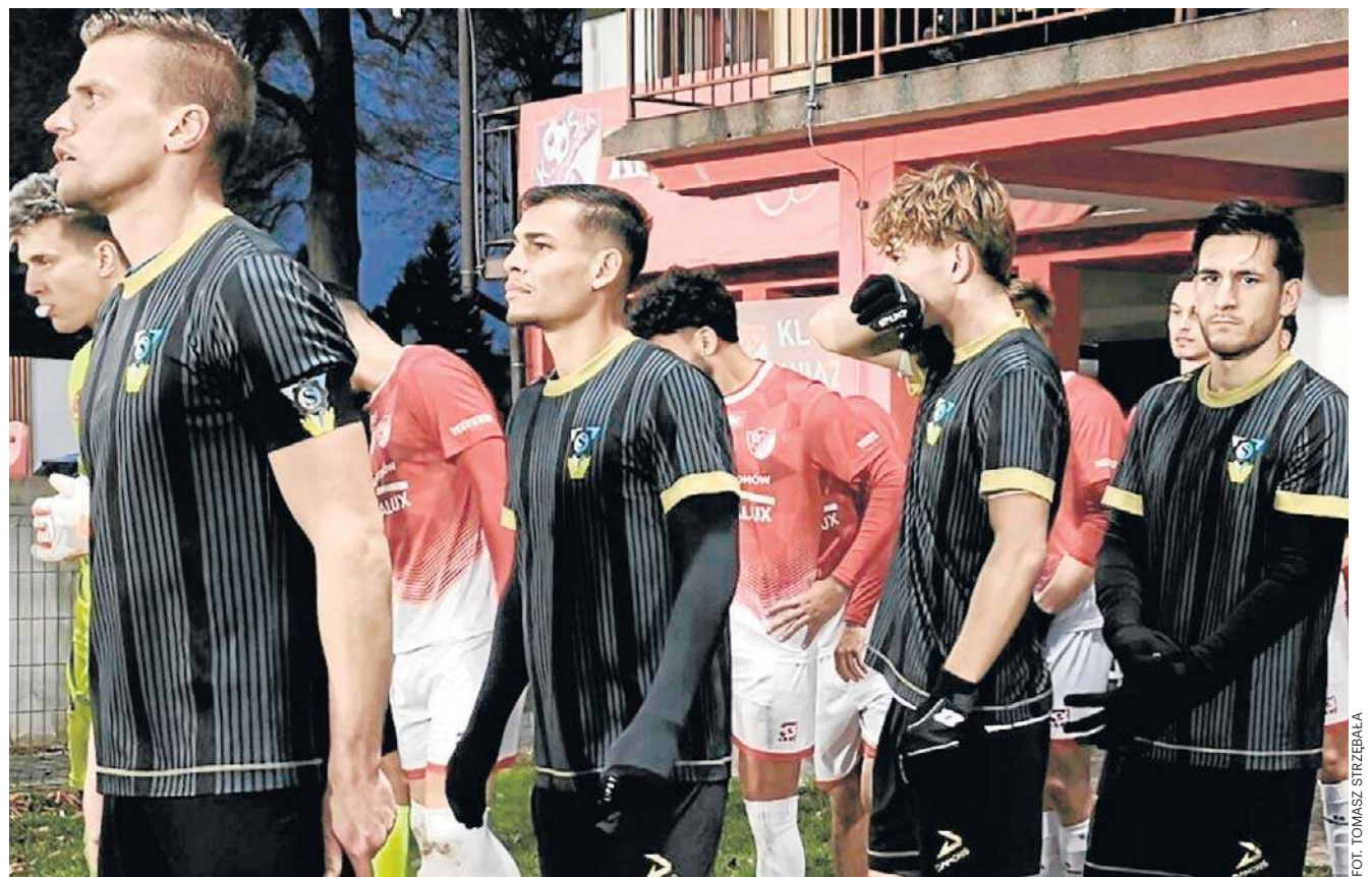
Gracze Stali Gorzycy (na czarno) mieli niezły 2025 rok. Ciężko uwierzyć, że w tym roku nie spadną z czwartej ligi...