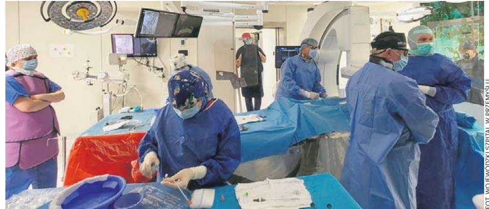
Chirurdzy naczyniowi i kardiologowie operują 86-letnią

W ubiegłym tygodniu chirurdzy naczyniowi i kardiologowie przeprowadzili u 86-letniego mężczyzny zabieg zaopatrzenia tętniaka okolic łuku aorty i aorty zstępującej z zastosowaniem protezy piersiowej z odnogami.