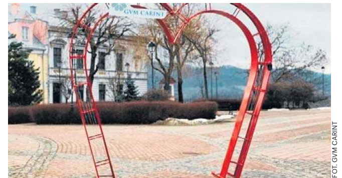
Na Rynku powstała instalacja promująca aktywność edukacyjno-informacyjną związaną ze zdrowiem serca

- Przez lata, współpracując ze szpitalem powiatowym, placówka zapewniała pomoc pa-