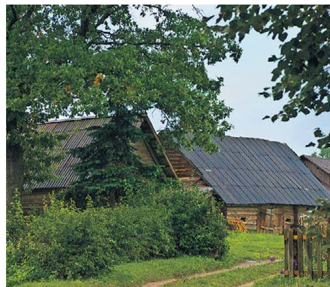
W dzisiejszych Zerwinach (Zervynas) w Dzukijskim Parku Narodowym nad Ułą znajduje się skansen etnograficzny