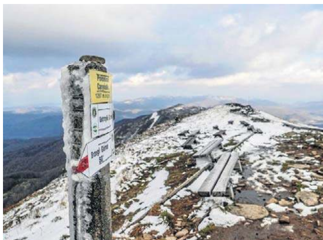
Główny Szlak Beskidzki to najdłuższy polski szlak górski, liczący niemal 500 km

Podczas posiedzenia zatwierdzono także listę stypendystów sportowych na 2026 rok. Na ten cel zarząd regionu przeznaczył ponad 2 mln zł. Wsparcie otrzyma 197 zawodników i zawodniczek, z czego większość to medaliści mistrzostw Polski lub członkowie kadry narodowej. Najliczniej reprezentowanymi dyscyplinami wśród stypendystów są: akrobatyka sportowa (37 osób), lekkoatletyka (32 osoby) oraz sumo (14 osób). (HUK/PAP)