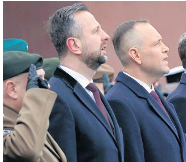
Prezydent i wicepremier wzięli udział w odprawie rozliczeniowo-zadaniowej dowódców Wojska Polskiego

Prezydent ocenił, że w związku z pytaniami o kontrole i przejrzystość wydatków w ramach programu SAFE zasadne jest ujawnienie listy